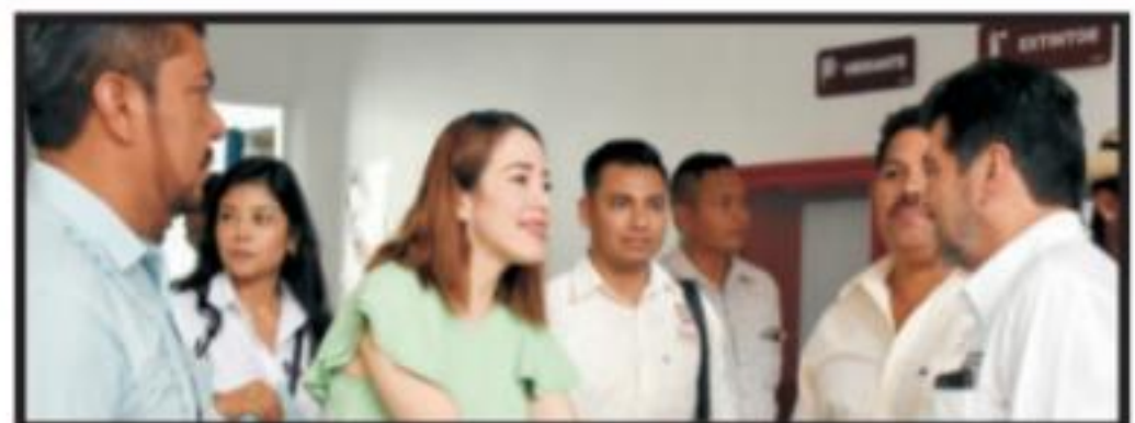
Página 5 Sección A

EL CLARIN Diario de la Región Oriente de Michoacán