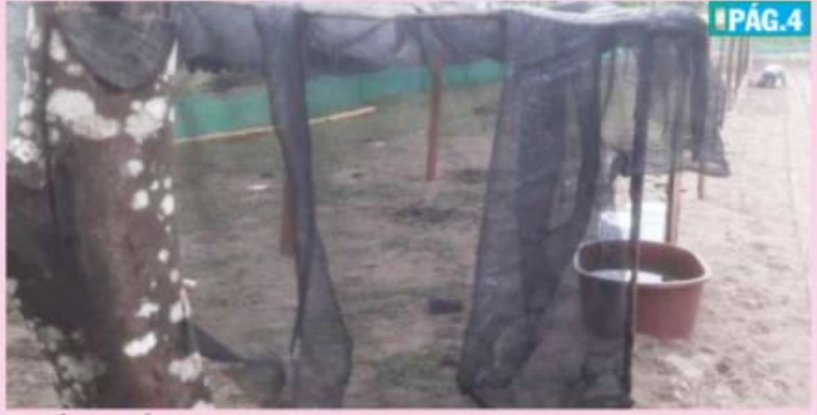
CD. LÁZARO CÁRDENAS, MICH.- Las inclemencias del tiempo desde inicios de octubre han provocado una serie de afectaciones al campamento tortuguero de Solera de Agua.

Mal tiempo afecta instalaciones del campamento tortuguero de Solera de Agua PÁG. 4