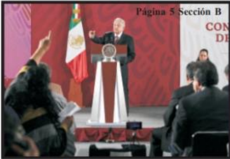
Página 5 Sección B