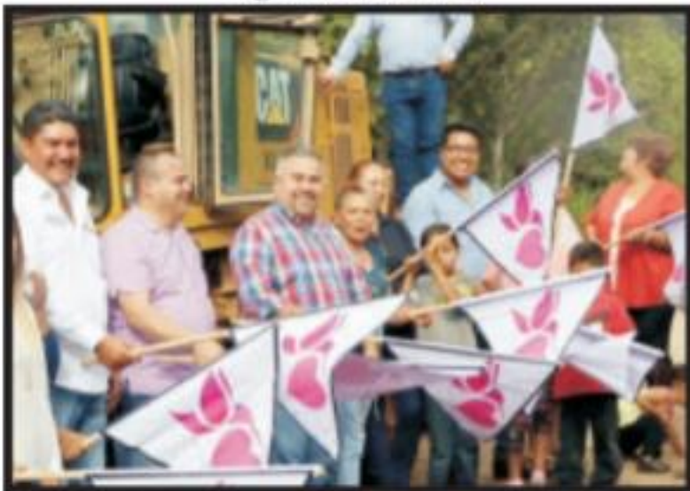
Página 7 Sección B