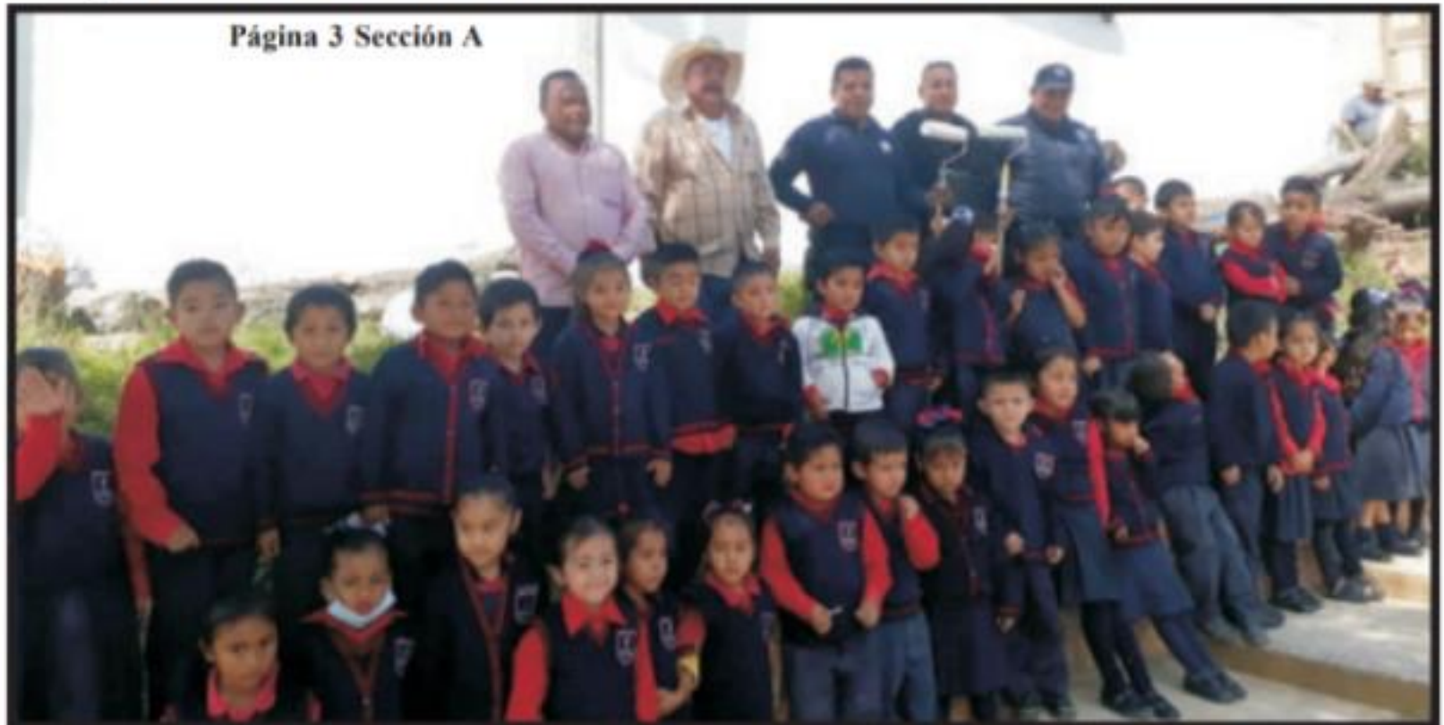
Página 3 Sección A