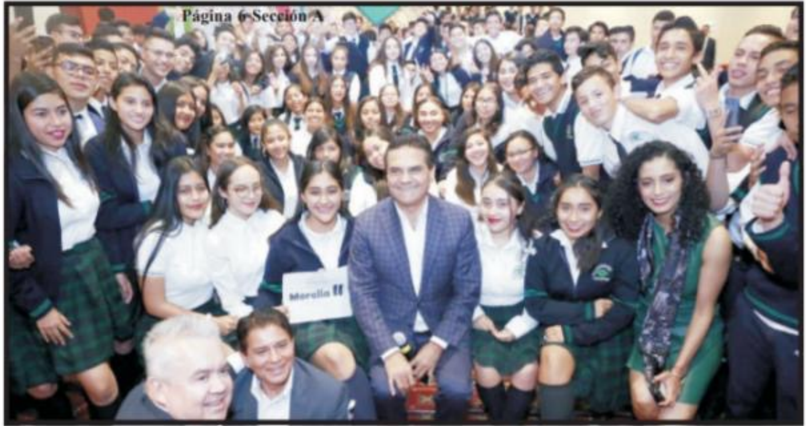
Página 6 Sección A