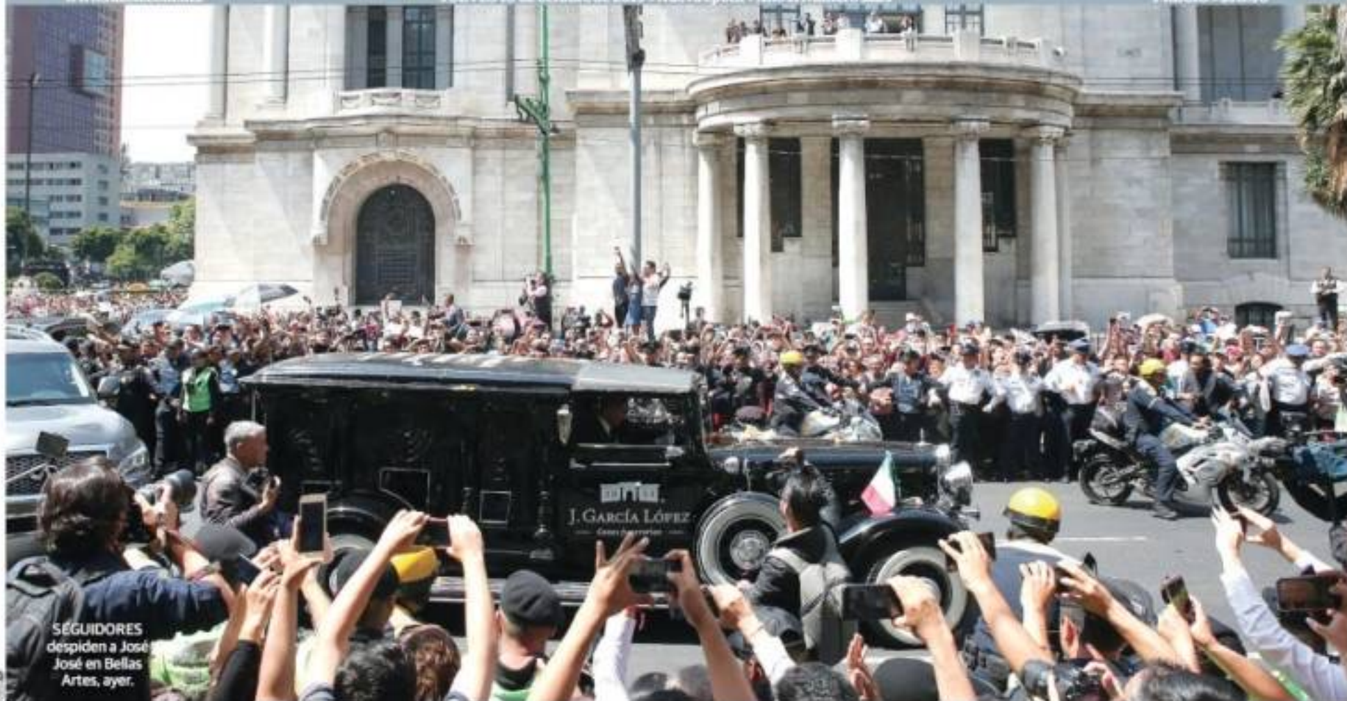
SÉGUIDORES despiden a José José en Bellas Artes, ayer.

ONG LE RECLAMAN POR REPORTAR CERO CASOS EN EL SESNSP