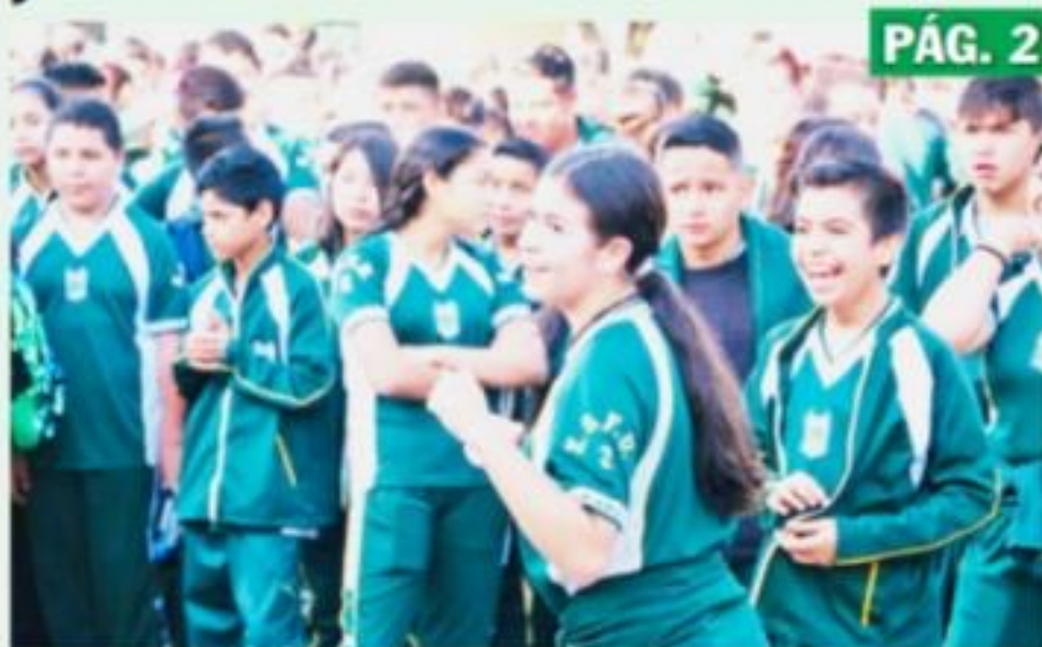
URUAPAN, MICH.- En una nueva jornada de activación física, realizada en el auditorio de la unidad deportiva, participaron más de 2 mil personas, en su mayoría jóvenes estudiantes de secundaria.

Mano dura contra el comercio ambulante en el primer cuadro de esta ciudad