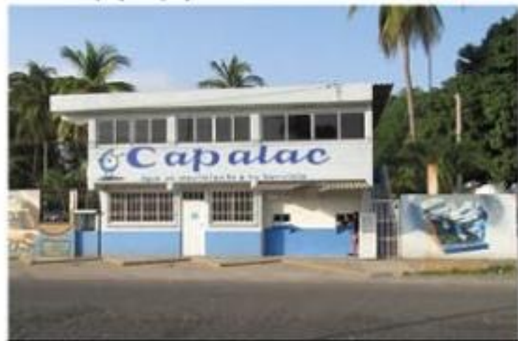
Usuarios del servicio de agua potable se quejan de arbitrariedades del CAPALAC.