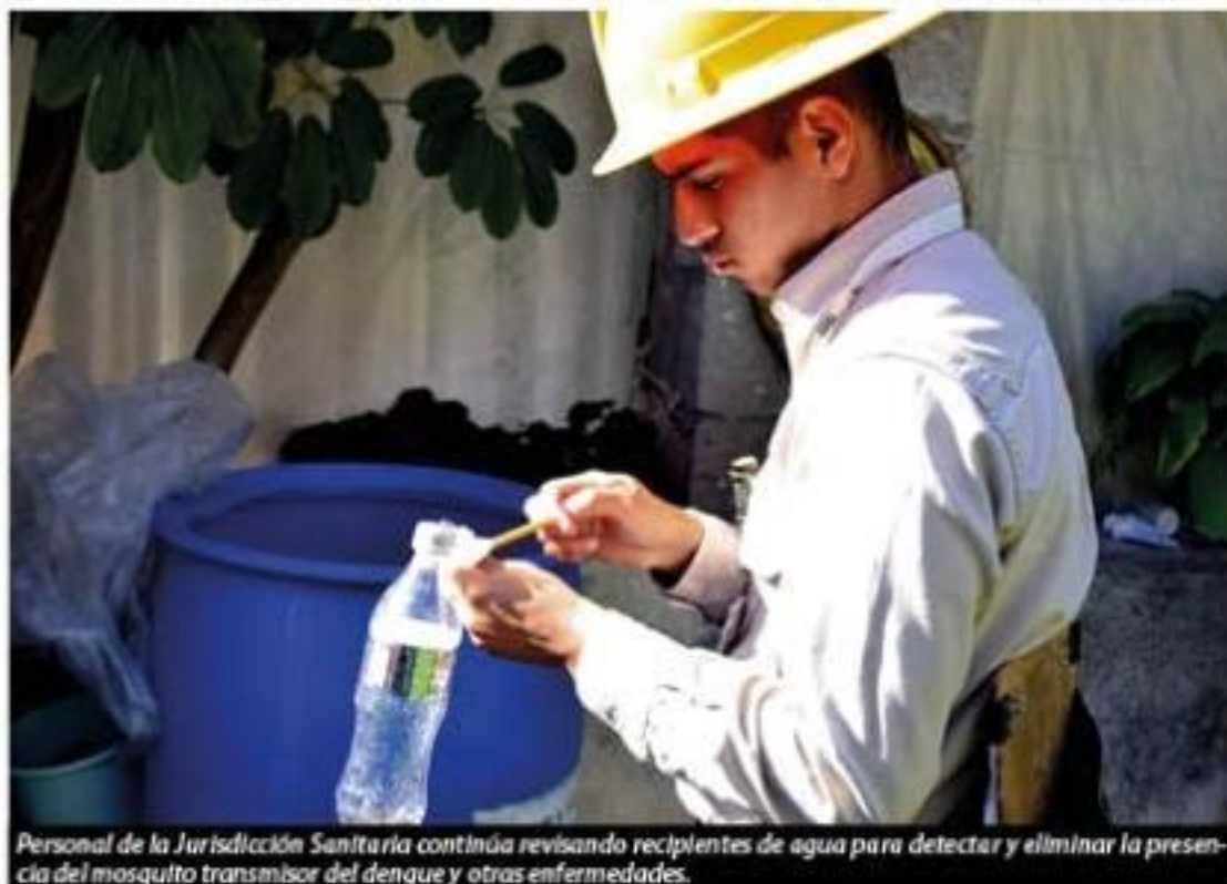
Personal de la Jurisdicción Sanitaria continúa revisando recipientes de agua para detectar y eliminar la presencia del mosquito transmisor del dengue y otras enfermedades.

El Comité de Agua Potable y Alcantarillado de Lázaro Cárdenas (Capalac) que ven- de agua potable y sospechamente no lo es, además violenta