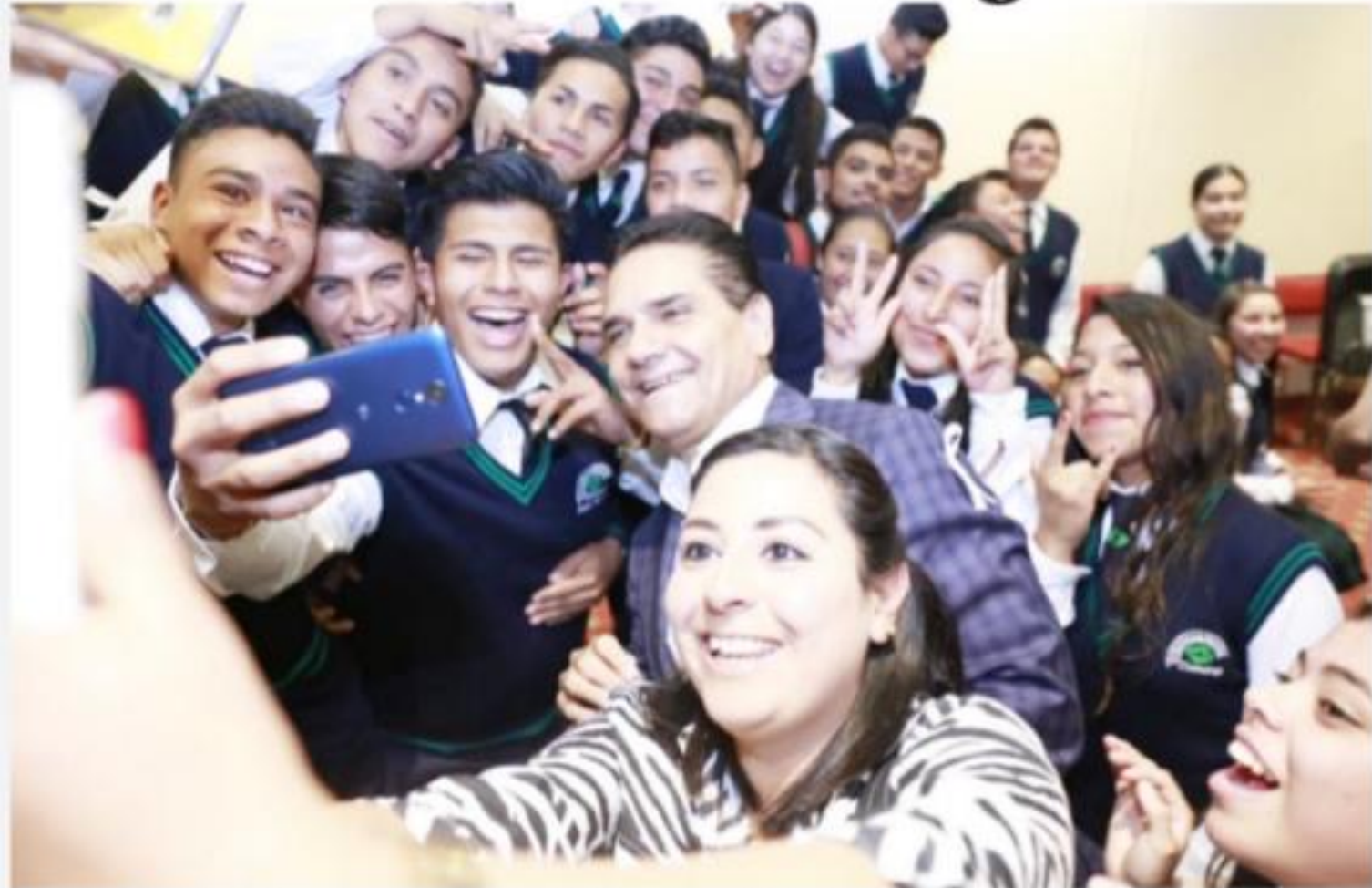
MORELIA, MICH.- "Están en una etapa muy bonita, pero también de alto riesgo, deben visualizar mejores escenarios", pide Silvano Aureoles a jóvenes.

Tener líderes que inspiren, una mentalidad positiva y un objetivo identificado, clave para transformar a Michoacán: Gobernador