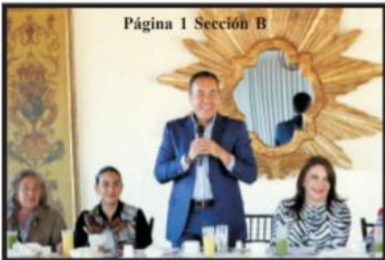
Página 1 Sección B