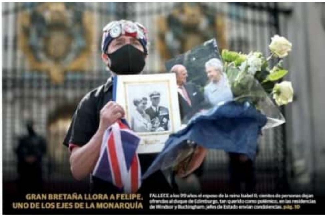
GRAN BRETAÑA LLORA A FELIPE, UNO DE LOS EJES DE LA MONARQUÍA