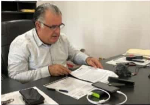
El síndico Miguel Ángel Peraldi Sotelo, informó ayer sobre el requerimiento de la ASM a la alcaldesa Itzé Camacho, por el presunto desvío de más de 21 millones de pesos, tan solo en los 4 primeros meses de la actual administración municipal. (Foto: Kike Rivera).

* Por desvío de 21 millones requiere ASM a la alcaldesa Itzé Camacho.