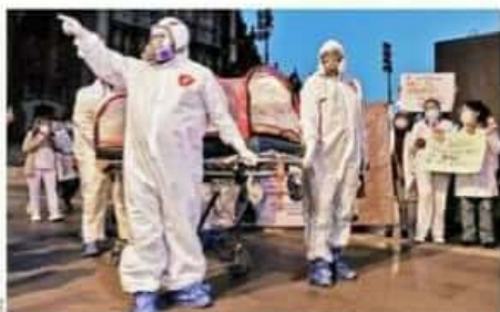
Un grupo de trabajadores de la salud se manifestó ayer frente a Palacio Nacional y después marchó a la Segob con el reclamo de ser vacunados.