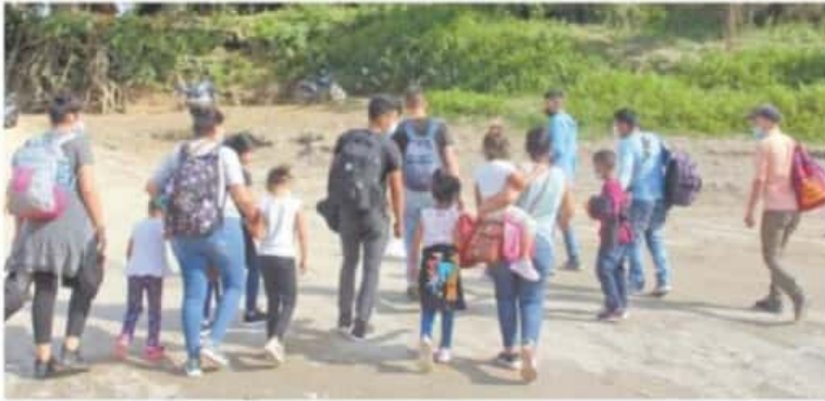
Chiapas.— Cientos de migrantes, entre ellos familias con niños, continúan cruzando de forma irregular a territorio mexicano por Frontera Corozal, en el municipio de Ocosingo, considerado territorio del EZLN, debido a que esta zona quedó exenta del operativo del Instituto Nacional de Migración y de fuerzas federales. | ESTADOS | A12