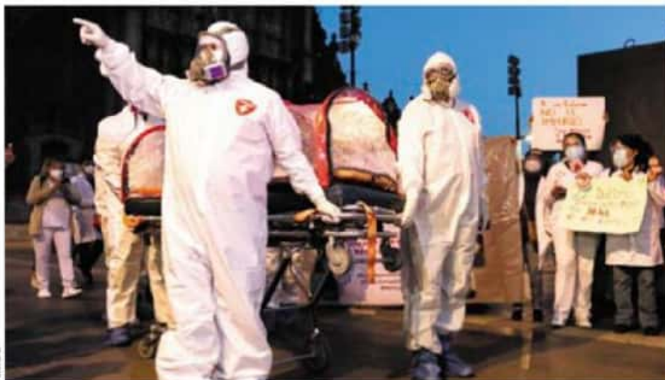
Los médicos privados querían entrar a Palacio. No habrá vacuna, por ahora, para ellos.