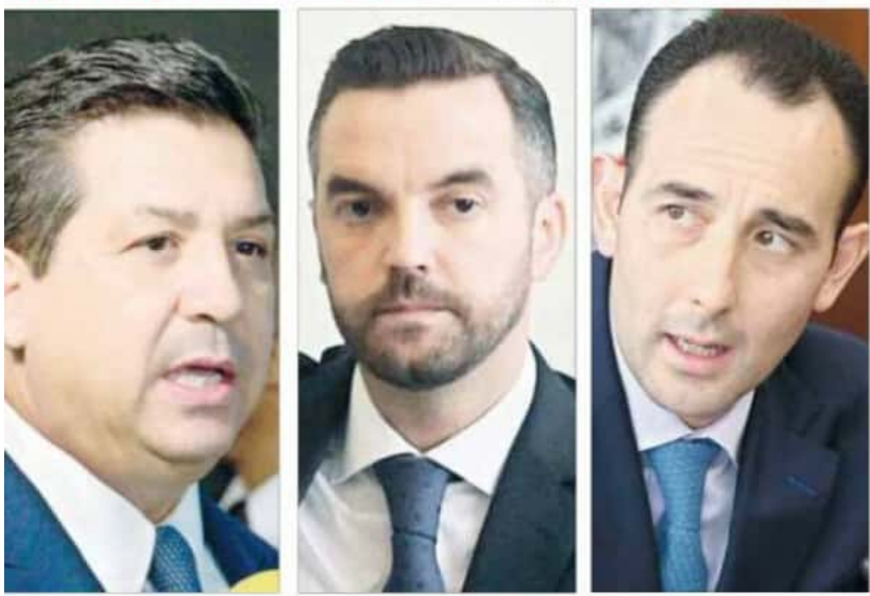
En la investigación que realizó el organismo de la Secretaría de Hacienda al ex legislador Jorge Luis Lavalle (centro) se vincula también al gobernador de Tamaulipas, Francisco Javier García Cabeza de Vaca (izquierda), y a Roberto Gil Zuarth (derecha) con el presunto

Bajo la lupa de la Unidad de Inteligencia Financiera