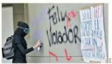
Feministas efectuaron ayer pintas en la sede del TEPJF, en demanda de que no se reituya la candidatura a Salgado.

FRANCISCO MORENO Han pasado más de cien días desde que fue aplicada la primera vacuna en México: 60 por ciento de los que trabajamos en medicina privada y al menos 15 por ciento de los que lo hacen en una institución pública, no hemos tenido ese privilegio. El no vacunar a los trabajadores de la salud pone en riesgo a pacientes que son atendidos en las clínicas y hospitales, ya que pueden resultar contagiados por el personal que labora en esos sitios, personas vulnerables por otras enfermedades y cuyo pronóstico, en caso de resultar infectados, es muy malo. No queremos medallas, aplausos o que nos llamen héroes, tan solo pedimos que se nos vacine. Escribe del tema • Pág. 9