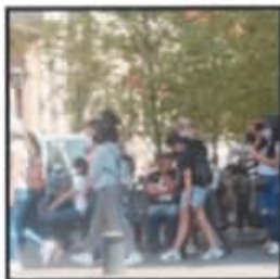
LA AFLUENCIA DE TURISTAS MARCÓ UN RESPIRO AL SECTOR TURÍSTICO DE NUESTRO ESTADO.