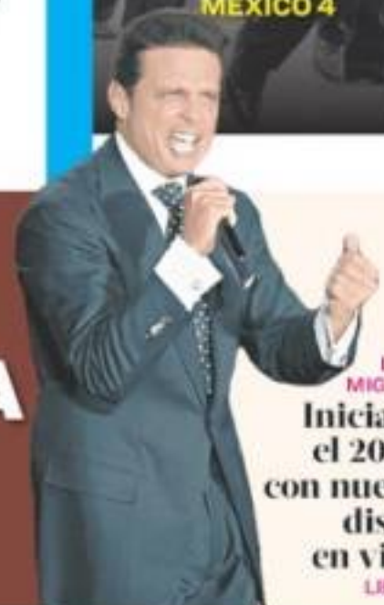
LUIS MIGUEL Iniciará el 2020 con nuevo disco en vivo LIKE 2

CELEBRA QUE SENADO RATIFICARA MODIFICACIONES; ES UN TRIUNFO AL ACUERDO COMERCIAL, DIJO MÉXICO 2