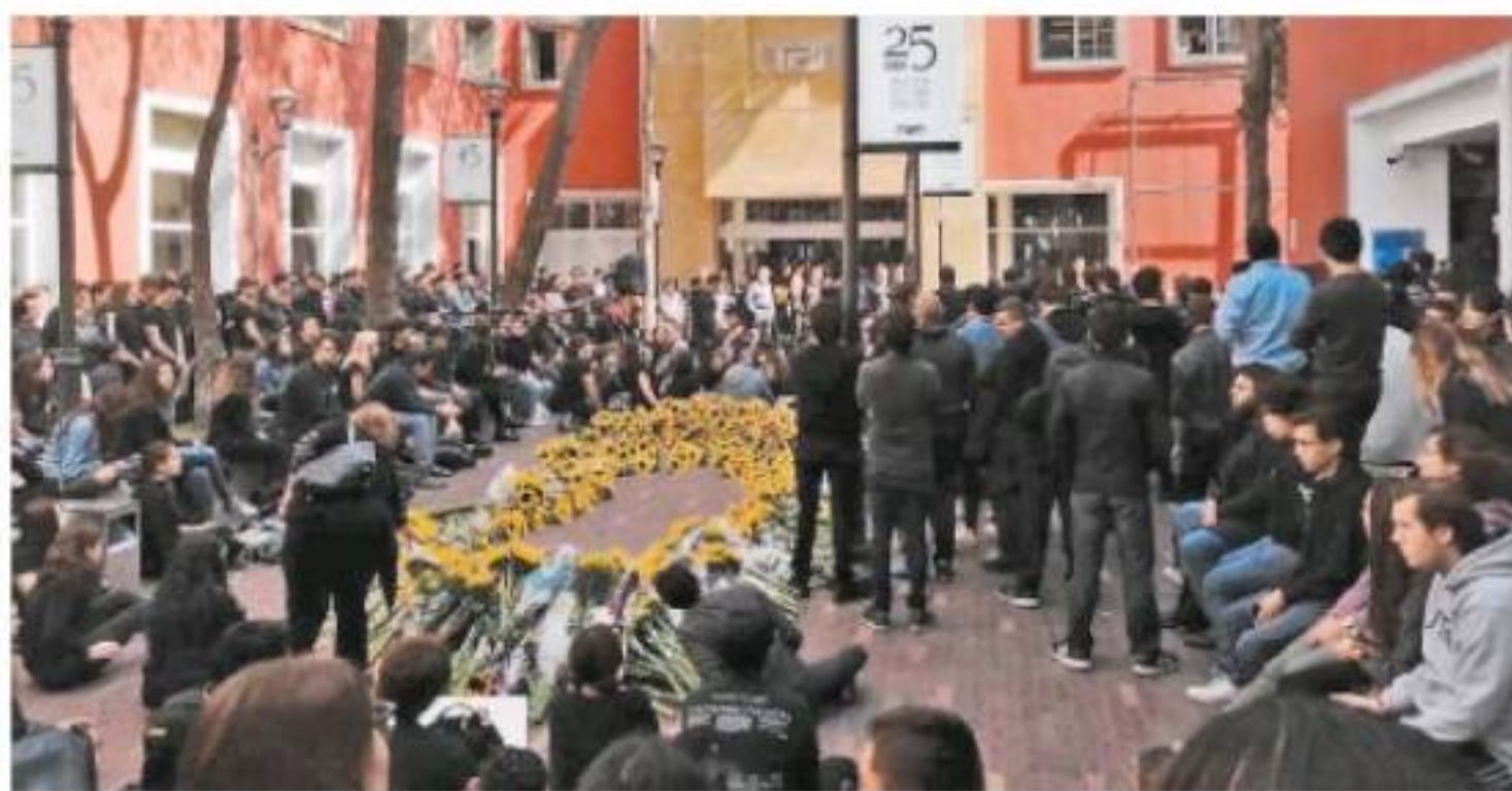
La comunidad estudiantil organizó suspensión de clases de 24 horas y homenajeó a su compañera muerta. LEONARDO LUGO