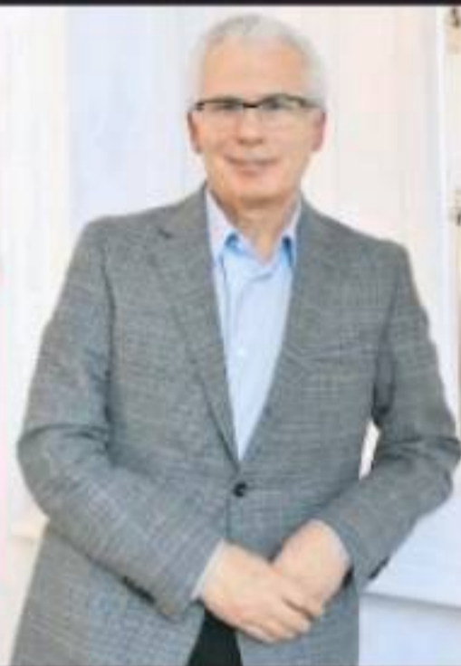
BALTAZAR GARZÓN, JUEZ ESPAÑOL

“Llevamos cien años de lucha frontal contra el tráfico de drogas, y no hemos ganado”