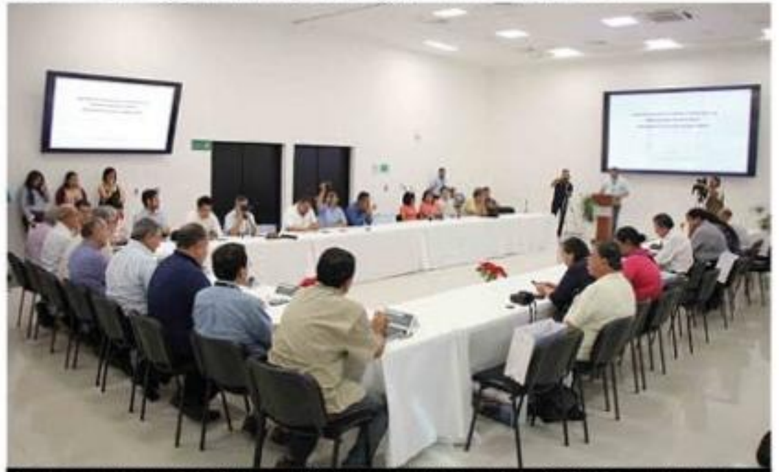
Ante los representantes de los distintos medios de comunicación de este lugar, la APILAC presentó ayer sus perspectivas de cierre de operaciones 2019.

Mientras el gobierno federal o la concesionaria de la autopista Siglo XXI, acuerdan ampliar a 4 carriles el tramo Uruapan-Lázaro Cárdenas de la au- >>> 4