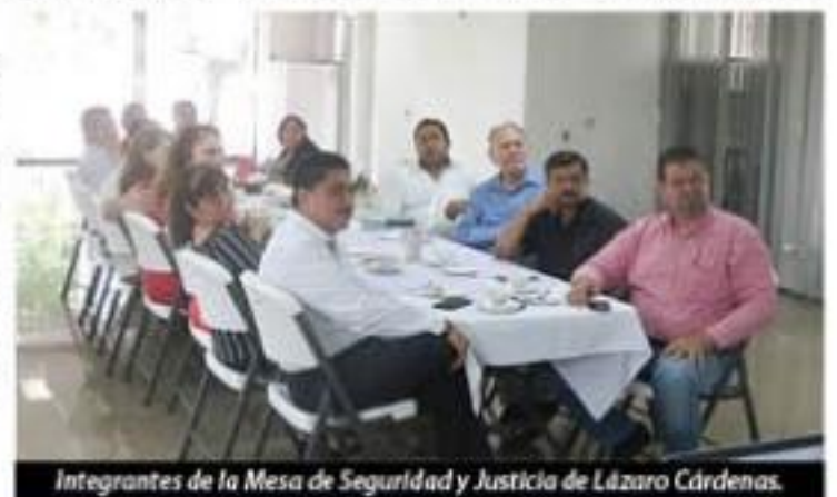
Integrantes de la Mesa de Seguridad y Justicia de Lázaro Cárdenas.

La Comisión Ejecutiva Estatal de Atención a Víctimas (CEEAV), la Mesa de Seguridad y Justicia de Lázaro Cárdenas y Muje- >>> 3