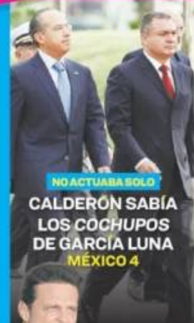
NO ACTUABA SOLO CALDERÓN SABÍA LOS COCHUPOS DE GARCÍA LUNA MÉXICO 4

● Gobierno mexiquense enfrenta diversas acusaciones por abuso de policías, como torturas y desapariciones 5