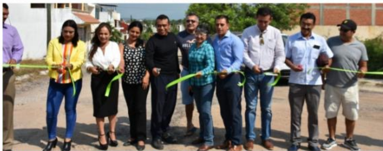
CD. LÁZARO CÁRDENAS, MICH.- Fue rehabilitado el drenaje sanitario de la colonia Irekani, la cual tuvo un financiamiento de dos millones 352 mil 23 pesos.

Rehabilitan el drenaje sanitario en colonia Irekani PÁG. 4