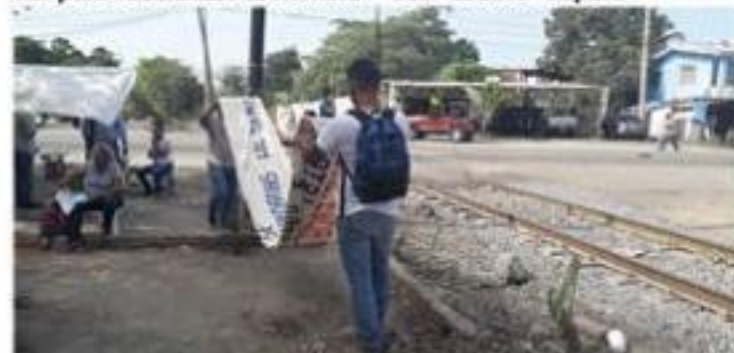
Con la federalización de la nómina educativa, la APILAC confía en que los bloqueos a las vías del tren por parte de los maestros, para el 2020 sea un asunto superado y olvidado.

El trabajo que hacen los gobiernos de Michoacán y nacional para federalizar la nómina dan optimismo de que cierren páginas y en 2020 sea asunto supera- >>> 5