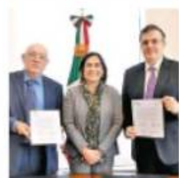
Firma de convenio. ESPECIAL

ASF vigilará los 100 mdd que la 4T enviará a Centroamérica