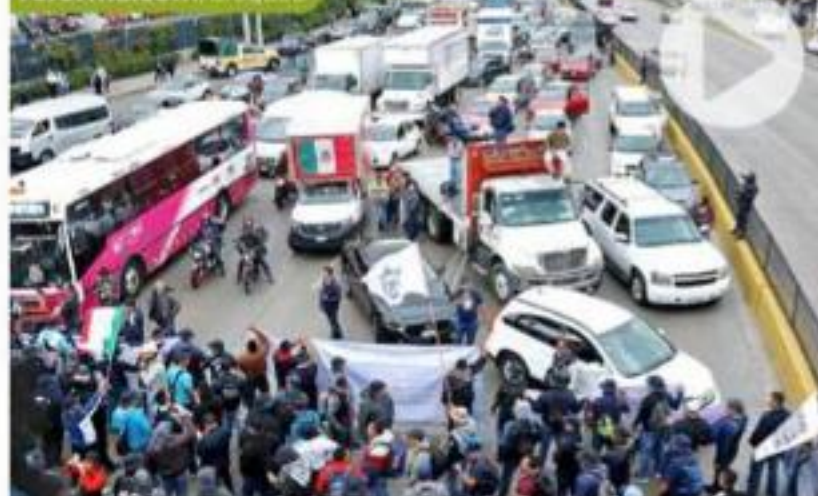
Los agentes bloquearon el Circuito Interior, justo en la entrada al AICM. La zona fue un caos.