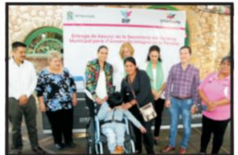
Página 2 Sección A

EL CLARIN Diario de la Región Oriente de Michoacán