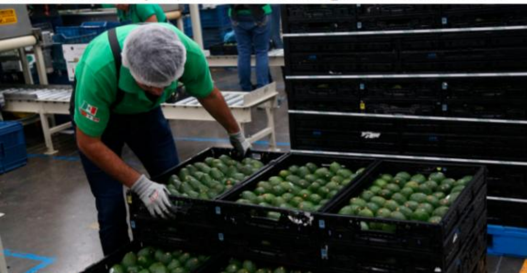
URUAPAN, MICH.- Nuevamente en riesgo el mercado del aguacate michoacano con Estados Unidos, al darse la alerta de inseguridad que priva en Michoacán.

► Alerta del vecino país, ante la ola de inseguridad de Michoacán