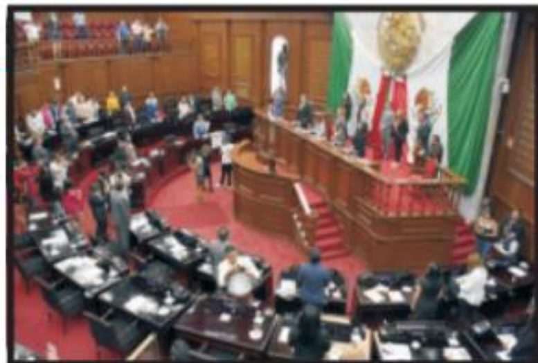
Página 7 Sección B