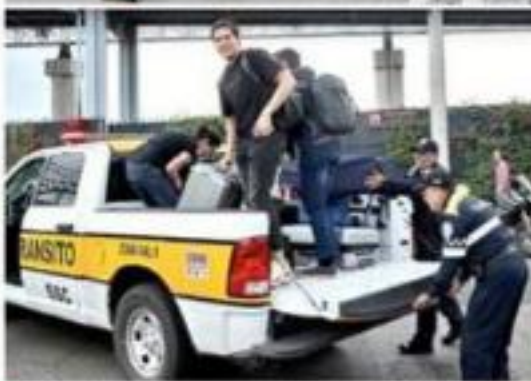
Cientos de pasajeros que tenían boletos de salida llegaron a pie al aeropuerto o en transporte que habilitó el Gobierno.

El amago, explicó, se dio luego de que denunció desde la tribuna del Congreso que Ulises controla la adjudicación de contratos, convenios y negocios en Morelos.