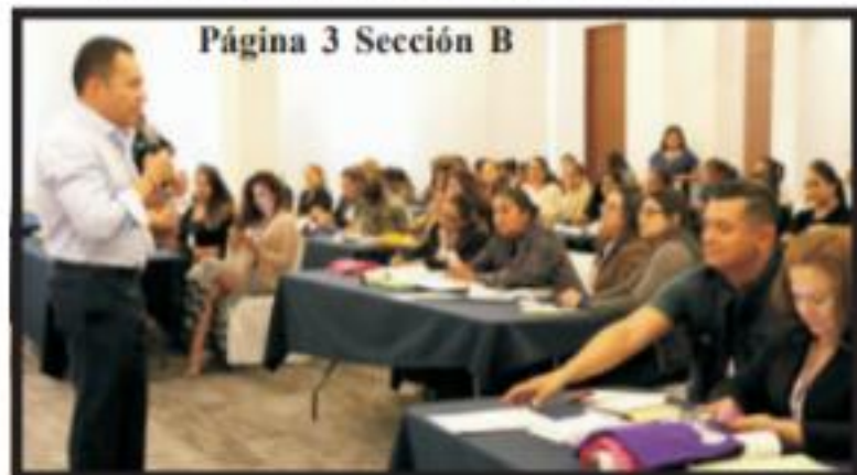
Página 3 Sección B