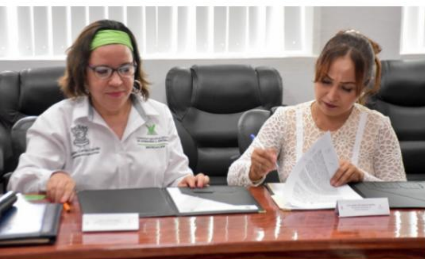
D. LÁZARO CÁRDENAS, MICH.- Con el objeto de coordinar esfuerzos para brindar una atención más cercana, inmediata y profesional para las víctimas de delito y violaciones a los derechos humanos, este viernes, el gobierno municipal suscribió un convenio de colaboración con la Comisión Ejecutiva Estatal de Atención a Víctimas (Ceeav).