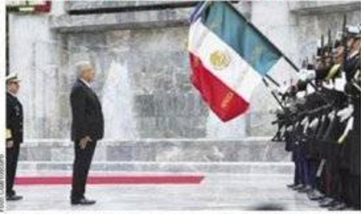
Andrés Manuel López Obrador. Gesta heroica. Viernes y sábado, en su rancho de Chiapas, y Grito, mañana en el Zócalo. Ver página 3