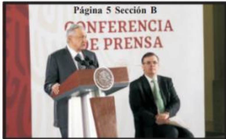
Página 5 Sección B

Mal manejo de medicinas, al "basurero de la historia" AMLO