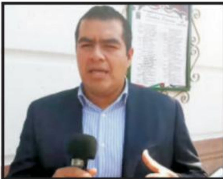
Página 3 Sección A