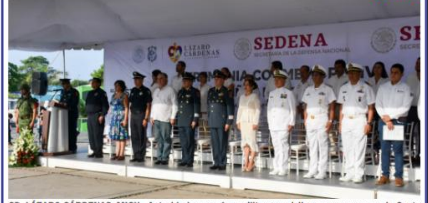
CD. LÁZARO CÁRDENAS, MICH.- Autoridades navales, militares y civiles, conmemoraron la Gesta Heroica del Castillo de Chapultepec

Conmemoraron el 172 aniversario de la Gesta Heroica del Castillo de Chapultepec PÁG. 4