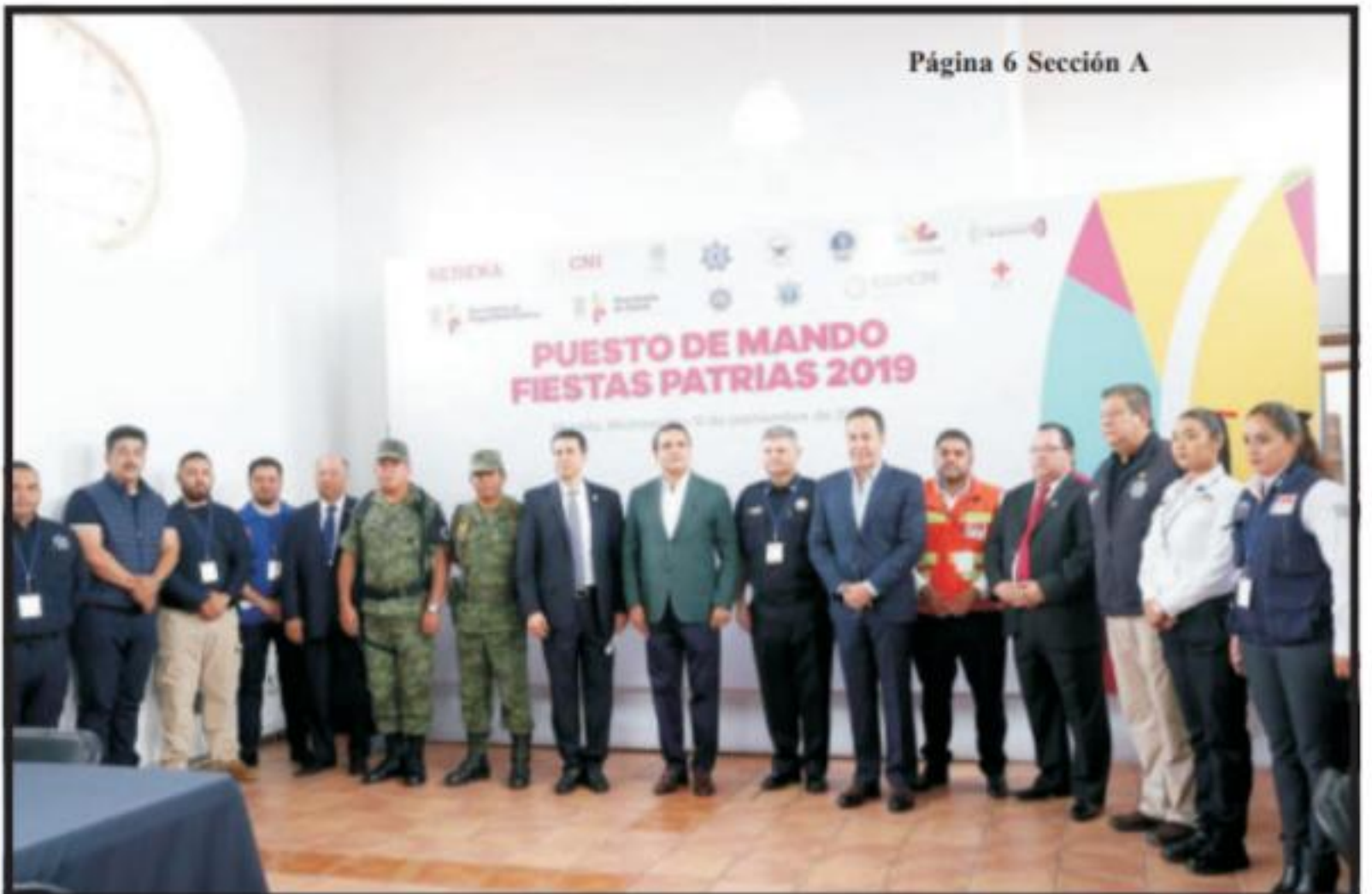
Página 6 Sección A