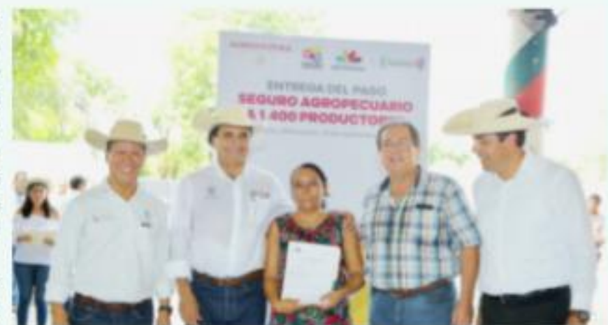
HUETAMO, MICH.- El gobierno de Michoacán mantiene su compromiso de atender a los productores afectados por los siniestros climatológicos de 2018 con la entrega de mil 400 pólizas de seguro en el municipio de Huetamo.

Por ello a través de los programas Seguro Agropecuario y Seguro Catastrófico, se erogarán cinco millones de pesos para 71 municipios de Michoacán, afectados por fenómenos climatológicos.