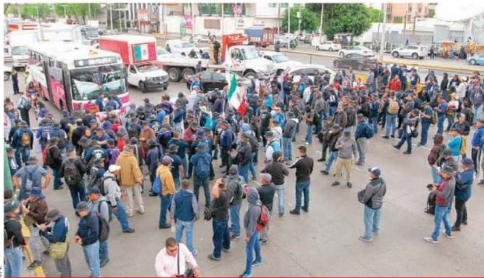
El bloqueo de un puñado de federales en protesta porque no quieren entrar a la Guardia Nacional y no han resuelto su liquidación, desquició el tránsito en la zona del aeropuerto capitalino y provocó el retraso de cientos de pasajeros para alcanzar sus vuelos. (Braulio Colín). 10