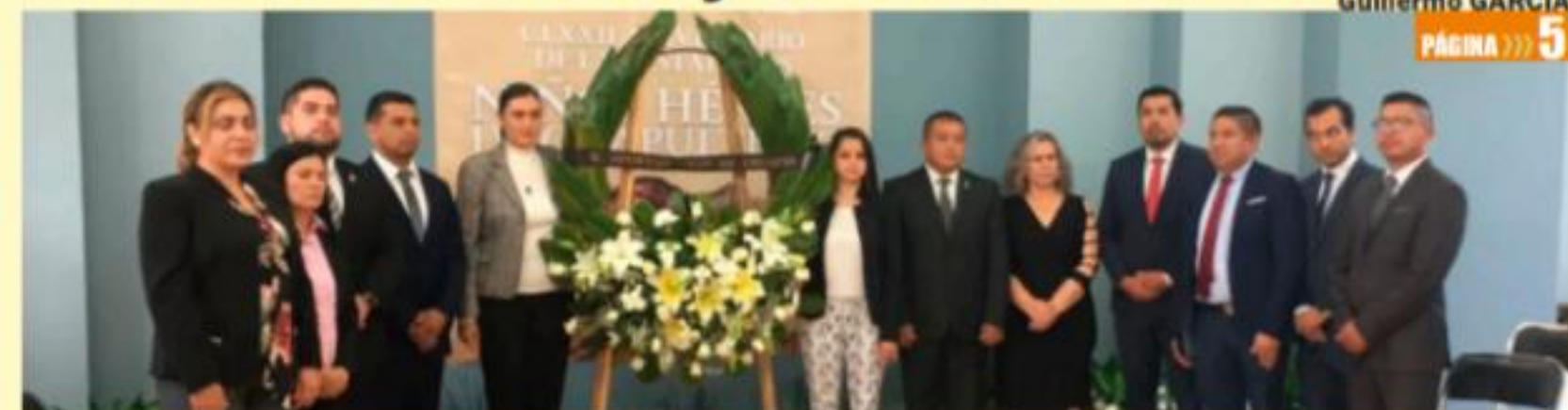
URUAPAN, MICH.- Autoridades municipales y educativas encabezaron el acto para conmemorar el 172 aniversario de la Gesta Heroica del Castillo de Chapultepec, el 13 de septiembre de 1847.