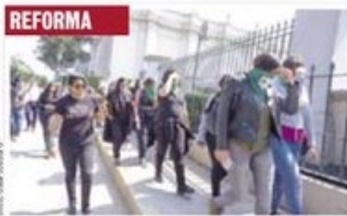
El grupo se trasladó hasta el diario Reforma, en Coyoacán. Hubo diálogo.