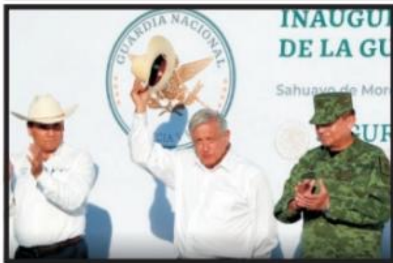
AMLO llama a Guardia Nacional a conducirse con integridad Página 5 Sección B