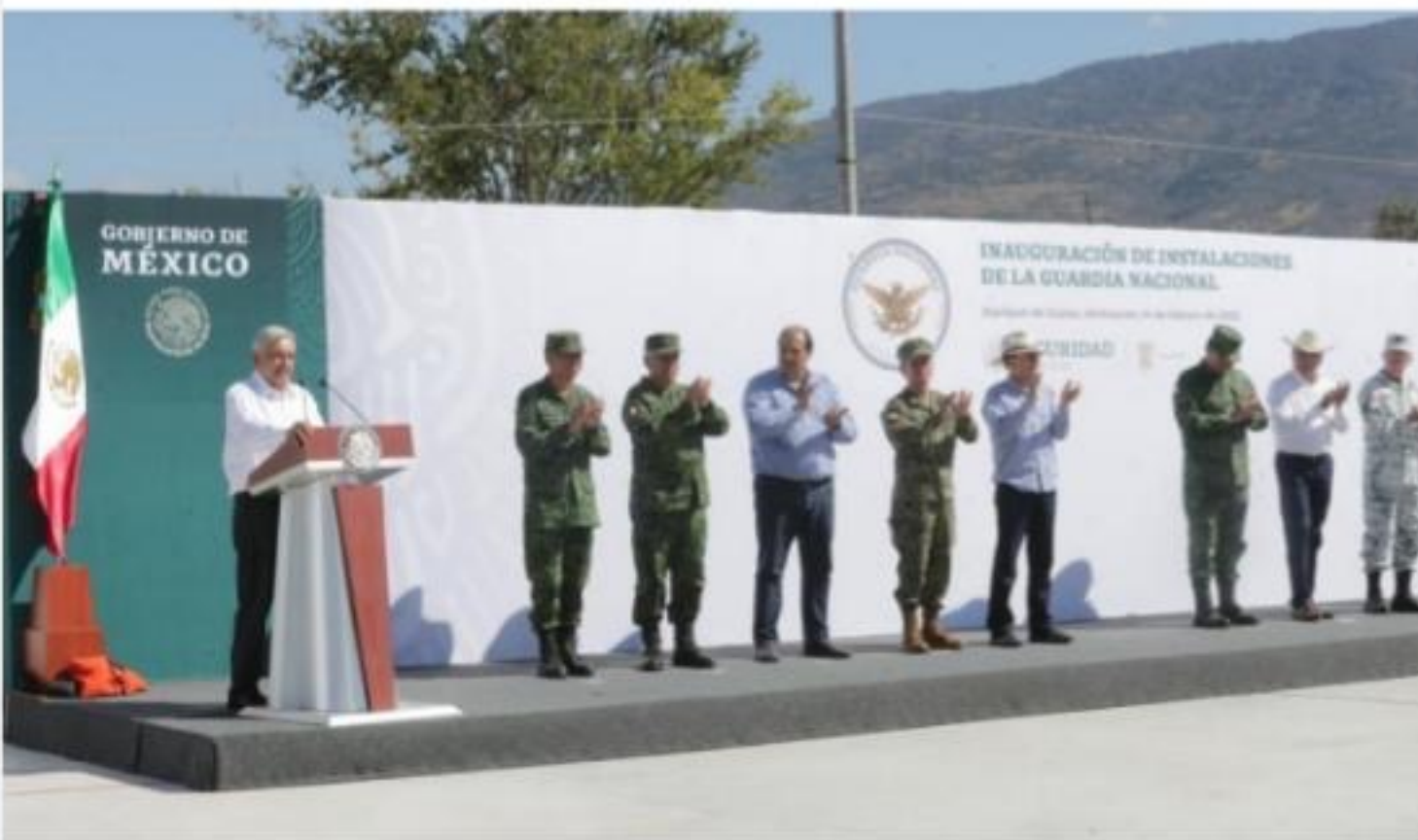
JIQUILPAN, MICH.-El presidente de la República, Andrés Manuel López Obrador y el gobernador de Michoacán, Silvano Aureoles Conejo, durante la entrega del primer cuartel de la Guardia Nacional.