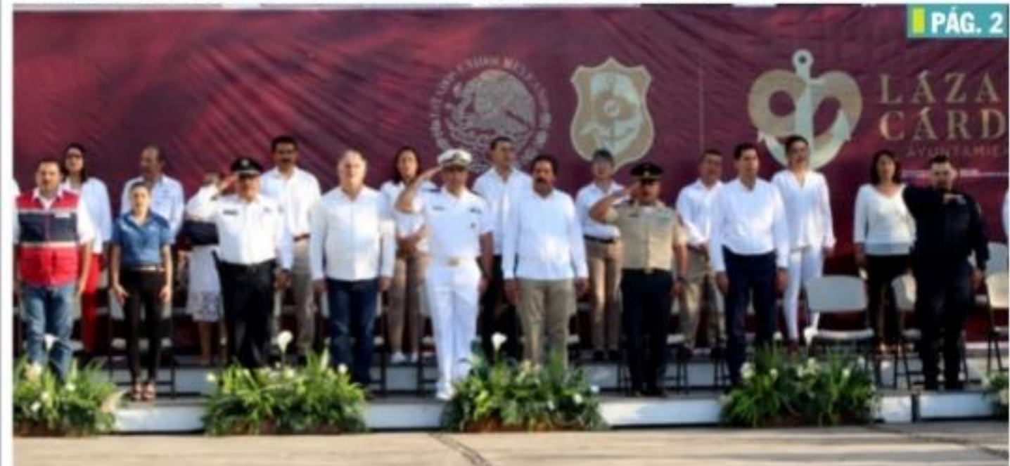
CD. LÁZARO CÁRDENAS, MICH.- El gobierno municipal de Lázaro Cárdenas, en compañía de autoridades civiles, militares y navales, conmemoraron el CLXXXIX Aniversario Luctuoso de Vicente Guerrero.