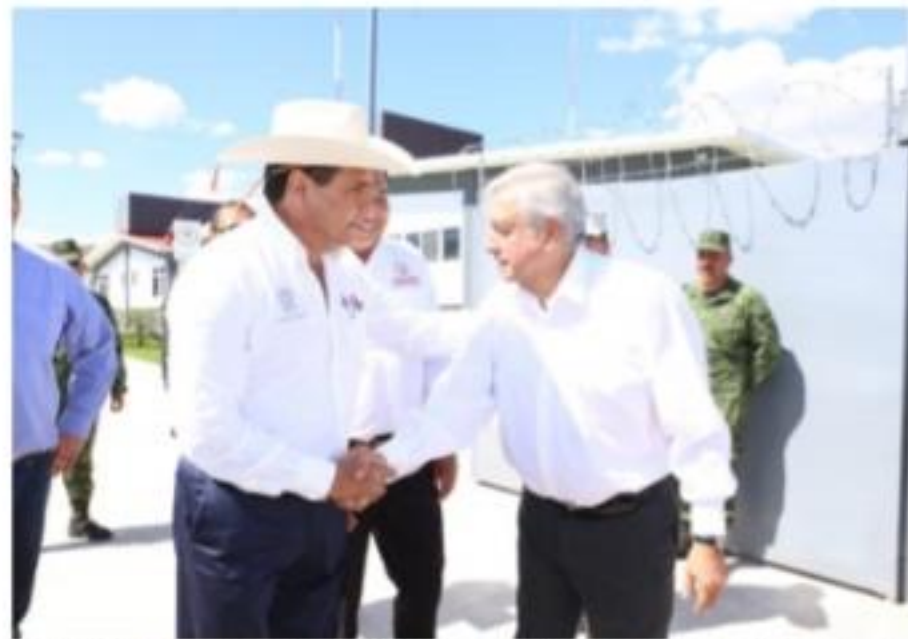
JIQUILPAN, MICH.- Encuentro entre el presidente de México, Andrés Manuel López Obrador y el gobernador michoacano, Silvano Aureoles Conejo.

"Quiero reiterar mi reconocimiento a nuestras fuerzas armadas por todo el apoyo que nos dan. El Ejército y la Marina, dos de las grandes instituciones de México ampliamente queridos y respetados por el pueblo, de ellos está compuesta la Guardia Nacional por ello hay garantía de resultados", finalizó.