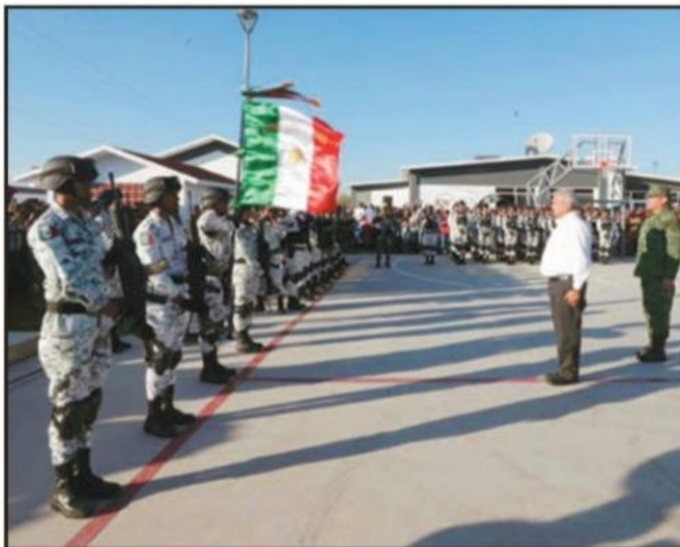
El presidente López Obrador rindió honores a la bandera al inaugurar el Cuartel de la Guardia Nacional en Jiquilpan.

Jiquilpan, Mich.- El presidente Andrés Manuel López Obrador inauguró en Jiquilpan y Sahuayo los primeros dos cuarteles de la Guardia Nacional (GN) en el país; en emotivos eventos, en donde fue recibido por la ciudadanía entre gritos de apoyo y júbilo, reiteró que está comprometido con garantizar la seguridad de Michoacán y de todo el país; “la paz es fundamental para lograr el progreso, no les voy a fallar”, afirmó con firmeza el dignatario mexicano.