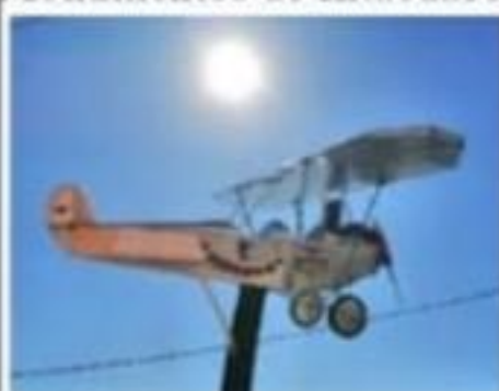
El avión de Miguel Carrillo Ayala (Pinocho) 10

Niega Fiscalía atención a adolescente presuntamente violentada sexualmente 7