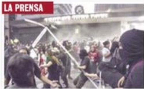
Marcharon a La Prensa, donde prendieron fuego a una camioneta y dañaron vehículos. Fueron recibidas.