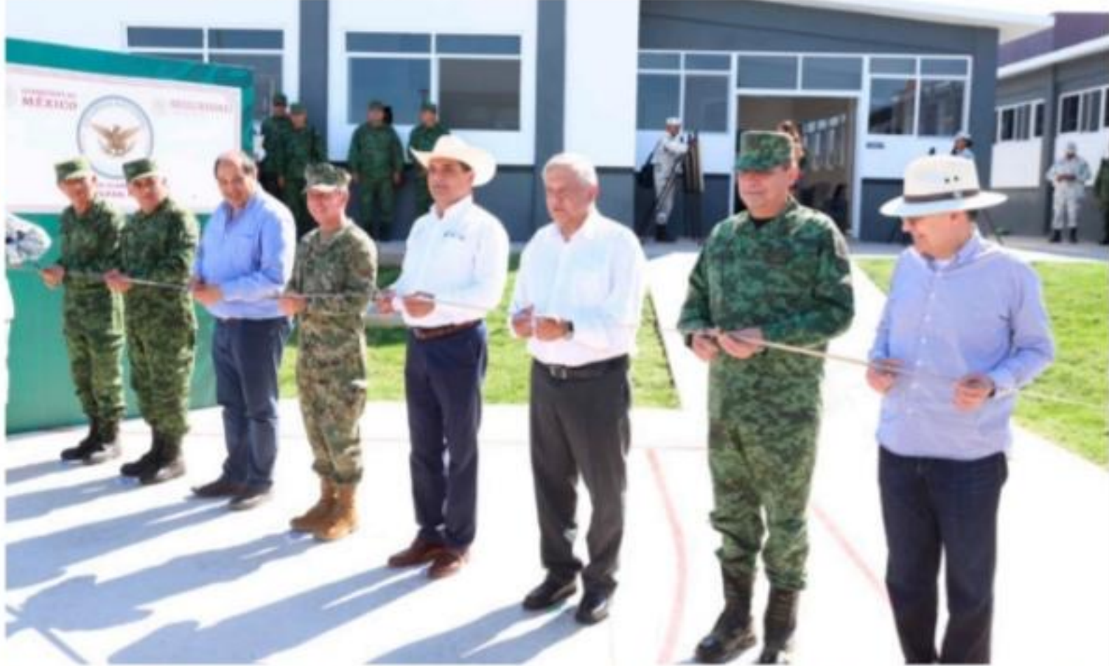
JIQUILPAN, MICH.- El presidente de la república, Andrés Manuel López Obrador y el gobernador de Michoacán, Silvano Aureoles Conejo, durante la entrega del primer cuartel de la Guardia Nacional en esta región occidental de la entidad.

Apuntala el Ayuntamiento de Uruapan la actualización de reglamentos municipales