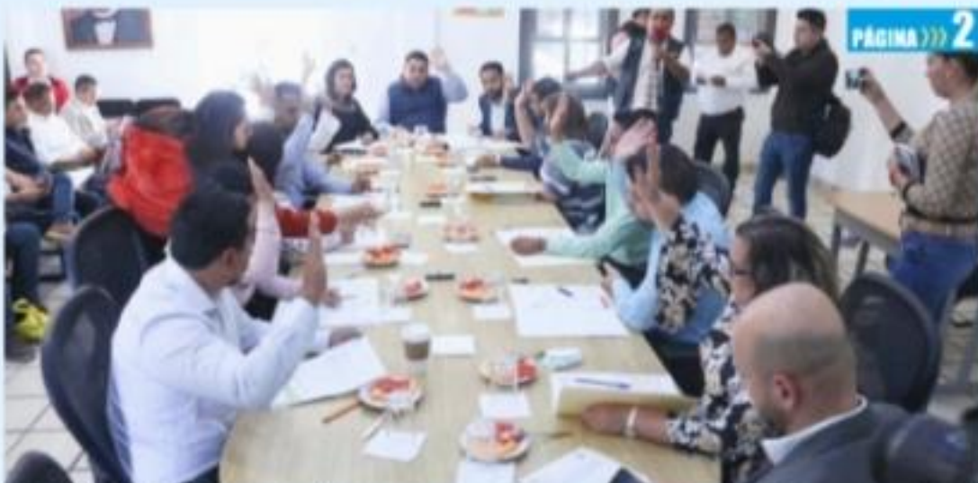
URUAPAN, MICH.- El Ayuntamiento realiza reuniones periódicas con regidores y secretarios municipales, con el fin de actualizar reglamentos municipales y crear los que hacen falta, de acuerdo a la dinámica y necesidades de este municipio.

Acepta la SCJN acción de inconstitucionalidad de la deuda del gobierno estatal por 4 mmdp