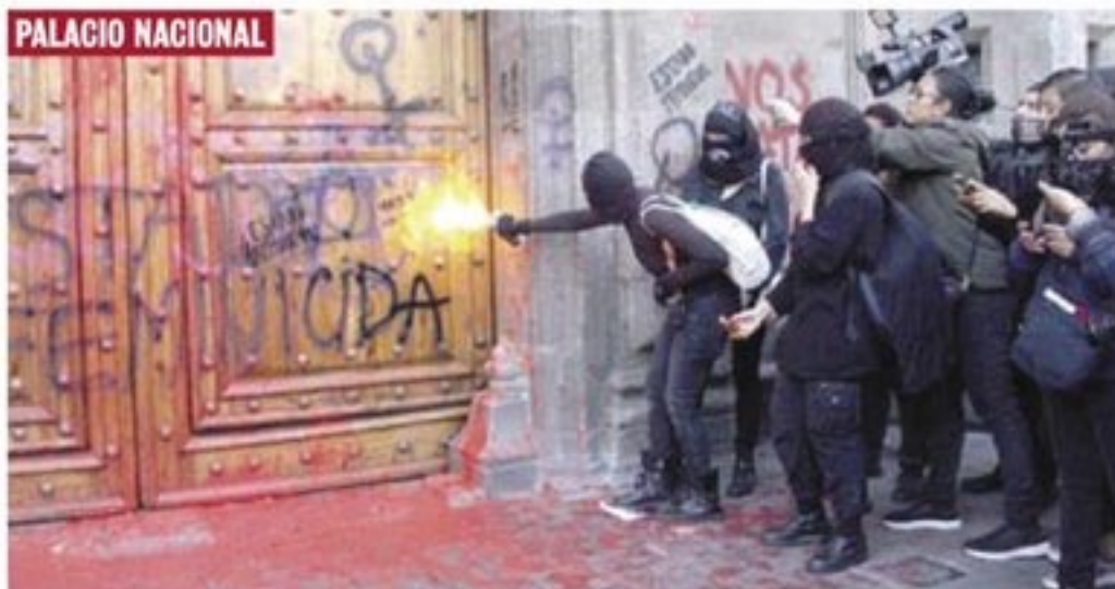
Durante la mañanera, el ataque a la Puerta Mariana. Fueron recibidas, pero quedaron inconformes.