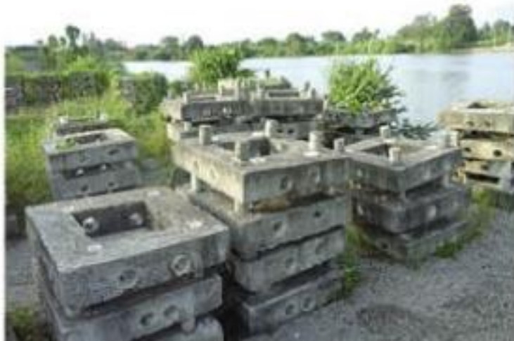
Solo falta cumplir un requisito con la Semar para que pescadores puedan llevar a cabo el hundimiento de estos arrecifes naturales que por año han estado abandonados.

De acuerdo a una reunión entre representantes del sector pesquero y la Secretaría de Marina Armada de México, todo está en orden y en cuanto se tramite el Formato Ocho efectuando el pago respectivo, se formarán las carpetas del caso a la espera de la autorización de la colocación del arrecife frente al » 4