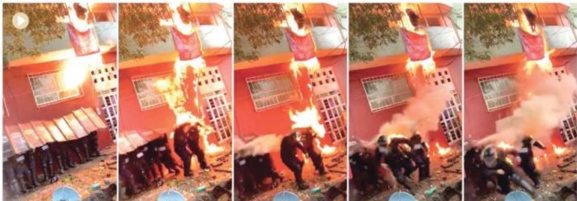
VECINOS arrojan tanques de gas y prenden fuego a policías, ayer en la colonia Alfonso XIII.

Inquilinos ligados a Los Claudios se resisten a orden judicial en Álvaro Obregón y atacan a agentes con piedras, bombas molotov...; hay 17 heridos; acusan abusos y GCDMX ofrece indagar. pág. 14