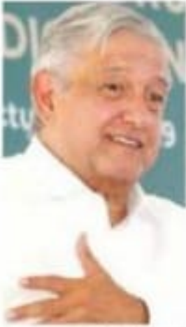
El Presidente visitó ayer San Luis Potosí y Zacatecas.

Alfonso Durazo, secretario de Seguridad, señaló que no caerá en "la idea conservadora", de que la fuerza lo resuelve todo, pues será el último recurso.