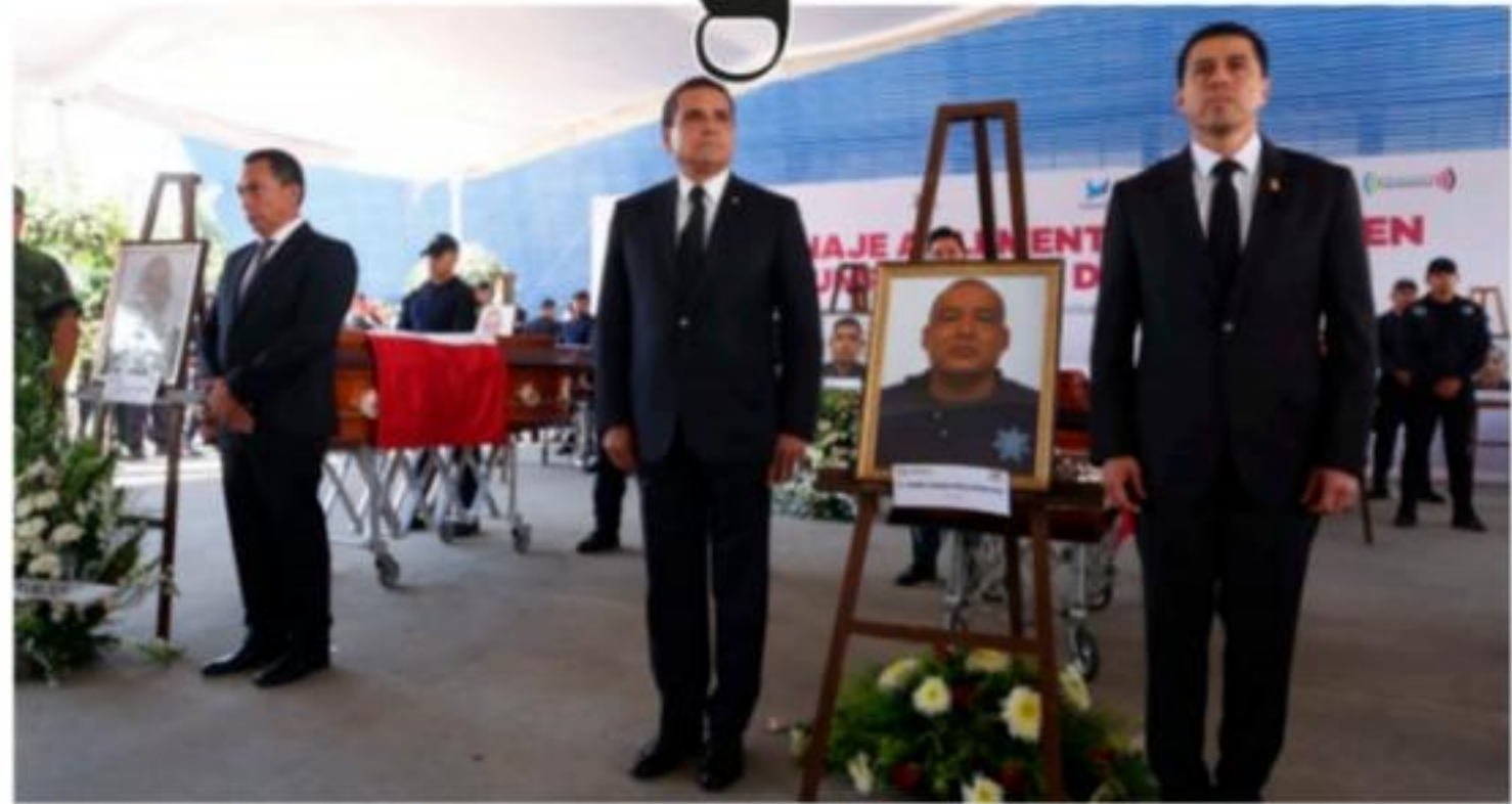
MORELIA, MICH.- El gobierno de Michoacán, encabezado por Silvano Aureoles Conejo, rindió homenaje a los elementos de la Policía Michoacán, caídos en cumplimiento de su deber.

Aprueban por unanimidad del informe trimestral del Implan