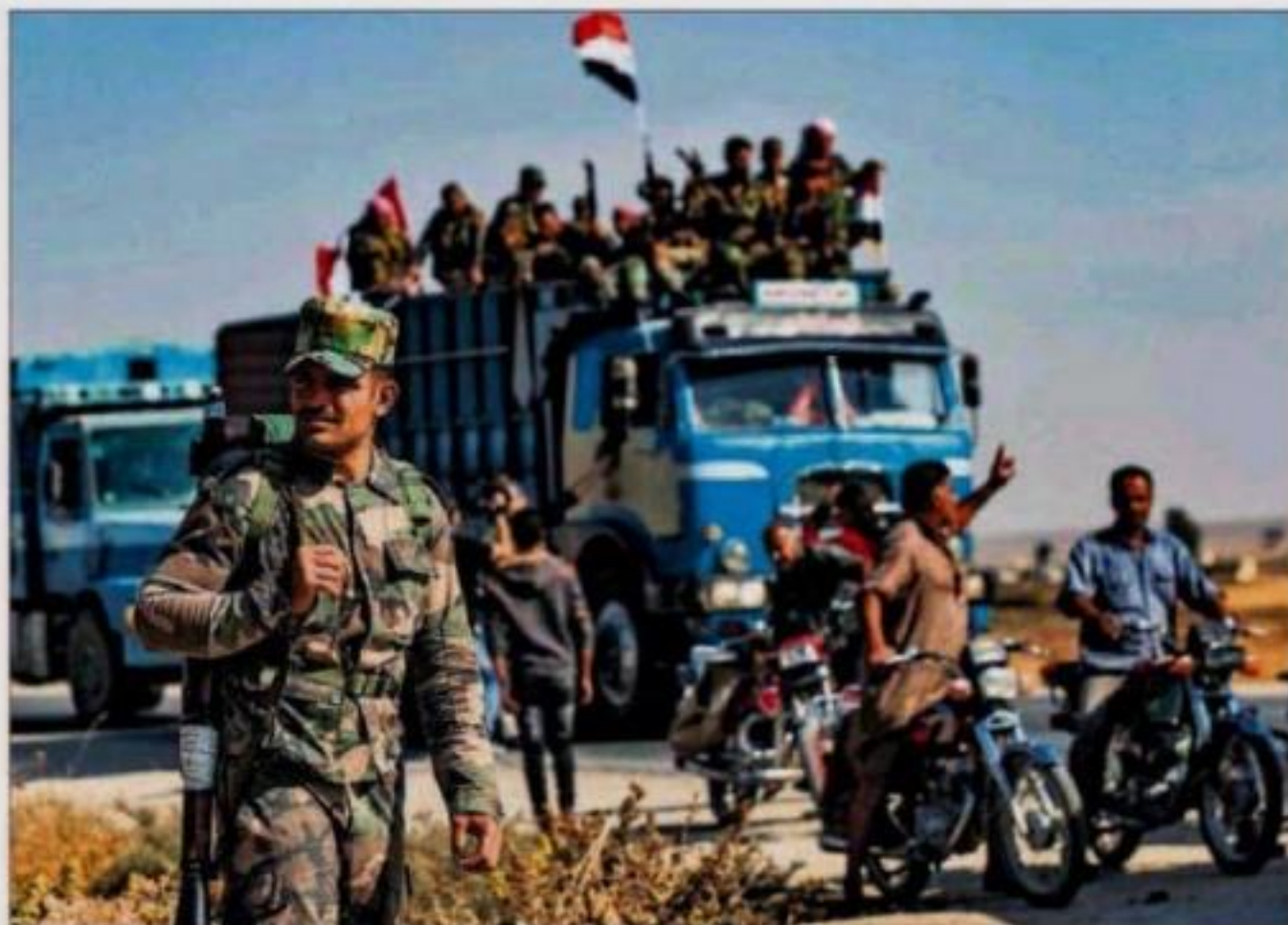
Tropas sirias llegan a la ciudad de Tal Tamr, cerca de la frontera turca.