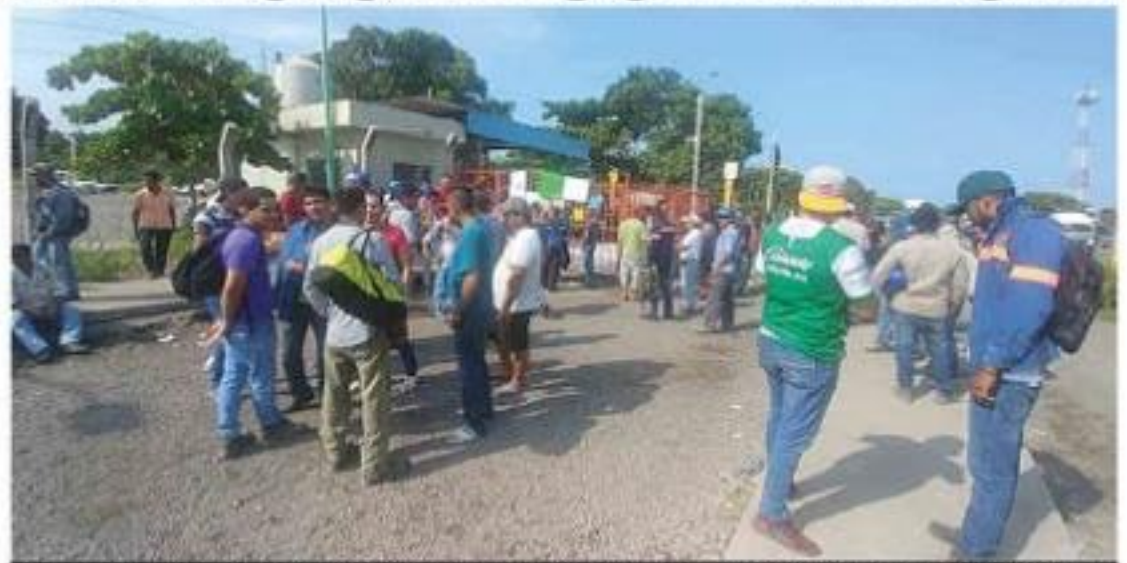
Aspecto del plantón de obreros que laboraron en la obra civil del Laminador de ArcelorMittal, y que reclaman justa indemnización a la contratista Lomcci, que aseguran los corrió sin pagarles nada.