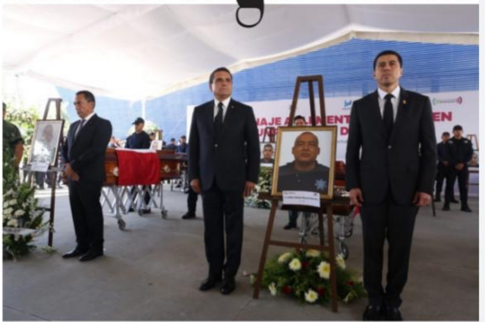
MORELIA, MICH.- En homenaje a policías caídos en cumplimiento de su deber, el gobernador Silvano Aureoles Conejo refrenda el compromiso de trabajo coordinado para que hechos en Aguililla no queden impunes.

Se suman escuelas de LC al Día Mundial del Lavado de Manos PÁGINA >>> 4