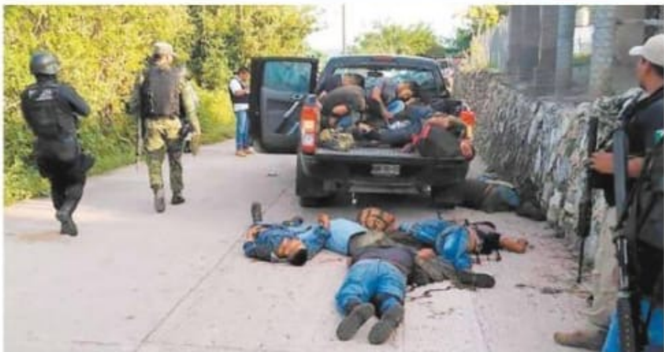
ESTADOS A24 y NACIÓN A12 Militares y policías estatales arribaron al lugar de los hechos, donde se encontraban los cuerpos de los civiles en la bodega de una camioneta y en el suelo.

Horas antes, en Michoacán la policía estatal rindió homenaje a los 13 elementos que fueron asesinados el lunes en una emboscada. Por la mañana, el presidente Andrés Manuel López Obrador descartó modificar la estrategia de seguridad de su gobierno.