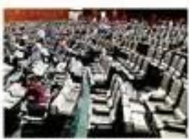
Foto: una grabación de la BBC, generada por inteligencia artificial