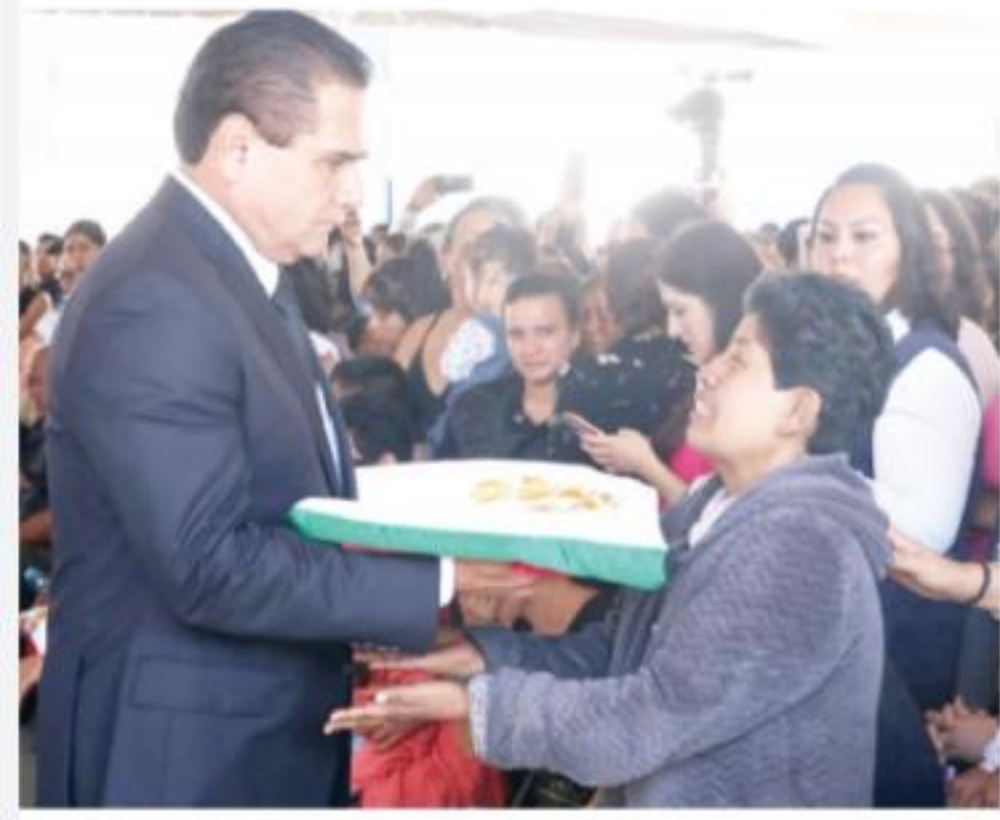
MORELIA, MICH.- El rostro de ambos lo dice todo, el del gobernador Silvano Aureoles y de esta mujer que recibe la bandera de honor de su ser querido caído en cumplimiento del deber.

► Realizan exequias de policías caídos en Aguililla