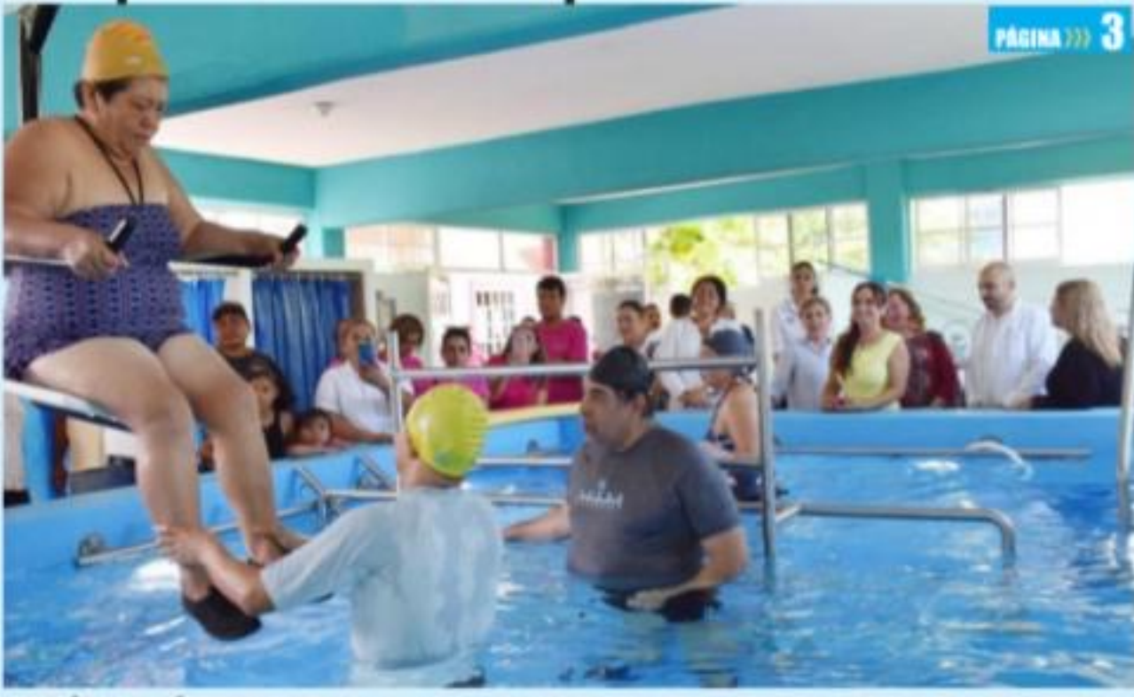
CD. LÁZARO CÁRDENAS, MICH.- Este lunes fue inaugurado el tanque de hidroterapia que operará en el Centro de Rehabilitación Integral de Lázaro Cárdenas.

Rehabilita ayuntamiento y DIF municipal, tanque de hidroterapia del CRI PÁGINA >>> 3