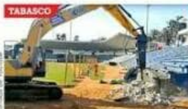
Tabasco. Tabasco. Tabasco.

En Cancún, Sedatru pidió una zona de skatepark, un corredor comercial exterior, are-