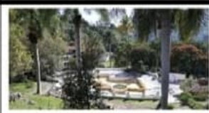
Conoce Alfredo Ramírez Bedolla, proyecto turístico de San José Purúa 2