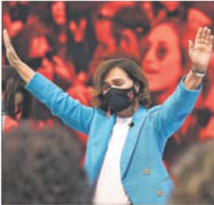
Carmen Calvo, que tras su intervención con el Congreso Federal del PSOE, que se celebró en Montecasi, jueves, 13

«falsa libertad y modernidad», un tema recurrente que está a regañadientes el presidente Sánchez. «No vamos a tener, bajo el pretexto de la democracia, la pérdida de la libertad de que los barones territoriales pueden una posición similar respecto a la financiación autonómica, está claro el inicio de la reforma», dijo.