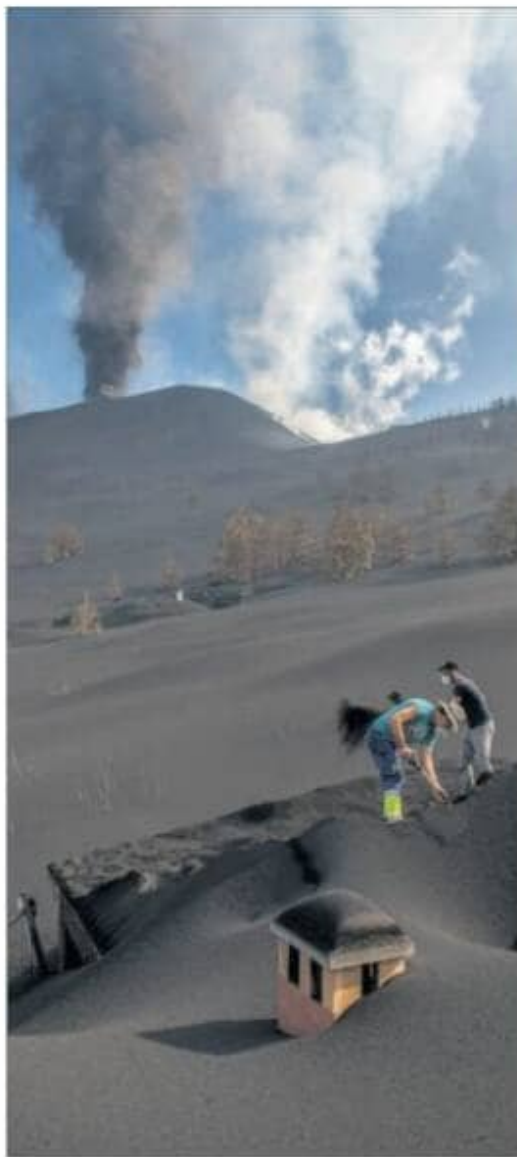
UN TSUNAMI DE LAVA Y MONTAÑAS DE CENIZA. El flujo del volcán de La Palma creció ayer y acechaba núcleos de población como La Laguna. En la foto, vecinos de Las Manchas tratan de limpiar la ceniza sobre sus casas. Páginas 24 y 25