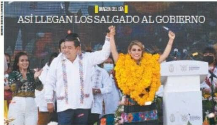
Chilpancingo. — Acompañada por su padre, el senador morenista Félix Salgado Méndez, Evelyn Salgado Pinoda (Morena) asumió la gubernatura de Guerrero, convirtiéndose en la primera mujer que gobierna el estado y con una carrera política corta. La mandataria se refirió a su padre como "un gigante de la democracia". | ESTADOS | A10