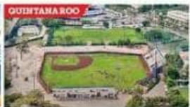
Quintana Roo. Villahermosa. Villahermosa.