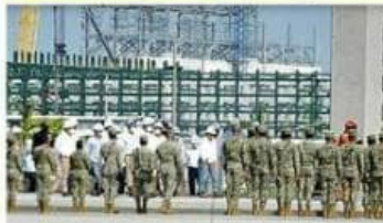
La Secretaría de Energía llegó custodiada por la Marina y la Guardia Nacional a Dos Bocas. Al interior, militares la recibieron con honores.