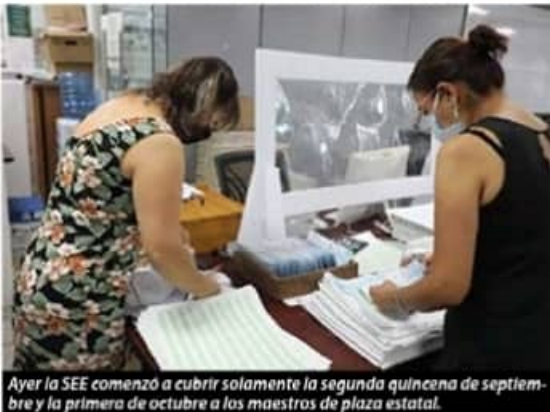
Ayer la SEE comenzó a cubrir solamente la segunda quincena de septiembre y la primera de octubre a los maestros de plaza estatal.