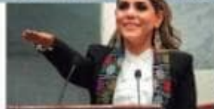
EVELYN SALGADO, ayer, al rendir protesta.

Con amplia convocatoria asume gubernatura, no es sólo cambio de estafeta, señala, promete tierra de honestidad y libertades, seguridad, impozengible pág. 10