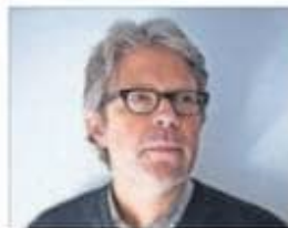
BARCELONA Jonathan Franzen.

El novelista, que publica 'Encrucijadas', asegura: "Es humanamente imposible hacer más de seis novelas buenas"