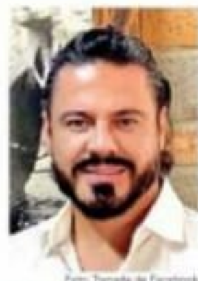
ARISTÓTELES SANDOVAL, LA VICTIMA