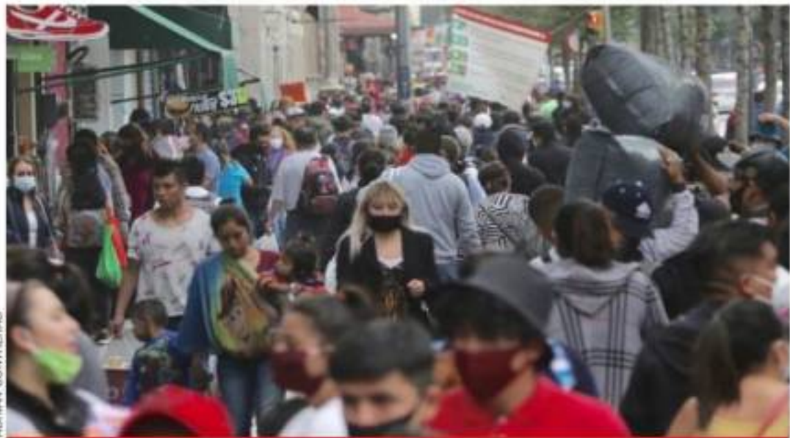
Así lucieron ayer calles del centro de la Ciudad de México, a pesar de los llamados de la autoridad para quedarse en casa.