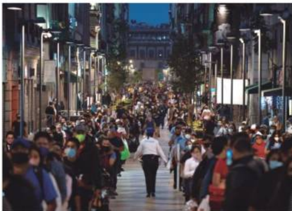
MILES abarrotan las calles y hacen compras de pánico ayer en el Centro (imagen), también en centros comerciales.

◻ Sacude anuncio a la BMV y baja 0.6%; el peso se deprecia 0.7%; cotiza en 19.95 por dólar págs. 3, 6 y 7