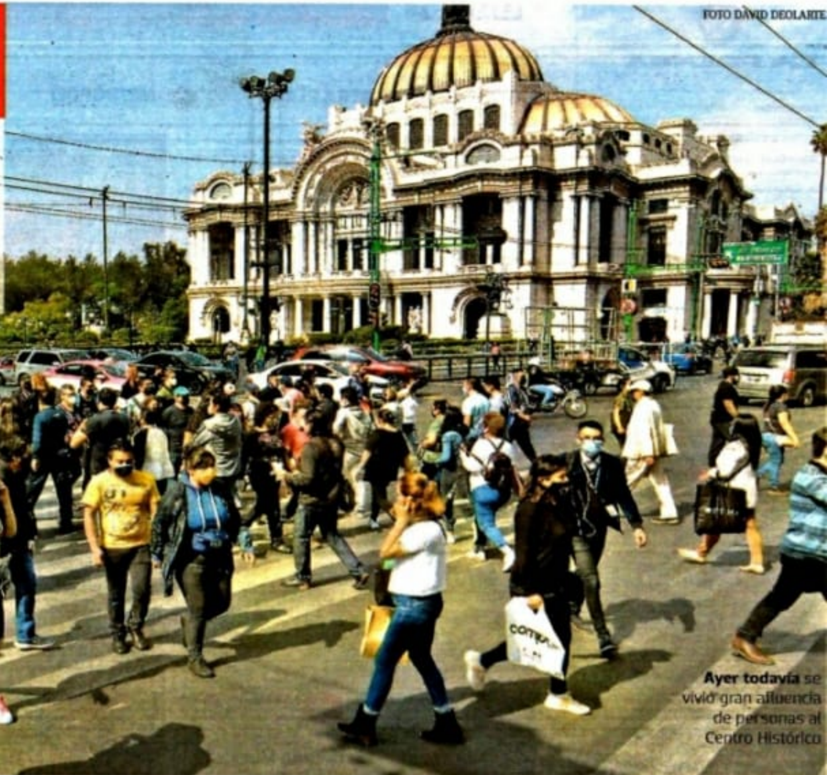
Ayer todavía se vivió gran afluencia de personas al Centro Histórico