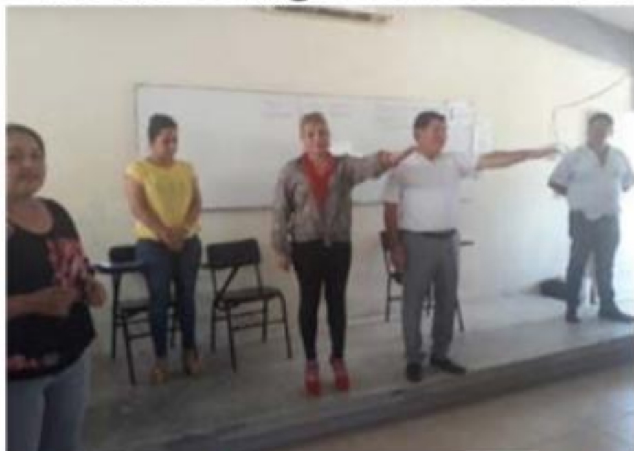
La coordinación regional de la CNTE se prepara para acudir al VIII Congreso Seccional de Bases, por lo que está designado a sus delegados efectivos.

El día de ayer y durante toda la semana, la Coordinación Regional de Lázaro Cárdenas de la CNTE, estuvo presidiendo las diferentes asambleas delegacionales en esta Región, para nombrar a los delegados efectivos y fraternos, rumbo al VIII Congreso Seccional de Bases, en donde será nombrado el nuevo Secretario General y El Comité Ejecutivo de la SECCIÓN XVIII.