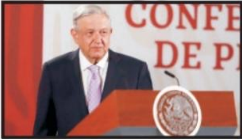
Critica AMLO silencio ante el saqueo de empresas españolas en México Página 5 Sección B