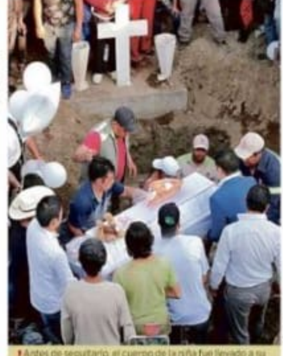
Antes de sepultarlo, el cuerpo de la niña fue llevado a su escuela. Más de 200 personas acompañaron el cortejo.

Sandford, fotoescultor Autor de desnudos que lleva al bronce o al mármol, con reminiscencias a la Grecia clásica, el británico Stuart Sandford prepara un proyecto para México. CULTURA (PÁG. 17)