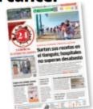
MERCADO NEGRO Reconocen autoridades venta de medicamento en tianguis, pero piden denuncias.

Mientras el desabasto se agrava en el sector Salud, pese a la negativa de autoridades, ayer familiares de pacientes rompieron el diálogo con Gobernación por falta de respuesta a sus demandas; en tanto, los testimonios de quienes padecen por el desabasto y mala atención se acumulan, tal es el caso de una familia que escribió a 24 HORAS para denunciar la muerte de su madre MÉXICO P.4