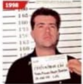
En marzo de 1998 fue detenido por robo de vehículo y portación de arma prohibida.

El líder gremial es senador suplente por Morena y