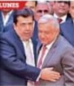
El líder de la CATEM mostró el lunes a AMLO el "músculo" de esa central.