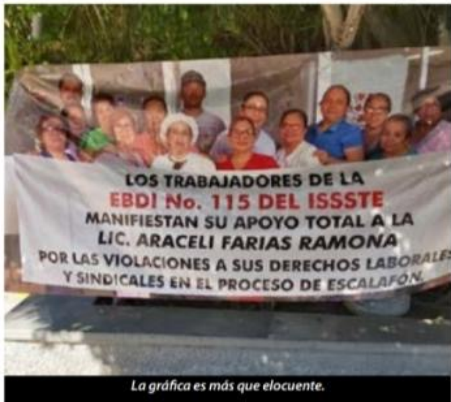
La gráfica es más que elocuente.