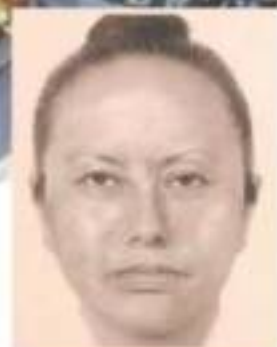
Diffunden retrato hablado de la mujer que se llevó a la niña.

● México, el segundo país con más niños en zonas de conflicto de alto grado. A15