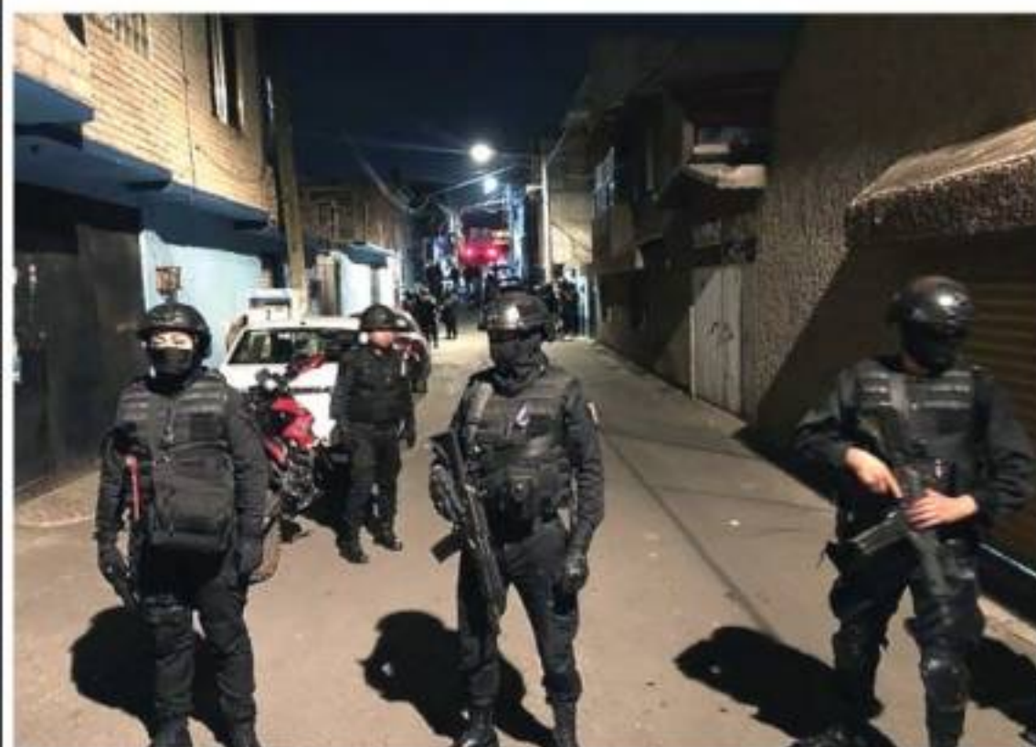
EL OPERATIVO, ayer, en la calle y casa donde ubicaron pertenencias de la niña.

Ajustan protocolo de Alerta Amber y de entrega de alumnos; sepultan a la menor entre lágrimas y reclamo de justicia.