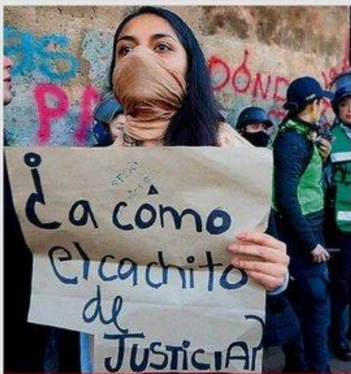
Mujeres integrantes de varios colectivos se manifestaron afuera de Palacio Nacional para protestar por el homicidio de la niña Fátima. Exigieron al Jefe del Ejecutivo acciones concretas para frenar la ola de feminicidios en el país.

Deberán transferir su patrimonio e infraestructura hospitalaria a la Federación, informa Hugo López-Gatell