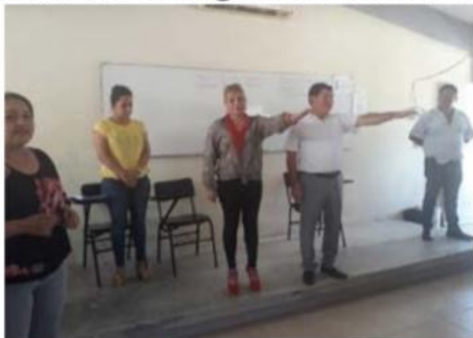
La coordinación regional de la CNTE se prepara para acudir al VIII Congreso Seccional de Bases, por lo que está designado a sus delegados efectivos.

El día de ayer y durante toda la semana, la Coordinación Regional de Lázaro Cárdenas de la CNTE, estuvo presidiendo las diferentes asambleas delegacionales en esta Región, para nombrar a los delegados efectivos y fraternos, rumbo al VIII Congreso Seccional de Bases, en donde será nombrado el nuevo Secretario General y El Comité Ejecutivo de la SECCIÓN XVIII.