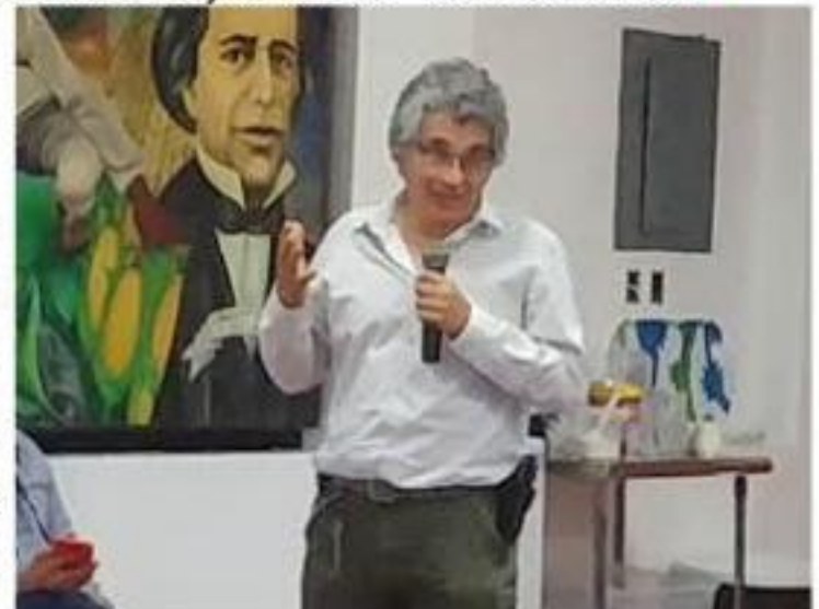
Un funcionario de la CNA al momento de explicar que son las descargas urbanas las que amenazan la vida acuática en esta región.

entorno a Fertinal. Se explicó que uno está dentro dársena del Río Balsas en su bra- » 3