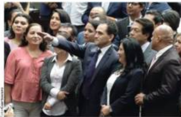
El secretario de Hacienda, ayer, al rendir protesta.

Ya son 4 detenidos; uno señala adeudo de $600 mil; PGJ desestimó caso en el que participó un Uber rentado; dos implicados, narcomenudistas; el presunto asesino estuvo preso y fue liberado; van por más cómplices pág. 13