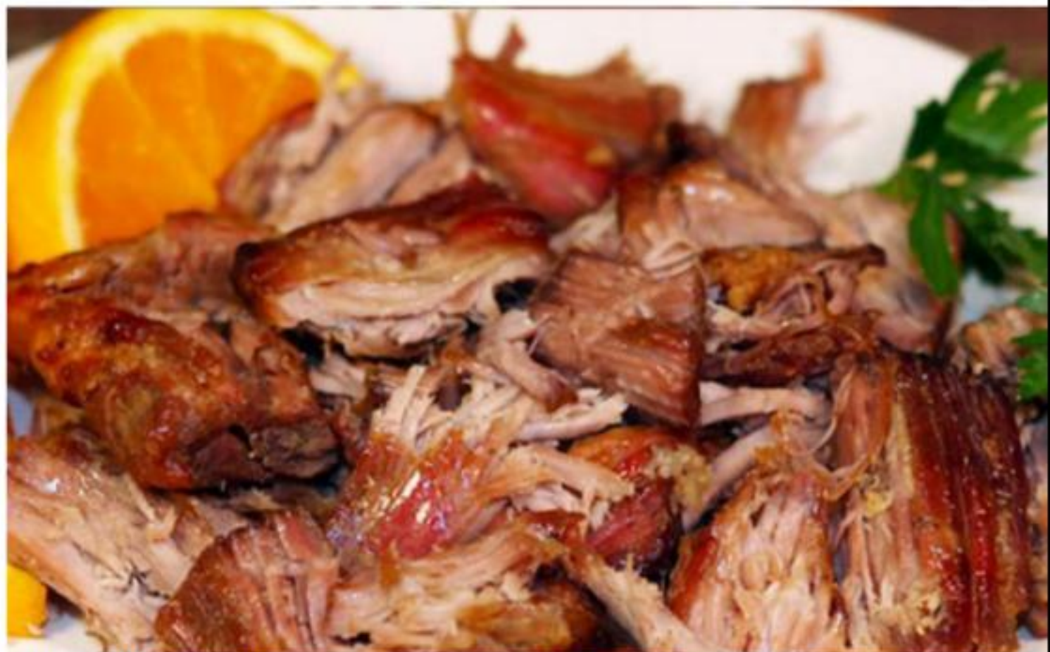
MORELIA, MICH.- Todo listo para la magna Feria de las Carnitas de La Piedad, festividad que se realizará el próximo 21 de julio en la plaza principal del municipio.

Y acotó que además de los productores locales del manjar, habrá stands de productores de Sahuayo, Tancitaro, Quiroga y Huandacareo; "en Michoacán se hacen las mejores carnitas de México", cerró.