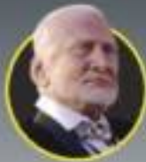
Buzz Aldrin Astronauta

EL ÚNICO astronauta vivo de la misión Apolo 11, que caminó en la superficie lunar hace 50 años, recuerda la "desolación magnífica" del satélite; ve como privilegio haber estado en esa primera misión tripulada; es tiempo de que la siguiente generación se aliste para ser pionera con una presencia permanente en Marte, señala en entrevista.