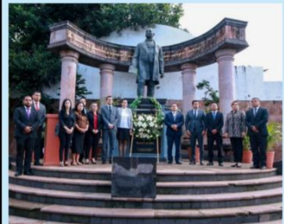
URUAPAN, MICH.- Autoridades municipales y educativas rindieron homenaje a Benito Juárez, en su 147 aniversario luctuoso. (INFORMACIÓN PÁGINA 3)