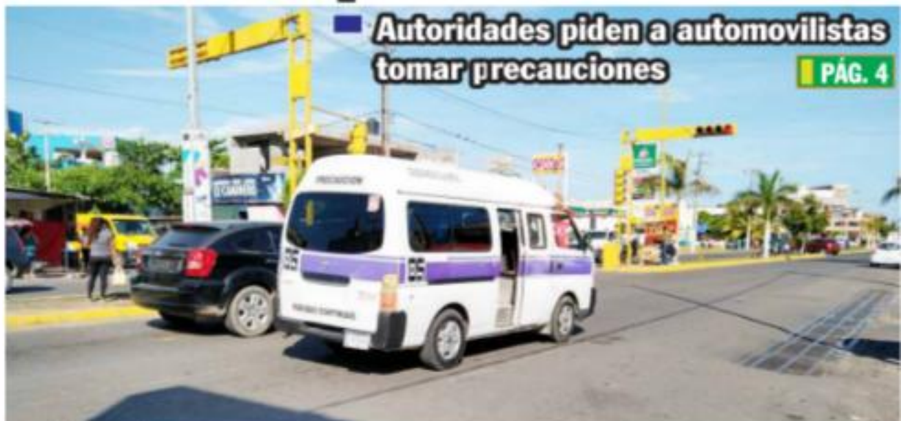
CD. LÁZARO CÁRDENAS, MICH.- Hoy darán inicio los trabajos de pinta de cruces peatonales en las intersecciones que conforman la avenida Lázaro Cárdenas, con esquina en las calles de Corregidora y Constitución de 1814.