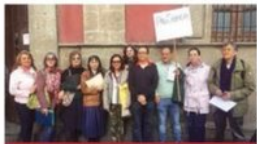
ELIAC TORRES / CRÓNICA

Lamentan la creciente "falta de confianza de una parte de la clase política en la ciencia como factor de progreso para el desarrollo nacional"