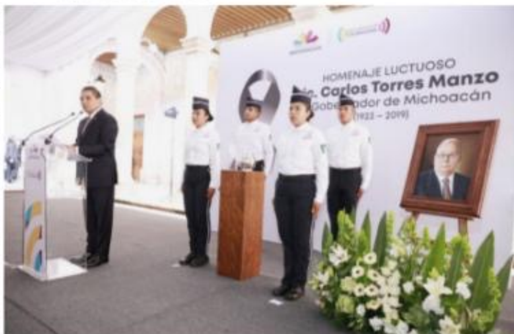
MORELIA, MICH.- El gobernador Silvano Aureoles Conejo, encabezó el homenaje en honor del ex gobernador Carlos Torres Manzo, fallecido hace unos días en la capital del país.

De este modo, fue como ayer en Palacio de Gobierno llevó a cabo la Ceremonia de las Últimas Exequias del Exgobernador Carlos Torres Manzo.