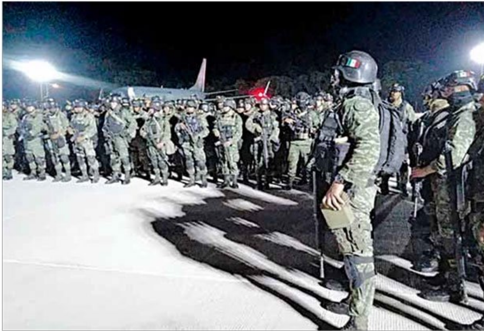
▲ Los elementos de la Secretaría de la Defensa Nacional llegaron anoche a la capital de Sinaloa en dos aviones de la Fuerza Aérea Mexicana para garantizar la seguridad de los ciudadanos, luego de la