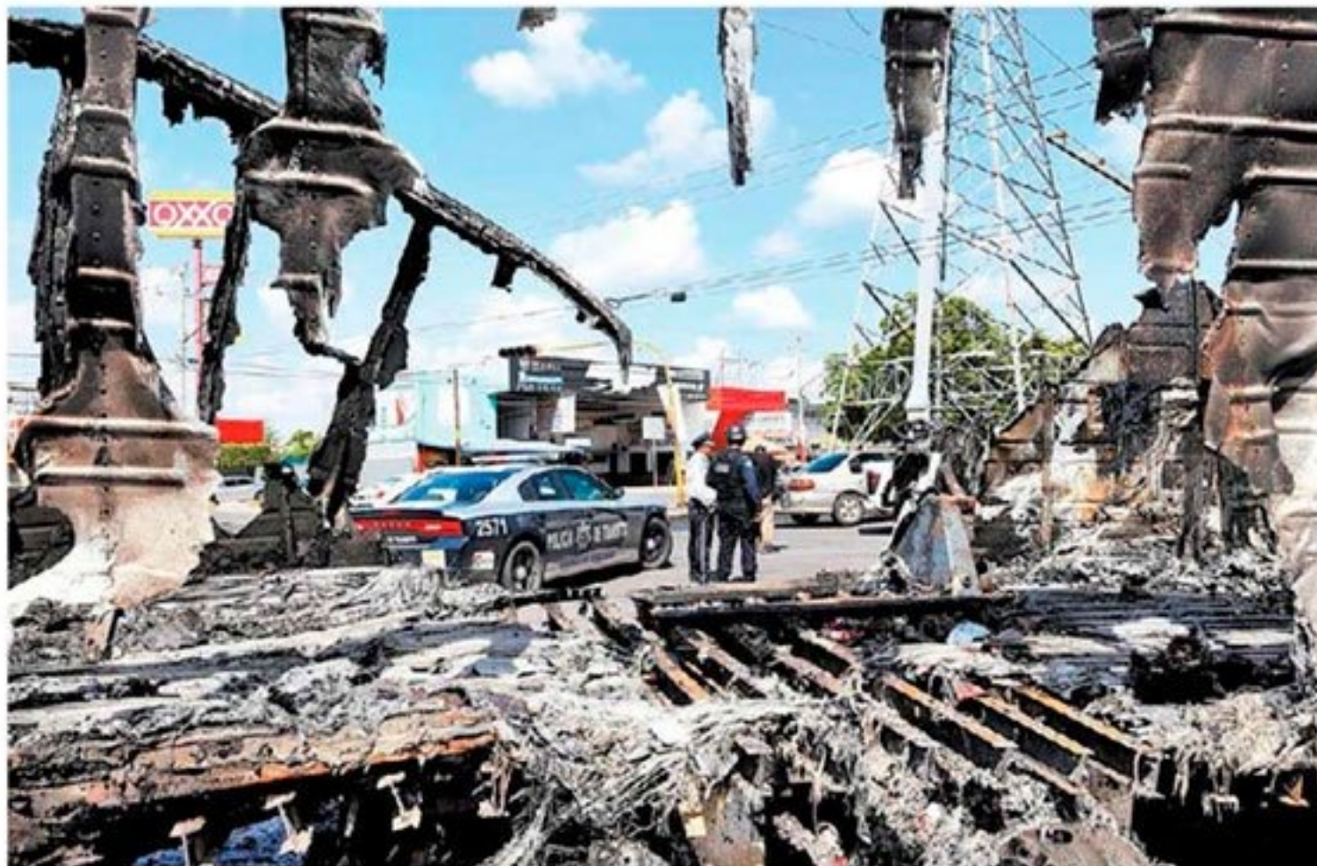
La ofensiva del cártel de Sinaloa concluyó con 8 muertos, 14 heridos, 19 bloqueos y 51 reos evadidos. JORGE CARBALLO