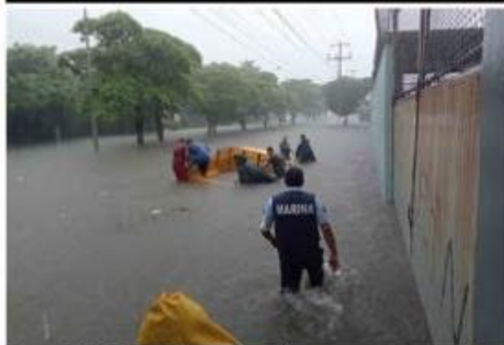
Personal de la Décima Zona Naval acudieron a auxiliar a automovilistas que de manera imprudente, como suele ocurrir siempre que se inunda la avenida Tulpanes, se atreven a cruzar con sus unidades en esa zona y se quedan varados con el daño que ello encierra para sus automotores.