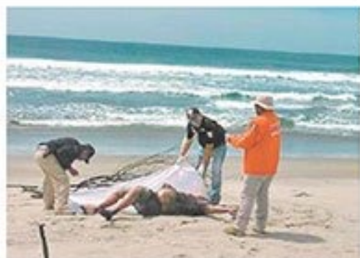
El cadáver de un migrante, que viajaba en una lancha que naufragó el pasado 11 de octubre, fue localizado a la orilla del mar.