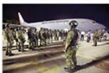
Anoche llegaron a la capital sinaloense más de 200 elementos de las fuerzas especiales del Ejército.