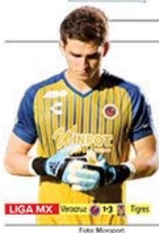
LIGA MX Veracruz 1-3 Tigres