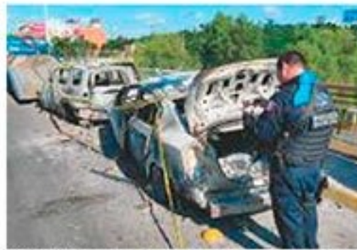
POLICÍAS, ayer, en el retiro de vehículos quemados.

SEDENA refiere errores: precipitación, no se avisó a mandos y se retrasó 2 horas una orden de cateo