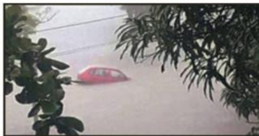
VEHÍCULOS FUERON ARRASTRADOS POR LA CORRIENTE, QUE TRANSITÓ POR CALLES CONVERTIDAS EN AUTÉNTICOS RÍOS.