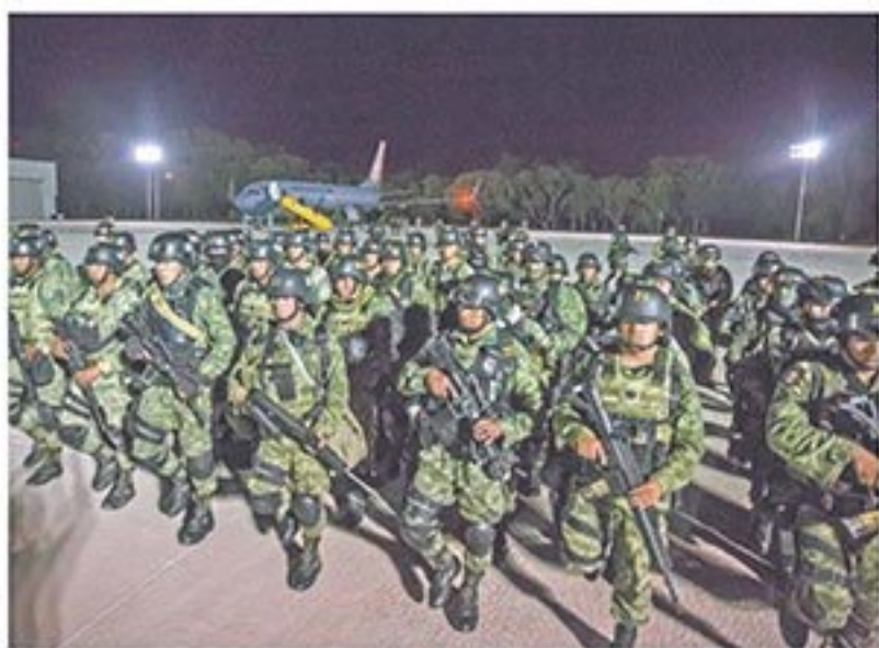
Tras las balaceras del jueves, 200 militares de élite arribaron ayer a Culiacán para reforzar la seguridad.