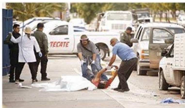
Los cuerpos de cuatro presuntos sicarios fueron levantados en las inmediaciones del bulevar Enrique Sánchez Alonso, que cruza la zona de Tres Ríos donde se concentraron los enfrentamientos del jueves.

Además del miedo por nuevos tiroteos, la ciudad vivió un viernes sin clases y con cierres en negocios y bancos; el saldo fue de 8 muertos, 16 heridos, 19 narcobloqueos y 51 reos fugados