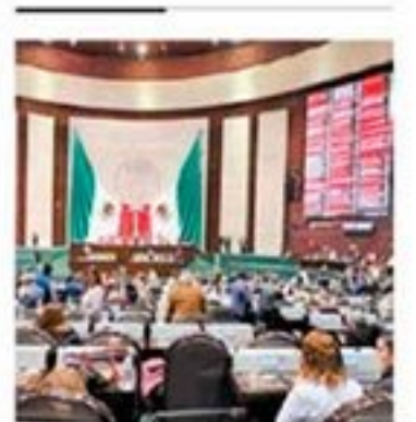
Debate en San Lázaro.