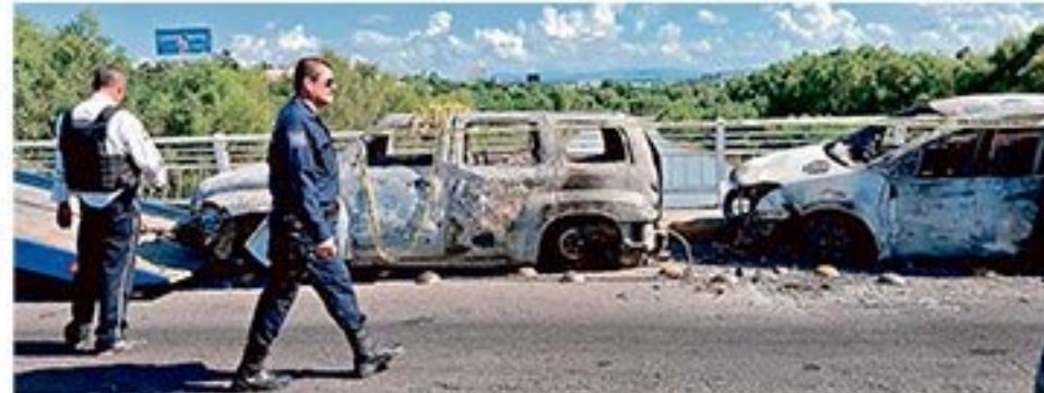
Las huellas de la batalla ocurrida el jueves permanecieron prácticamente todo el día de ayer en las calles de Culiacán.

"Ahí es donde se encuentran con este retén y una cantidad de gente adicional armada; retienen a un oficial, cuatro de tropa, un vehículo y armas, que posteriormente son regresados sin lesiones", admitió el General, quien no juró la familiaridad de trato entre uniformados y sicarios.