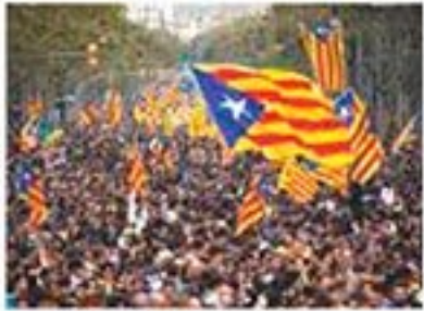
MARCHA, ayer, en Barcelona.