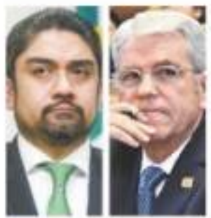
Interpol, tras exsecretarios maneristas COMX 10