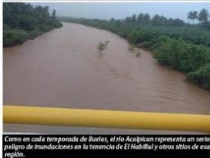
Como en cada temporada de lluvias, el río Acalpican representa un serio peligro de inundaciones en la tenencia de El Habillal y otros sitios de esa región.