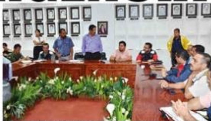
Aspecto de la reunión extraordinaria del Consejo Municipal de Protección Civil.