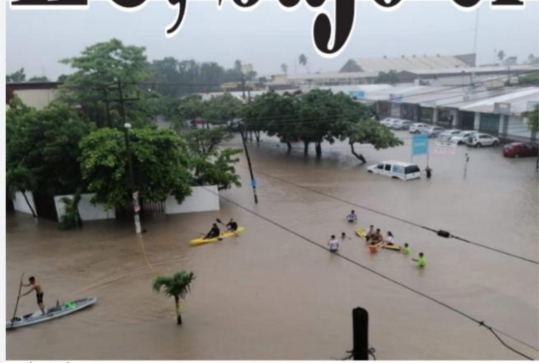
CD. LÁZARO CÁRDENAS, MICH.- Un grupo de jóvenes, con apoyo de tres kayaks, se dieron a la tarea de transportar ciudadanos por las calles, pese a que el agua les llegaba en algunos casos hasta la cintura.

Jóvenes, solidarios con varados por inundaciones PÁG. 2