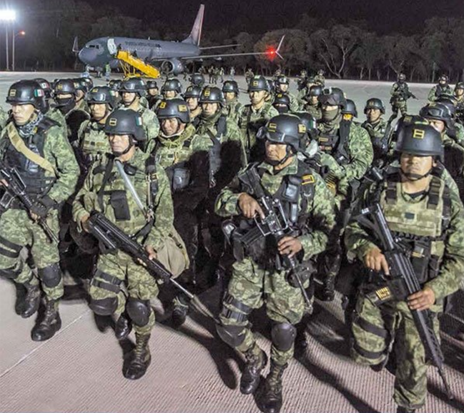
POR PARIS SALAZAR Y KAREN BRAVO / P4-6

• GOBERNADORES MUESTRAN SU RESPALDO AL MANDATARIO FEDERAL Y LLAMAN A CERRAR FILAS CON ÉL