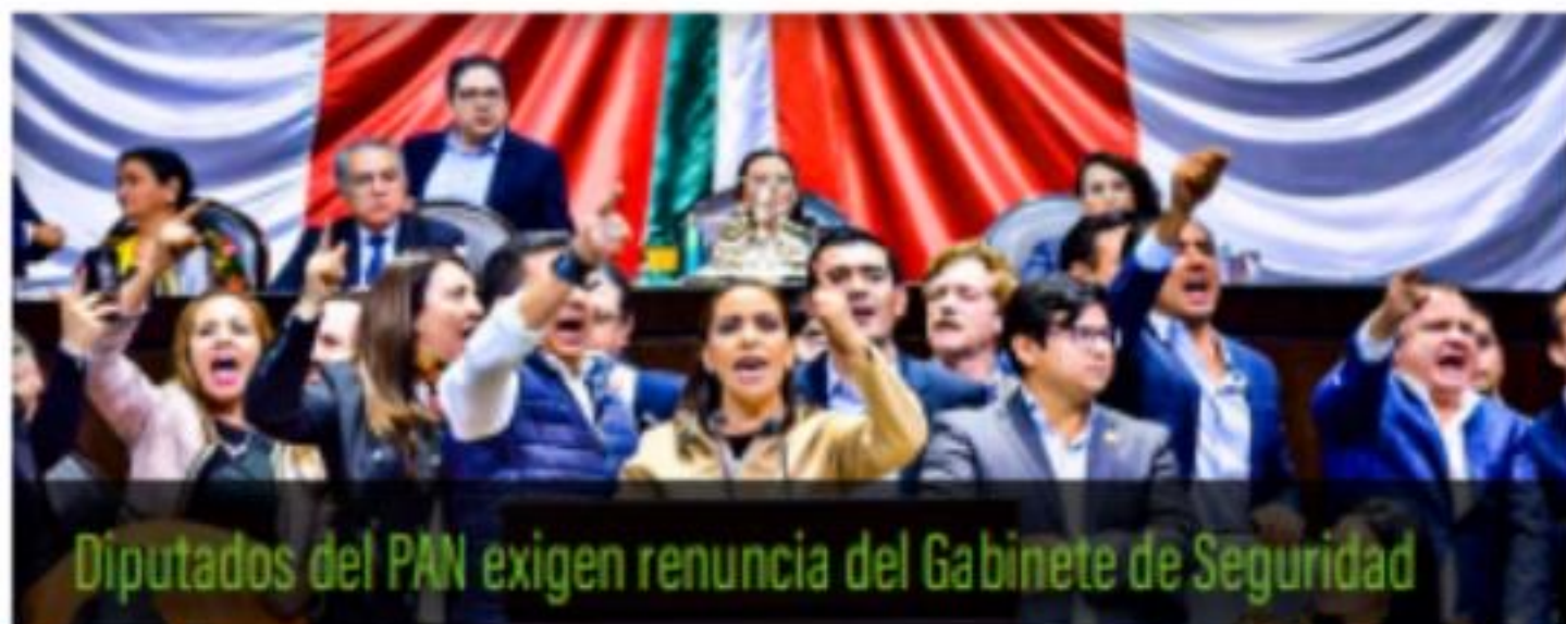
Diputados del PAN exigen renuncia del Gabinete de Seguridad