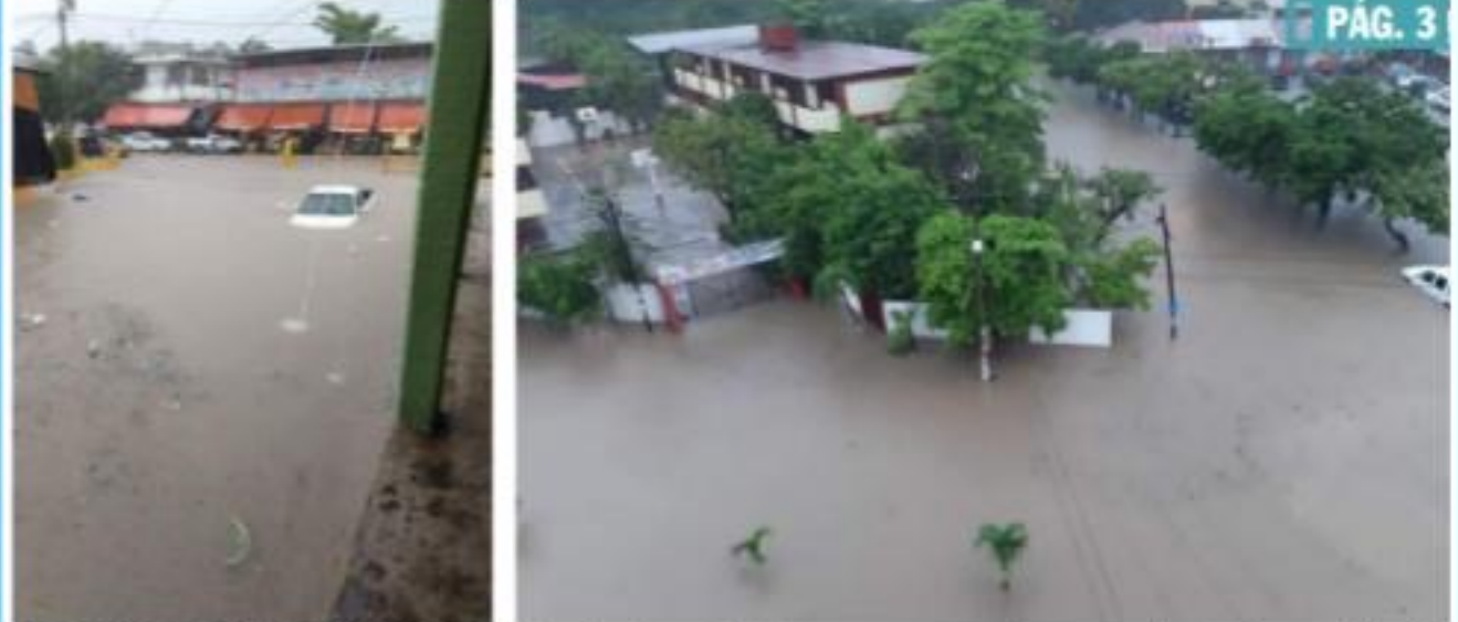
CD. LÁZARO CÁRDENAS, MICH.- Fuertes inundaciones se presentaron por las intensas lluvias registradas durante este viernes en el municipio de Lázaro Cárdenas.

Se pidió a la población extremar precauciones PÁG. 3