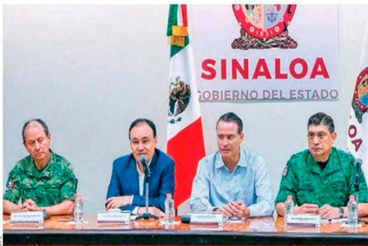
Alfonso Durazo (SSPC), acompañado del almirante José Rafael Ojeda Durán (Semar), Quirino Ordaz Coppel (gobernador de Sinaloa) y el general Luis Crescencio Sandoval (Sedena), durante la conferencia ofrecida la mañana de ayer en Culiacán, Sinaloa.

La miscelánea fiscal pasa en la Cámara como la quiere Hacienda