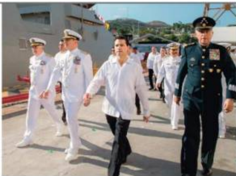
EL MANDATARIO , ayer, flanqueado por los secretarios de la Marina y de la Defensa.

«El Presidente afirma que es una de las instituciones más apreciadas; en el Día de la Armada presenta buque para combatir narcotráfico; por teléfono dialoga con Trudeau sobre firma del T-MEC pág. 5