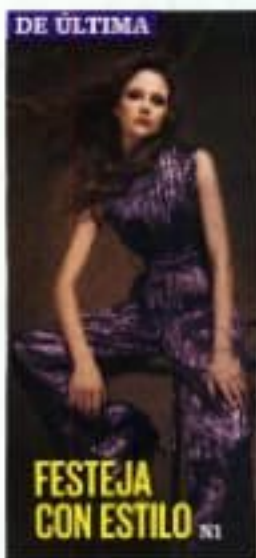
FESTEJA CON ESTILO