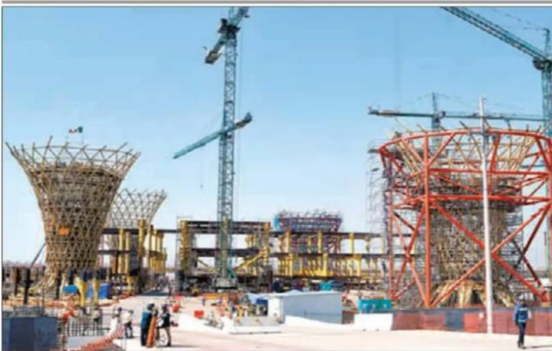
La obra de infraestructura más ambiciosa del sexenio peñista avanza hacia la sepultura.