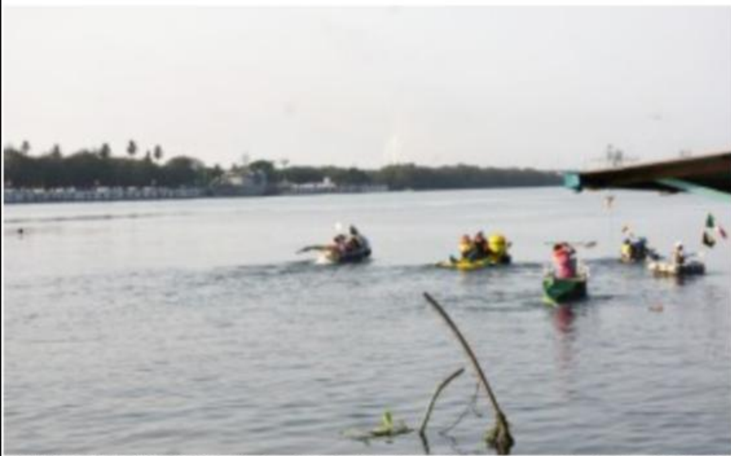
CD. LÁZARO CÁRDENAS, MICH.- Se llevó a cabo la tradicional "Regata" en el marco de los festejos del Día de la Marina Nacional 2019.

Gran asistencia de familias a disfrutar del tradicional evento PÁG. 2