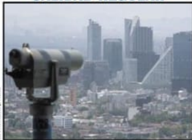
Pese a la lluvia y el viento, persiste la contaminación del aire.