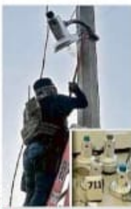
El operativo en Reynosa

Sin embargo, esta mayor proporción en la ocupación de plazas no se ha visto compensada en la nómina, ya que de los 2 mil 656.7 millones de pesos que mensualmente se pagan, ellas se llevan el 47 por ciento y los hombres el 53 por ciento.