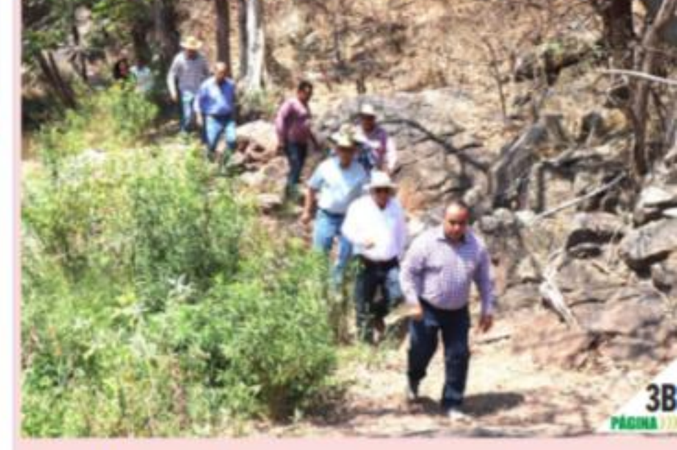
AGUILILLA, MICH.- Existe vigencia para desarrollar el proyecto ejecutivo dirigido a edificar la presa del Ancón.