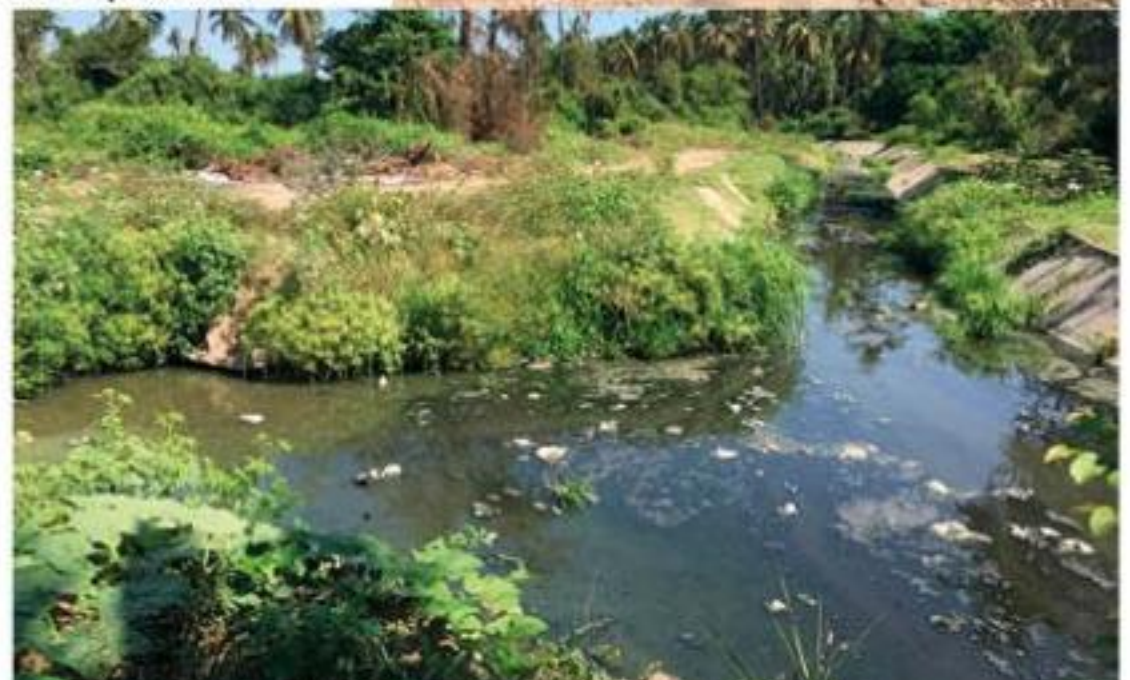
Esta es solo una pequeña muestra de cómo se encuentra el llamado canal "Lucio Cabañas", al estar recibiendo las aguas negras que produce un importante número de habitantes de varias colonias de Guacamayas, y cuyas aguas pestilentes después desembocan en el canal pluvial "Noyola" y de ahí directo a contaminar el río Balsas.