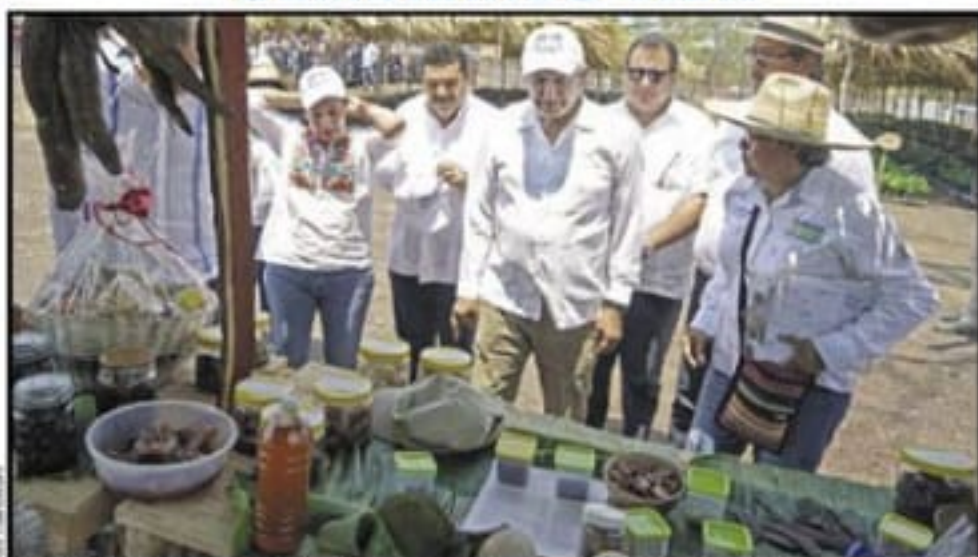
BALANCAN, Tabasco.- Andrés Manuel López Obrador. Apoyo a los trabajadores del campo.