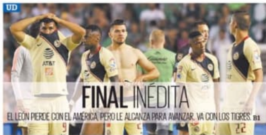
UD EL LEÓN PIERDE CON EL AMÉRICA, PERO LE ALCANZA PARA AVANZAR. VA CON LOS TIGRES. B1

El poeta modernista es recordado en su natal Tepic en el centenario de su muerte. C7