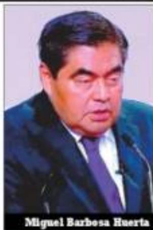
Miguel Barbosa Huerta