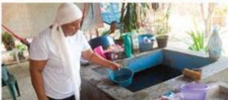
A fin de evitar la reproducción del mosquito transmisor del dengue en los hogares de los habitantes de Playa Azul, personal de la Jurisdicción Sanitaria número 08, les recomendó mantener tapados los sitios de almacenamiento de agua.