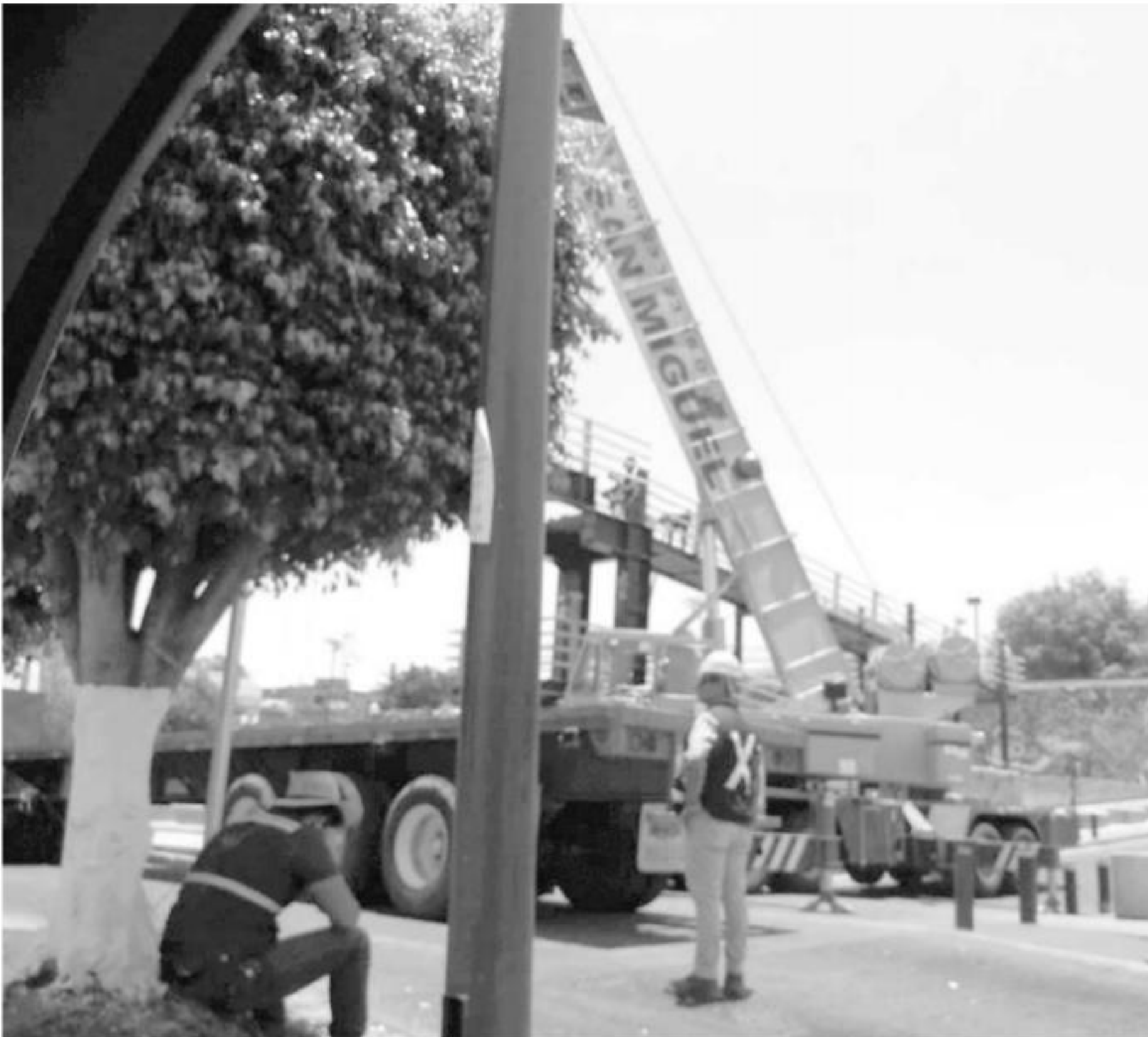
Retiro del puente peatonal de la Avenida Héroes de Nocupétaro.