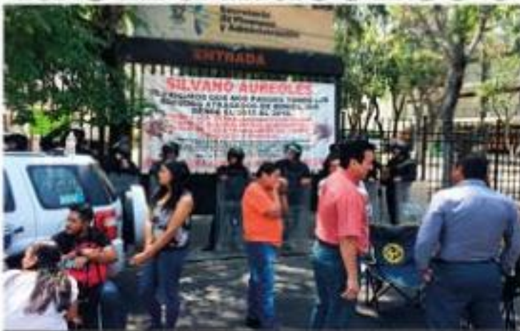
Maestros de la CNTE continuarán exigiendo el cumplimiento de diversos acuerdos, que aseguran, fueron pactados con el gobierno estatal.

De acuerdo a la información proporcionada por la Coordinación General de Gestión de la Sección XVIII del SNTE-CNTE, este lunes en las oficinas centrales de la Secretaría de Educación en el Estado, en Morelia, continuará el pago de salarios a maestros eventuales.