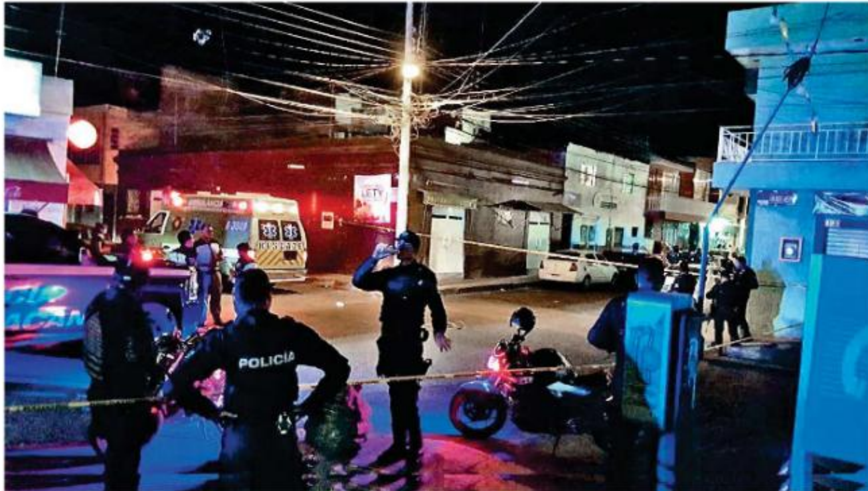
Fueron localizados en el interior de un domicilio ubicado en la calle Galeana del Centro de la ciudad.