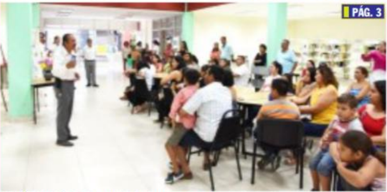
CD. LÁZARO CÁRDENAS, MICH.- Fue inaugurada la exposición pictórica "Pequeños Pintores", la cual consta de 50 piezas elaboradas por alumnos del taller de dibujo y de la Escuela "Asseret".

Inauguran autoridades la exposición Pequeños pintores PÁG. 3