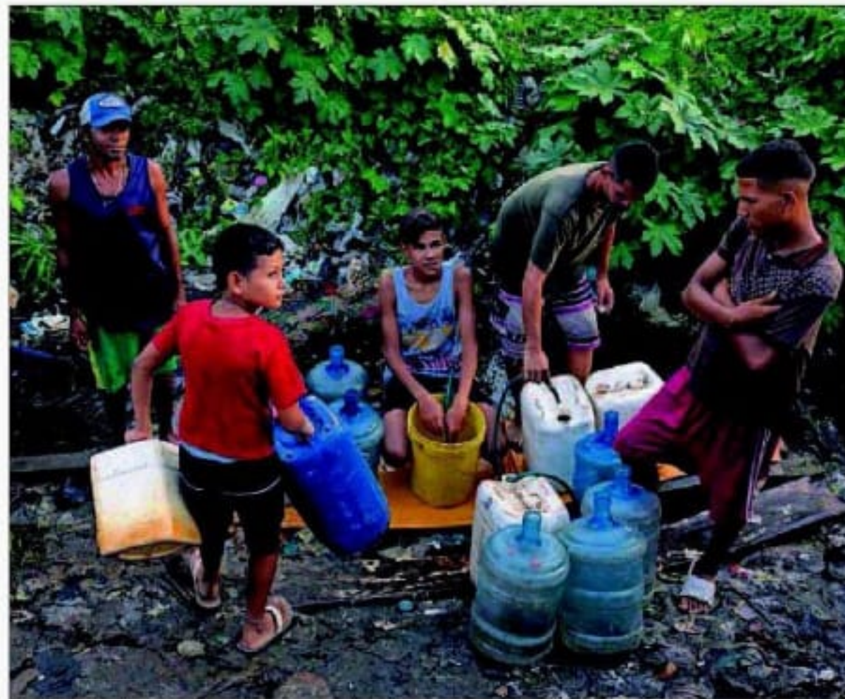
Unos jóvenes llenan contenedores en una toma de agua en un río, el viernes en Maracaibo.

Por eso, 187 países que forman parte del Convenio de Basilea han decidido modificar el tratado para regular la explotación de las basuras plásticas y evitar así que las naciones en desarrollo sigan recibiendo desechos plásticos sin control. La regulación se aplicará a partir de 2021. PÁGINAS 20 Y 21