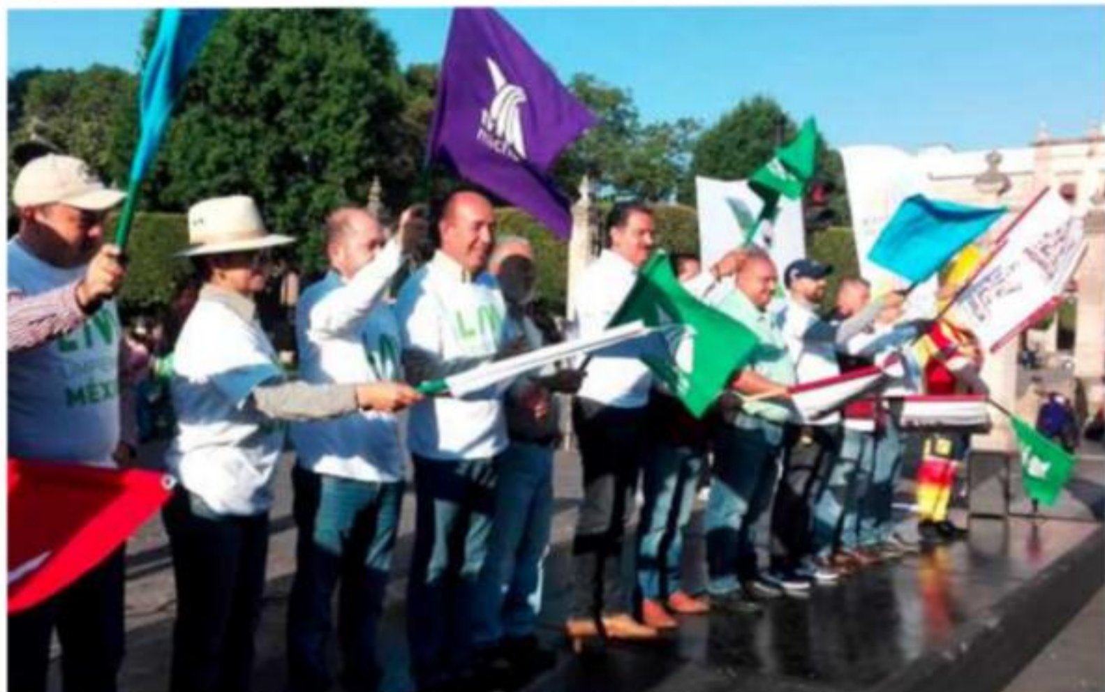
MORELIA, MICH.- Arrancó la décima edición de la campaña Limpiemos México .