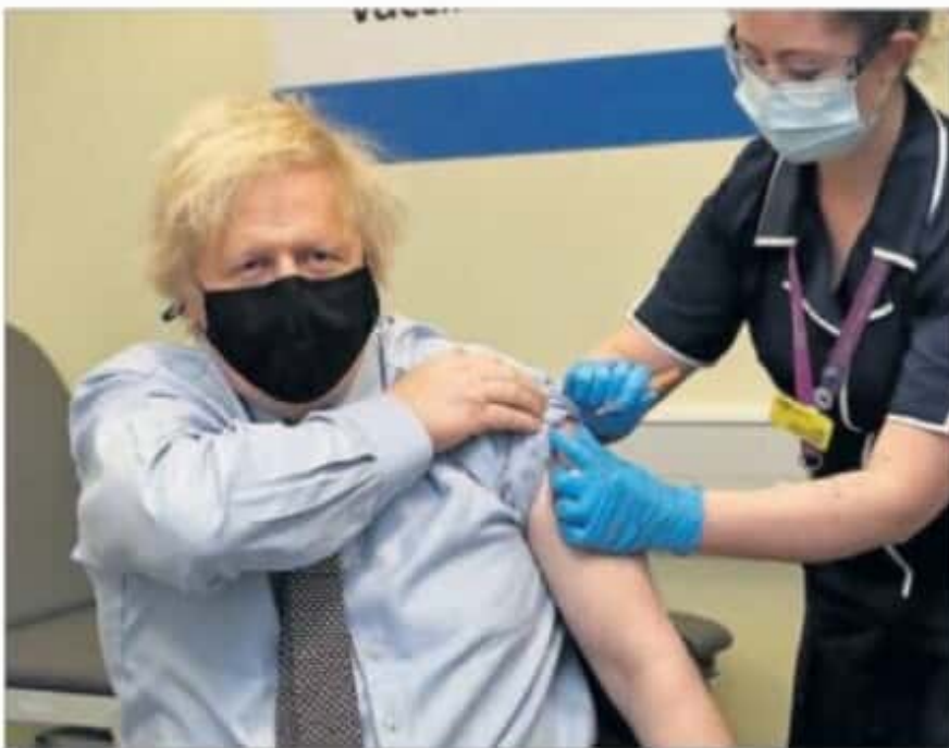
ASTRAZENECA, "BUENA Y RÁPIDA", El primer ministro británico, Boris Johnson, recibió ayer la primera dosis de la vacuna de AstraZeneca. "Muy buena y muy rápida", dijo de la experiencia. Su homólogo francés, Jean Castex, también se vacunó ayer, y el italiano Mario Draghi anunció que lo hará pronto.

con Salvador Illa", ironiza en una entrevista realizada ayer, tras una semana de desertiones en su partido y otros sobresaltos políticos. "La jornada de puertas abiertas del PP a tráfugas es indecente", sentencia. Y asegura que Ciudadanos "jamás" pactará "con los extremos a izquierda y derecha". Página 16