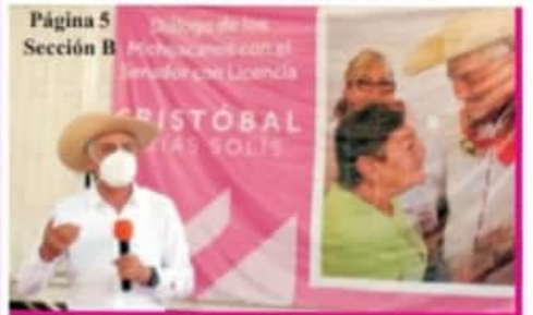
Página 5 Sección B