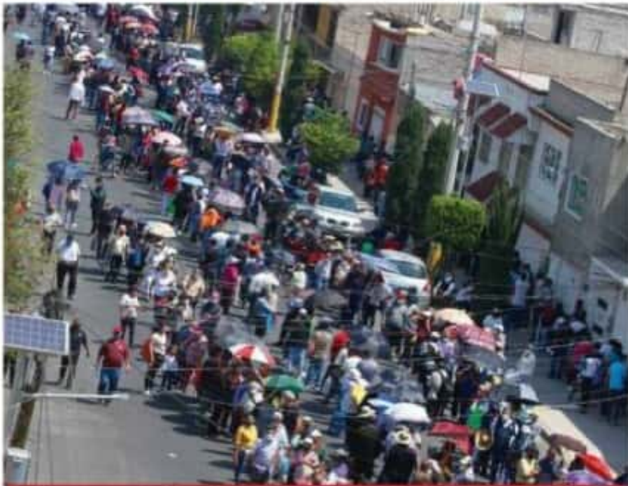
Miles de habitantes mayores de 60 años de Nezahualcóyotl, Estado de México, hicieron filas kilométricas para recibir la primera dosis de la vacuna contra COVID.

Los efectos son generales; considera el juez que puede afectar la competencia y el desarrollo del sector