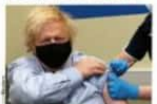
BORIS JOHNSON, ayer, al recibir la vacuna.

• Jefes de Estado dicen sus filias con biológico de AstraZeneca, algunos se vacunan para dar confianza pág. 10