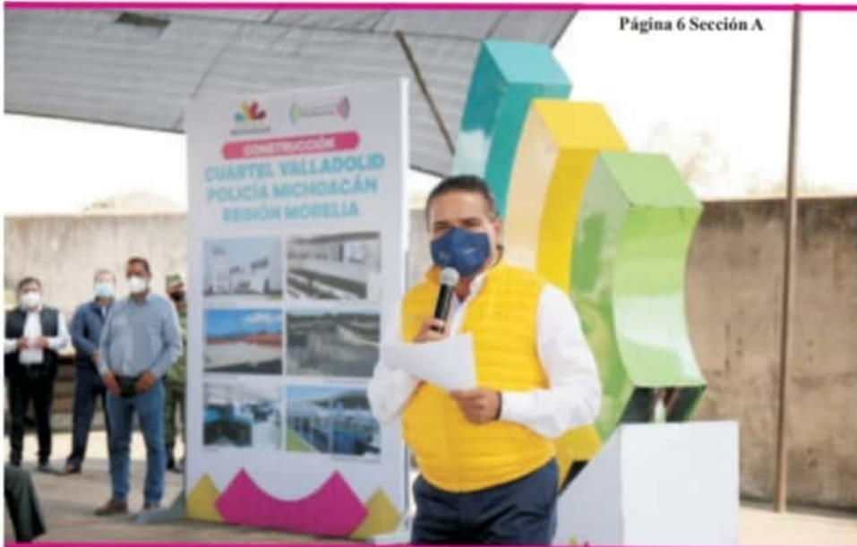
Página 6 Sección A