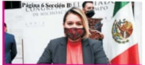
Página 6 Sección B

Organizará Congreso del Estado actividad para conmemorar el día mundial del Síndrome de Down