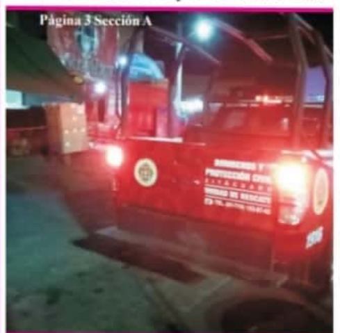
Página 3 Sección A

Protección Civil Municipal realiza recorridos de daños por el sismo de 5.9