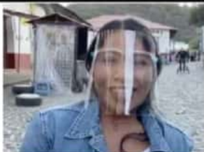
Pueblo Mágico de Tlalpujahuada bienvenida a Yalitza Aparicio 7