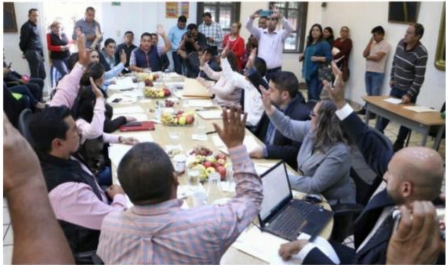
URUAPAN, MICH.- El ayuntamiento aprobó ayer en sesión extraordinaria de Cabildo, adelgazar el aparato burocrático para enfrentar los recortes a los presupuestos del año entrante.