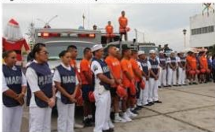
Personal de la Décima Zona Naval que participa en la Operación Salvavidas Invierno 2019 en esta región de Michoacán.