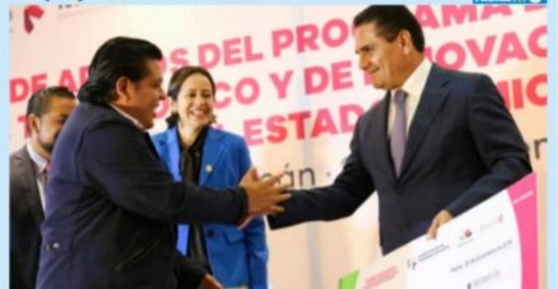
MORELIA, MICH.- Al entregar ayer recursos provenientes de multas electorales para destinarlos a proyectos de ciencia y tecnología, el gobernador, Silvano Aureoles Conejo aseguró que Michoacán ha dejado de ser un estado pobre.