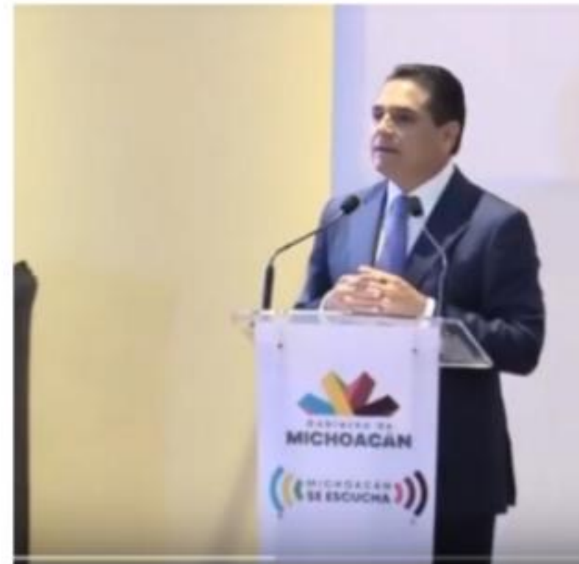
MORELIA, MICH.- El gobernador del estado, Silvano Aureoles Conejo, expresó que Michoacán cerrará el año con 1 por ciento de crecimiento económico, y que con esto ha salido de la lista de los estados categorizados como pobres.

De este modo, fue como ayer en Casa de Gobierno se hizo entrega de los Recursos de las Multas Electorales por un valor de 9 millones de pesos a 70 investigaciones científicas dentro del Programa de Fortalecimiento Científico, Tecnológico y de Innovación con Pertinencia