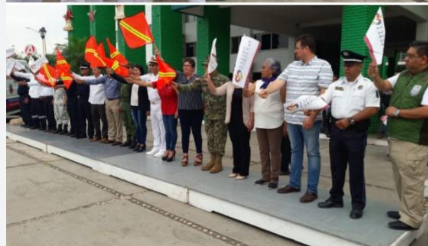
CD. LÁZARO CÁRDENAS, MICH.- Ayer, en la explanada municipal arrancó el Operativo Vacacional - Diciembre 2019, mientras que la Semar dio el banderazo a la "Operación Salvavidas, Invierno 2019", todo con la intención de salvaguardar la vida de visitantes y locales durante el último periodo de asueto del año.

En el acto, se reinauguró la oficina de Gestión Social del palacio municipal