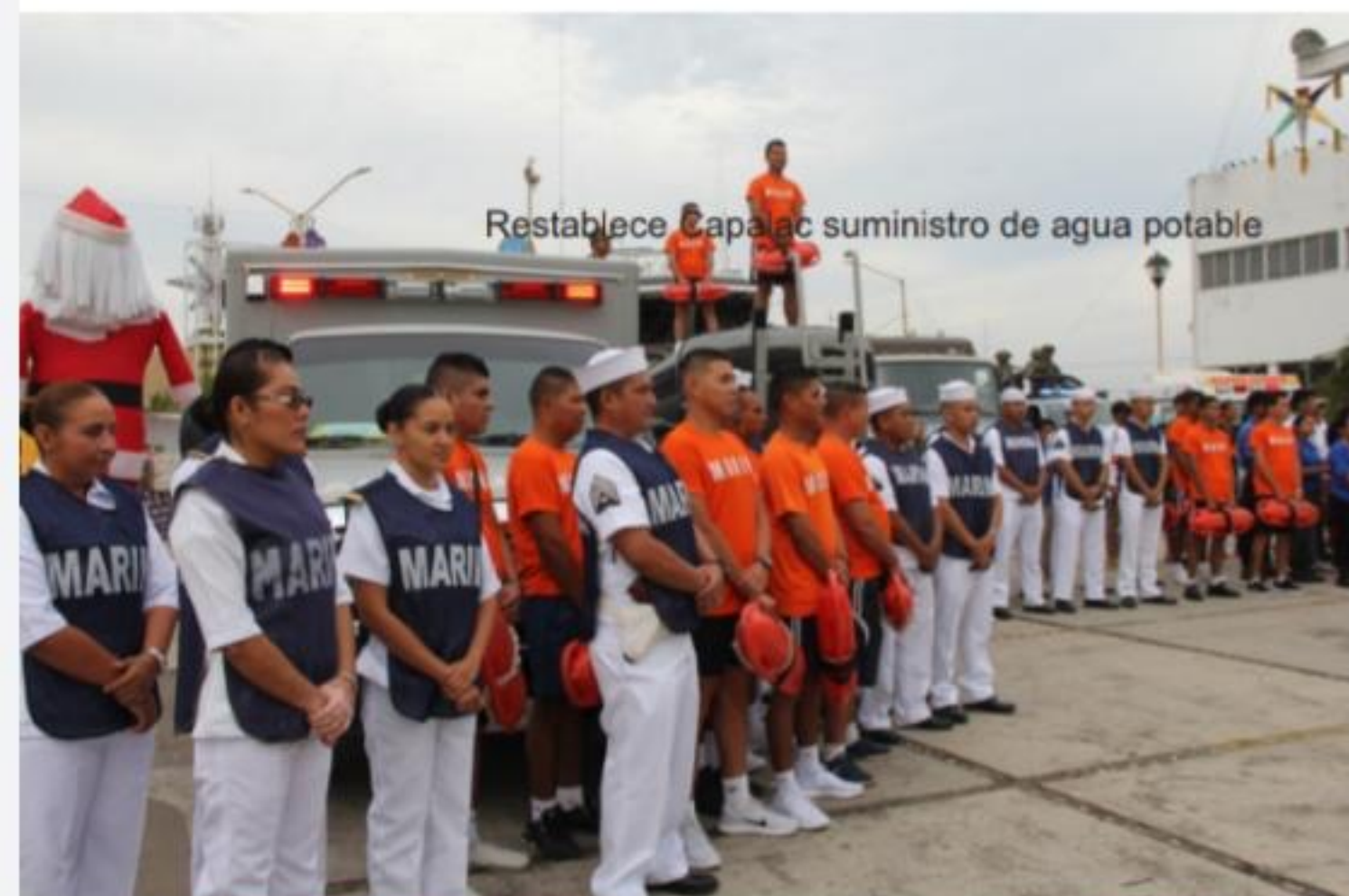
Restablece Capalac suministro de agua potable