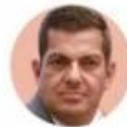
Ricardo Peralta Subsecretario de Gobernación

El subsecretario de Segob rechaza que este Gobierno genere conflictos; asegura a La Razón que cada hora resuelven un problema de administraciones pasadas como los del SME, ferrocarrileros...; en 6 meses, mil 800 atenciones pág. 3