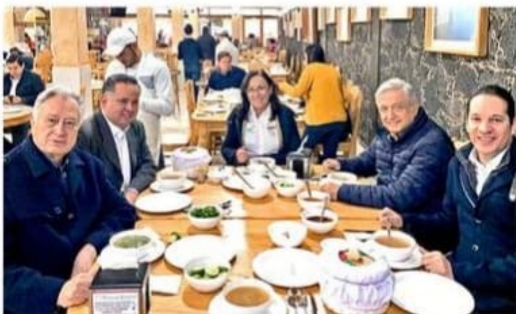
APAPACHO Y BARBACOA. Por la mañana, el Presidente López Obrador en conferencia dijo que apoya a Bartlett porque con sus acciones defiende al pueblo. Luego, en gira de trabajo, el Mandatario comió y se fotografió con el director de la CFE, además de los titulares de Energía, Roció Nahle y de la UIF, Santiago Nieto y del Gobernador de Querétaro, Francisco Domínguez.