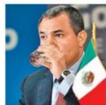
Al banquillo.

REDACCIÓN, CIUDAD DE MÉXICO Los fiscales de Nueva York dicen contar con evidencia en fotos, audio y video para procesar a Genaro García Luna. PÁG. 10