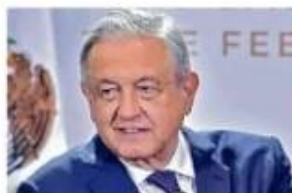
Andrés Manuel López Obrador Presidente de México