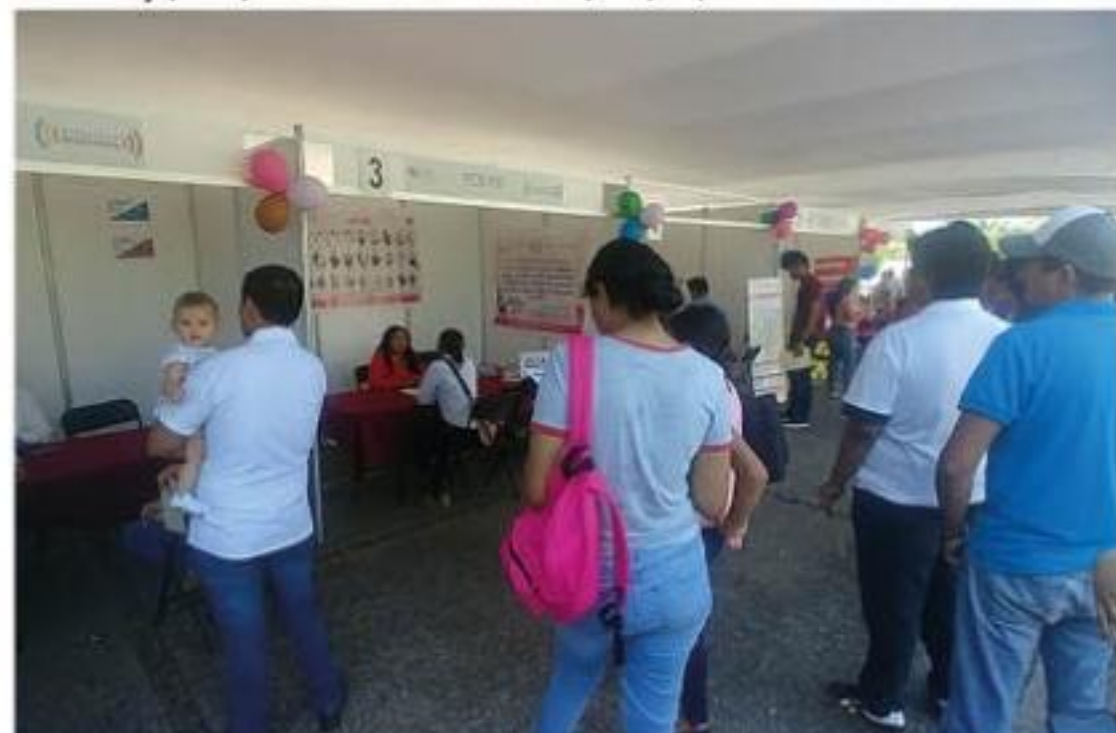
Durante la primera Feria del Empleo que se realizó ayer en la explanada del palacio municipal, 11 empresas ofertaron 250 empleos.