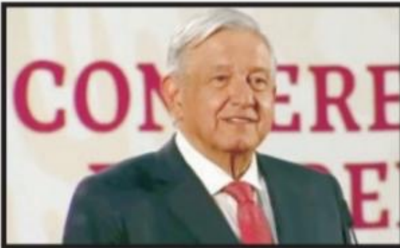
Coincide AMLO en reunión con gobernadores para atender feminicidios Página 5 Sección B