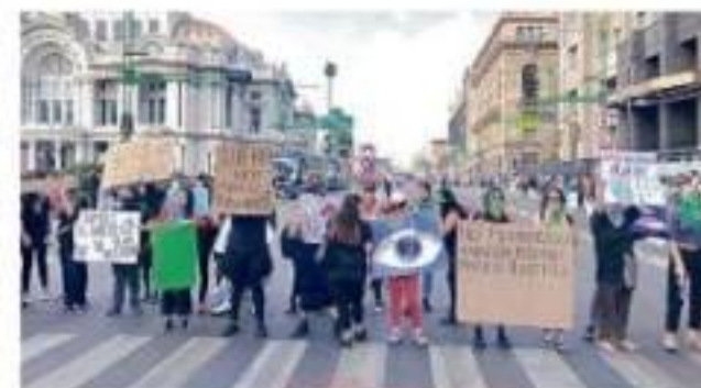
En diferentes puntos de la Ciudad, feministas se manifestaron por la igualdad de género con miras al paro del 9 de marzo.