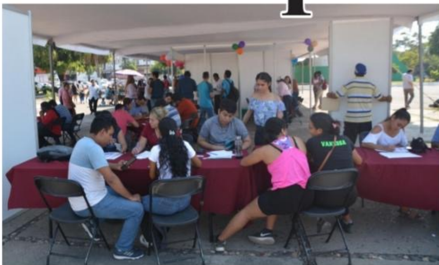
CD. LÁZARO CÁRDENAS, MICH.- Este viernes tuvo lugar la Feria del Empleo, en la cual cientos de personas se acercaron para poder ver una opcional laboral que se ajuste a sus necesidades y tiempos.

Anuncia alcaldesa entrega de obras en El Habillal PÁG. 3