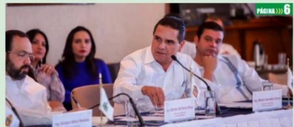
LA PAZ, BCS.- A iniciativa de Silvano Aureoles, coordinador de la Comisión de Seguridad y Justicia de la Conago, las reuniones regionales iniciarán en Tamaulipas el próximo 28 de febrero. PÁGINA >>> 6

► Llama SAC a aprovechar compromiso de estados y federación para enfrentar los retos de seguridad en México