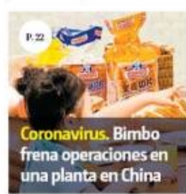
Coronavirus. Bimbo frena operaciones en una planta en China