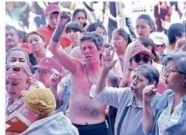
Por segundo día consecutivo mujeres protestaron por la suspensión de recursos para el tratamiento del cáncer de mama.