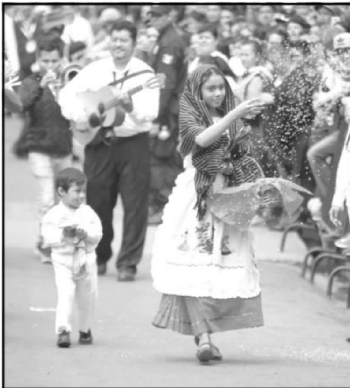
Inaugura Gobernador la 54 Feria Nacional del Cobre y el 74 Concurso de Cobre Martillado

«Estoy contento de estar aquí, quiero expresar mi reconocimiento a los ar-