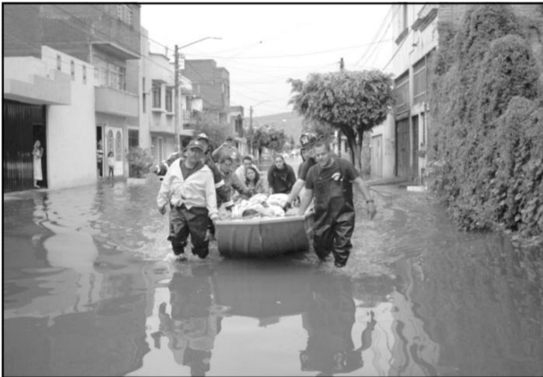
Personal de la Policía Morelia, de Protección Civil y Bomberos Municipales mantienen cierre de la circulación en Poliducto y realizan tareas de rescate de personas en zonas afectadas por las intensas lluvias.

Grupo armado asesina a mujer activista indígena