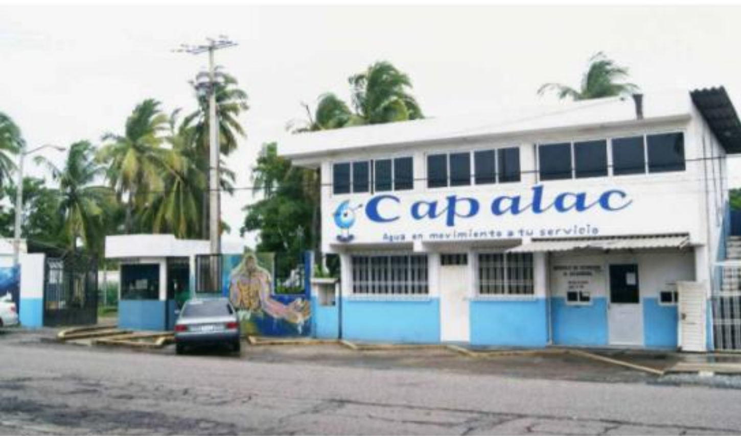
D. LÁZARO CÁRDENAS, MICH.- Por diversas circunstancias que van desde "bajos voltajes" hasta falta de rehabilitación de pozos, son constantes las dificultades del organismo operador para llevar agua de manera regular a todos los sectores.