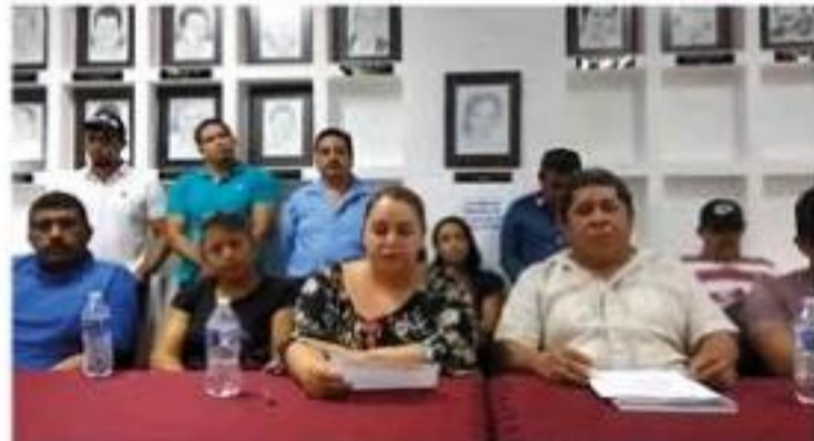
Maestros afiliados a la coordinación regional de la CNTE durante la conferencia de prensa en la sala de cabildo del ayuntamiento porteño.