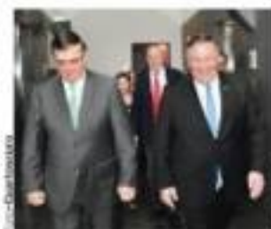
MARCELO EBRARD y Mike Pompeo, ayer.