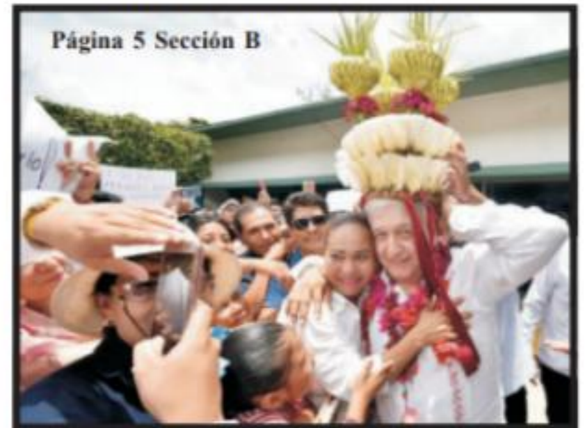
Página 5 Sección B