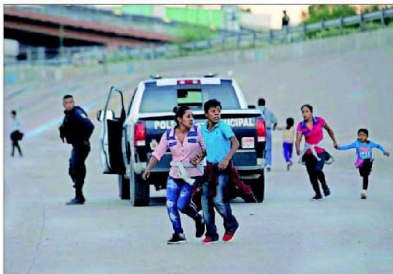
Varios migrantes intentan escapar de una patrulla policial, el sábado en Ciudad Juárez.