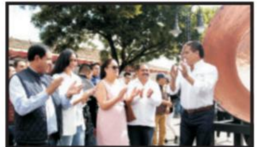
Página 7 Sección B