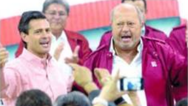
Peña Nieto y Romero Deschamps P. 8

Pemex entregó a sindicato petrolero 353 mdp meses antes de la salida de EPN