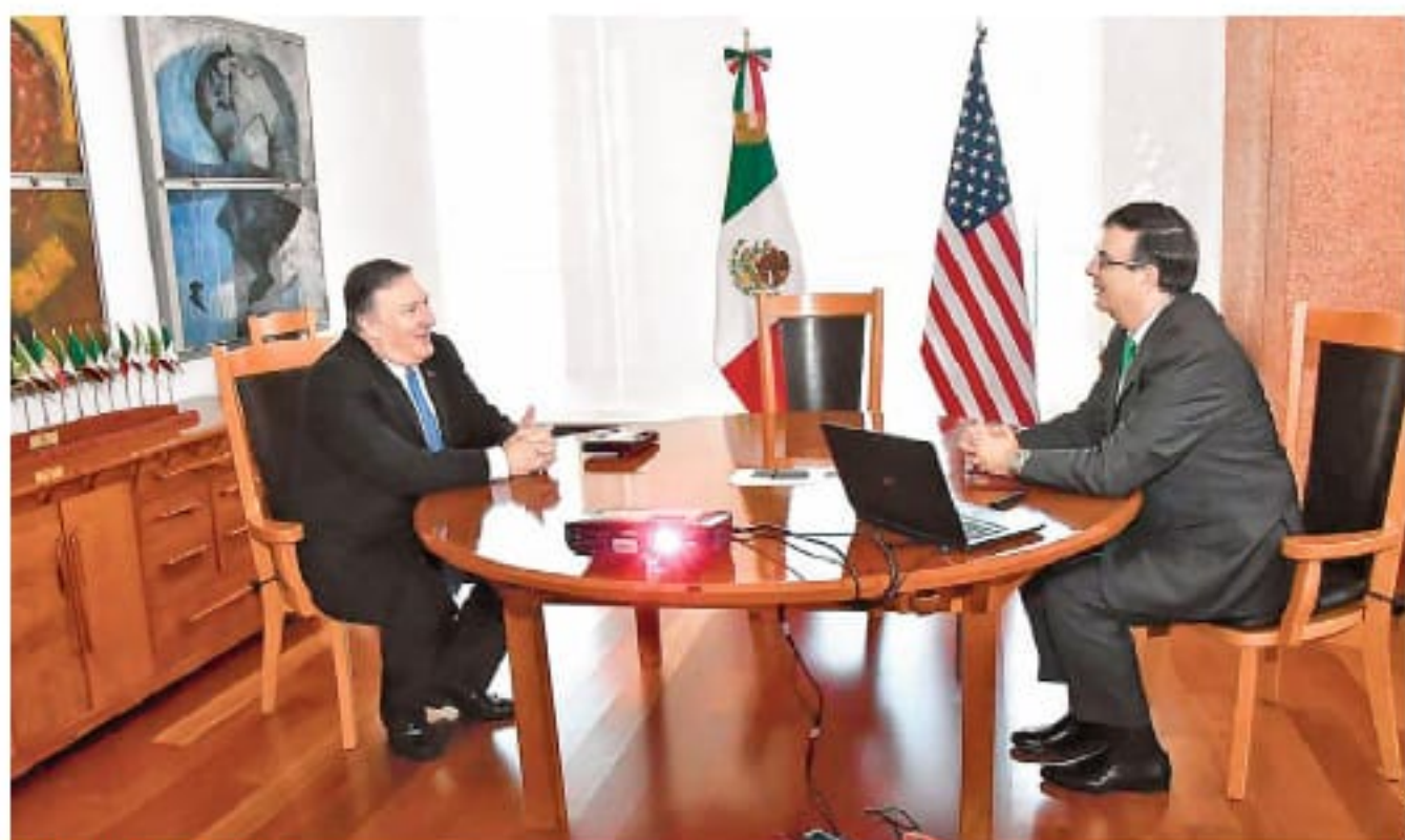
RESULTADO POSITIVO. El secretario de Estado de Estados Unidos y el canciller mexicano, en un encuentro cordial que duró una hora.