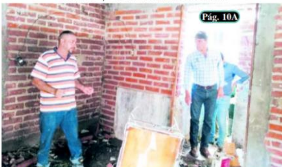
JIQUILPAN, MICH.- El gobernador Silvano Aureoles Conejo recorrió las zonas que resultaron dañadas por las intensas lluvias que se registraron en este municipio y señaló a los habitantes «no los dejaremos solos».