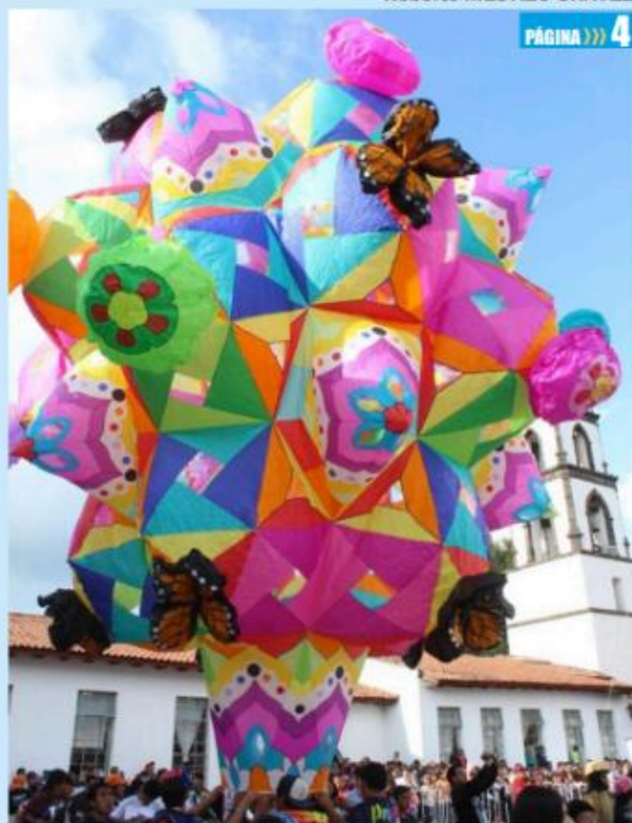
PARACHO, MICH.- La capital mundial de las guitarras está preparada para recibir el próximo fin de semana a miles de visitantes que acudirán a disfrutar del Festival de Globos de Cantoya, del 26 al 28 de julio.

Colapsa vivienda; inundaciones en varias colonias