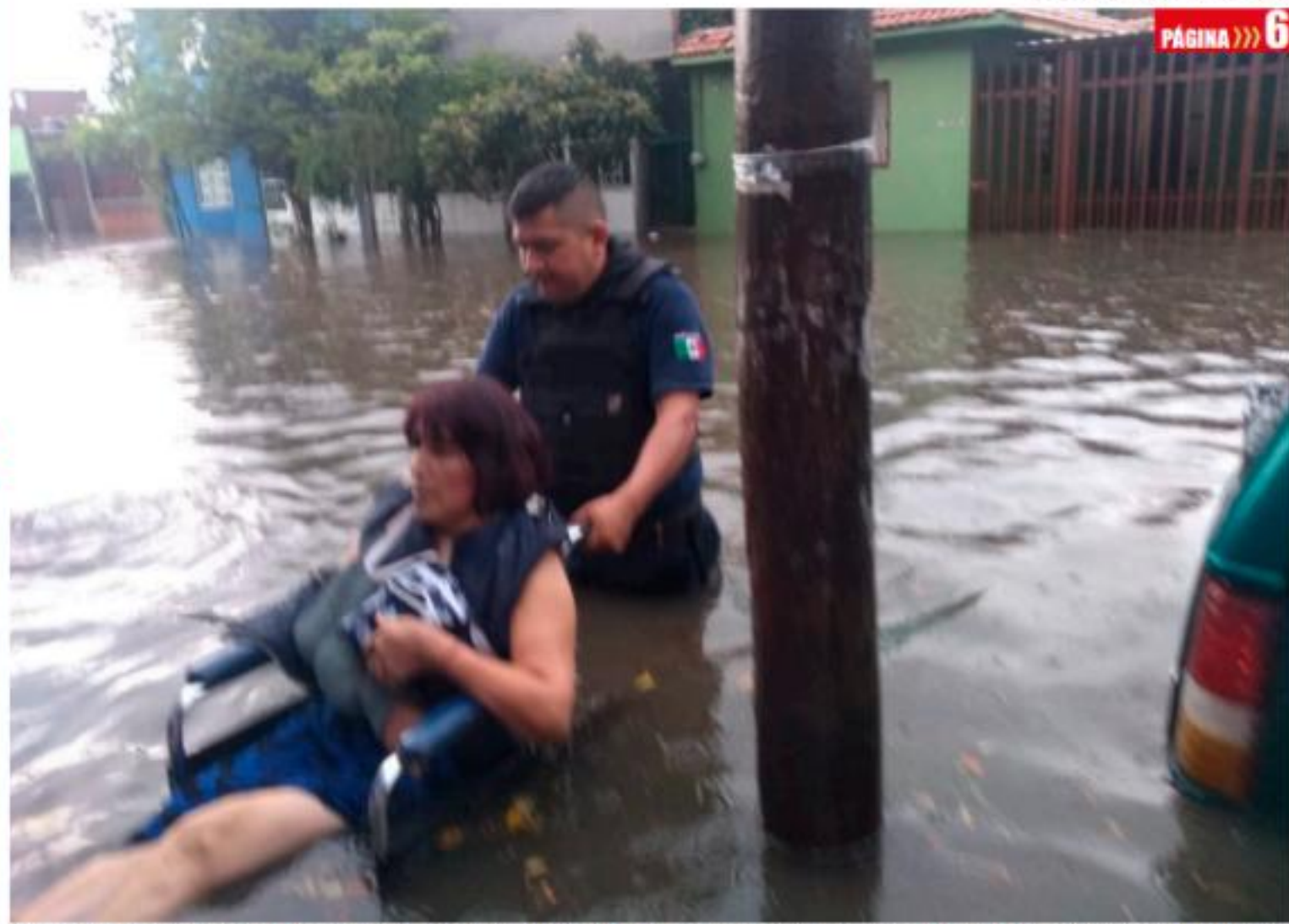
MORELIA, MICH.- Nuevamente la capital del estado resintió la fuerza de la naturaleza, cuando este domingo una fuerte tromba azotó esta ciudad, ocasionando inundaciones en decenas de colonias.