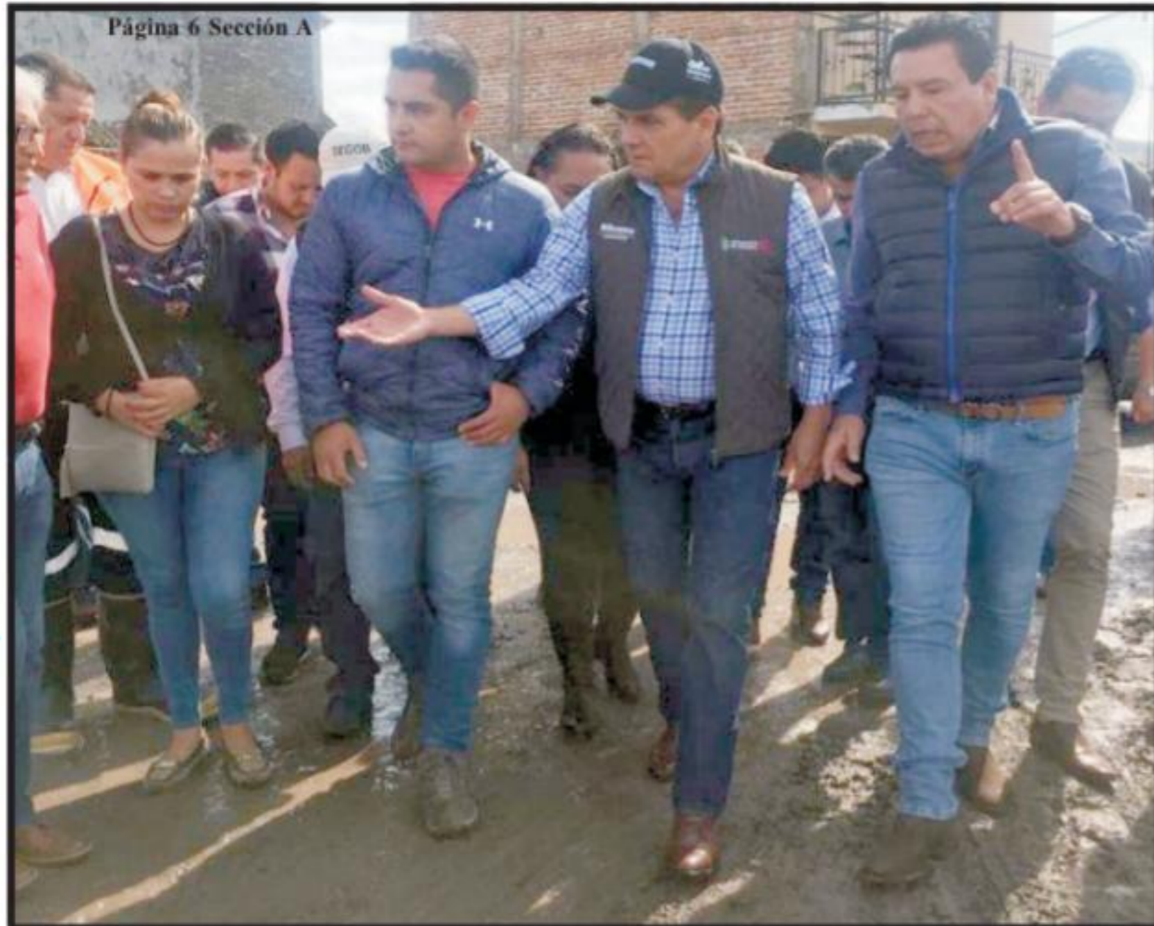
Página 6 Sección A