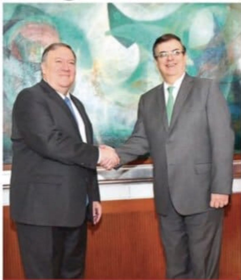
El secretario de Estado de EE, Michael R. Pompeo, y el canciller mexicano, Marcelo Ebrard, se reunieron ayer para revisar, entre otros, el tema migratorio.

Función Pública y SHCP documentan obras inexistentes, sobrepeso, gastos ajenos a los autorizados y falta de reportes de ejecución