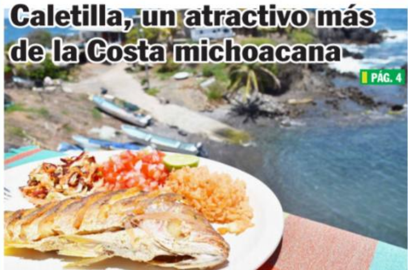
CD. LÁZARO CÁRDENAS, MICH.- La Costa michoacana cuenta con grandes atractivos, siendo uno de ellos la comunidad de Caletilla.