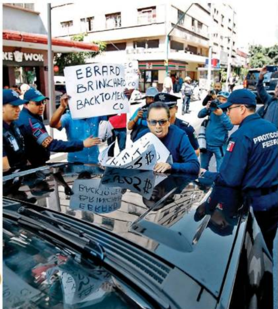
Protesta encabezada por supuesto abogado del capo se plantó ante la comitiva estadounidense. A. PÉREZ

Estancias infantiles Ministro de la 4T, a cargo de proyecto para fallo de fondo JOSÉ ANTONIO BELMONT - PÁG. 12