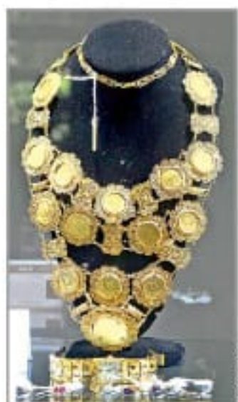
EXHIBEN RIQUEZA. Visitantes de Los Pinos que vieron las joyas que serán subastadas el 28 de julio próximo apoyan que los recursos se destinen a los pobres P. 5

Desde noviembre, la empresa no revela en su portal la información acerca del robo de combustibles a nivel nacional; además, esconde detalles sobre el donativo a Tabasco realizado en abril de este año NEGOCIOS P. 17