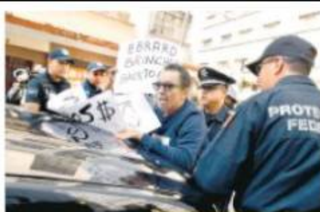
LA JERBA LOMBERA

Mientras un grupo exige la extradición del narco mexicano en Relaciones Exteriores, el secretario de Estado de EU, Mike Pompeo, reconoció significativos avances para frenar a migrantes. Pág. 4