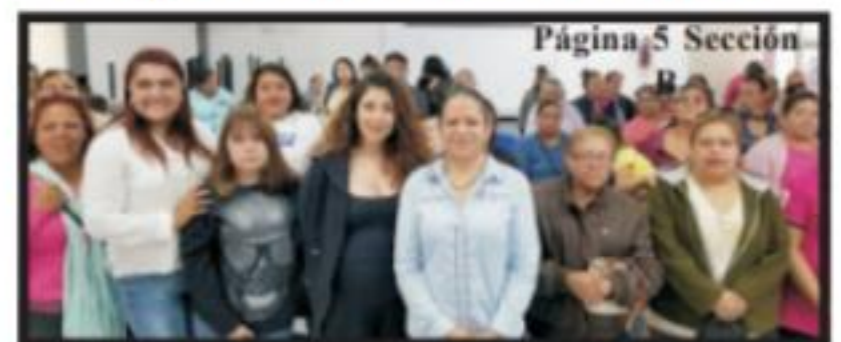
Página 5 Sección B