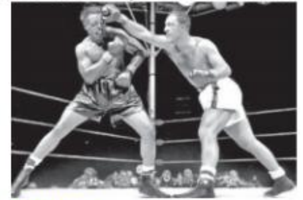
Archie Moore se enfrenta a Rocky Marciano, el 21 de septiembre de 1955. Especial

MANNY PACQUIAO conquistó a sus 40 años el título como supercampeón mundial de peso welter de la WBA, al derrotar al estadounidense Keith Thurman; se une al club de boxeadores que han logrado coronarse a una edad madura, el cual lidera Bernard Hopkins, quien a los 49 años, fue Rey de los semipesados en 2014. Págs. 28-29