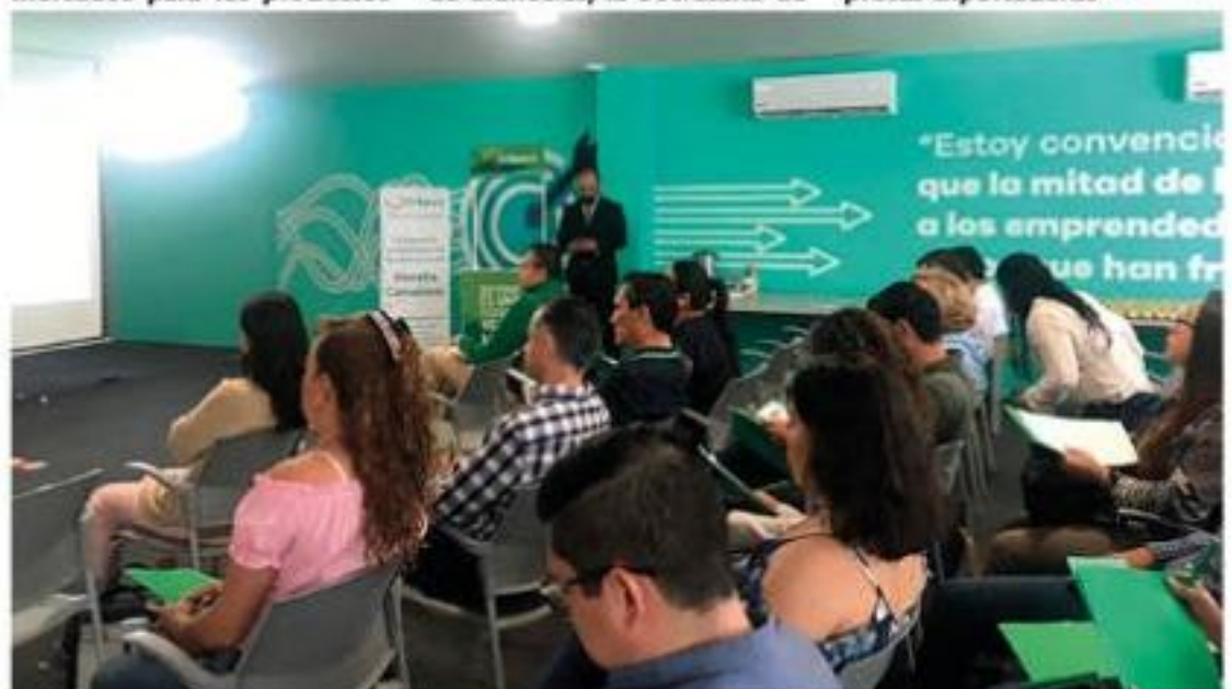
La Sedeco realizó conferencias dirigidas a 46 empresas exportadoras de Morelia, Uruapan, Zamora y Zitácuaro.