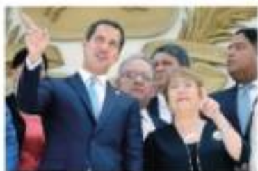
JUAN GUAIDÓ y Michelle Bachelet, ayer.

Bachelet deja en Venezuela a observadores y llamado al diálogo