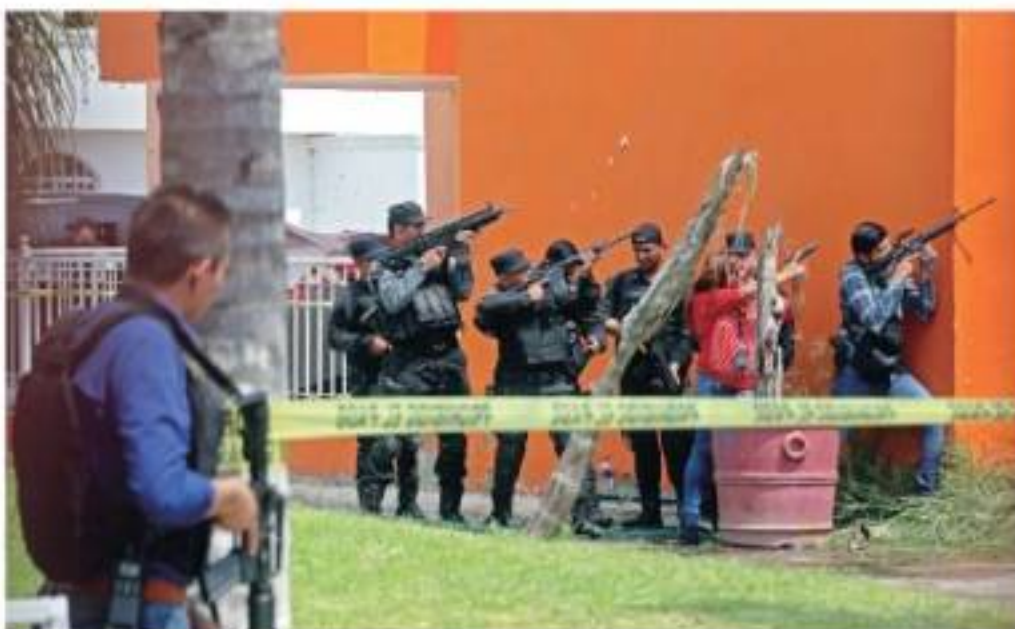
EN TLAJOMULCO policías y soldados repelieron una agresión en un fraccionamiento, ayer.

Tres ataques a agentes de Fiscalía de Jalisco; ahí, crecen homicidios