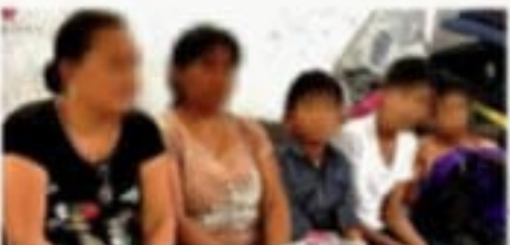
Los centroamericanos vendieron casas, terrenos o cosechas para poder viajar a EU. Hoy están en Mexicali.

Hasta el momento, los retornos de migrantes se hacen a través de las cruces fronterizas de Mexicali y Tijuana, Baja California, así como Ciudad Juárez, Chihuahua.