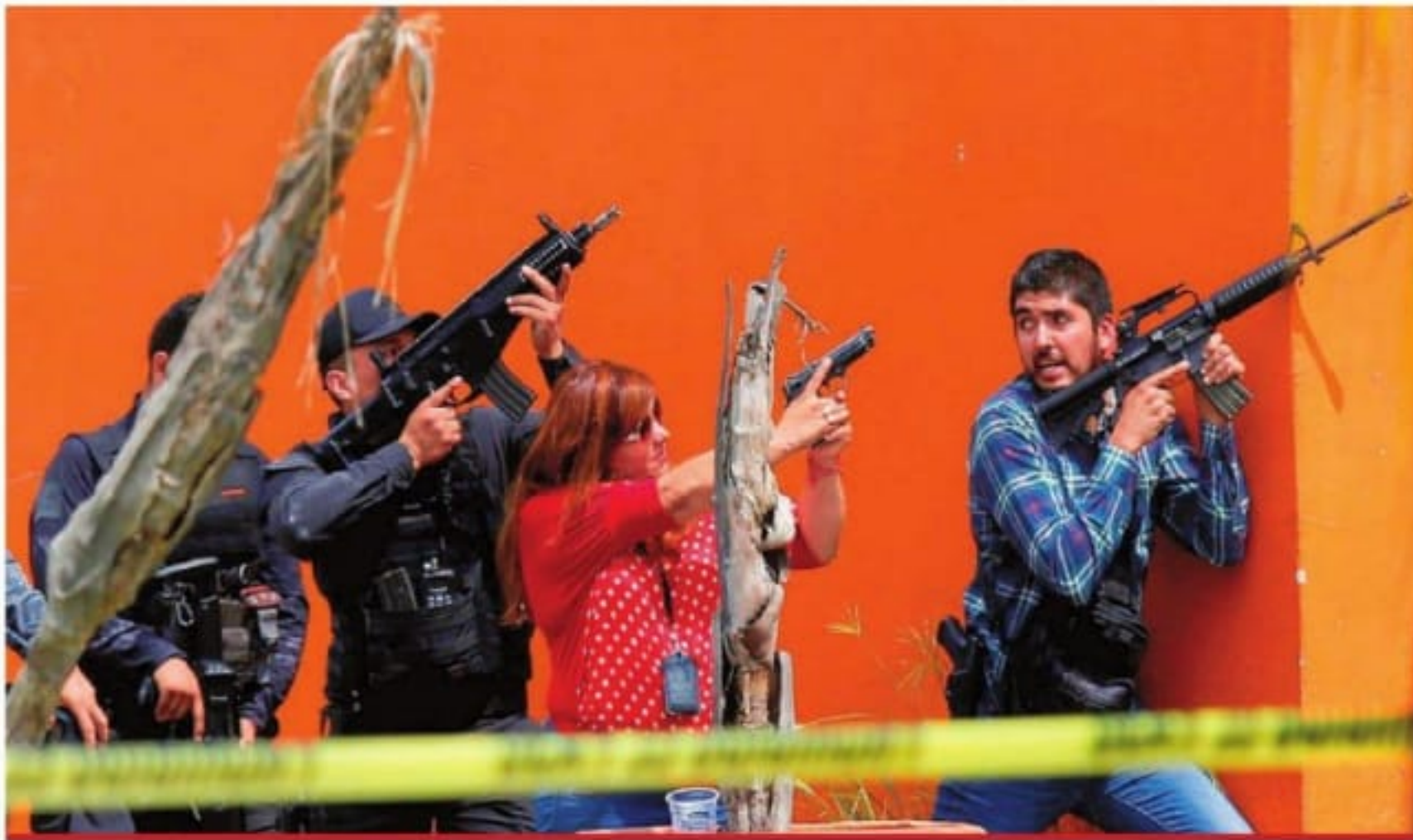
Miembros de fuerzas federales se enfrentaron a un grupo armado en el fraccionamiento Jardines del Edén, en el municipio de Tlajmulco, Jalisco.