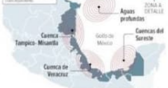
Infografía: Jesús Sánchez

Las áreas cubren 21 millones 400 kilómetros cuadrados, hasta por ahora se han explorado 10 mil 400 millones de barriles de crudo equivalente.