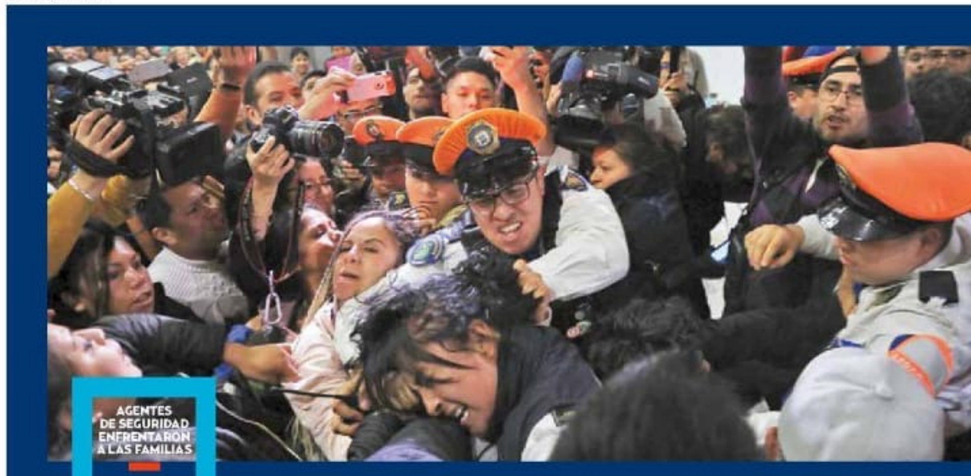
AGENTES DE SEGURIDAD ENFRENTARON A LAS FAMILIAS