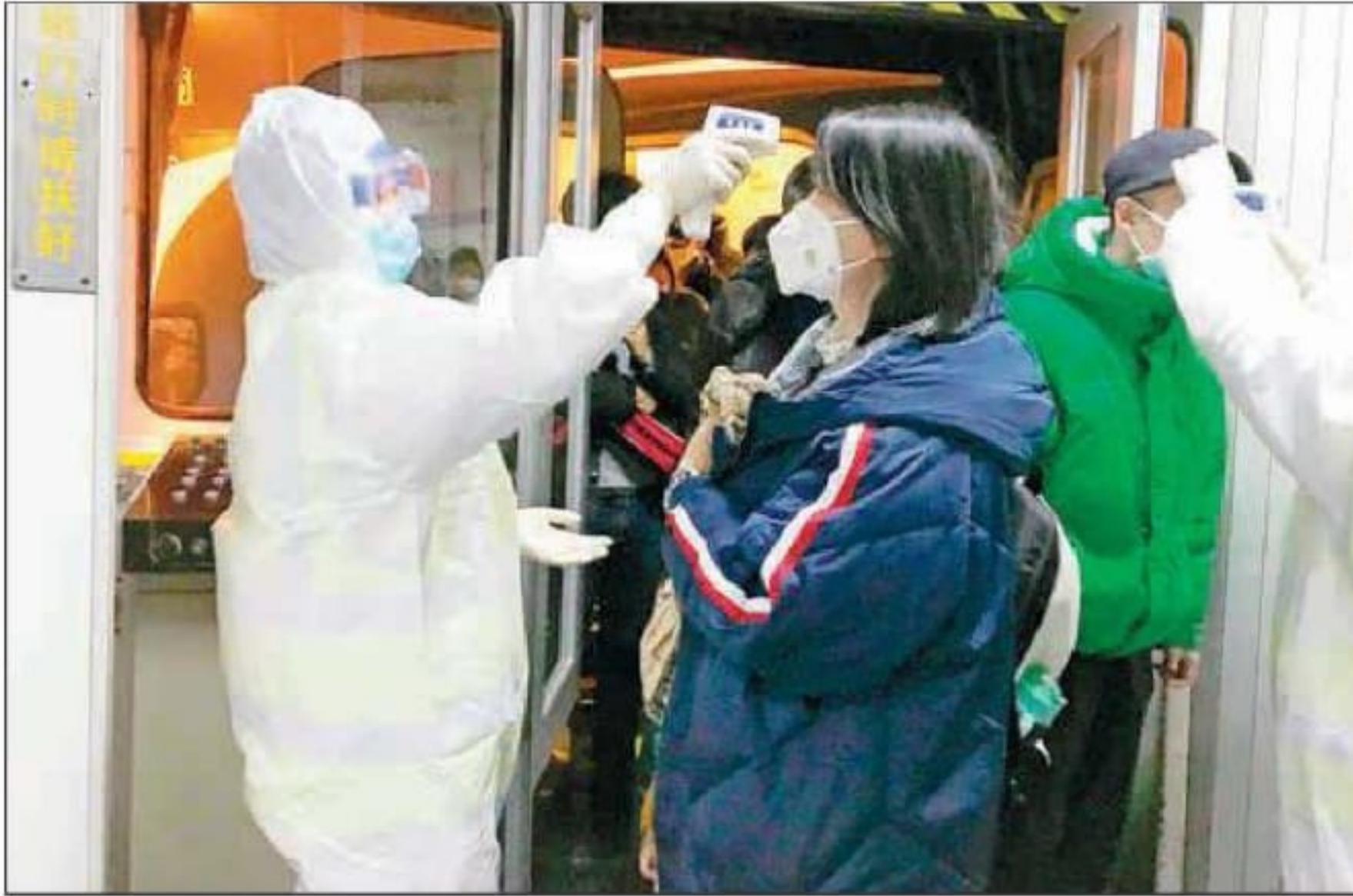
▲ Equipos médicos fueron desplegados en el aeropuerto de Pekín para revisar a pasajeros ante la propagación del coronavirus. Unas 5 mil personas están en observación ante la misteriosa enfermedad,