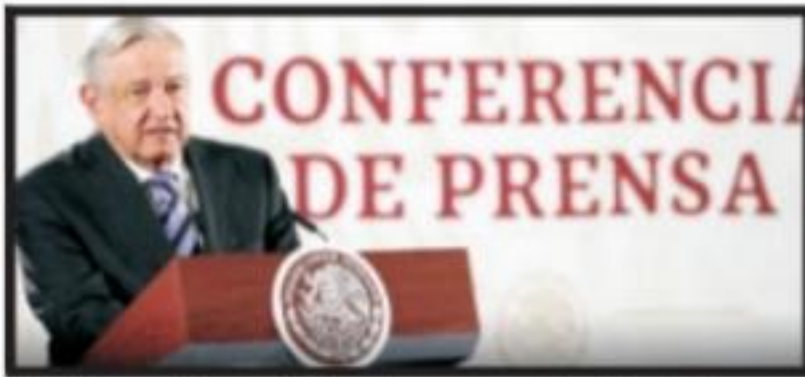
Celebra López Obrador apreciación del peso Página 5 Sección B