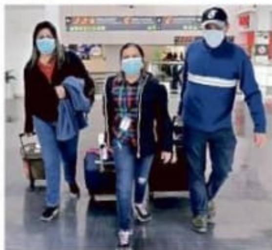
Passajeros utilizaron cubrebocas en el AICM, ante la alerta emitida por Salud por el coronavirus.