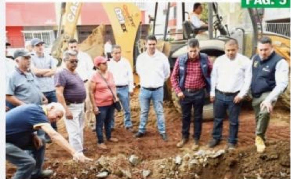
URUAPAN, MICH.- En visita de trabajo en esta ciudad, el titular de la Comisión Estatal de Aguas y Gestión de Cuencas, Germán Tena Fernández, indicó que este año nuestro municipio tendrá para obra hidráulica un presupuesto del doble al que manejó en el 2019.