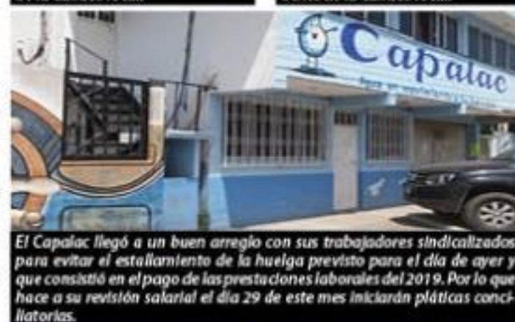
El Capalac llegó a un buen arreglo con sus trabajadores sindicalizados para evitar el estallamiento de la huelga previsto para el día de ayer y que consistió en el pago de las prestaciones laborales del 2019. Por lo que hace a su revisión salarial el día 29 de este mes iniciarán pláticas conciliatorias.