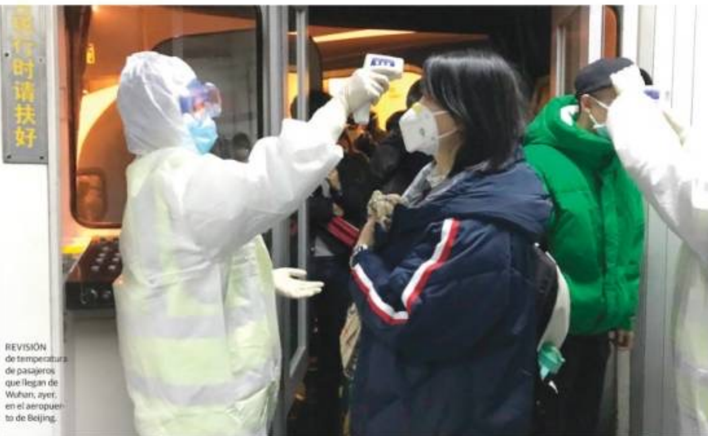
REVISIÓN de temperatura de pasajeros que llegan de Wuhan; ayer, en el aeropuerto de Beijing.

VIGILAN caso sospechoso en Tamaulipas, NL y BC ponen revisión en aeropuertos; inspeccionan cruceros