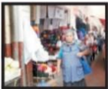
Preocupados pequeños comercios ante nuevas medidas del Servicio de Administración Tributaria Página 2 Sección A