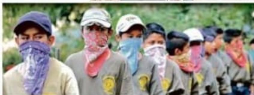
Los menores hicieron ejercicios de posiciones de disparo y luego marcharon sobre la carretera.