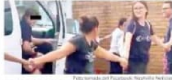
Vecinos de Nashville hicieron una valla para proteger al migrante.

- News Egiptus y agencia PRIMERA | PÁGINAS 12 Y 13