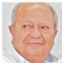
Carlos Romero Deschamps

REFORMA publicó ayer que la FGR tiene dos investigaciones por lavado de dinero y enriquecimiento ilícito contra Romero Deschamps, derivado de igual número de