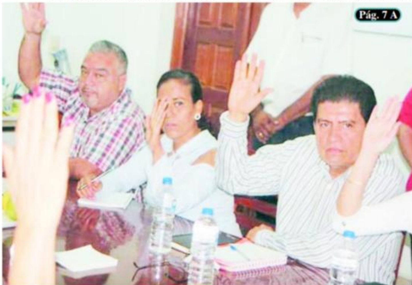
Pág. 7 A

□ Aprobaron Regidores en pasada Sesión de Cabildo, se trata de 2 hectáreas