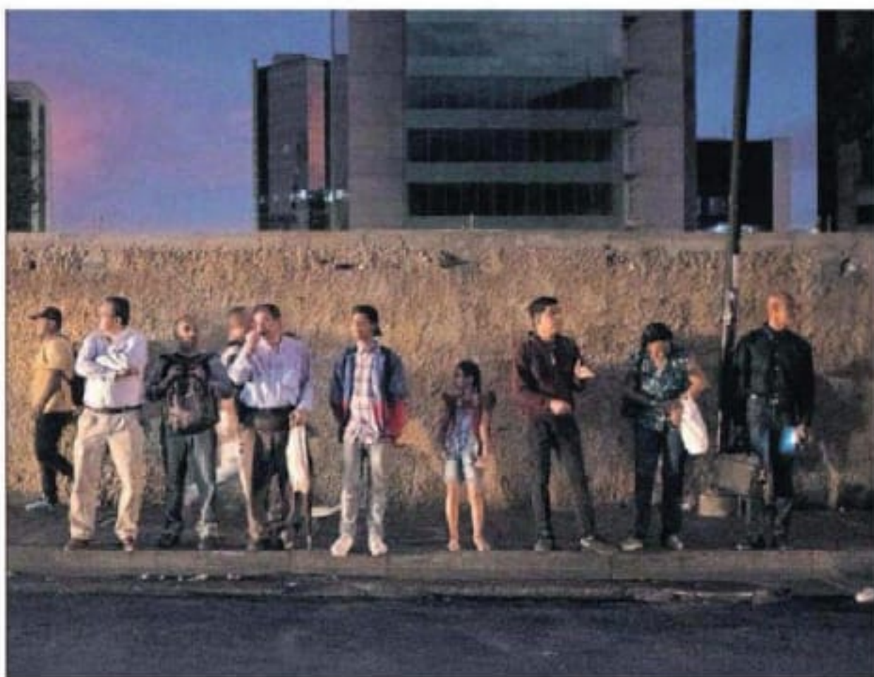
Varias personas esperan el lunes el autobús en Chacaíto (Caracas) durante el apagón.

El enésimo fallo eléctrico colapsa la capital venezolana mientras los vecinos buscan la forma de regresar a sus hogares