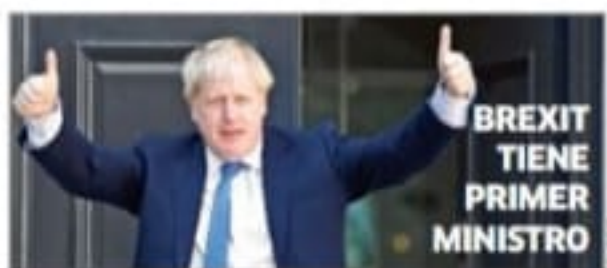
Arrasa Boris Johnson: nuevo líder de los conservadores y del Reino Unido MUNDO P. 13

Tras la creación de una nueva Junta de Coordinación Política que fue impugnada, los legisladores bajacalifornianos avalaron la reforma que amplía de dos a cinco años el gobierno del morenista millonario Jaime Bonilla MÉXICO P. 6