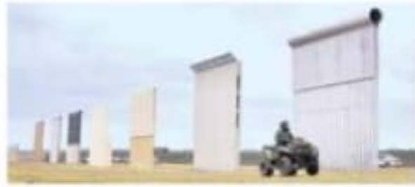
La CBP construyó prototipos del muro que luego fueron destruidos.