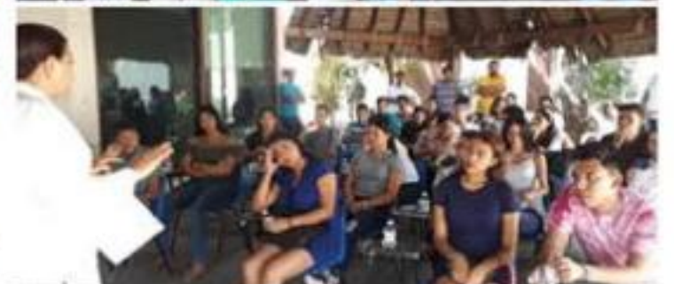
Silvia Estrada Esquivel, Jefa de Gobierno en esta región, señaló que se deben seguir buscando condiciones de desarrollo para los jóvenes.