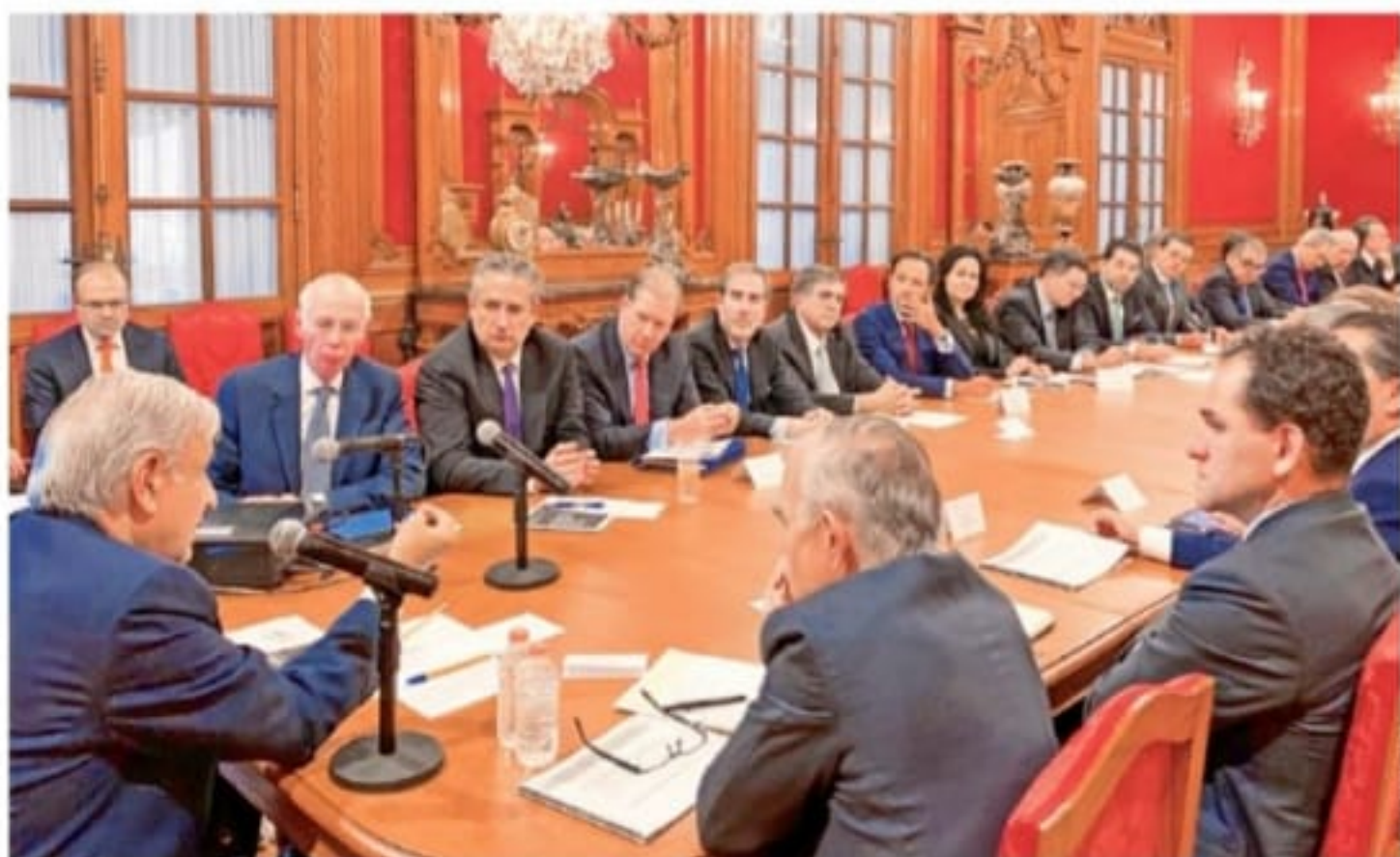
VIVIENDA. La banca promoverá un acuerdo para fomentar el crédito hipotecario en cofinanciamiento con el Infonavit.