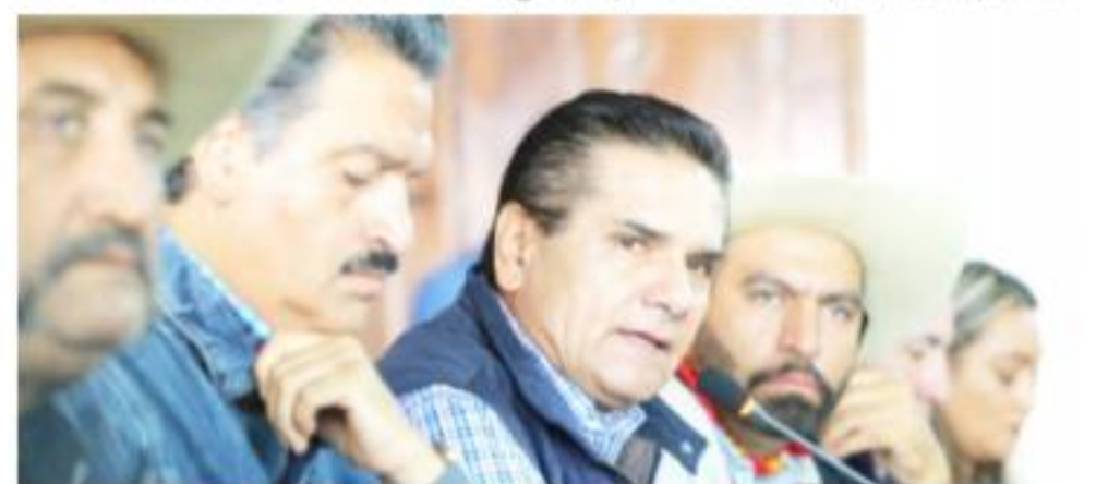
MORELIA, MICH.- El gobernador de Michoacán, Silvano Aureoles Conejo, se reunió con jefes de tenencia, ejidatarios y autoridades auxiliares de las localidades de la zona sur de la capital michoacana.