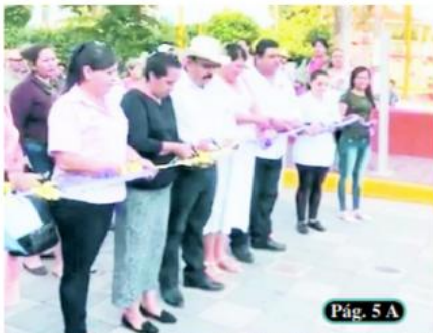
Pág. 5 A

□ Después partirá al municipio de Aguililla