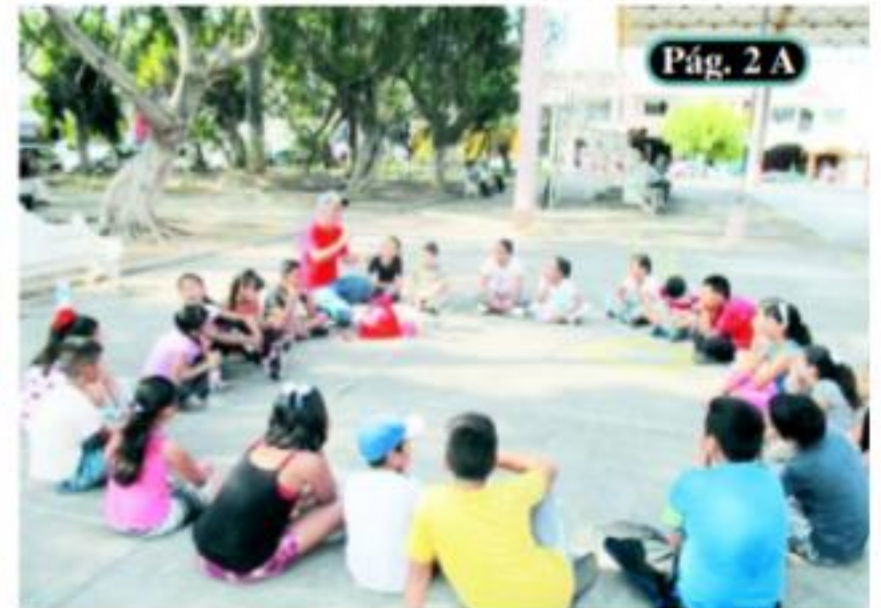
Pág. 2 A

□ La edición 2019 reunió una cifra de 800 niños, jóvenes y adultos