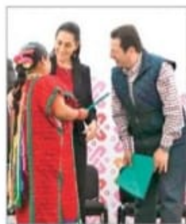
PRÉSTAMOS. Lamandataria capitalina destacó que el objetivo es potenciar el desarrollo económico de la ciudadanía.

Claudia Sheinbaum y el titular del Fondeso, Fadlala Akabani Hneide, entregaron en Xochimilco cinco mil 948 créditos para el autoempleo por un monto de 56.2 millones de pesos; el presupuesto para el programa 2019 es de 400 millones de pesos, el doble que en años anteriores CDMX P. 9