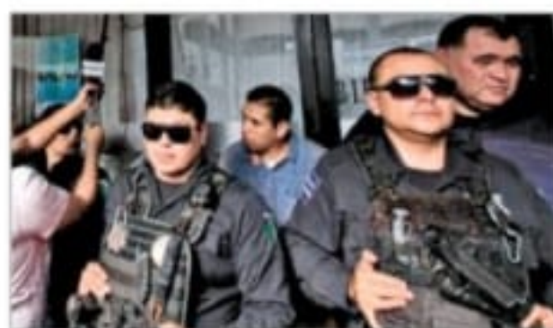
A PUERTA CERRADA. Resguardados por la Policía.

Al conocer la perspectiva del organismo multilateral, el presidente López Obrador dijo que no confía en esas opiniones y lo convocó a que no sólo evalúe el crecimiento económico, sino también el desarrollo. Por la tarde, tras reunirse con el mandatario, el comité directivo de la ABM informó que está dispuesto a otorgar créditos hasta por 500 mil mdp para impulsar las actividades productivas MÉXICO Y NEGOCIOS P. 4 Y 16