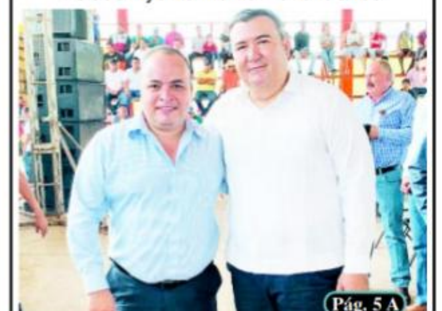
Pág. 5 A

□ Con aportaciones en forma tripartita: Estado-Ayuntamiento-Beneficiarios