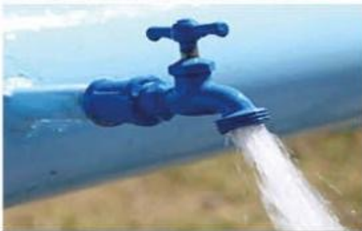
La CEAC busca los mecanismos de financiamiento para que pronto se haga realidad la obra de una nueva planta potabilizadora de agua, que costaría alrededor de 500MDP, para garantizar agua de calidad y en forma suficiente a la población.