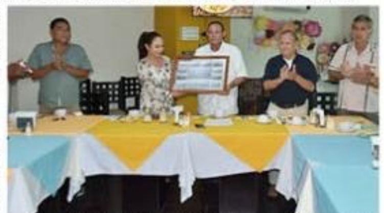
Los integrantes de la A.C. "Los Llanitos" hicieron un reconocimiento a la alcaldesa por su apoyo al Fondo Legal.

Lo anterior, durante una reunión con integrantes de la asociación civil "Los Llanitos", quienes le hicieron entrega de un reconocimiento por su apoyo al fondo legal. Al respecto, la alcaldesa manifestó su agradecimiento y refrendó su compromiso >>> 5