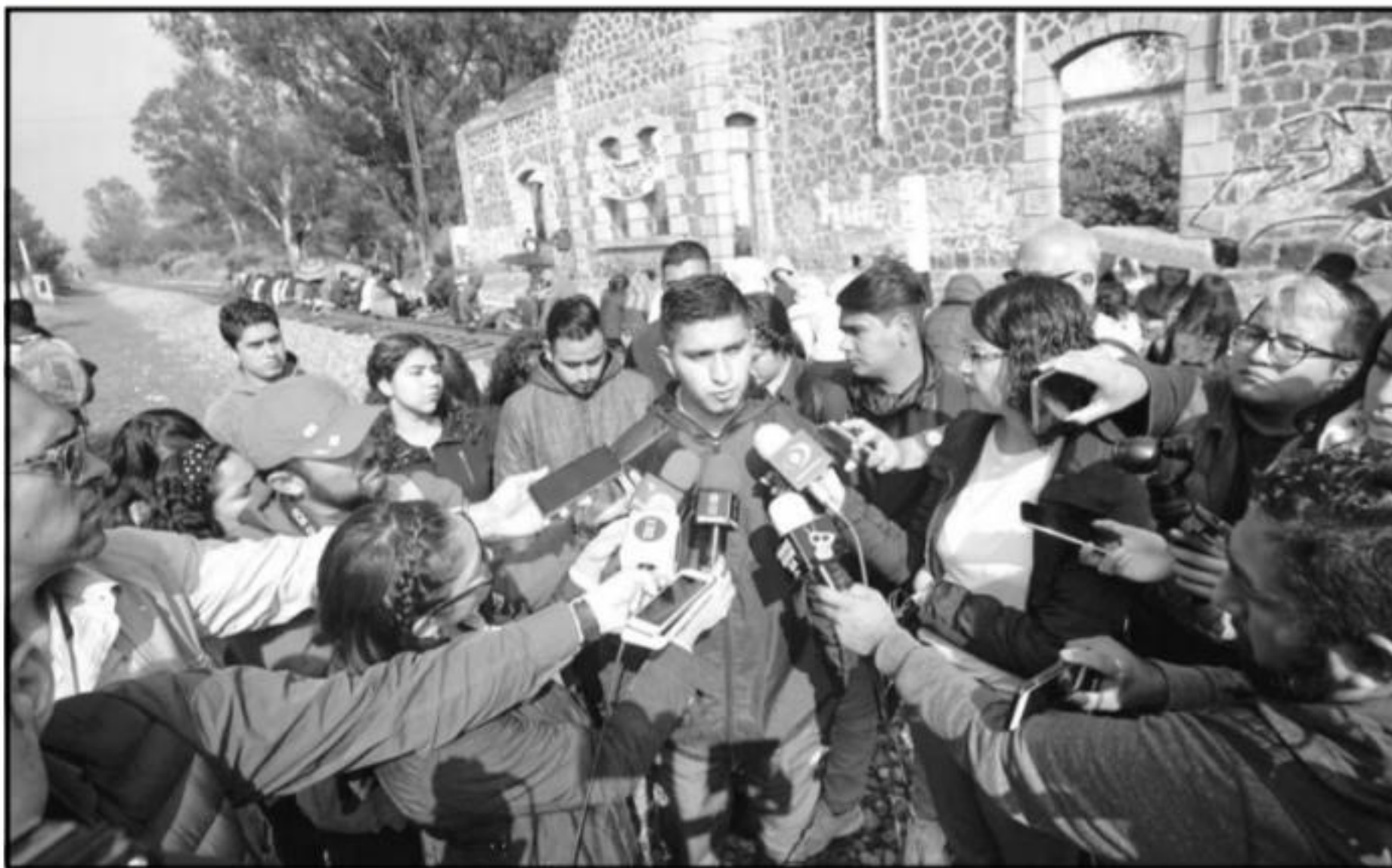
Estudiantes de las normales, mantienen bloqueos a las vías férreas en Michoacán, ocasionando con ello cuantiosas pérdidas; empresarios e industriales demandaron al gobierno estatal aplicar la ley y castigar a los responsables.