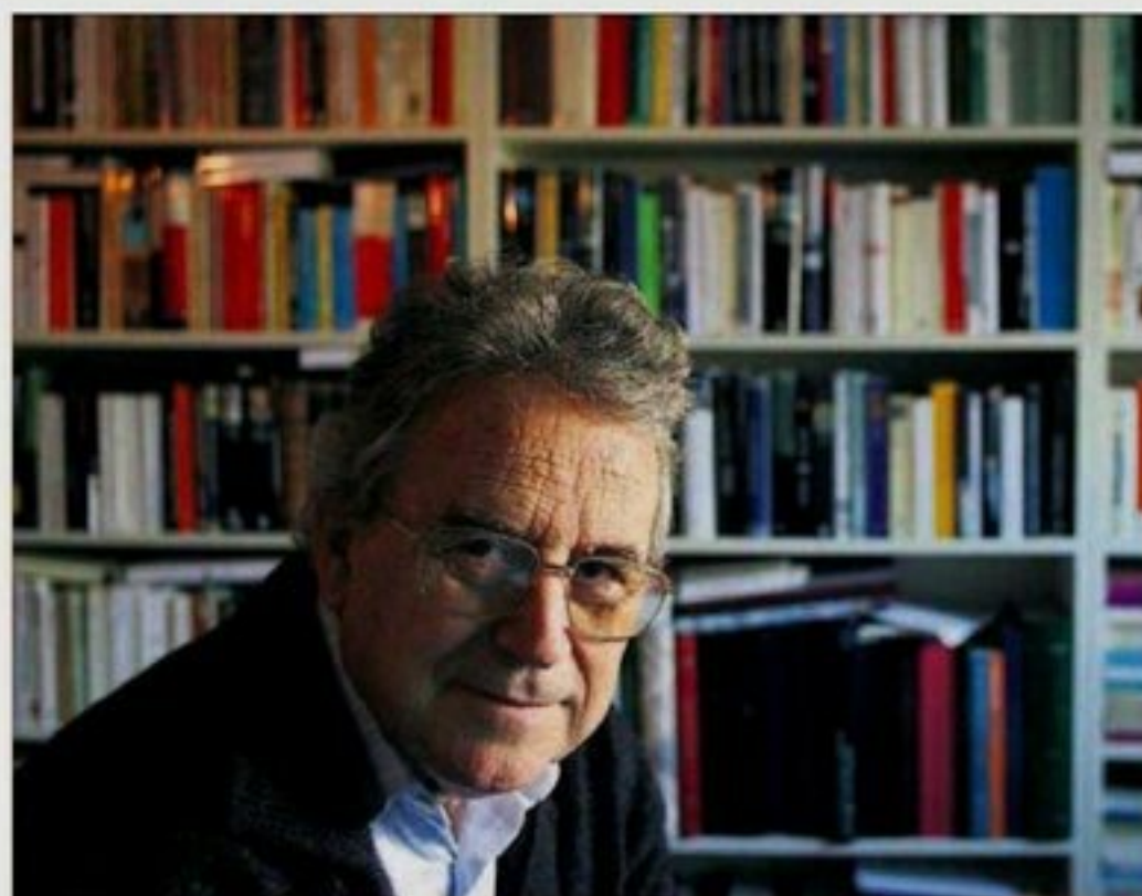
MUERE SANTOS JULIÁ, EL GRAN HISTORIADOR DEL SIGLO XX ESPAÑOL. Lúcido observador del pasado y del presente de España, intelectual de la complejidad y enemigo del maniqueísmo, el historiador, escritor y articulista Santos Juliá falleció ayer en Madrid a los 79 años. PÁGINAS 26 A 29

miembros de Inmigración de Interior colaborarán en el esclarecimiento de este terrible suceso". En 2000, el Reino Unido ya se vio conmocionado por el hallazgo de 58 cadáveres de inmigrantes chinos en otro contenedor de camión en Dover, el principal puerto de entrada al país. PÁGINA 2