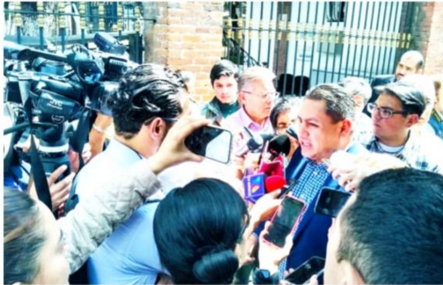
CDMX.- El alcalde de Uruapan, Michoacán, Víctor Manuel Manríquez González, continúa realizando gestiones en la capital del país para que ese municipio cuente con los recursos necesarios para atender las demandas de su población.

Presenta Capasu proyecto de rescate del río Cupatitzio