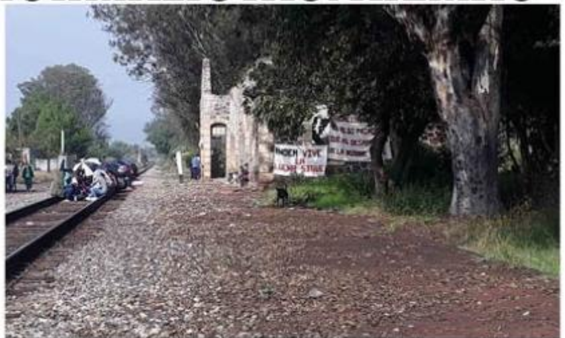
De acuerdo a la asociación de Industriales de Michoacán, de nuevo hay pérdidas millonarias por el bloqueo a las vías del tren por parte de estudiantes normalistas.

Uno de los grandes retos que tiene el gobierno del estado a través de la Comisión Estatal del Agua y Gestión de Cuencas, en forma conjunta con el >>> 3