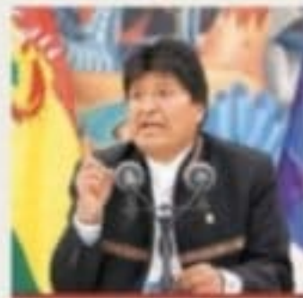
Evo Morales, presidente de Bolivia.

Continúan las protestas en Chile, pese a que Piñera pidió perdón... también sigue la militarización