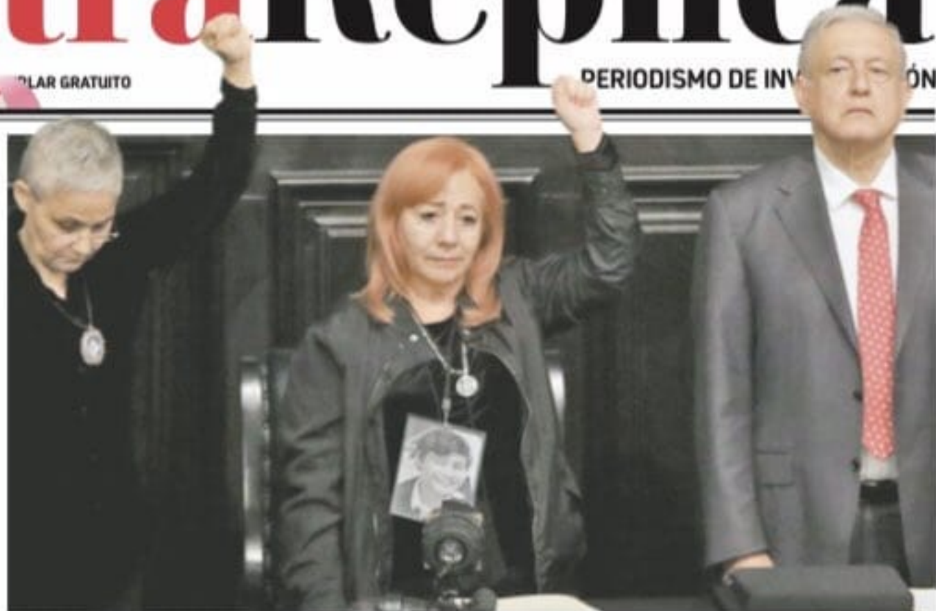
HIJAS DE ROSARIO IBARRA ENCARGAN A AMLO LA BELISARIO DOMÍNGUEZ. PÁG. 7