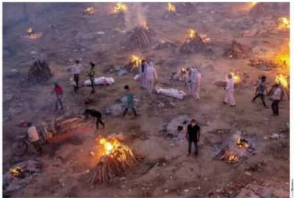
India, atrapada en la mayor crisis

Cuatro pasan de verde a amarillo y 3 de amarillo a naranja; 4 más estados en riesgo: Edomex, Yucatán, Guaymas y Jalisco pág. 3