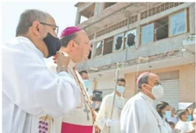
El grupo apostólico recorrió la carretera Aguatitlán-Aguililla y realizó algunas paradas en las comunidades para solicitar a los habitantes que ya lo esperaban. Le hizo sus oraciones, al asegurar que no tiene por su vida al visitar esta región.

Madrugada de reñones y delirios de la Constitución, | NACIÓN | A4