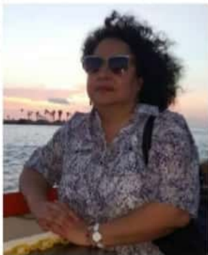
Blanca Estela Gorostieta Ortuño