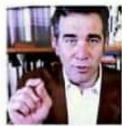
Lorenzo Córdova, presidente del INE

Ministro no rechaza acuerdo legislativo; deja decisión final a Máximo Tribunal