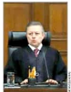
AUTOREGULACION, bajo principios de eficiencia, economía, transparencia y honradez.

A una semana de su llegada a la presidencia de la Corte, Arturo Zaldívar anuncia que ganarán 67 mil pesos menos que el año pasado, lo cual dijo "es una medida de racionalidad del gasto público". Posteriormente, señaló, se informará de otras acciones como parte de la política de austeridad de su administración MÉXICO P. 3