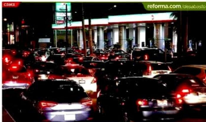
Los automovilistas hicieron largas filas y acabaron con la gasolina disponible en varias estaciones.

Venden menos autos 7.11% cayó la venta al público de vehículos ligeros en el País en 2018; fue la segunda reducción en fila, luego que en 2017 la baja fue de 4.57 por ciento.