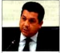
"Estamos a favor de la suma de esfuerzos entre Federación, estados y municipios. Colaboración que no debe entenderse como subordinación" FRANCISCO GARCÍA CABEZA DE VACA Gobernador de Tamaulipas

Doce gobernadores respaldaron la creación de la Guardia Nacional, con la condición de que inicie bajo un mando civil, que sea temporal y privilegio de fortalecimiento de las policías locales sin afectación económica para los estados.