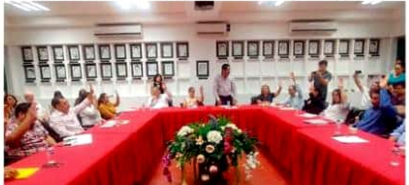
Por unanimidad, el cabildo porteño aprobó ayer la reducción de salarios de ellos y de los funcionarios de primer nivel, en lo que se presume una simulación.