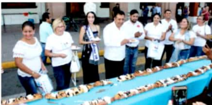
APATZINGÁN, MICH.- En el marco del reparto de la tradicional rosca de Reyes, participaron cientos de apatzinguenses, evento desarrollado afuera del Palacio Municipal.