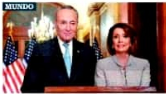
'LIBERTAD, SÍMBOLO DE EU Y NO MURO' El presidente Donald Trump defendió la necesidad de una valla en la frontera; demócratas la descartan. A14