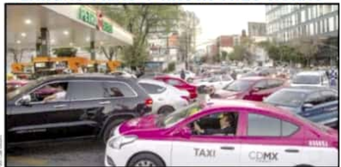
Caso que se prolongó hasta la madrugada de hoy.