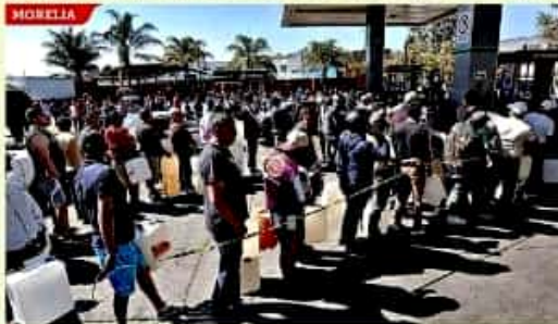
La capital michoacana sigue siendo de las más afectadas por la falta de combustible.