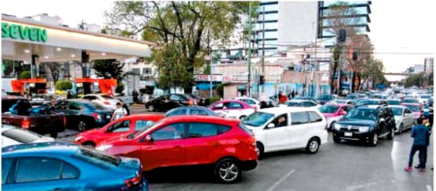
Largas filas se vieron en estaciones de servicio de distintos puntos de la ciudad, como en avenida Revolución y Rembrandt.

Gil Gamés "Las filas para obtener combustible son salvajes, brutales, increíbles" - p. 47