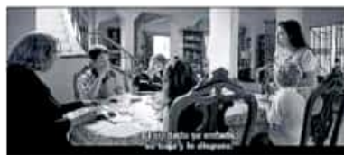
Rótulo que traduce al español de la península "se enoja el soldado, se baja el soldado y le disparó".

¿Es preciso en España una película mexicana? Roma, de Alfonso Cuarón, enciende el debate sobre la lengua común porque se proyecta para los espectadores españoles con subtítulos inme-