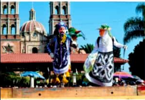
NUEVO SAN JUAN PARANGARICUTIRO, MICH.- Más de 5 mil visitantes se congregaron en la explanada de la plaza principal para disfrutar de la tradicional competencia de la danza de Los Kúrpites de los Barrios San Mateo y San Miguel.

En Nuevo San Juan Parangaricutiro Manuel JIMÉNEZ