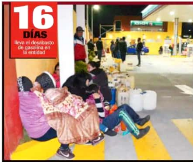
Familias enteras "acampan" en las gasolineras con la esperanza de obtener combustible.

■ CRECEN DAÑOS EN PRODUCTIVIDAD; LAS ESCUELAS DE BÁSICA FLEXIBILIZAN LA ASISTENCIA Y LA PUNTUALIDAD