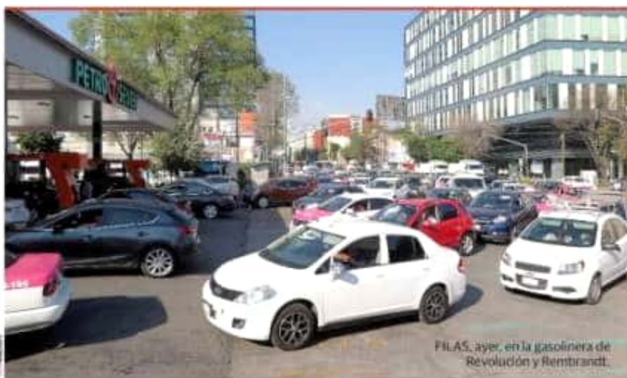
FILAS, ayer, en la gasolinera de Revolución y Rembrandt.