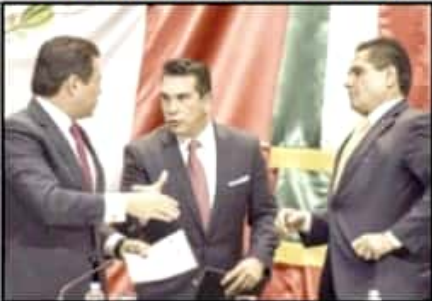
Alejandro Moreno, Silvano Aureoles y Mario Delgado. Conago en la Cámara de Diputados.