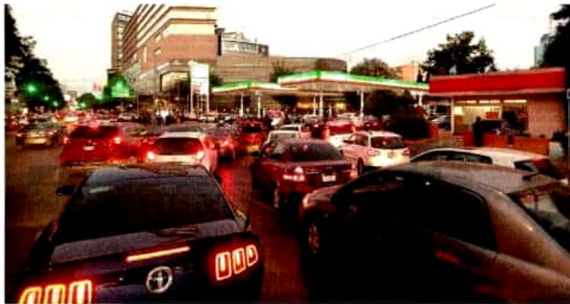
Aster el riesgo de quedarse sin combustible, automovilistas hacen largas filas para abastecerse en gasolineras de la capital del país.