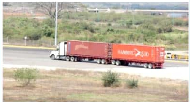
CD. LÁZARO CÁRDENAS, MICH.- El nuevo régimen fiscal, así como la inseguridad, fueron las principales afectaciones que enfrentó el sector transportista durante el 2018 según informes de la Attac. PÁG. 3

Inseguridad y cuestión fiscal, las principales afectaciones del sector de autotransporte