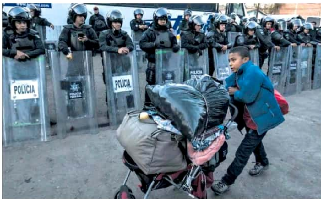
Un niño migrante centroamericano recoge sus pertenencias en presencia de la policía en Tijuana, el 3 de enero.