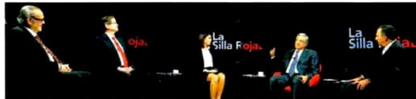
PRENSA. El presidente dijo que no habrá censura y que impulsará el debate, el derecho a la réplica y el diálogo circular.

“Tenemos que buscar la conciliación, el debate no es odio; yo no odio a nadie, no tengo fobias, y soy feliz”