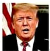
Donald Trump habló anoche en cadena nacional.