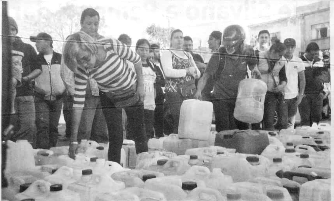
CAMBO | ACG