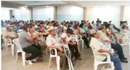
El sindicato de trabajadores al servicio del ayuntamiento y funcionarios de la administración municipal, celebraron su primera reunión tendiente a la sindicalización de 163 personas.