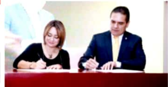
MORELIA, MICH.- En Casa de Gobierno se firmó la Declaratoria por el Turismo en Michoacán, la cual contiene 20 proyectos a trabajar y que firmaron autoridades estatales y líderes empresariales del ramo.