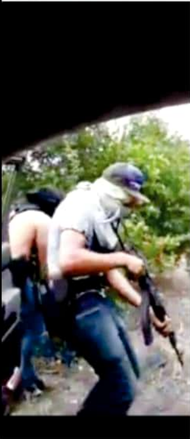
APATZINGÁN, MICH.- El registro de balaceras al sur del municipio de Buenavista, son en su mayoría simulaciones de células del crimen organizado para mantener en jaque a las autoridades policiacas y militares, señalaron habitantes de aquella zona.