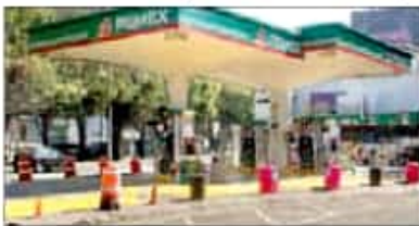
Algunas estaciones de gasolina en la CDMX tuvieron que cerrar ayer, por falta de combustible.

[ RODRIGO JUÁREZ Y BEATRIZ COLLA ] .3, 4 y 10