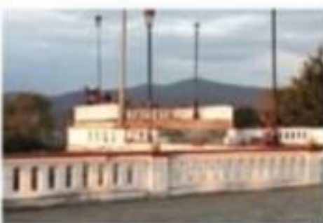
El cerrito de la Independencia 16