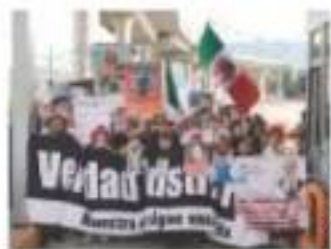
EL CONTINGENTE, ayer en la entrada de Topilejo.

Caravana liderada por Sicilia y los LeBarón alista acto en la Estela de Luz; buscan audiencia en Palacio.