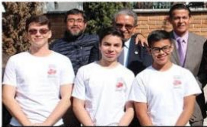
Cuatro estudiantes de LC, tres de ellos del plantel Cecytem-Guacamayas, obtuvieron medalla de oro en la 29 edición nacional de las Olimpiadas de Química y Biología.

Una vez más, jóvenes estudiantes llenaron de orgullo a Michoacán, con la obtención de 3 medallas de oro, una de plata y 4 de bronce, en la 29ª Edición Nacional de las Olimpiadas de Química y Biología.