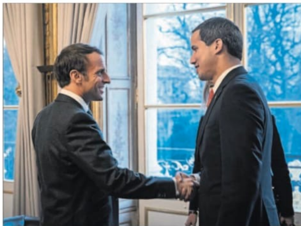
Emmanuel Macron en París con Juan Guaidó, en una imagen facilitada por el equipo del presidente francés.

RETINA Inteligencia artificial que revoluciona el deporte