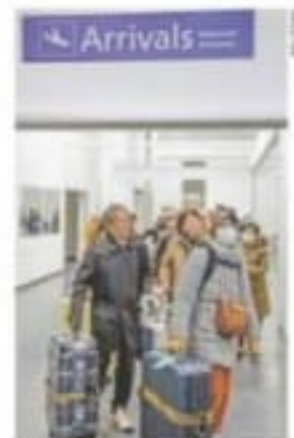
Viajeros chinos en Finlandia usan cubrebocas como medida de prevención contra el virus.

● El Gobierno invertirá 64 millones de pesos en una estrategia de atención integral a los jóvenes, mejoras a centros de prevención y más especialistas. El proyecto arrancará operaciones en marzo próximo. A15