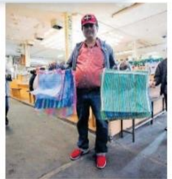
Las antiguas bolsas de mandado son una alternativa viable