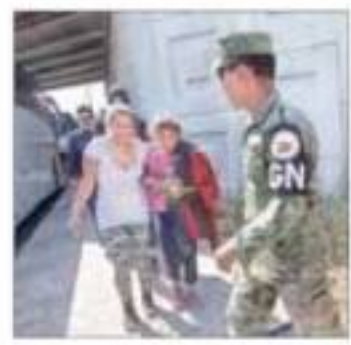
Se retiró a la Guardia Nacional del Suchiate, anunció el Ejecutivo. La imagen, en un retén cerca de Tapachula.