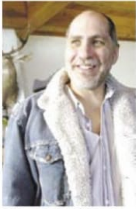
Guillermo Arriaga. Salvar al Fuego, su novela.