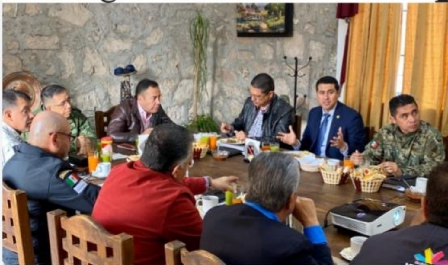
MORELIA, MICH.- En reunión de la Mesa de Coordinación para la Construcción de la Paz en Michoacán, se revisó la estrategia para inhibir la comisión de delitos en la Autopista Siglo XXI.

■ Acuerdan mantener acciones coordinadas para inhibir la comisión de delitos en esa importante vía de comunicación