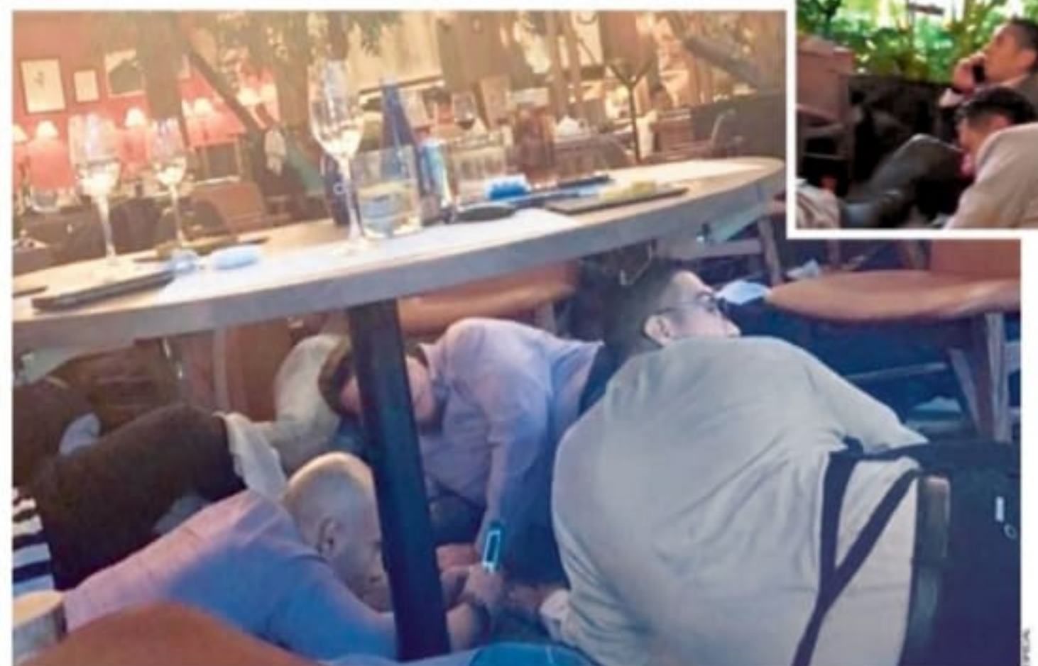
PÁNICO. Comensales del restaurante Hunan buscaron protegerse. En el recuadro, el alcalde de Coyoacán, Manuel Negrete. LA ACCIÓN FUE AL ESTILO NARCO Y SE UTILIZÓ UN ARMA LARGA