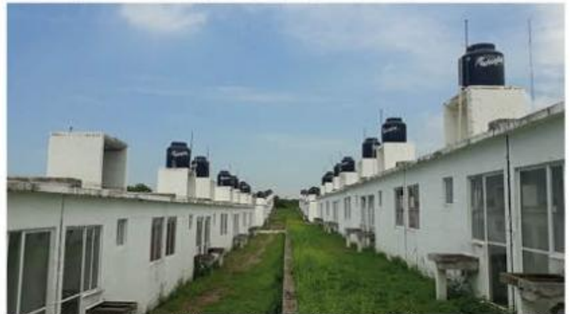
Este es el fraccionamiento de las 400 Casas, donde serían reubicadas las familias de pescadores, y que a la fecha luce abandonado y vandalizado.

Ese alcance representa sólo el 7.4% del universo de las unidades económicas locales registradas. >>> 3