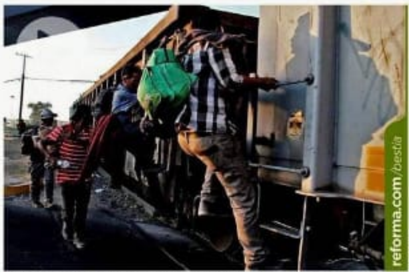
Igual que como llegaron, los indocumentados viajan en tren de regreso al sur de México.

A 3.84% descendió la tasa anual en la primera quincena de julio. Este es el nivel más bajo desde enero de 2017. NEGOCIOS