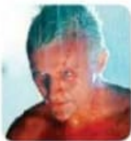
La muerte del replicante Roy Batty.

Rutger Hauer, recordado por interpretar a un androide en Blade Runner, personaje que pronuncia uno de los monólogos más famosos de la historia del cine, falleció a los 75 años en Holanda. FUNCIÓN | PÁGINA 4