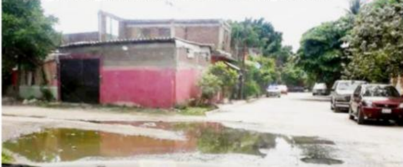
CD. LÁZARO CÁRDENAS, MICH.- Habitantes de la colonia Comunal Morelos denunciaron las constantes fugas y brote de aguas negras derivado al colapso del sistema de drenaje.