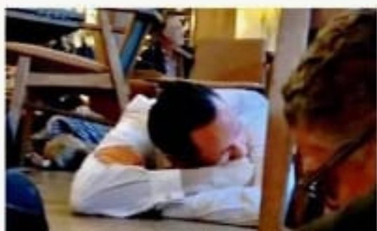
Los comensales que se encontraban en el lugar se tiraron al suelo al iniciarse la balacera dentro de la plaza comercial.

El Presidente respetará la participación privada en petróleo, petroquímica y gas, informó Carlos Salazar, líder del CCE, tras una reunión en Palacio donde también participó el Consejo Mexicano de Negocios. NEGOCIOS