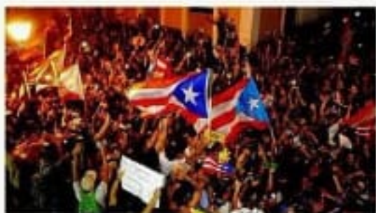
Miles de boricuas celebraron tras el anuncio de Roselló.