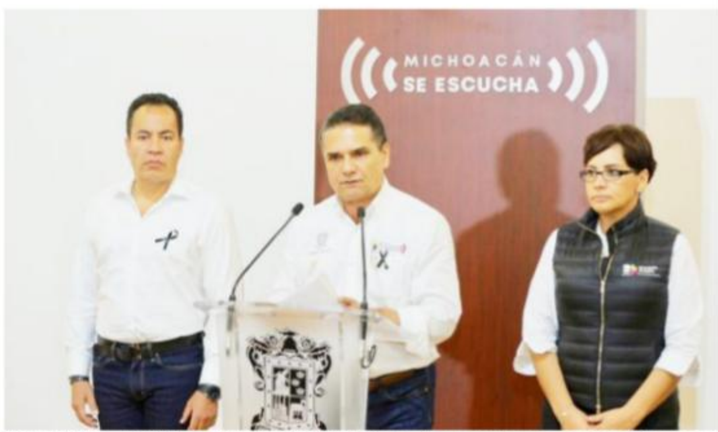
MORELIA, MICH.- El gobernador de Michoacán, Silvano Aureoles Conejo, llamó a no caer en especulaciones con relación al accidente y pidió esperar lo que arrojen las investigaciones.