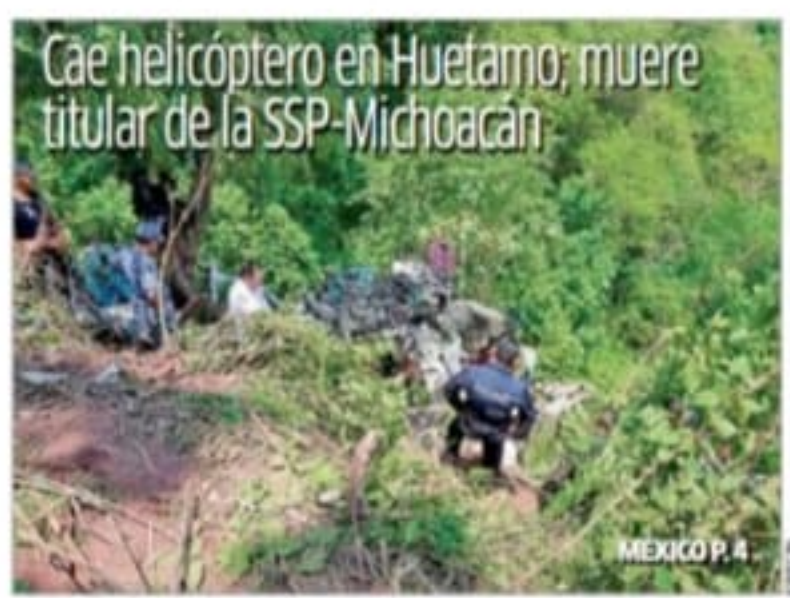
Cae helicóptero en Huetamo; muere titular de la SSP-Michoacán MÉXICO P. 4