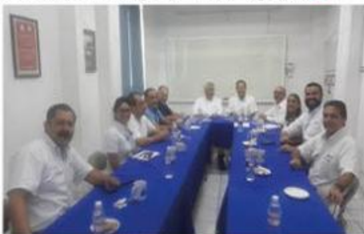
Directivos y consejeros de la Canaco local, durante una de sus sesiones semanales.