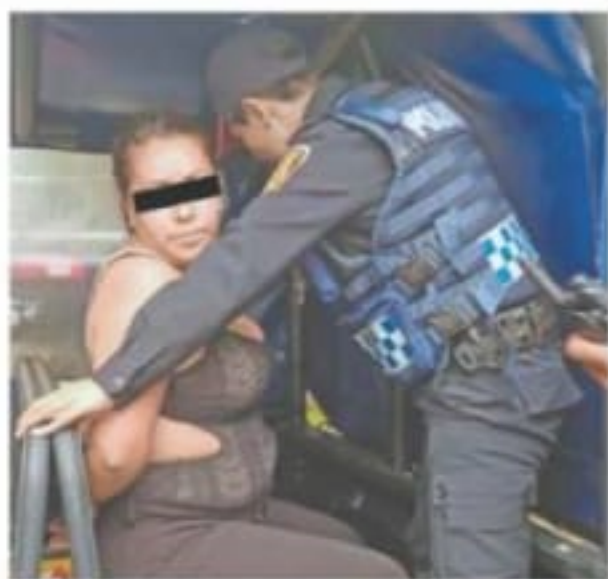
Esperanza "N" fue detenida luego de participar en el asesinato de dos hombres de nacionalidad israelí en una plaza comercial del sur.