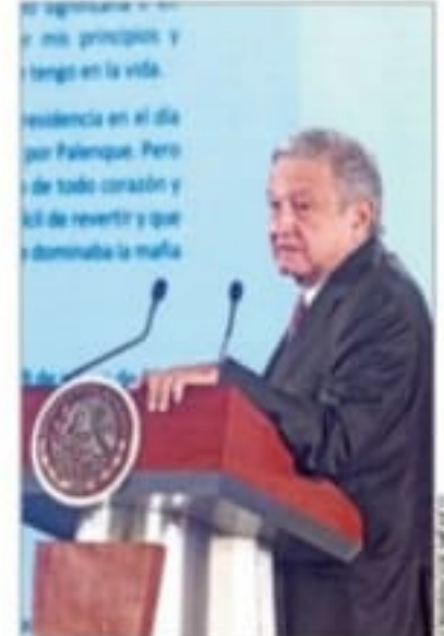
QUENO LO MIREN A EL. En su conferencia, AMLO dijo sobre BC: "Buscan echarme la culpa de todo".

El ex candidato del PAN a la gubernatura, Óscar Vega, recurrirá a autoridades electorales; los legisladores federales, tras un tenso debate en Permanente, pidieron al actual gobernador que publique las reformas para interponer los recursos legales ante la Suprema Corte. López Obrador dijo que no le echen la culpa por la reforma MÉXICO P. 3