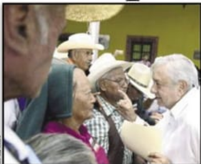
PINOS, Zac.- Andrés Manuel López Obrador. Contacto con el pueblo.

La titular de la Oficialía Mayor de la Secretaría de Hacienda y Crédito Público (SHCP), Raquel Buenrostro Sánchez, explicó que