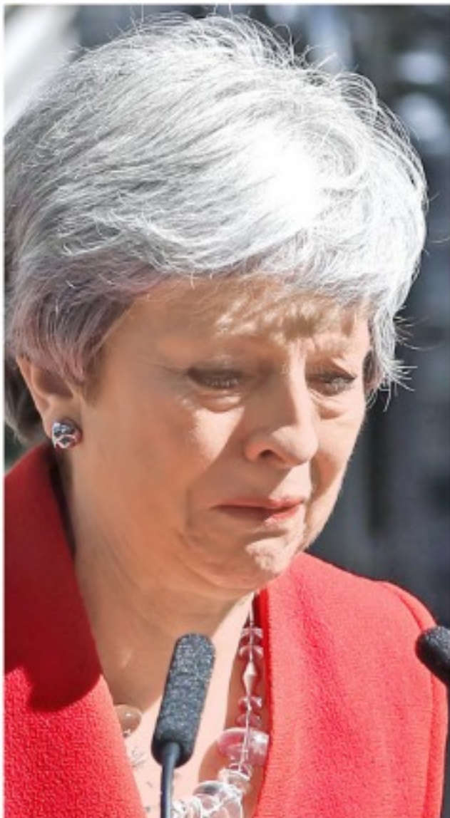
Theresa May afirmó ayer que "es en el interés del país que un nuevo premier conduzca ese esfuerzo" de sacar a los británicos de la UE.