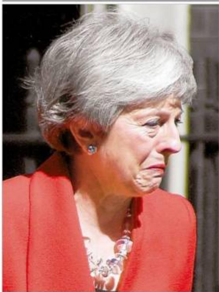
Theresa May rompió en llanto al anunciar su dimisión para el próximo 7 de junio.

Alista nuevo mecanismo legal para evitar atropellos en contra de estudiantes y el mal uso del CREFAL, revela López Obrador