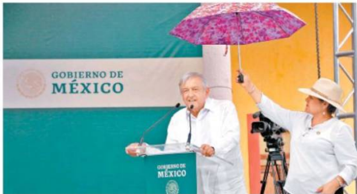
Al Presidente le llovió en su visita a Zacatecas, donde presentó los programas integrales de bienestar. JESÚS QUINTANAR