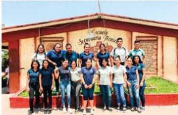
Escuela secundaria técnica No. 113, con estudiantes de segundo semestre de Licenciatura en Psicología Educativa.

Durante la semana del 20 al 24 de mayo del año en curso, estudiantes del IMCED plantel Guacamayas realizaron prácticas interdisciplinarias en primaria, secundaria y nivel medio superior; con el objetivo de contras- ➤ 10