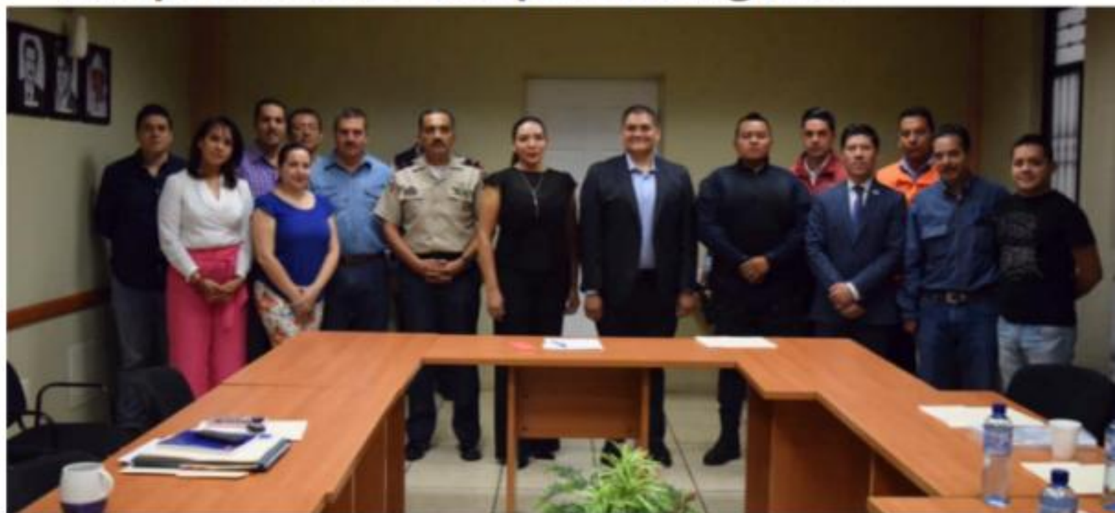
JACONA, MICH.- Este consejo atenderá desde alguna contingencia pequeña hasta situaciones de emergencia.