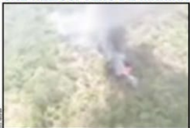
Un helicóptero de la Marina se desplomó cuando apoyaba tareas en el combate a un incendio forestal