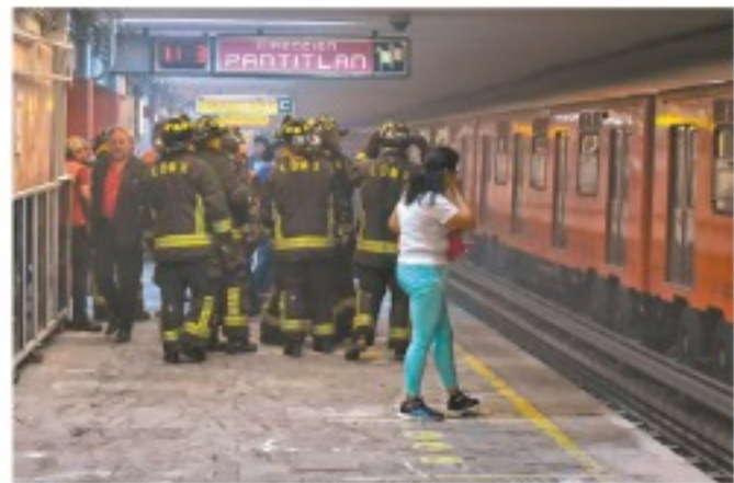
En la estación Balderas se presentó ayer una humareda debido a una falla en las zapatas de freno de un vagón, por lo que los pasajeros fueron desalojados.

Ayer, en la estación Balderas de la Línea 1 del Metro se registró una falla en un tren que generó humo y los pasajeros fueron desalojados. METRÓPOLI A18