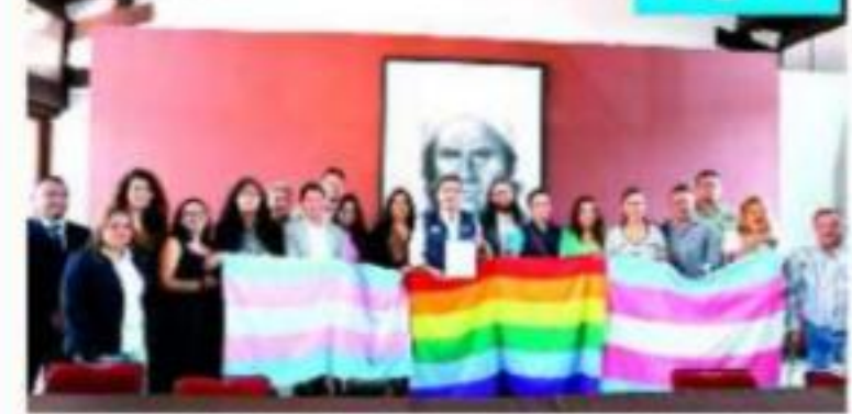
MORELIA, MICH.- El gobernador Silvano Aureoles firmó el acuerdo administrativo y junio será el Mes del reconocimiento al cambio de identidad de género.

Encuentro con el gobernador y autoridades del Gobierno de Michoacán Pág. 7 D