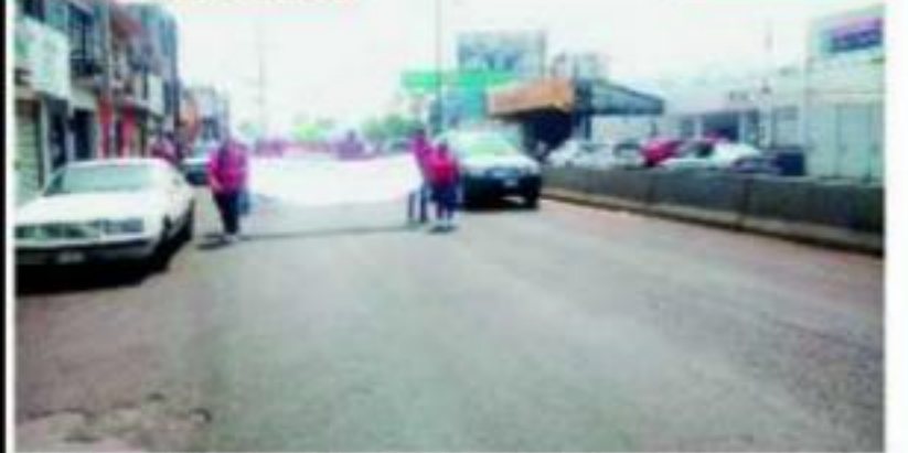
MORELIA, MICH.- Caótica jornada vivió la capital del estado hasta con 4 protestas.

Conafe y jóvenes ambientalistas, Telebachillerato y UTM Pág. 2 D Octavio ORTIZ GARCÍA