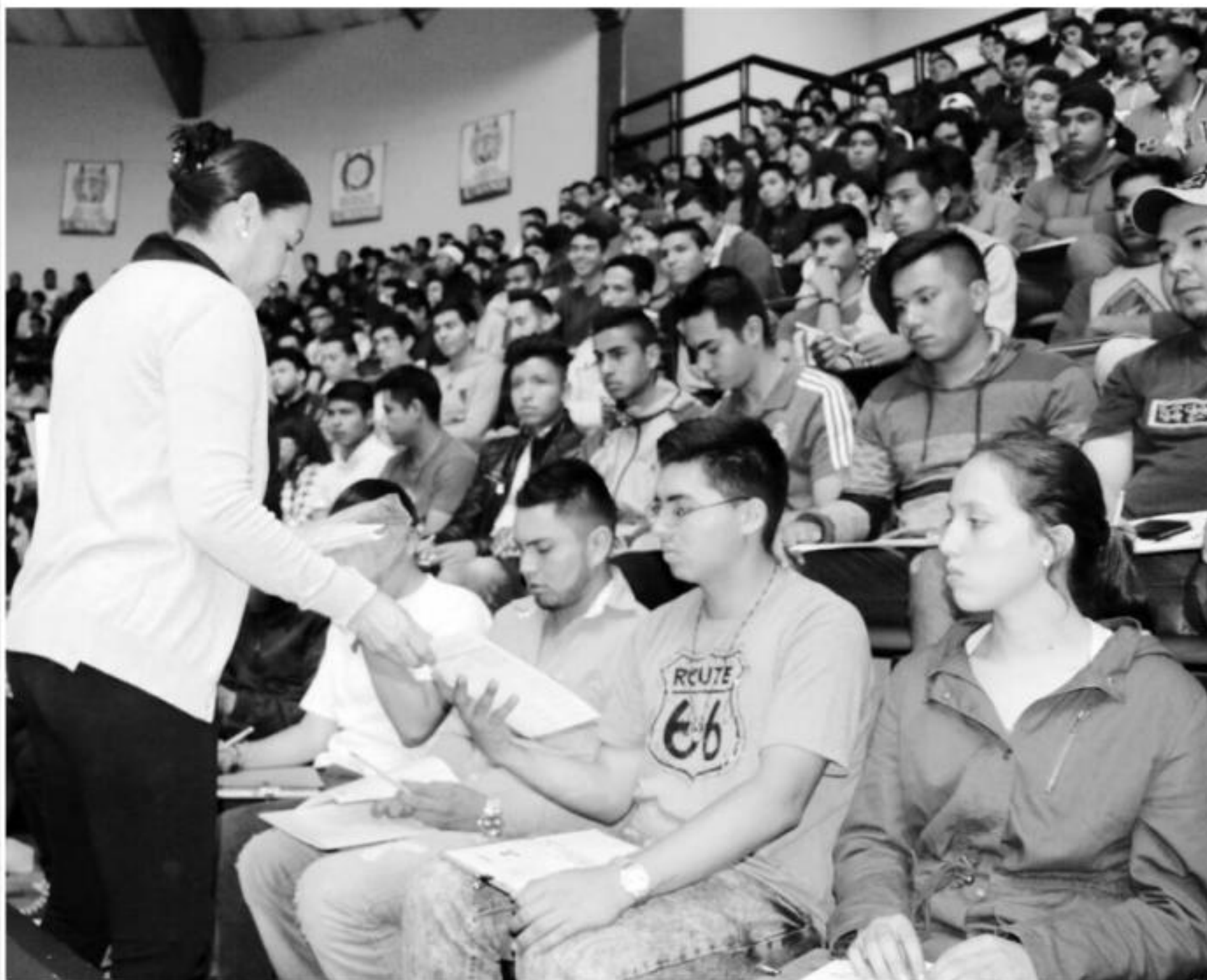
Examen de admisión de la Universidad Michoacana de San Nicolás de Hidalgo.