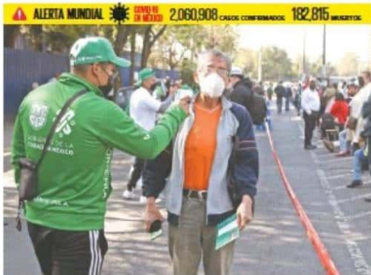
Así como se agilizan a la Secretaría Superior de Educación Pública en Itzamal, una de las secretarías de vacaciónes.