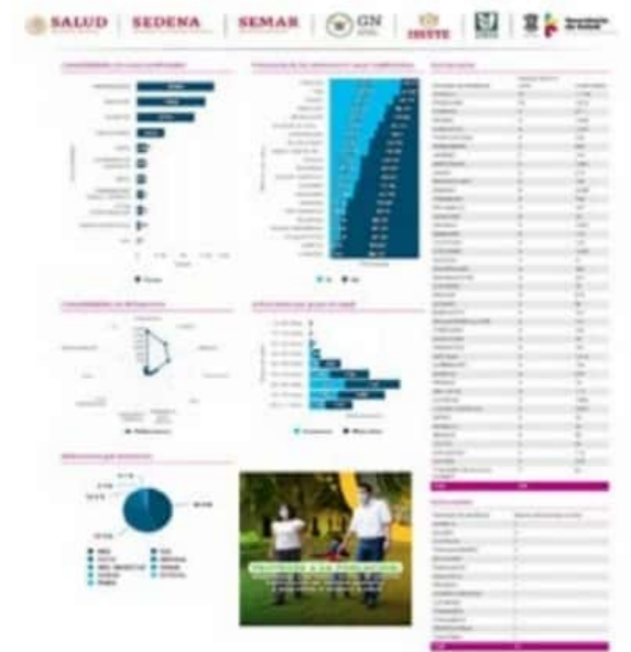
El día de ayer, según el CESS, el municipio de LC registró solamente 3 nuevos casos positivos de COVID-19 y una defunción más.