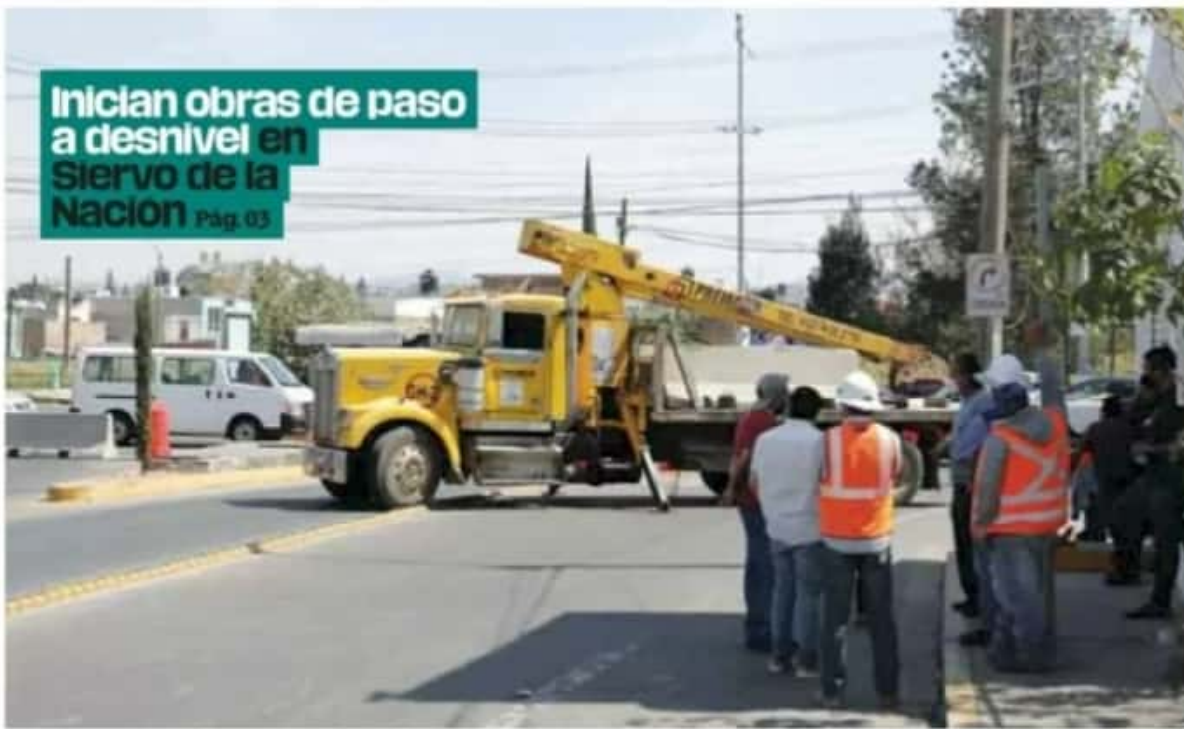
Tráfico. El inicio de los trabajos de construcción obligó a hacer un corte a la circulación vehicular, por lo que se recomienda utilizar vías alternas.

Inician obras de paso a desnivel en Siervo de la Nación Pág. 03