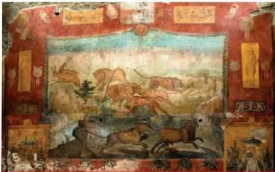
Expertos del Parque Arqueológico de Pompeya mostraron ayer un fresco de grandes dimensiones recuperado en la ciudad de Pompeya, el cual muestra escenas de caza y paisajes egipcios de la delta del río Nilo. La obra está en el jardín de la casa de un magistrado de la Antigua Roma.

RECUPERAN EN POMPEYA FRESCO CON PAISAJES EGIPCIOS