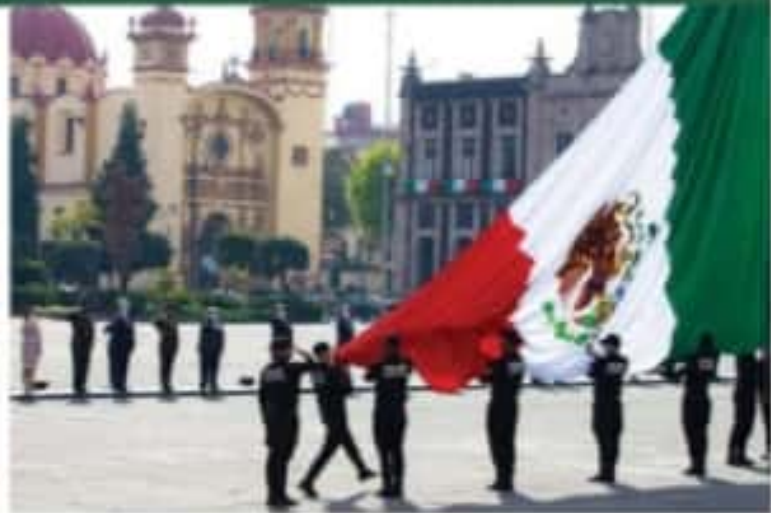
El gobernador, Alfredo del Mazo Mazo, encabezó la ceremonia conmemorativa del Día de la Bandera, junto con los titulares de los poderes Legislativo y Judicial del Estado de México, con quienes rindió los honores correspondientes al labero patrio, realizada en la plaza de Los Mártires, en el centro de la capital mexicana. Estuvo acompañado por su gabinete legal y ampliado, así como por representantes de organismos autónomos. En una ceremonia breve, los servidores públicos atestiguaron el traslado e izamiento del símbolo nacional, para después entonar el Himno Nacional. (Alicia Rodríguez)