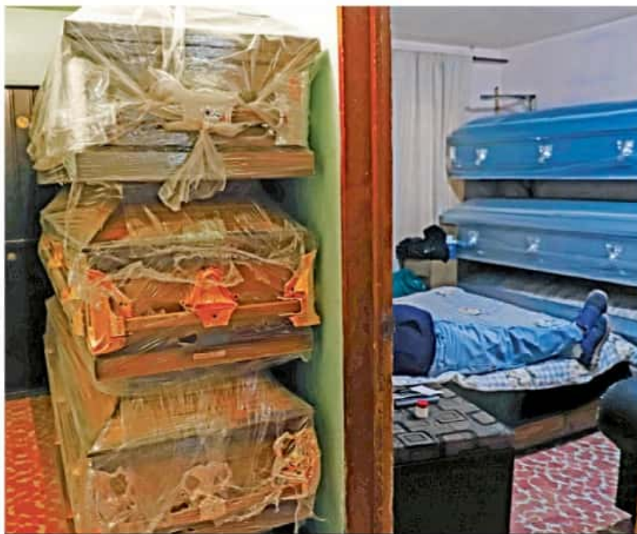
NEGOCIO EN BONANZA. Debido a la pandemia, la funeraría Ermita, en Tzotzamal, presta hasta 80 servicios mensuales, cuando en tiempos normales eran de 20 a 30. Ahora ocupan cualquier espacio para almacenar los ataúdes necesarios para el negocio. VIDEO HTTPS://BIT.LY/2021MXI TOCA AQUÍ