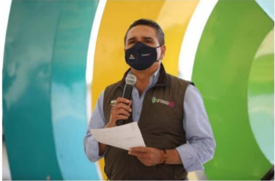
URUAPAN, MICH.- El gobernador Silvano Aureoles Conejo, emitió su postura en torno a las acusaciones contra el gobernador de Tamaulipas y sentenció que si la intención del gobierno federal es intimidar y callar a la Alianza Federalista, no lo van a lograr.

Firma Canaco convenio de colaboración con el Icatmi PÁG. 2