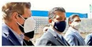
El Gobernador de Tamaulipas acudió ayer a la Cámara de Diputados para conocer las acusaciones de la FGR.

Rastrean la UIF y Aduanas ligas de funcionarios con huachicoleo BENITO JIMÉNEZ Y MARTHA MARTÍNEZ