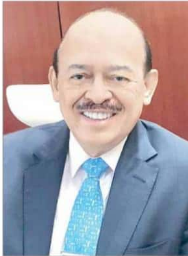
del outsourcing, por presuntamente incurrir, en ambos casos, en delincuencia organizada, operaciones con recursos de procedencia ilícita y defraudación fiscal.