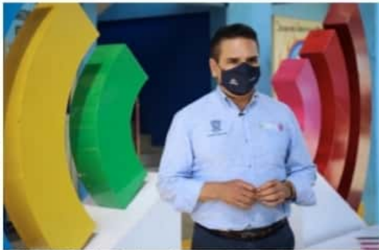
URUAPAN, MICH.- El gobernador, Aureoles Conejo, dijo que es muy lamentable que no se cuide la ley y el estado de derecho.

Tras cuestionarle sobre la petición que hizo el presidente de la república para la firma de un pacto entre gobernadores para no "meter las manos" en el actual proceso electoral, el mandatario michoacano aseguró no entender por qué un presidente pide a los gobernadores que firmen un pacto como el que dijo, "cuando ya está plasmado en la ley, es redundante", y agregó que el pacto debió ser para atender la pandemia, para el plan de vacunación, la reactivación económica y apoyo a los micro y pequeños empresarios; un pacto para que no les quiten el dinero a las instituciones de investigación y desarrollo, finalizó.