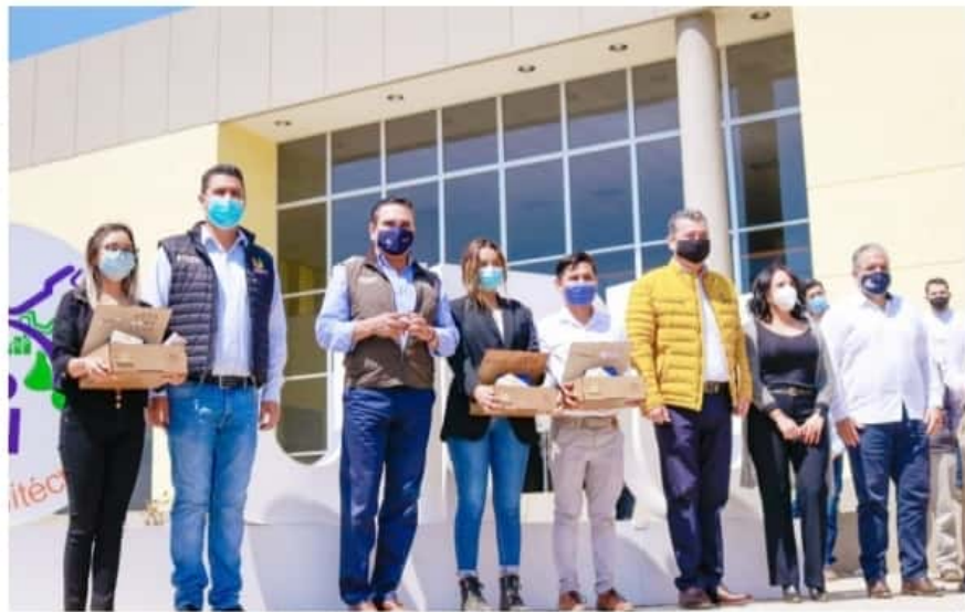
URUAPAN, MICH.-Infraestructura educativa por más de 95 mdp entregaron ayer a planteles de educación superior de esta ciudad, el presidente municipal, Miguel Ángel Paredes Melgoza, y el gobernador, Silvano Aureoles Conejo.