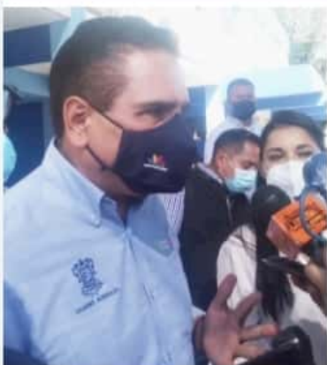
URUAPAN, MICH.- Ante la solicitud de desafuero al gobernador de Tamaulipas, integrado a la Alianza Federalista, presentada por la FGR, Silvano Aureoles Conejo fue claro al señalar que "ni nos intimidan ni nos callan", y lamentó que se utilicen prácticas que corresponden a una tiranía.

ABSURDO QUE AMLO PROPONGA UN PACTO PARA RESPETAR LAS LEYES