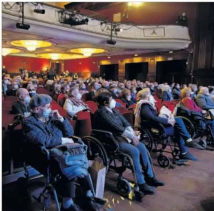
DE LA RESIDENCIA AL TEATRO GRACIAS A LA VACUNA. 170 ancianos de residencias de Madrid, que han recibido la inmunización del coronavirus, pudieron acudir ayer a una función especial en un teatro de la Gran Vía madrileña. Fue su primera salida desde el confinamiento de marzo. PÁGINA 25

El pleno del Congreso mostró ayer el nuevo clima de entendimiento entre socialistas y populares. Pablo Casado abogó por un "nuevo comienzo", mantuvo su desmarque de Vox y señaló que está "dispuesto a mancharse" y a colaborar con el Gobierno para "enfrentar juntos el plan de reconstrucción". Pedro Sánchez llamó a la unidad política porque "la sociedad está exhausta", y pidió al PP buscar fórmulas para "recorrer juntos el tramo final de esta calamidad". Vox atacó al PP por su acercamiento a un pacto con el Gobierno. PÁGINAS 14 a 16