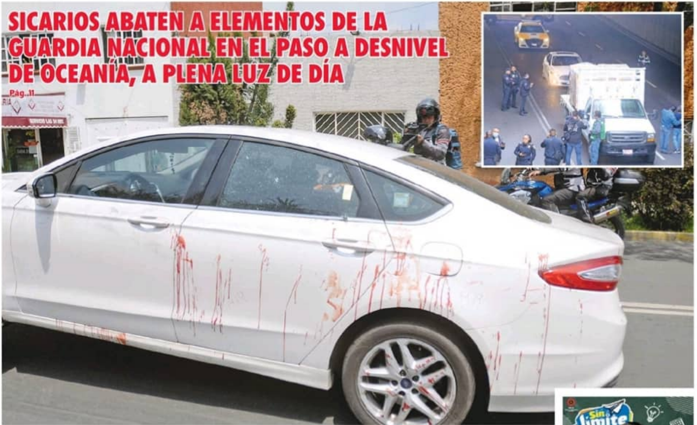
Eligieron el lugar donde no registran las cámaras de vigilancia. LUIS A BARRERA