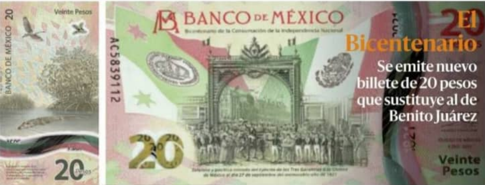
El gobernador del Banco de México presentó ayer el billete de 20 pesos conmemorativo al Bicentenario de la Independencia; en el anverso luce un fragmento de la obra de la entrada del Ejército Trigarante a la Ciudad de México de autor anónimo y en el reverso un ecosistema protegido costero.

HISTORIA EN VIVO Berthel Hernández - Páginas 8-9