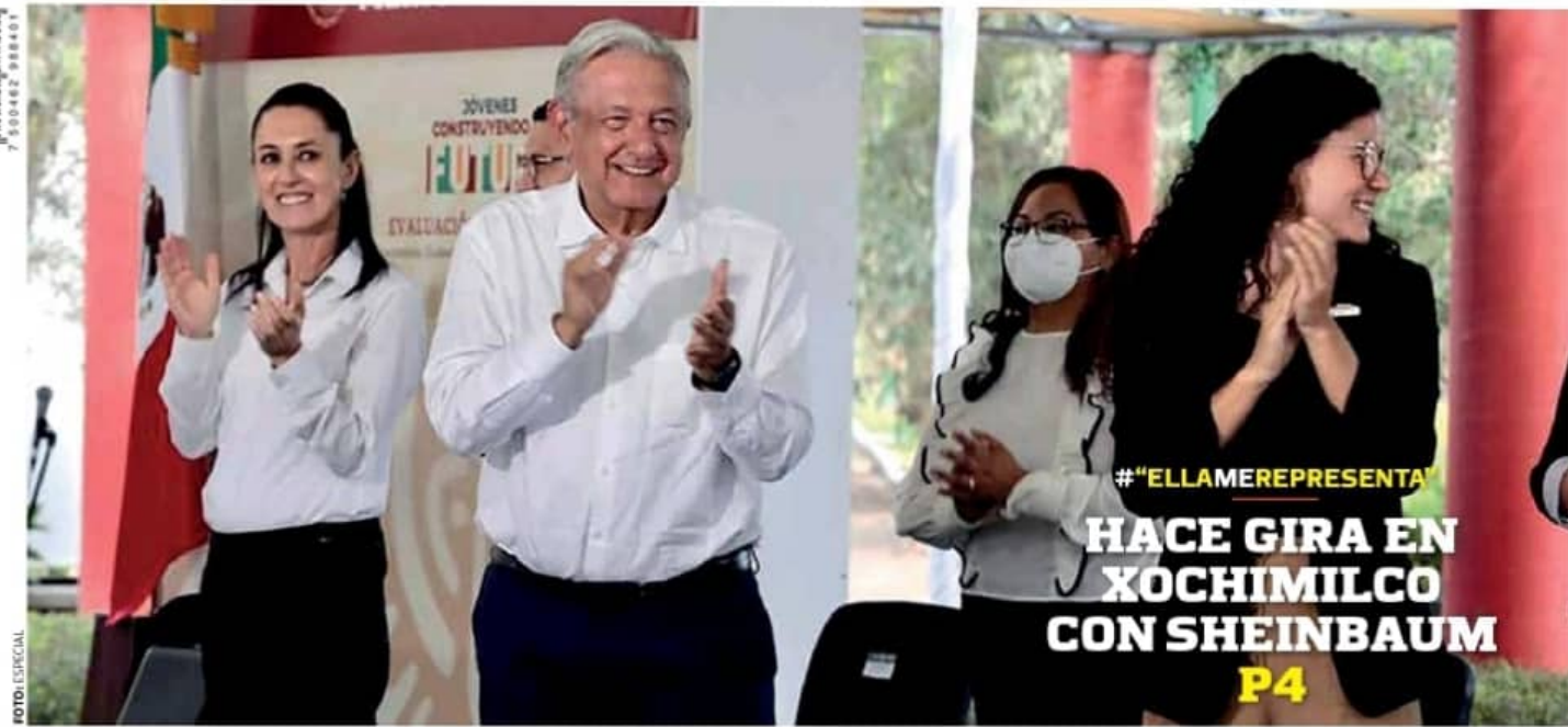
#"ELLAMEREPRESENTA" HACE GIRA EN XOCHIMILCO CON SHEINBAUM P4