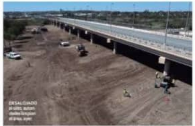
DESALOJADO al sur, están desde tiempos el área, ayer.

Pide a la ONU intervenir también más de mil campos para coronavirus, no está en marcha en la CDMX, dice Sheinbaum no abris albergues pág. 11