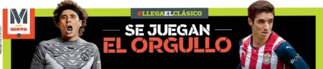
#LLEGAELCLÁSICO SE JUEGAN EL ORGULLO