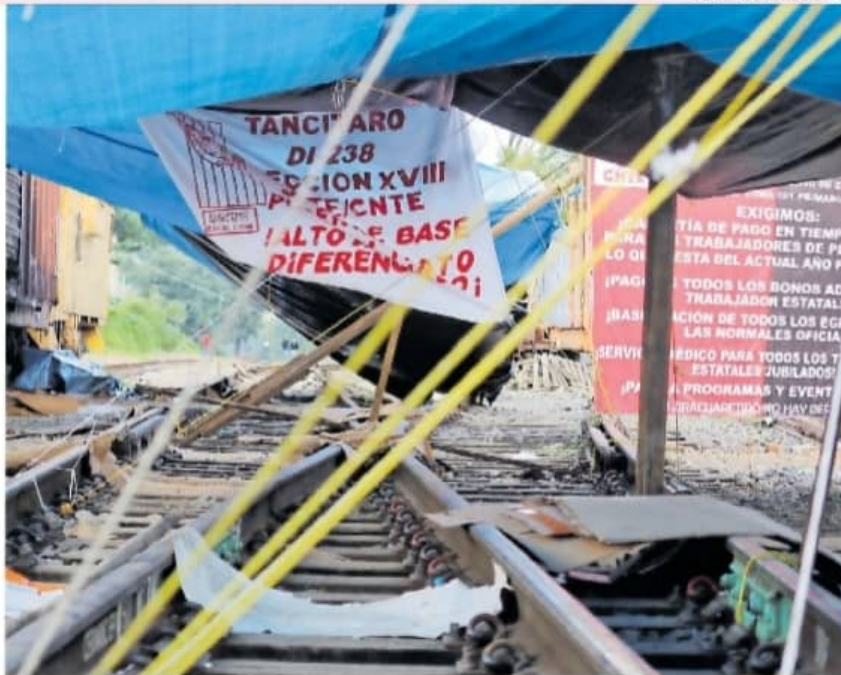
El bloqueo más persistente es en la comunidad de Caltzontzin, en Uruapan.