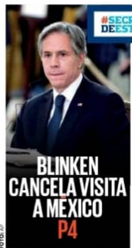
#SECRETARIO DE ESTADO BLINKEN CANCELA VISITA A MÉXICO P4