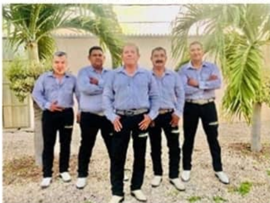
Los Hermanos Arellano, del merittito Zirándaro, Gro., preparan ya el lanzamiento de su disco musical número 34.