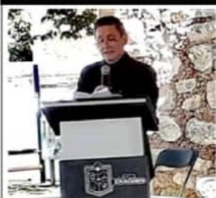
Primer aniversario de la revista "Linterna"