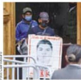
Acudieron a Palacio Nacional. Mañana se cumplen siete años de la desaparición de los normalistas.