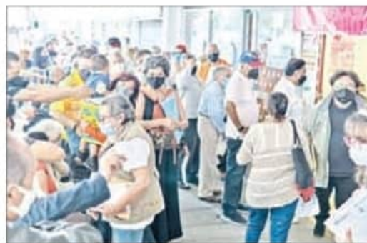
▲ Larga espera en la colonia Narvarte.