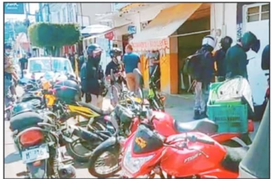
CAPTURA DEL VIDEO DEL GRUPO TIGRES