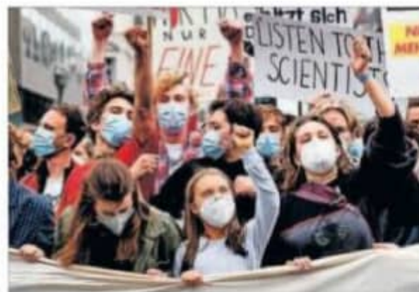
Manifestación del movimiento Fridays for Future contra la crisis climática.

El socialista Olaf Scholz partía con ventaja en la campaña, pero su margen se ha ido estrechando y ayer era de apenas un punto. La incertidumbre es máxima antes de que abran las urnas. El fin de la campaña coincidió con una gran movilización de jóvenes activistas contra el cambio climático en Berlín y cientos de