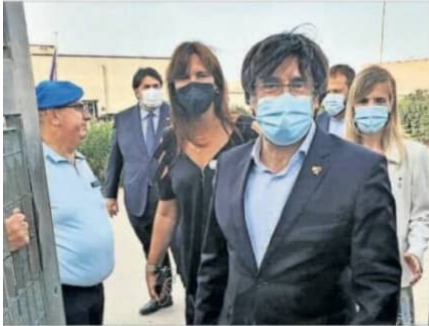
Carles Puigdemont abandonaba ayer la prisión de Bancari, en Cerdeña, tras la decisión del tribunal. P.17

BABELIA El enigma y todas las contradicciones de Andreu Nin