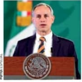
#ENTRE12Y17AÑOS EN OCTUBRE, VACUNAS A MENORES P7