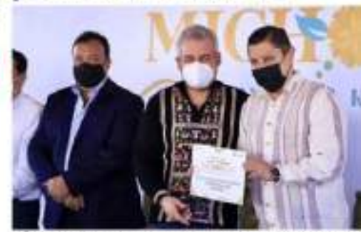
PÁTZCUARO, MICH.- El gobernador, Alfredo Ramírez Bedolla, entregó recursos a pueblos y comunidades que organizan eventos con motivo del Día de Muertos; este año los apoyos fueron por el doble del 2020, y Uruapan recibió,