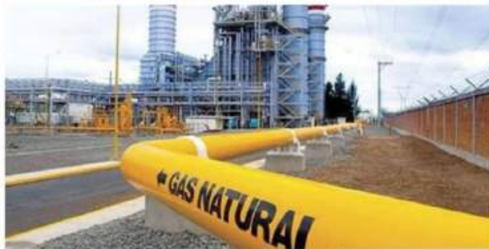
EL APODERADO LEGAL de Destiladora del Valle denunció que Pemex abandonó al 70% de sus clientes.