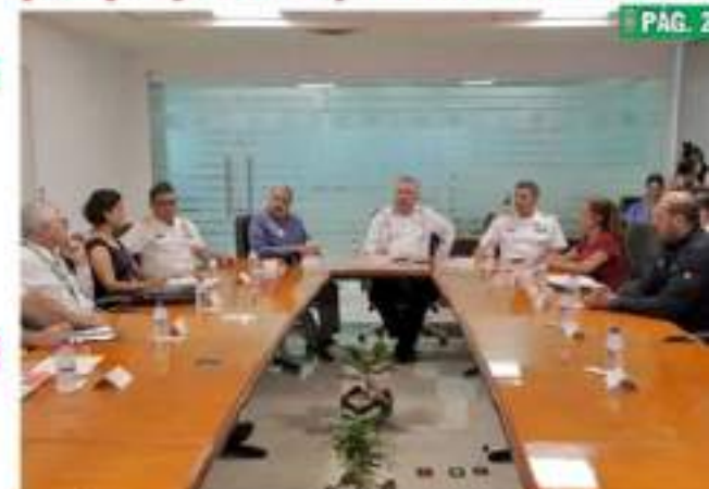
CD. LÁZARO CÁRDENAS, MICH.- Apilac y el Gobierno del Estado de Michoacán establecieron coordinación para proyectar al Puerto Lázaro Cárdenas.

Prevé gobierno estatal establecer padrón único Para atender a población en situación de vulnerabilidad PAG. 10