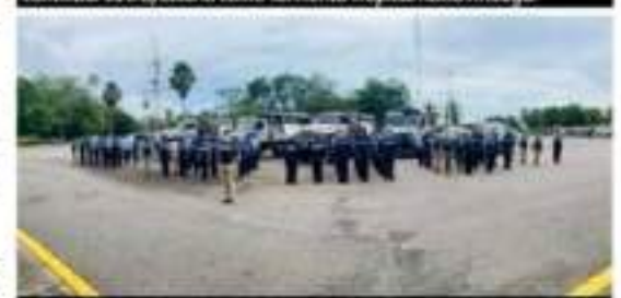
Elementos de la Décima Zona Naval, por indicaciones de la Semar, activan desde ayer el Plan Marina, en fase de prevención, por lo que pudiesen pasar a consecuencia de entrada a tierra en esta región del huracán Rick.