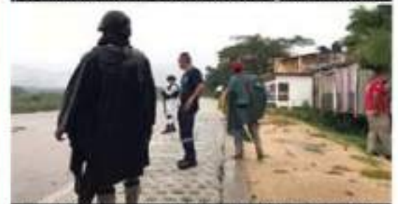
Personal de la Guardia Nacional, desde ayer activaron el Plan de Asistencia a la Sociedad en Casos de Emergencia.