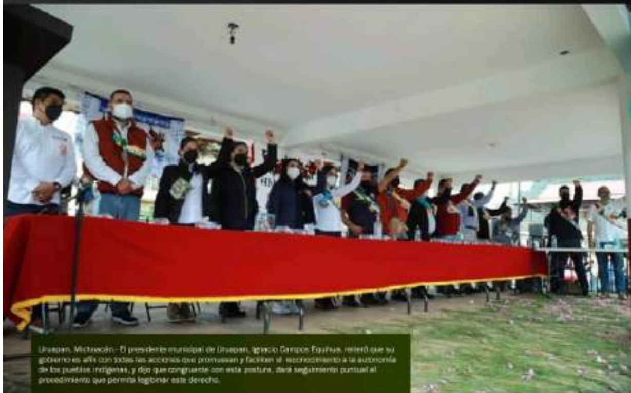
Uruapan, Michoacán.- El presidente municipal de Uruapan, Ignacio Campos Equihua, reiteró que su gobierno es afín con todas las acciones que promuevan y faciliten el reconocimiento a la autonomía de los pueblos indígenas, y dijo que congruente con esta postura, dará seguimiento puntual al procedimiento que permita lograr este derecho.