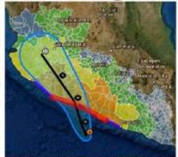
De acuerdo al pronóstico del SMN al huracán Rick, categoría 1, entrará a tierra en la madrugada de hoy lunes por puerto Lázaro Cárdenas, para continuar su trayectoria como Tormenta Tropical hacia Arteaga.

El día de hoy empezaron los registros para jefes de tenencia y encargados del orden en este municipio, a esto se le puede decir que es la antecala de la elección del 2024, y aunque los partidos no tienen >>> 4