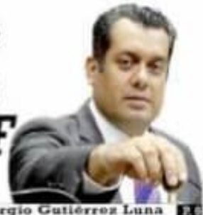
Sergio Gutiérrez Luna

AMLO reitera que Evelyn Salgado, gobernadora de Guerrero, tendrá el apoyo del Gobierno Federal