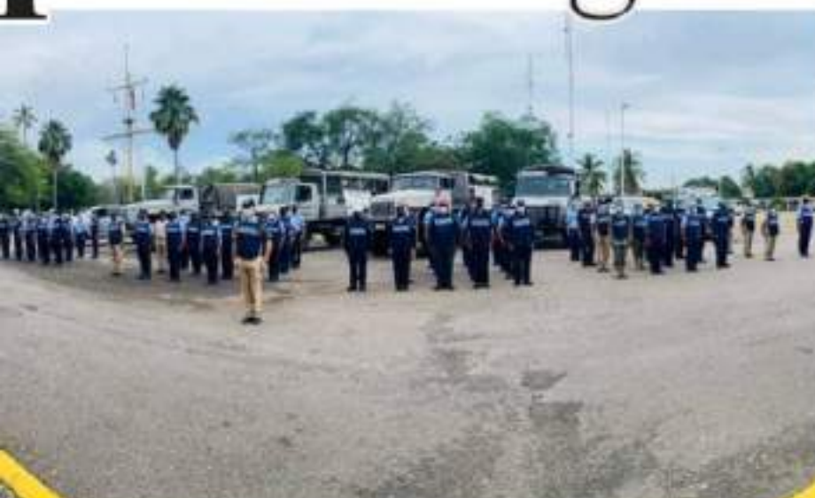
CD. LÁZARO CÁRDENAS, MICH.- Ante la presencia del huracán "Rick" en las costas del Estado de Michoacán, se activó el Plan Marina en fase de Prevención.

Habilita gobierno estatal albergues temporales en LC PAG. 2