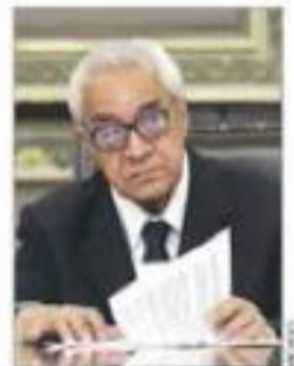
LABOR. Asistieron secretarios y el encargado de despacho de la FGE

El líder nacional, Marko Cortés, señaló a Morena de querer negociar la propuesta de gubernatura interina de Puebla a cambio de obtener el apoyo de Acción Nacional para extender el periodo de mandato en Baja California PUEBLA P. 8