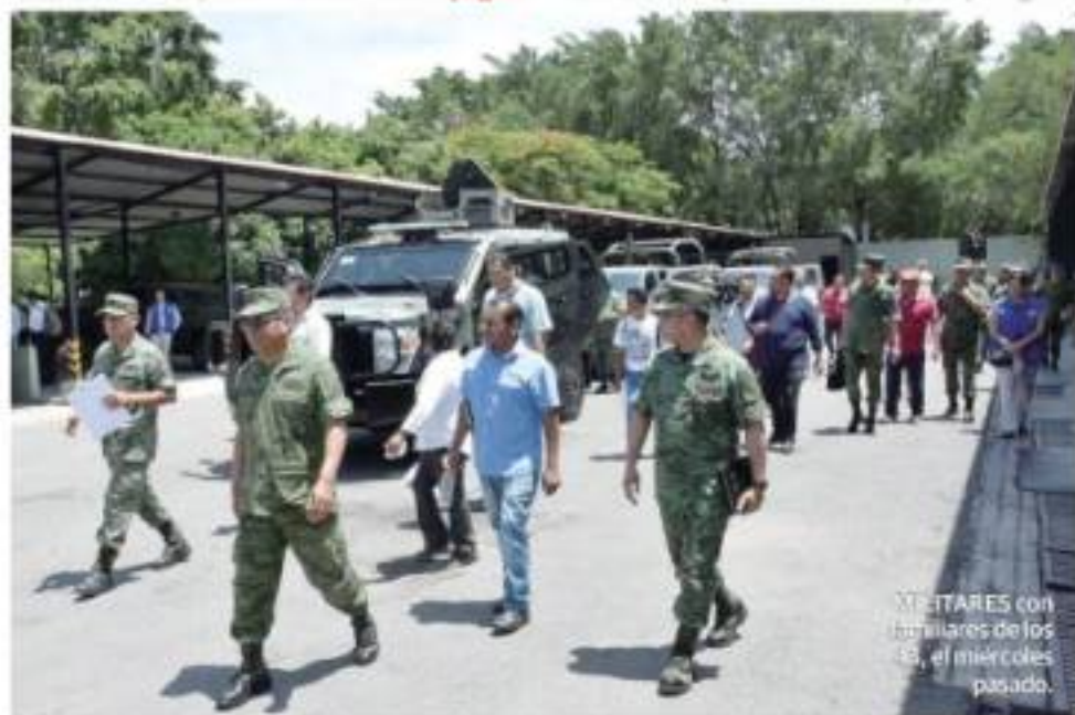
MILITARES con familiares de los 43, el miércoles pasado.

• Ponen lupa a altos funcionarios tras denuncias de CNDH; afirma el jefe de la oficina especial para Iguala