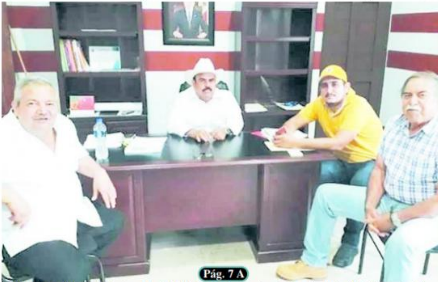
Pág. 7 A

□ Beneficiaron a los integrantes de la Asociación de usuarios de riego Benito Juárez de Antúnez