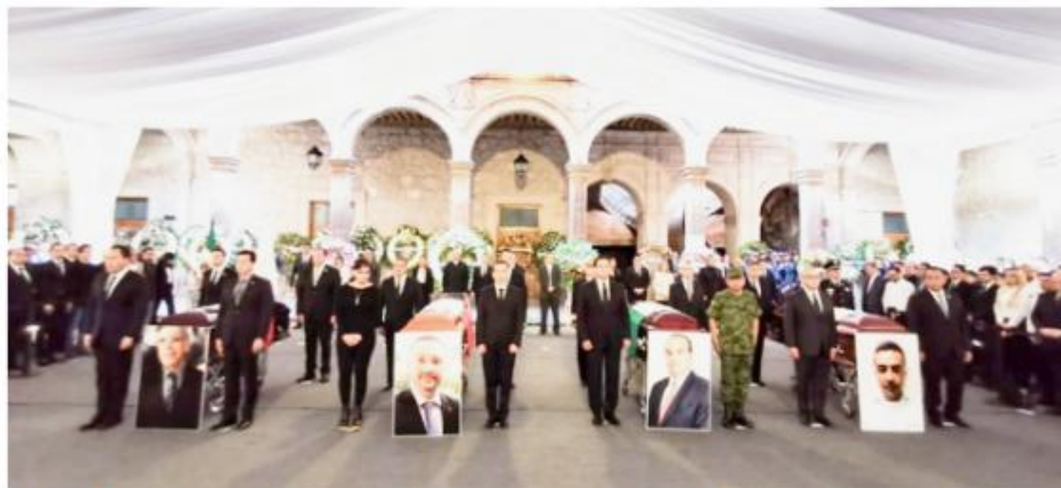
MORELIA, MICH.- Aspecto del Homenaje de Cuerpo Presente que se le realizó hoy en Palacio de Gobierno a los 4 fenecidos del accidente aéreo de ayer en Villa Madero.