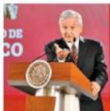
Enunció al peso. J. CABRILLO

El Presidente señaló que en su reunión del miércoles con empresarios hizo un "reclamo fraterno" por el caso TransCanada. PÁG. 6