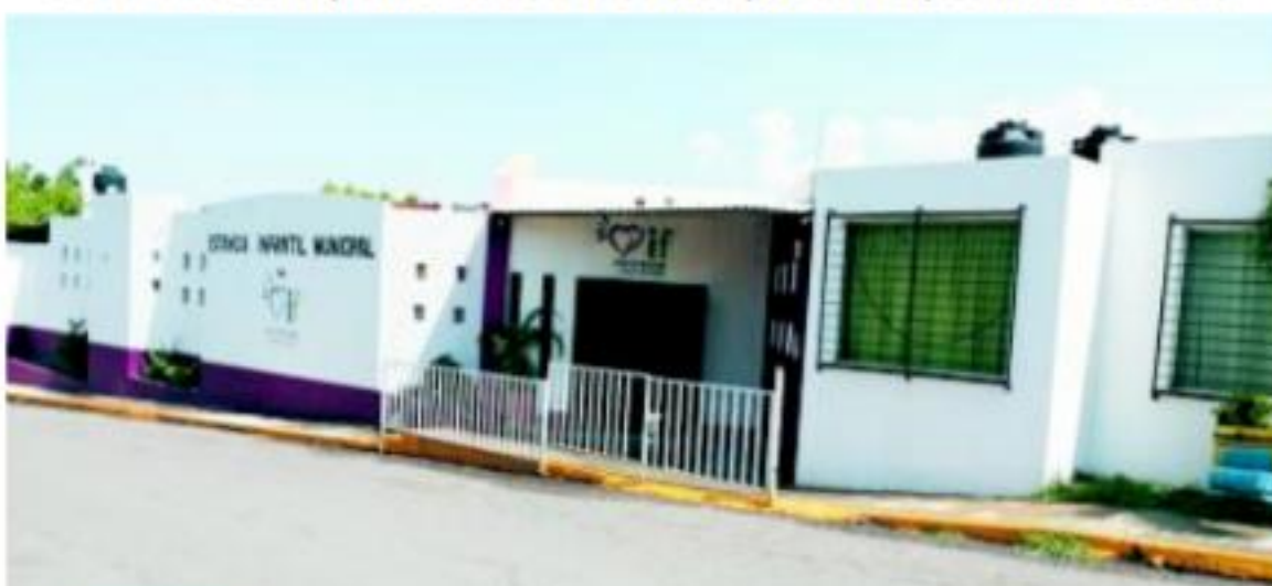
Pág. 2 A

□ El inmueble permanecerá cerrado por un espacio de 15 días