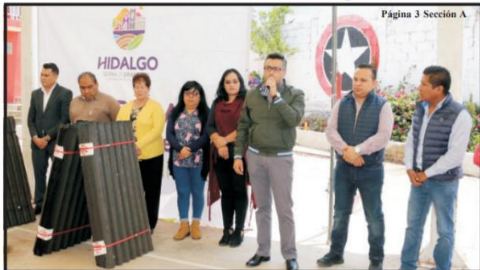
Página 3 Sección A