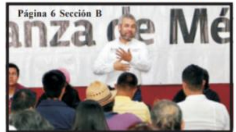
Página 6 Sección B

Continúa Jefatura Regional de Hidalgo con actividades de vinculación municipal