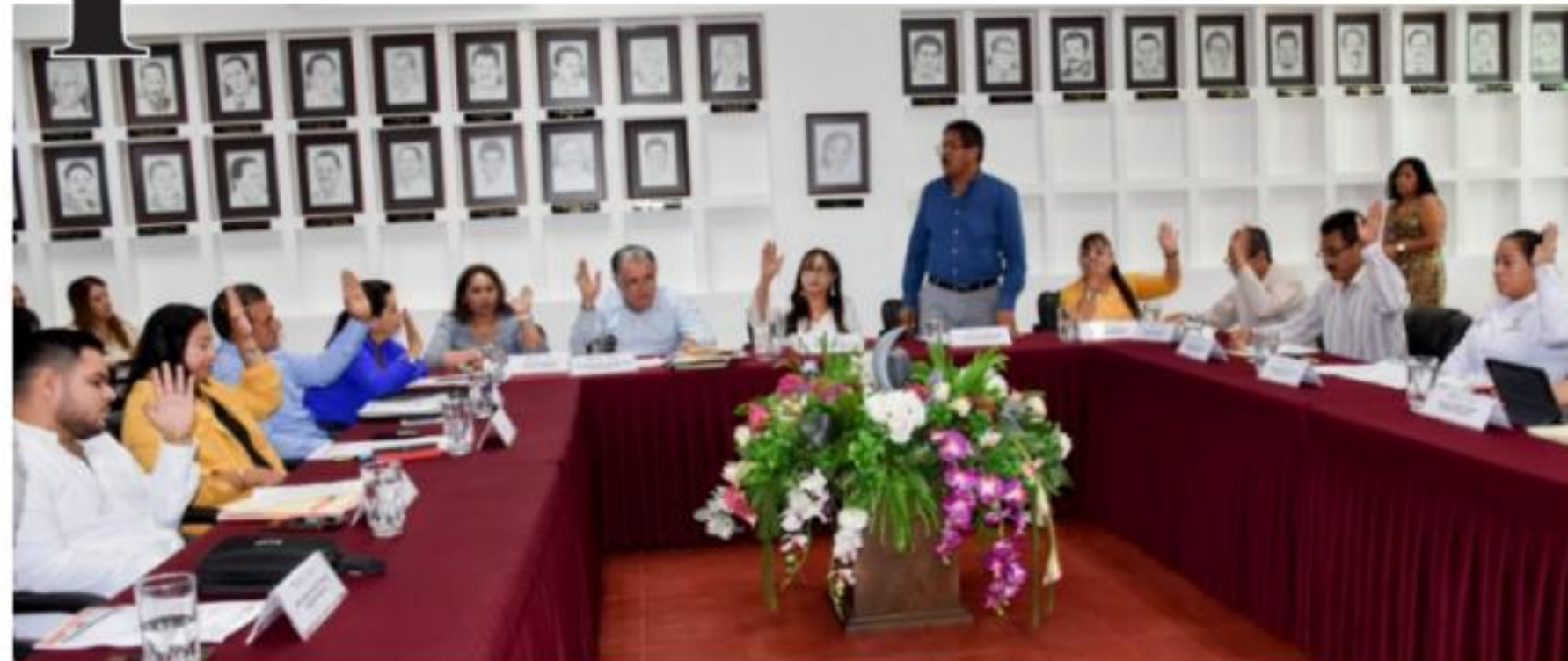
CD. LÁZARO CÁRDENAS, MICH.- Por mayoría de votos, el Órgano de Gobierno autorizó la ampliación y modificación del Presupuesto de Ingresos Egresos para el Ejercicio Fiscal 2019.

La acción financiera para LC fue aprobada en sesión extraordinaria de Cabildo La alcaldesa explicó que la medida se aplicó debido a la buena recaudación PÁGINA 4