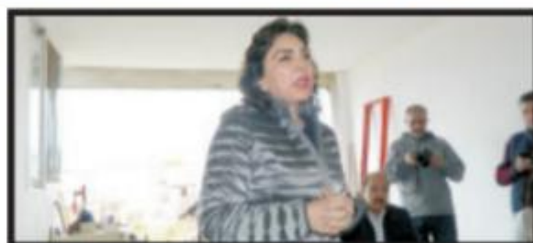
Página 4 Sección A