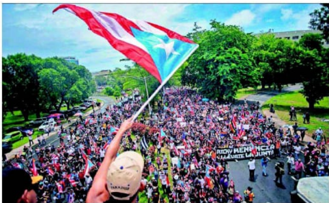
Vista de la marcha en San Juan, un día después de la dimisión del gobernador Rosselló.

Una partida de 80 días que al final nadie ganó PA