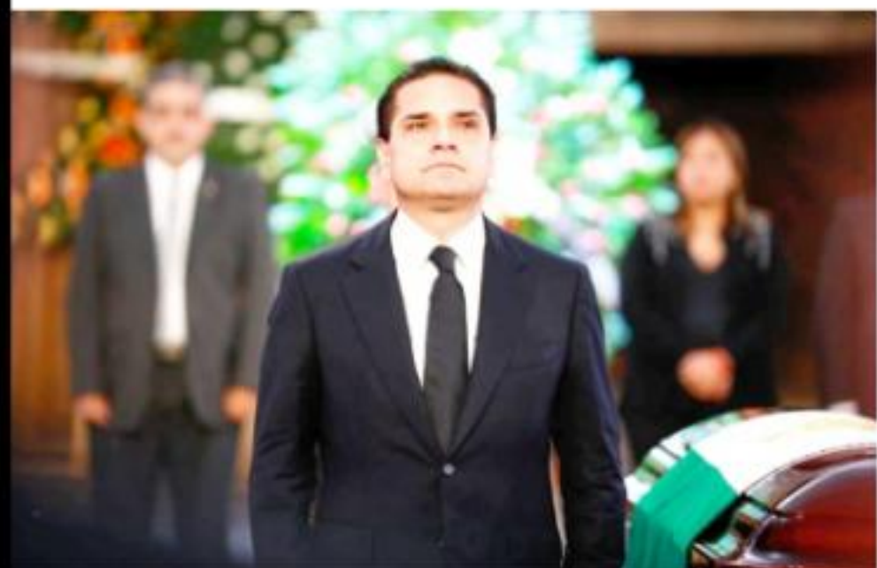
MORELIA, MICH.- El gobernador de Michoacán, Silvano Aureoles Conejo, expresó que "todos se la jugaron por Michoacán y ayudaron a cambiar el rostro del estado, incluso cuando no nacieron aquí".

Finalmente, señaló que honrará la memoria de los finados con el trabajo necesario para lograr el Michoacán que ellos soñaron; "muchos de sus colegas también sienten la pérdida", cerró.