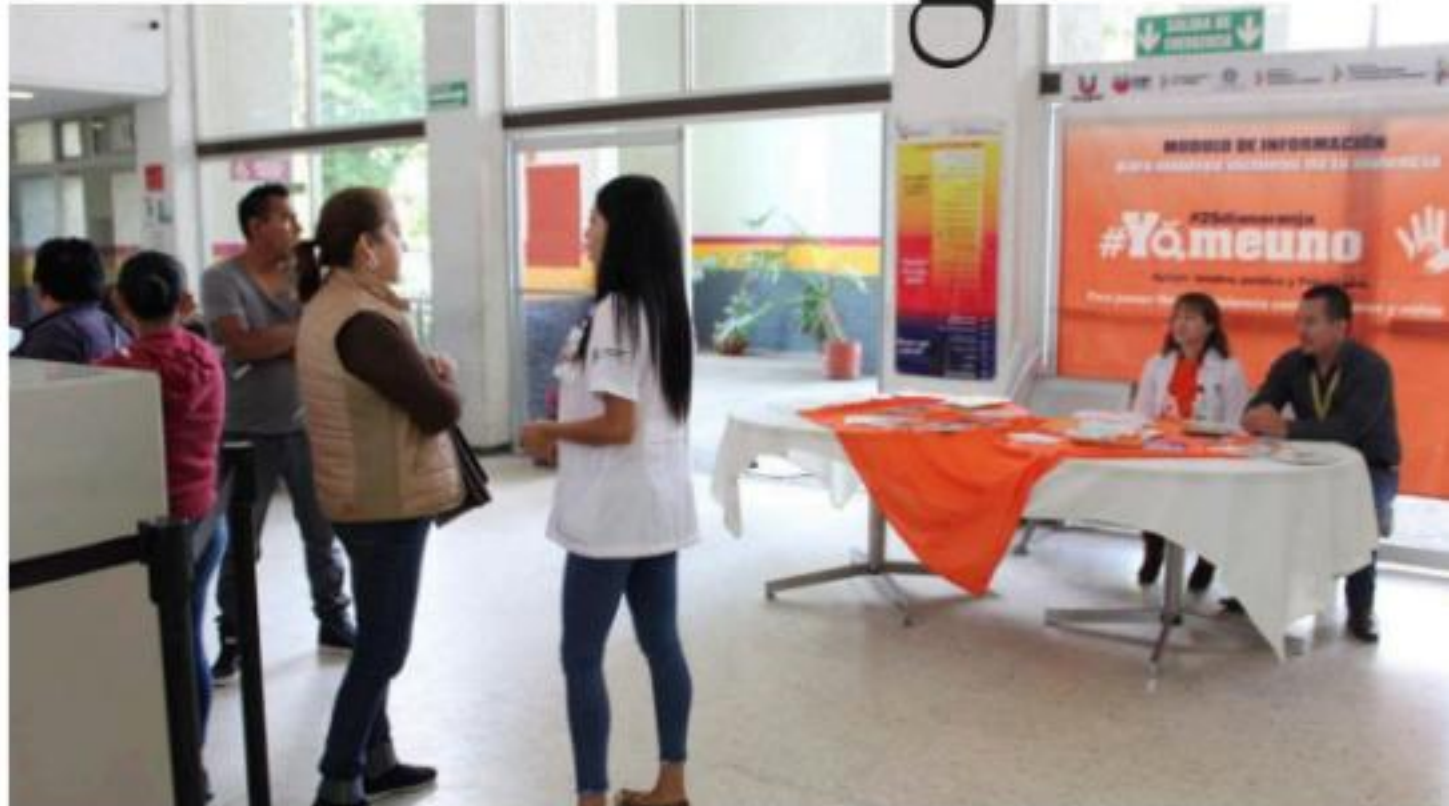
URUAPAN, MICH.- El gobierno municipal, que preside Víctor Manuel Manríquez González, refuerza su estrategia para combatir la violencia de género.

Como cada día 25 de cada mes, de las nueve a las catorce horas se llevó a cabo esta dinámica de divulgación sobre medidas para que la sociedad detecte de manera oportuna casos de violencia de género, así como para dar a conocer los servicios y programas que estas instituciones de gobierno ofrecen de manera gratuita a todas aquellas niñas y mujeres que requieran de ellos.