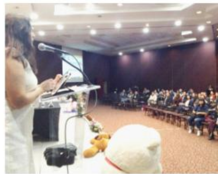
MORELIA, MICH.- Se inauguró el 25º Congreso de Pediatría.

muerte infantil son previsible, Michoacán ha reducido la muerte neonatal por asfixia y se ha colocado como los primeros estados con menos muertes", cerró.