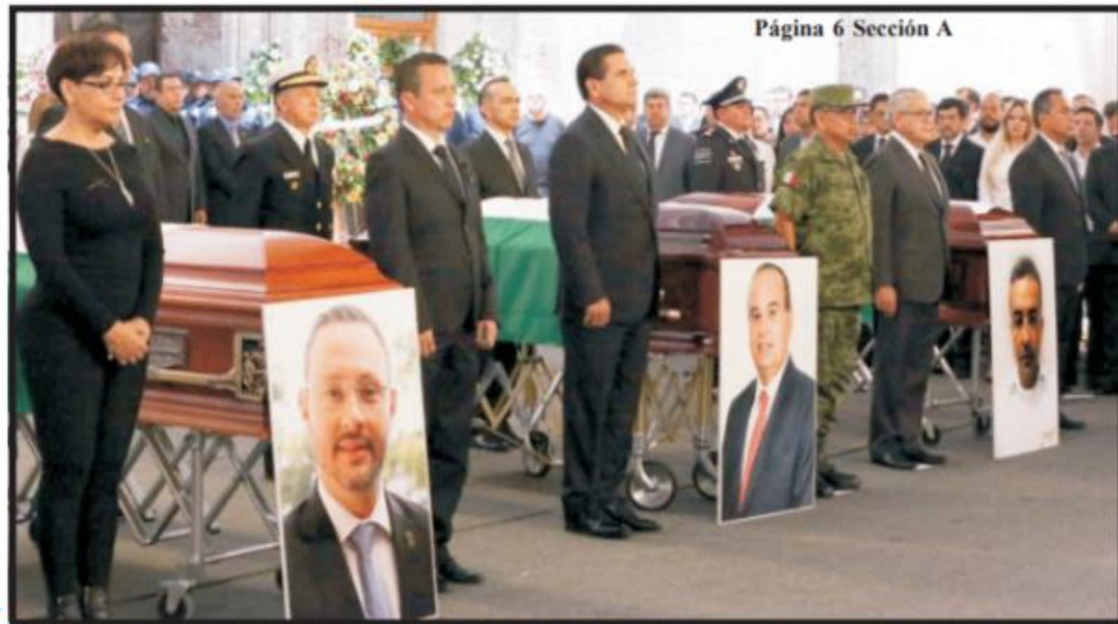
Página 6 Sección A