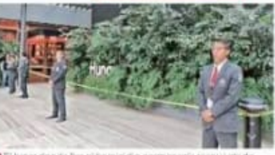
El lugar donde fue el homicidio permanecía resguardado.