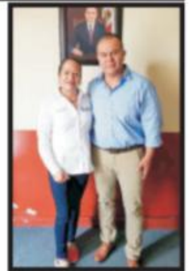
Página 7 Sección B

Continúa Jefatura Regional de Hidalgo con actividades de vinculación municipal