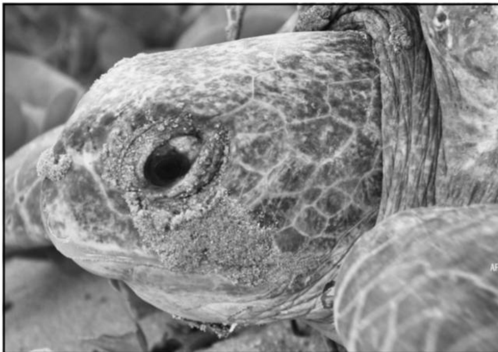
La UMSNH es sede de la segunda Reunión Internacional sobre Tortugas Marinas del Pacífico Oriental Tropical.

De entonces acá, las acciones conjuntas entre los biólogos de la UMSNH y las comunidades indígenas de costa Michoacana, han logrado que en la actualidad la población de tortuga negra del Pacífico michoacano, sea considerada un éxito de conservación por la Sociedad Internacional de Tortugas Marinas y el Servicio de Pesca y Vida Silvestre de