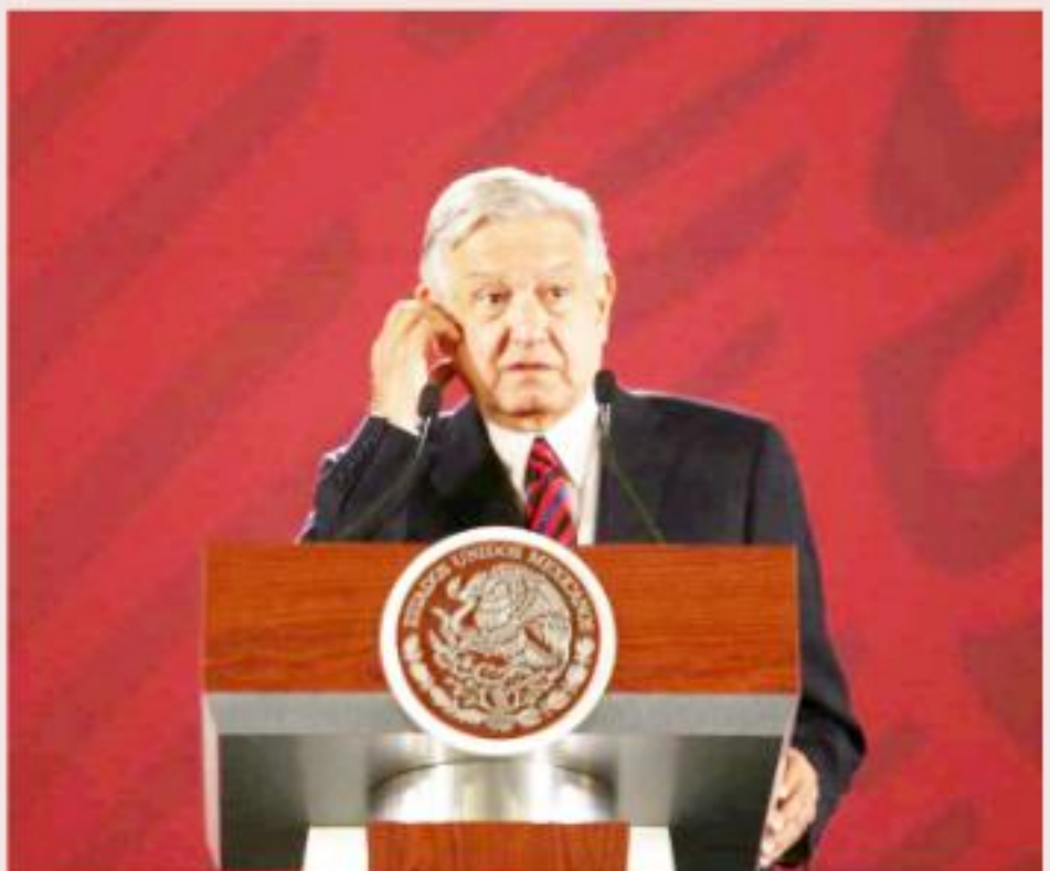
MORELIA, MICH.- El presidente Andrés Manuel López Obrador lamentó el accidente aéreo mediante un mensaje breve en su conferencia matutina.

Y finalmente, señalar que en la conferencia de prensa el presidente firmó bajo notario que no se reelegirá: "no les concederé nada a mis contrincantes", cerró.