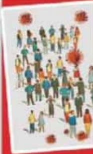
Ilustración: Jesús Sánchez