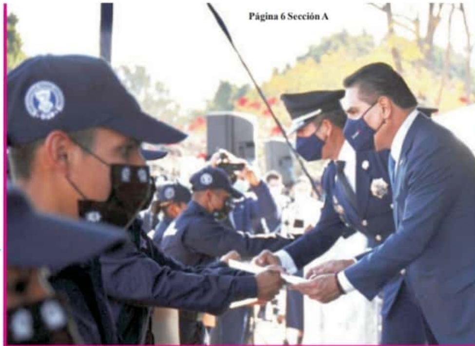
Página 6 Sección A