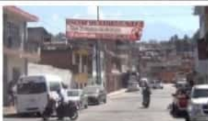
Siguen los robos en la calle Artillería 13