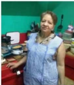
Doña Mary 13