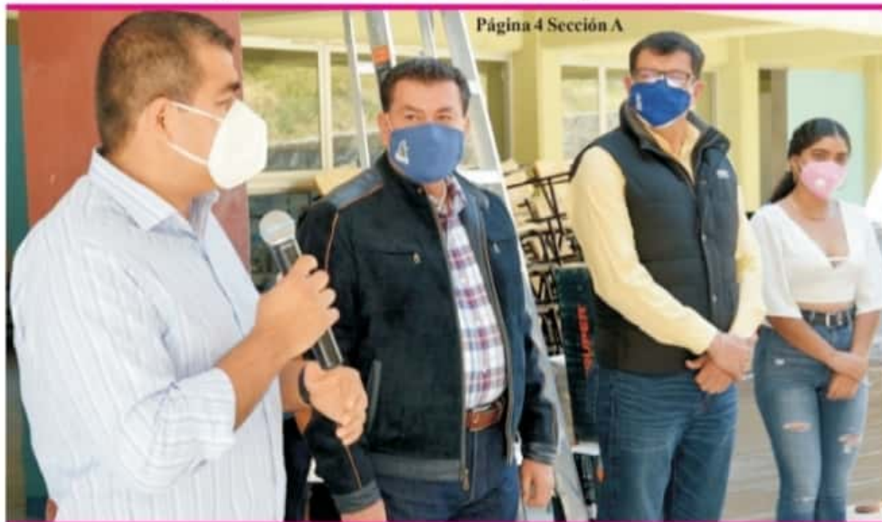
Página 4 Sección A