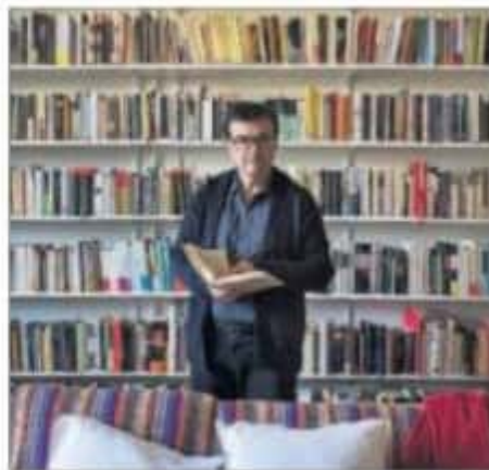
Javier Cercas en su casa de Madrid. PÁGINA 14

Las cartas inéditas del editor Jorge Herralde