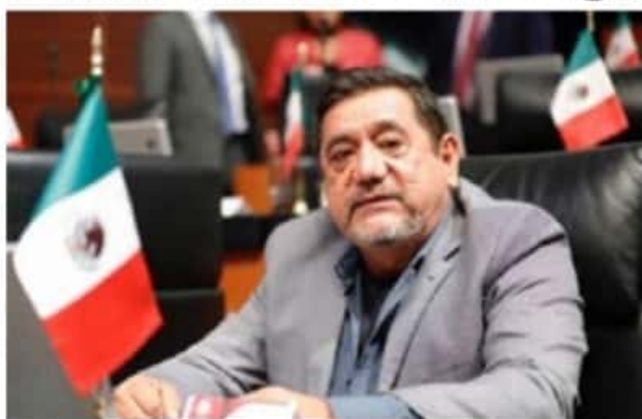
Finalmente se impuso el clamor general, y la comisión de Honor y Justicia de Morena, determinó quitar la candidatura a gobernador de Guerrero a Félix Salgado Macedonio, por los señalamientos de violador de que ha sido objeto, aunque los delitos ya hayan prescrito.

A través de un escrito que se entregó a la dirigencia nacional de Morena, a la Comisión Nacional de Honestidad y Justicia del partido así como a la Comisión Nacional de Elecciones, se