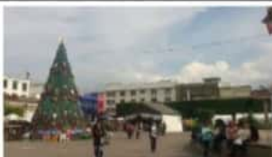
Plaza Cívica Benito Juárez 10