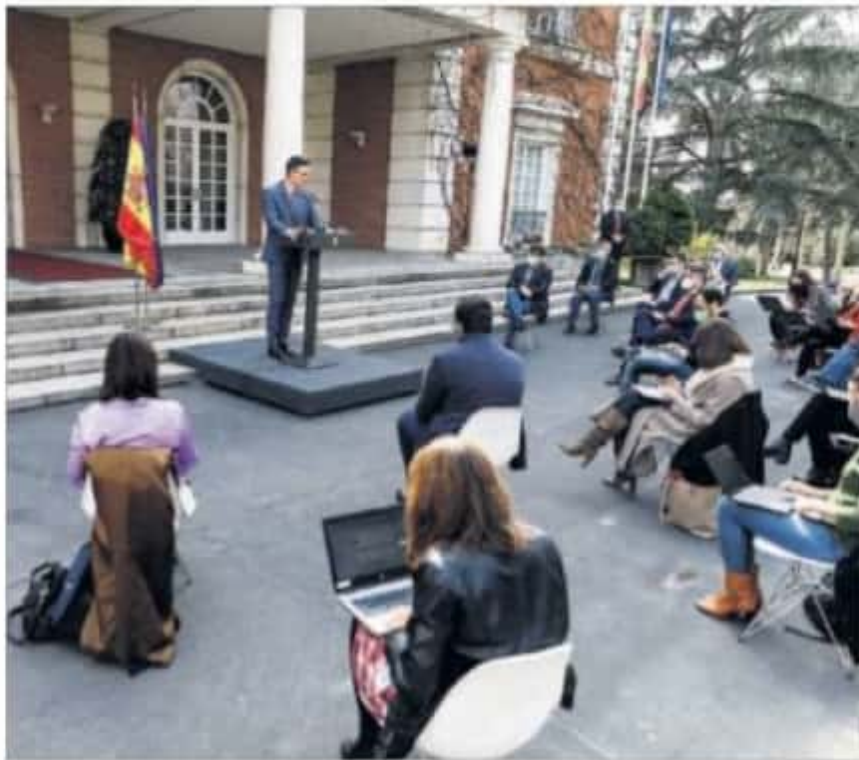
RUEDA DE PRENSA AL PIE DE LAS ESCALINATAS DE LA MONCLOA. El presidente del Gobierno dio ayer su primera rueda de prensa en dos meses. Lo hizo con los periodistas en semicírculo para guardar la distancia de seguridad y al aire libre, aprovechando el buen tiempo en Madrid. PÁGINA 12

Una decena de empresarios y amigos íntimos del rey emérito han contribuido a pagar los 4,4 millones de euros de la regularización. En un principio se contactó con una treintena, pero muchos de ellos no llegaron a tiempo de ultimar los trámites. La fórmula elegida es la de préstamos —muchos firmados ante notario— y no donaciones. De esa manera se evita pagar un 40% de impuestos. PÁGINAS 12 Y 13