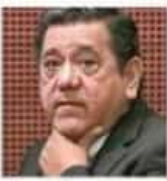
Félix Salgado Macedonio @fmsalgado 20:00:00 ¡Ánimo compañeras y compañeros! ¡Hay Toro!