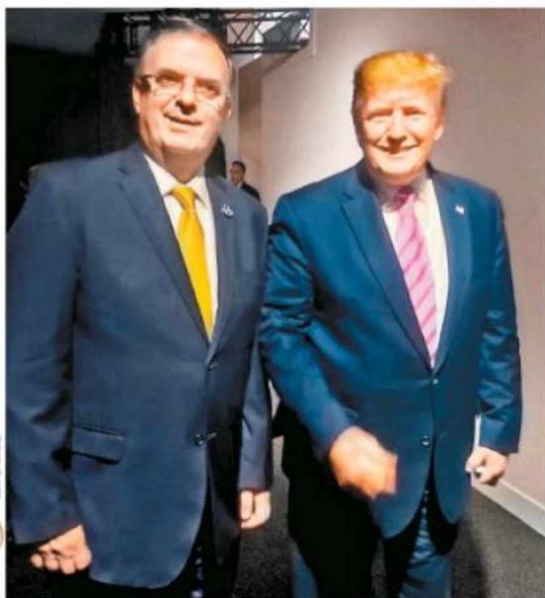
Marcelo Ebrard, titular de la SHG, saludó al presidente de EU a su llegada a la cumbre del G20.