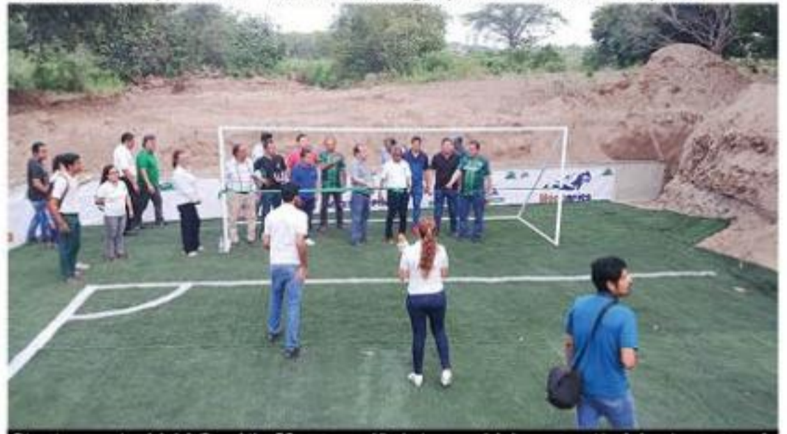
Directivos y socios del club Cocodrilos FC, cortaron el listón inaugural de la construcción de la primera etapa de lo que será su estadio de fútbol.