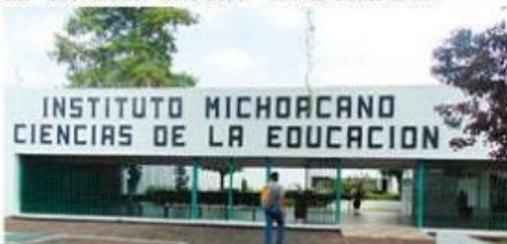
Los posgrados serán ofrecidos en todas las sedes del IMCED en el estado.