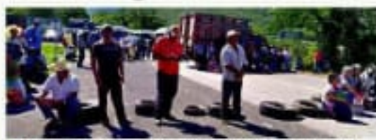
La carretera Tixtla-Chilapa fue bloqueada ayer siete horas.

El lunes, en ese mismo lugar fueron saqueadas las