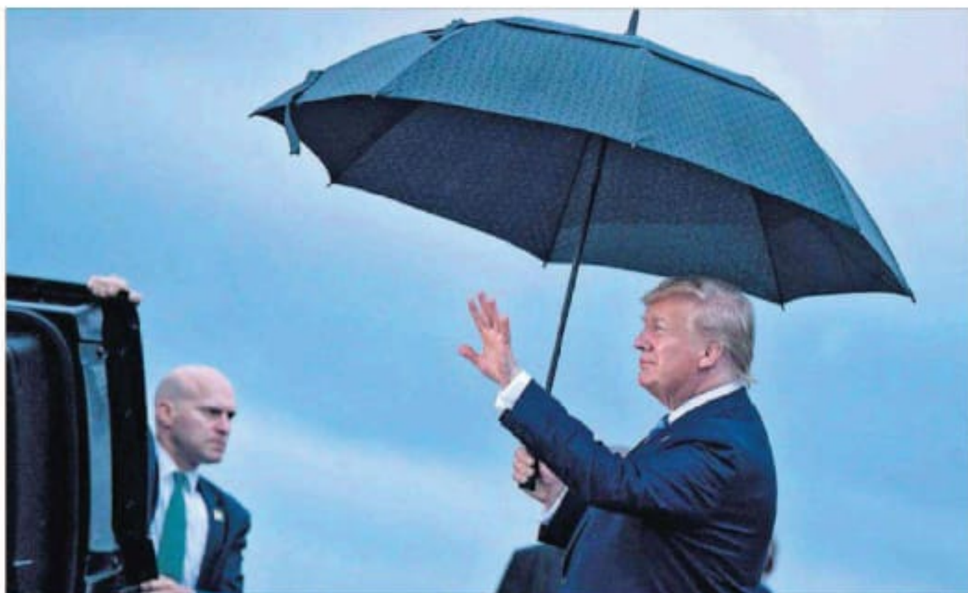
El presidente de EE.UU., Donald Trump, llega ayer al aeropuerto de Osaka.