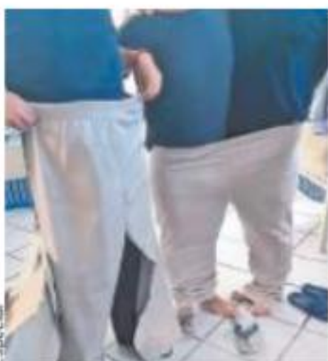
Entregan a agentes pantalones en los que caben 2 personas. Pág. 8

• La Jefa de Gobierno de la CDMX aseguró el 20 de junio que los problemas deben ser atendidos ahora; no se trata de echarle la culpa a los anteriores; hay que ponerse a trabajar, expresó.