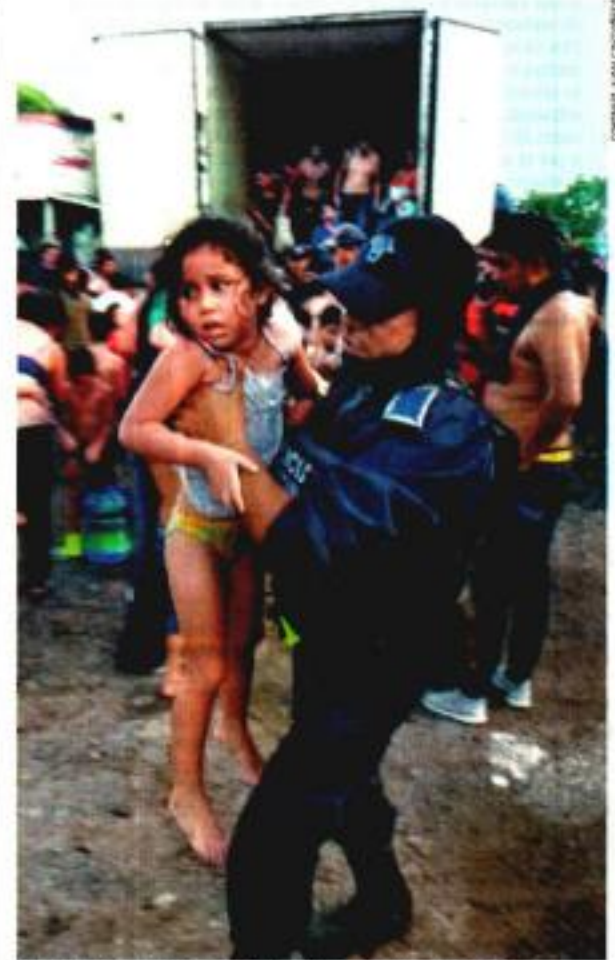
Los migrantes rescatados, entre los que se encontraron 71 niños, presentaban signos de deshidratación.

● Fueron hallados en Veracruz; en Tapachula, cierran albergue migratorio