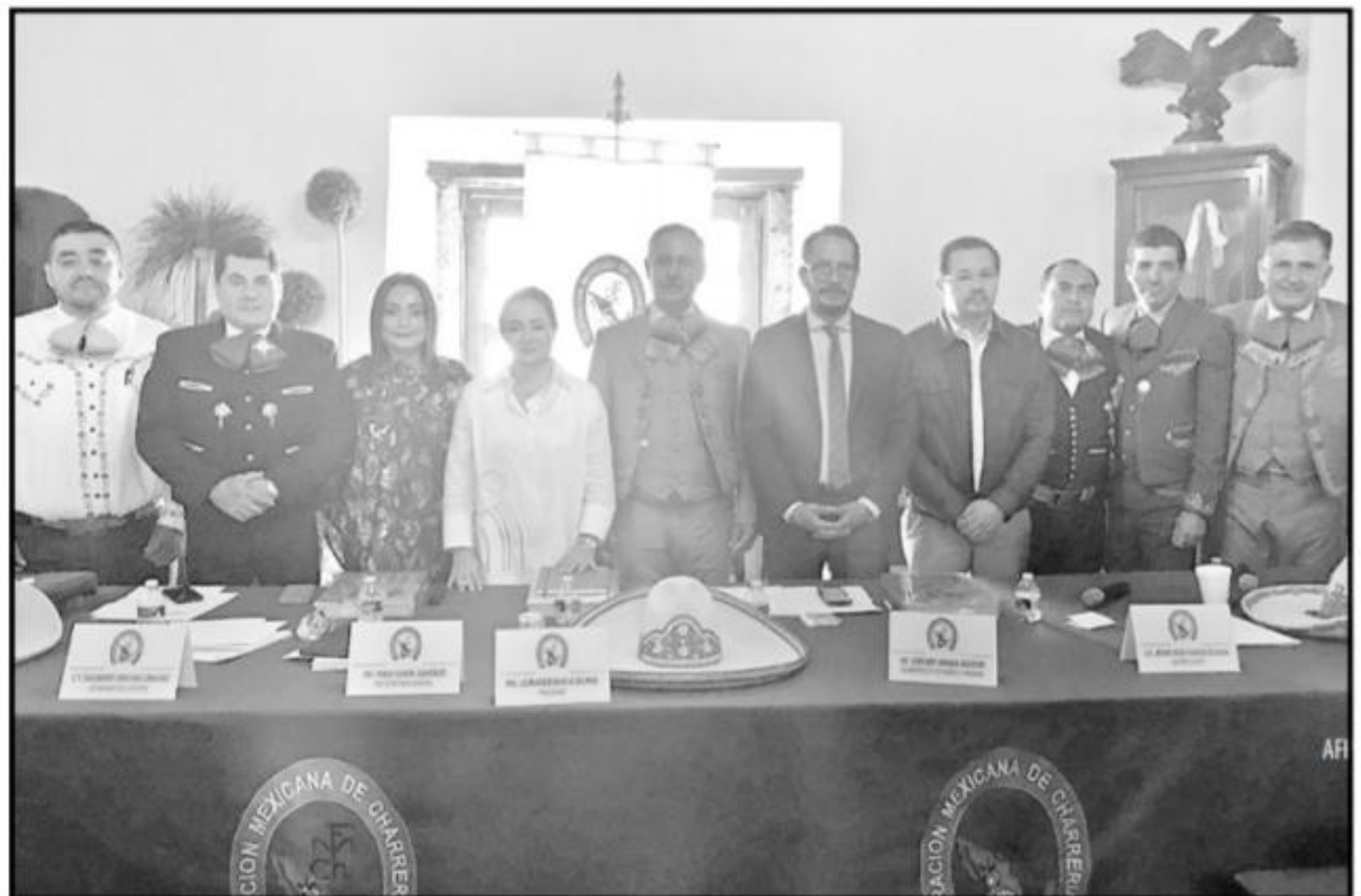
La delegación michoacana refrenda el respaldo del gobierno del estado para coadyuvar en el éxito de este magno evento en Morelia.

nacional congrega en promedio a más de 120 mil personas a lo largo de los 23 días que tienen de duración, por lo que por tercera vez, Michoacán recibirá equipos procedentes de toda la República mexicana y, allende la frontera norte, de Estados Unidos y Canadá.