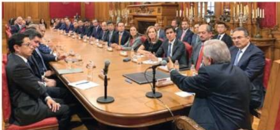
EL PRESIDENTE, ayer, con el titular de Pemex (der.) y los representantes de instituciones bancarias.

El mandatario firma la renovación de líneas de crédito revolventes por 8 mmdd con tasas de interés bajas; CEO de HSBC subraya que este acuerdo demuestra la confianza de los banqueros en el Gobierno pág. 16