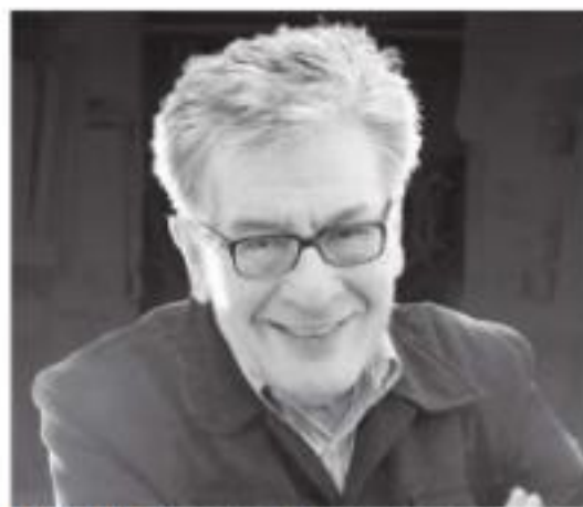
El escritor José Emilio Pacheco, en una imagen de archivo.

COMO NO PUEDO traer aquí al joven que leyó No me preguntes cómo pasa el tiempo tengo que recordarlo leyendo esas páginas de poesía. La vida pública había irrumpido por primera vez con toda su fuerza en la vida privada de aquellos jóvenes que se acercaban a los 20 años y que despedían al régimen de Luis Echeverría y escuchaban por primera vez las palabras devaluación, inflación, crisis.