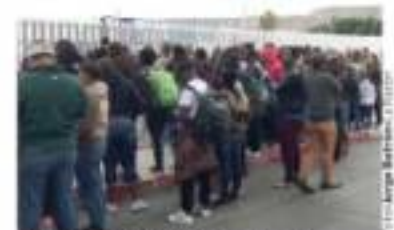
FILA DE SOLICITANTES de asilo, ayer, en Tijuana.

Indocumentados detenidos en veredas fronterizas de Veracruz