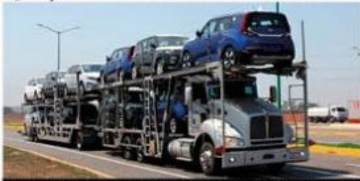
La atención al autotransporte federal de carga terrestre por parte de la APILAC al mes de mayo de este año, registró un incremento del 7% en relación al mismo lapso del año pasado.