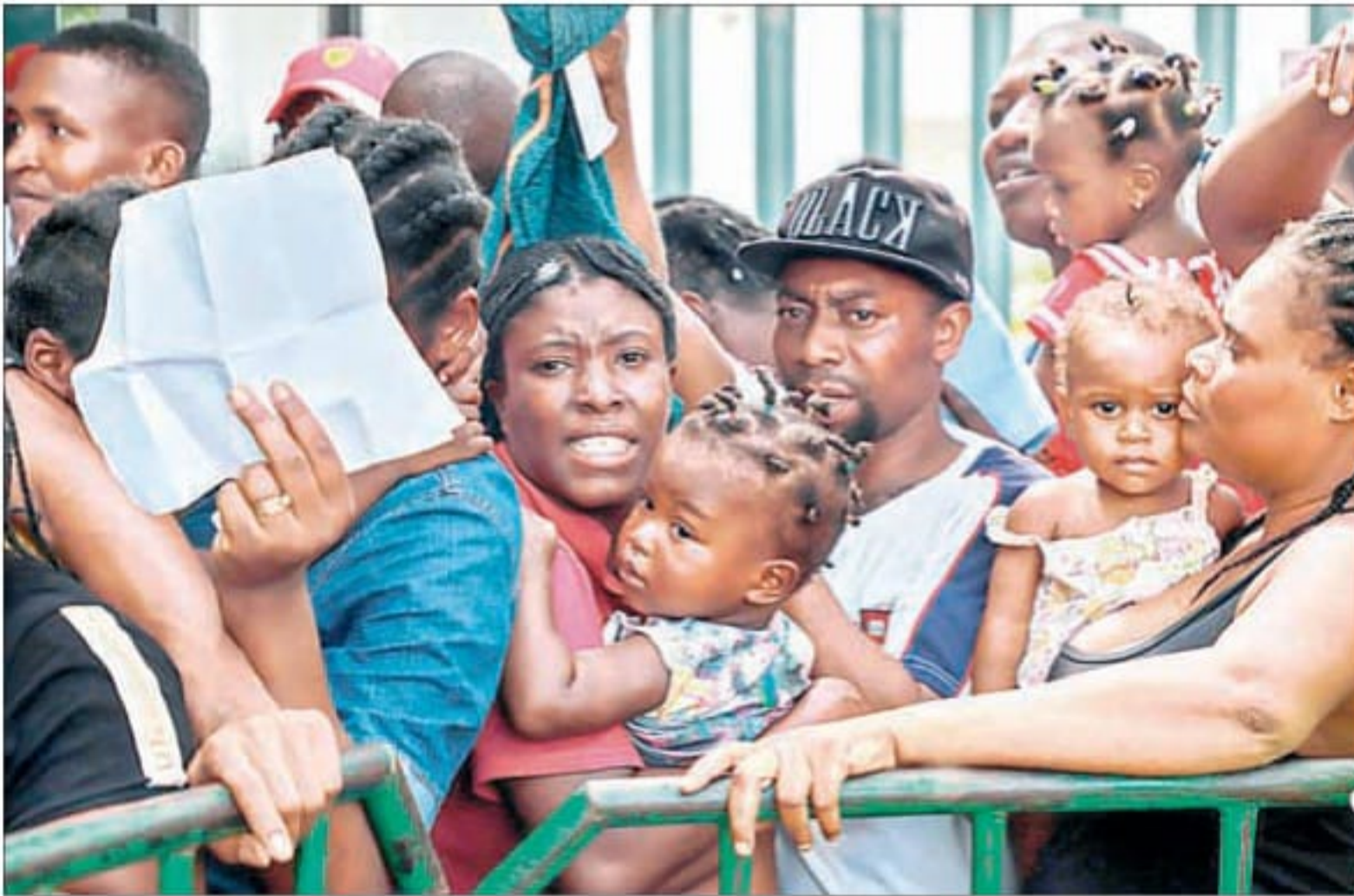
▲ Migrantes de diferentes nacionalidades hacen fila en la estación migratoria de Tapachula, Chiapas, para tramitar una visa humanitaria. Ayer, alrededor de 50 ciudadanos de Haití y de algunas naciones de