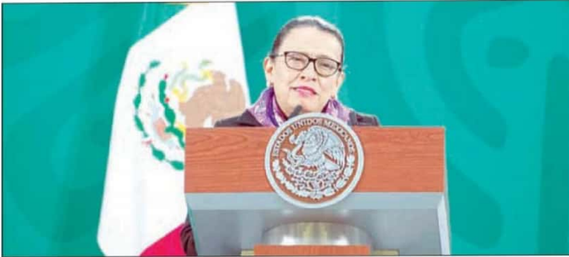
▲ Rosa Icela Rodríguez, secretaria de Seguridad Pública y Protección Ciudadana, señaló en conferencia que se han identificado los lugares