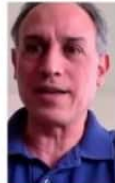
Los titulares o representantes del Colegio de México, UNAM, CEPAL, Instituto Nacional de Ciencias Médicas y Nutrición Salvador Zubirán, OPS y SSA, además los de otras instituciones, durante el seminario en el que se presentaron recomendaciones para enfrentar la pandemia.

El rector de la UNAM afirma que "nuestros más de 150 mil muertos y el exceso de mortalidad son una prueba" ◆ Señala que México enfrenta rezago crónico presupuestal, de infraestructura, cobertura y atención de calidad ◆ Llama a la colaboración productiva y estrecha, a hacer una pausa en el camino y dejar polarizaciones para superar "estos momentos difíciles por el bien de México" ◆ Entregan a López-Gatell el documento Reflexiones sobre la Respuesta de México ante la Pandemia de Covid-19 y Urgencias para Enfrentar los Próximos Retos , elaborado por instituciones como la UNAM, INSP, OPS, Colmex y CEPAL. [ Isaac Torres Cruz ] 16