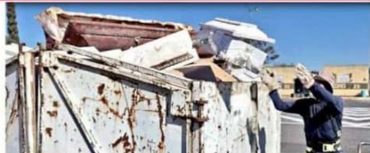
En el panteón municipal de Nezahualcóyotl, en Edomex, diariamente una decena de nichos se desocupan. Los atáides van a un contenedor de basura y los restos a la fosa común. Los nichos vuelven a ocuparse con muertos por Covid.