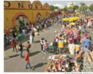
Los ambulantes se instalan en el estacionamiento del centro de abasto. Si no van a laborar, también deben pagar cuota, afirman.

DAN MANITA DE GATO A ENTORNO DE SANTA LUCÍA La Sedetu suma 213 mdp en obras públicas para cinco municipios mexicanos. PRIMERA | PÁGINA 17