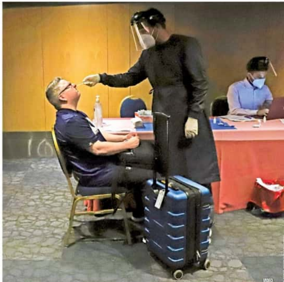
REINA CONFUSIÓN EN EL AICM. Pese a la instalación de módulos para realizar pruebas Covid en el aeropuerto, persiste el caos entre viajeros que van a EU, quienes se han visto obligados a retrasar sus vuelos. MÉXICO P.3