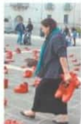
La artista ha hecho de Zipaquirá parte de su símbolo de lucha. | CULTURA | A22

"Vivimos una pandemia de feminicidios hace 30 años. ¿Como es posible que el gobierno no haga nada, que siga siendo parte del problema y no de la solución?"