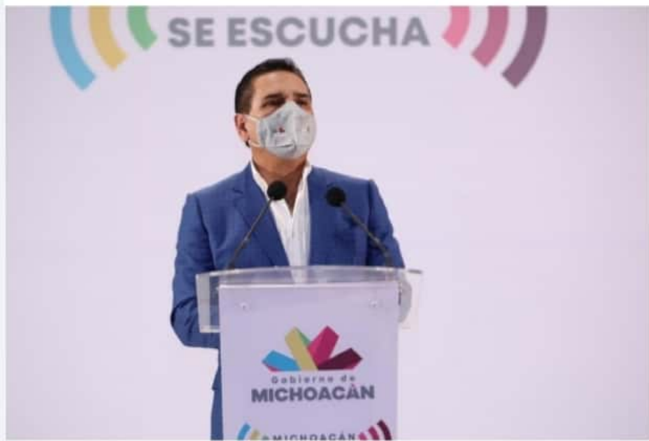
MORELIA, MICH.- El gobernador Silvano Aureoles Conejo, anunció la reactivación del programa de Estancias Infantiles, en solidaridad con los niños y las madres michoacanas.

Gobierno estatal invertirá más de 85 mdp para atender a 12 mil 800 niñas y niños, informó el gobernador, Silvano Aureoles Mayra HURTADO PÁG. 10