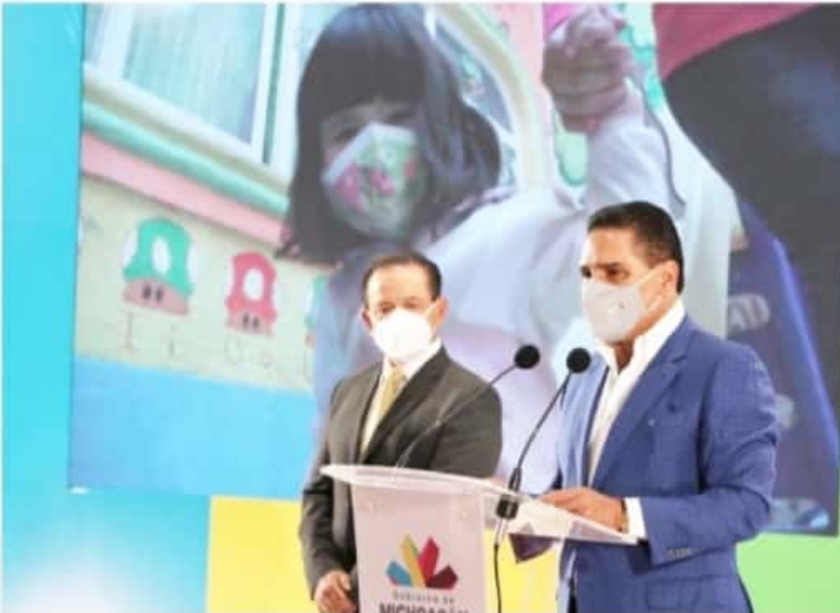
MORELIA, MICH.- Con la reactivación de las estancias infantiles, el gobierno del estado refrendó su solidaridad con los niños y las madres michoacanas que han sufrido por la falta de apoyo federal.

Gobierno estatal invertirá más de 85 mdp para atender a 12 mil 800 niñas y niños, informó el gobernador, Silvano Aureoles