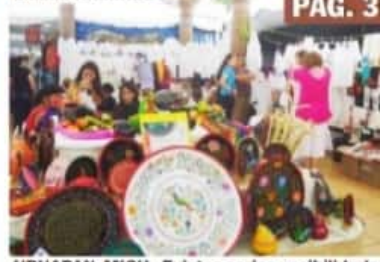
URUAPAN, MICH.- Existen serias posibilidades de que por segundo año consecutivo se suspenda el Tianguis de Artesanías del Domingo de Ramos en Uruapan, debido a la pandemia.