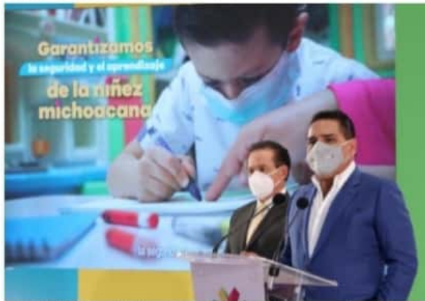
MORELIA, MICH.- el Gobierno del Estado de Michoacán reactivará el programa de Estancias Infantiles que dejaron de percibir recursos del Gobierno federal hace dos años, con una inversión de 85 millones de pesos.

El titular de la Sedesoh precisó que el programa tendrá