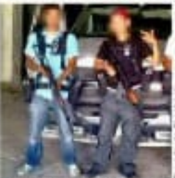
Menores muestran en redes fotos trabajando de sicarios.