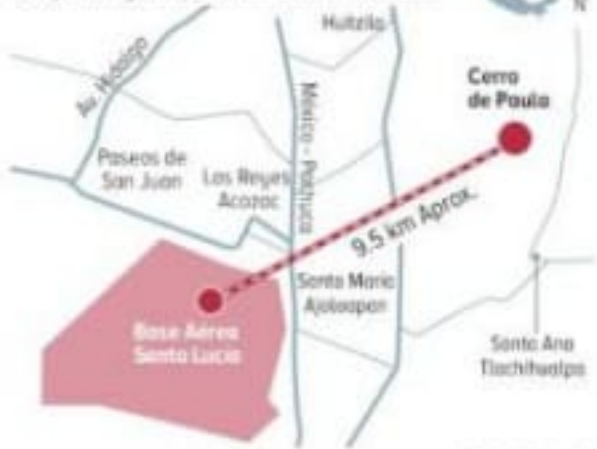
Dibujos: Erik Zapata

Por ley, los vestigios no pueden ser tocados ni modificados.