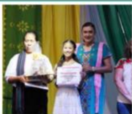
Con éxito y superando expectativas concluyó el Tianguis Artesanal 2019