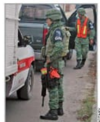
PRIMERAS ACCIONES. El viernes llegó a Minatitlán, Veracruz, la Guardia Nacional.

Representantes de ONG y legisladores consideran prematura la medida del Gobierno federal por considerar que falta capacitación y están pendientes las leyes secundarias que deben normar al nuevo organismo, las cuales serán discutidas por el Congreso en un período extraordinario MÉXICO P. 5