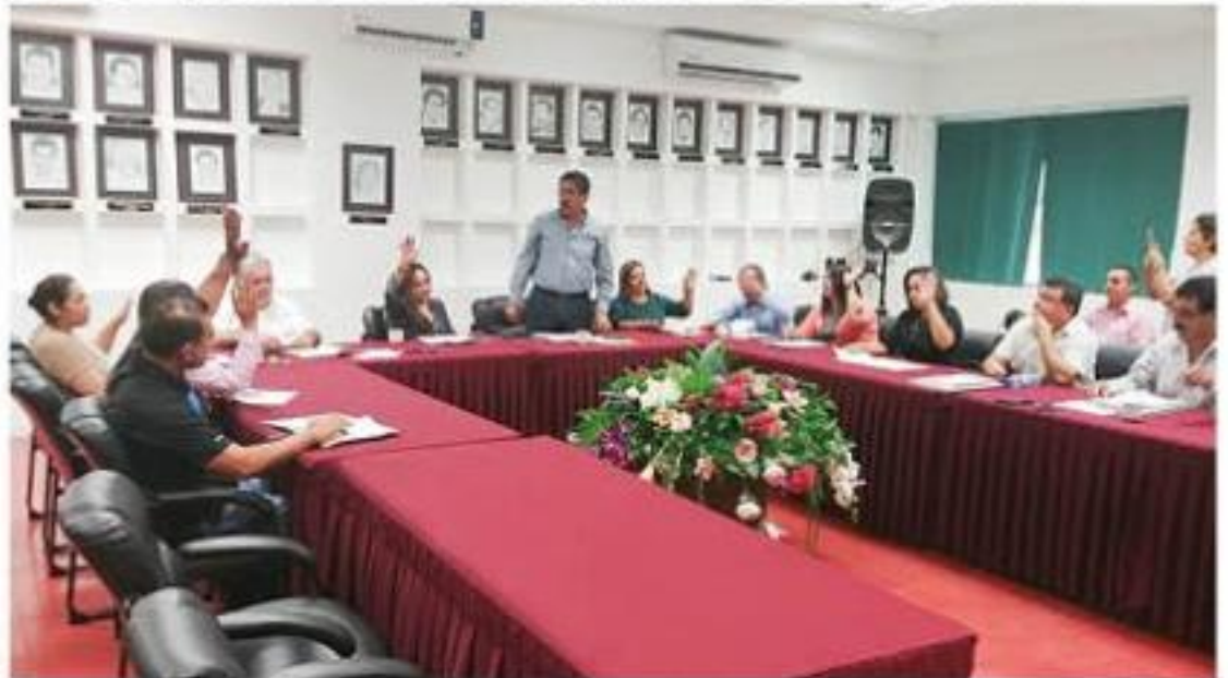
En sesión de cabildo de ayer domingo, se aprobó por mayoría de votos, la cuenta pública correspondiente al primer trimestre de este 2019.