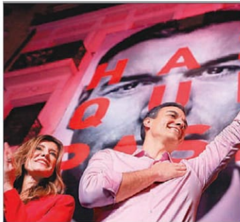
María Begoña Gómez y su esposo Pedro Sánchez, presidente del gobierno de España, celebran los resultados electorales en la sede del PSOE, en la Calle Ferraz de Madrid.

Ganó el PSOE la elección en España; necesitará pactos para gobernar