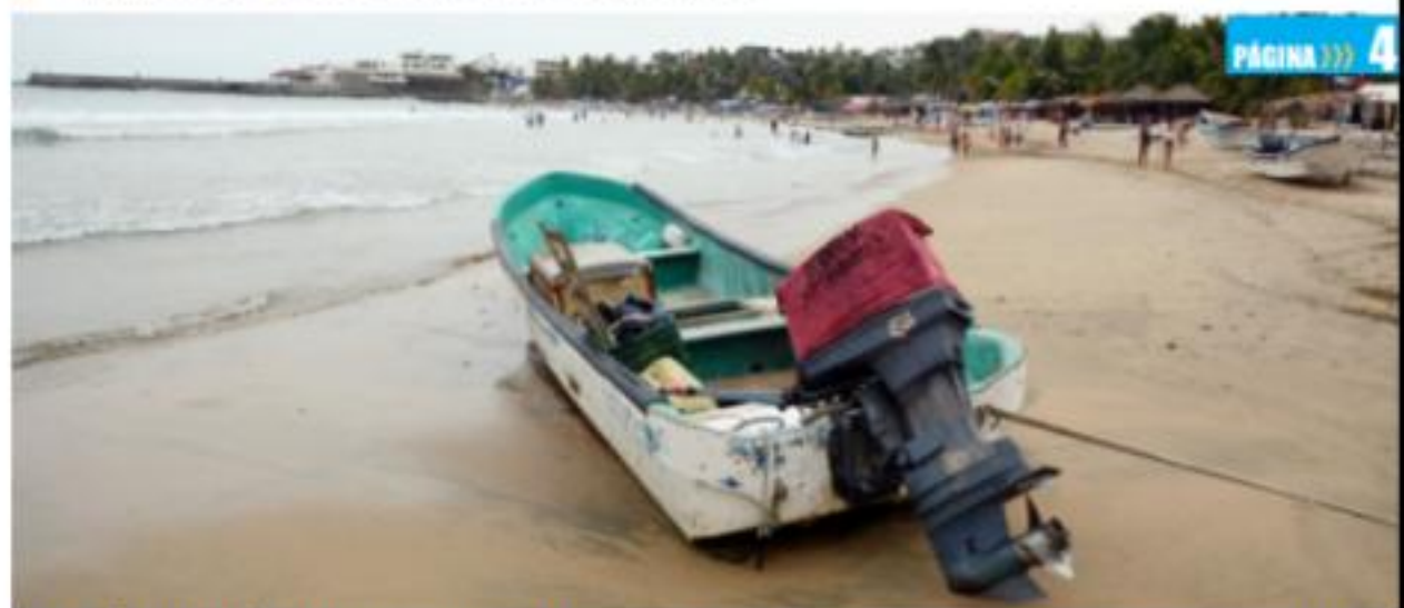
CD. LÁZARO CÁRDENAS, MICH.- El consumo de pescado en Semana Santa en Caleta de Campos fue por lo menos 10 veces más que lo que los enramaderos de la bahía venden en la temporada baja, ya que en la llamada semana mayor se superaron las 10 toneladas.

Visitantes consumieron más de 10 toneladas de pescado PÁGINA >>> 4 Tan solo en Caleta de Campos