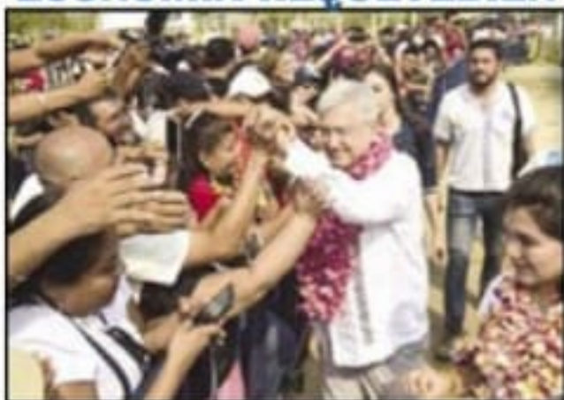
JUCHITAN, Oaxaca. - Andrés Manuel López Obrador. La economía marcha bien. Gira por Oaxaca.