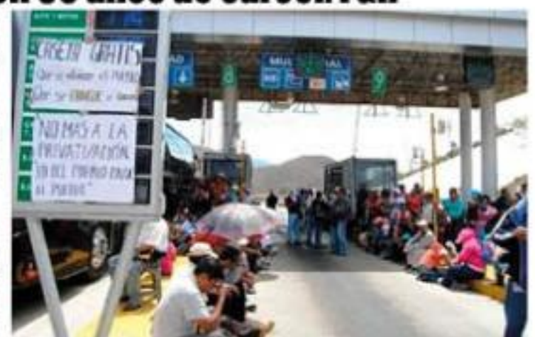
Según la FGR, la toma o bloqueo de casetas está considerado como delito federal, y quienes lo hagan, podrán recibir una pena que va de 15 días a los 30 años de cárcel.