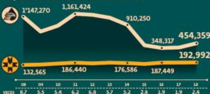
ISR de empresas de BMV y derechos de Pemex por la utilidad compartida (MILLONES DE PESOS AJUSTADOS POR INFLACIÓN Y VECES)