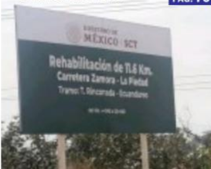
ZAMORA, MICH. - Están por iniciarse las obras de rehabilitación en la carretera Zamora-La Piedad en su primera etapa, comprendiente al tramo Rinconada-Ecuandureo.

Municipios pequeños no cuentan con recursos para Guardia Nacional