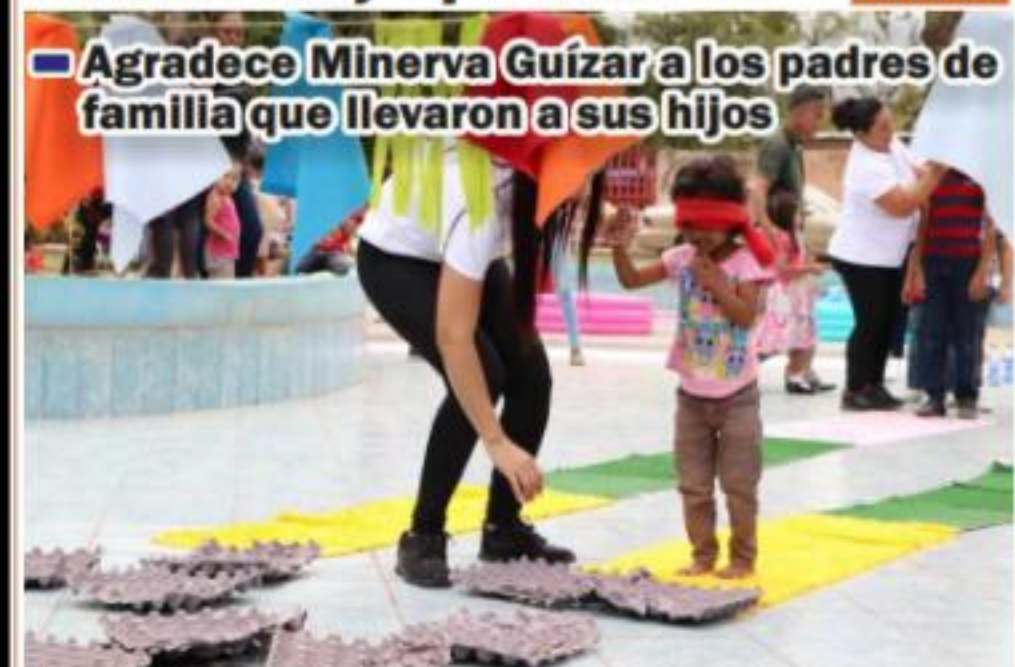
APATZINGÁN, MICH.- Organizado por el Sistema DIF Municipal en coordinación con el Centro Cultural Casa Pamar, Estancia Infantil, UBR, Promoción al Deporte, Aseo Público y Ecología.