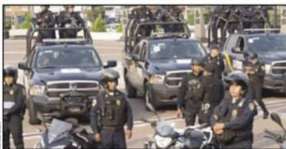
Entrega de uniformes a los policías capitalinos.

Ante las agresiones a policías en la capital del país y en el Metro, que