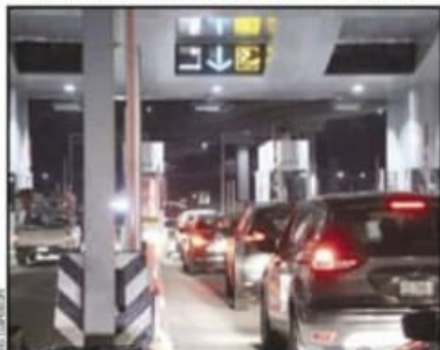
Al concluir las vacaciones de Semana Santa, volverán hoy a las aulas 36.6 millones de alumnos, estudiantes y maestros.