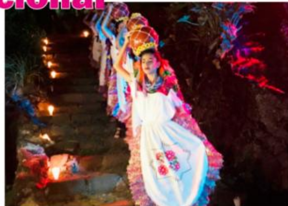
URUAPAN, MICH - Un éxito resultaron los recorridos nocturnos por el Parque Nacional Barranca del Cupatitzio, al grado de que se tuvo que agregar un recorrido adicional a los programados.

► Se evitan afectaciones al manantial El Ortigal