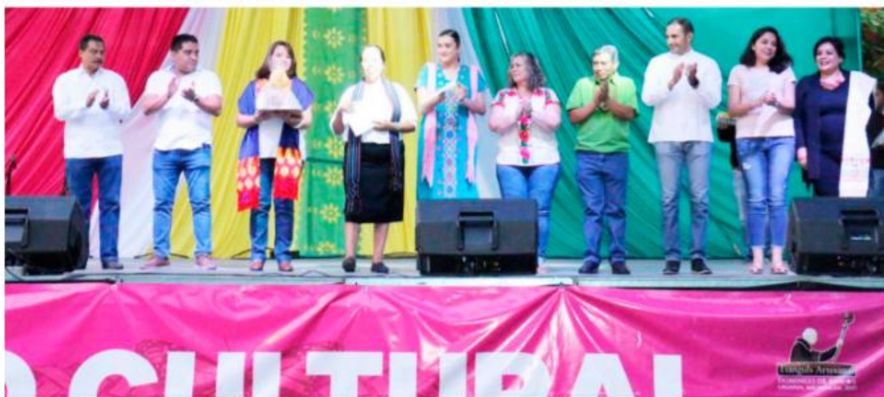
URUAPAN, MICH.- Al clausurarse ayer el Tianguis de Artesanías del Domingo de Ramos en Uruapan, se recalcó que la edición de este año superó cualquier expectativa, gracias al trabajo y la unidad de todos los sectores de la sociedad uruapense.

Y recalcaron el trabajo de los jóvenes voluntarios, "que lo mismo se encargaron de colocar sillas, que de proporcionar información a los turistas y de dar atención personal a los artesanos para resolver algunos problemas. Por eso, el éxito de este tianguis es de todos, es el resultado del trabajo de todos los uruapenses, reiteraron.