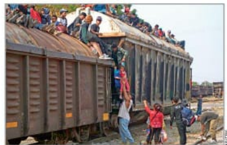
Viajan en La Bestia hacia EU MÉXICO P. 3