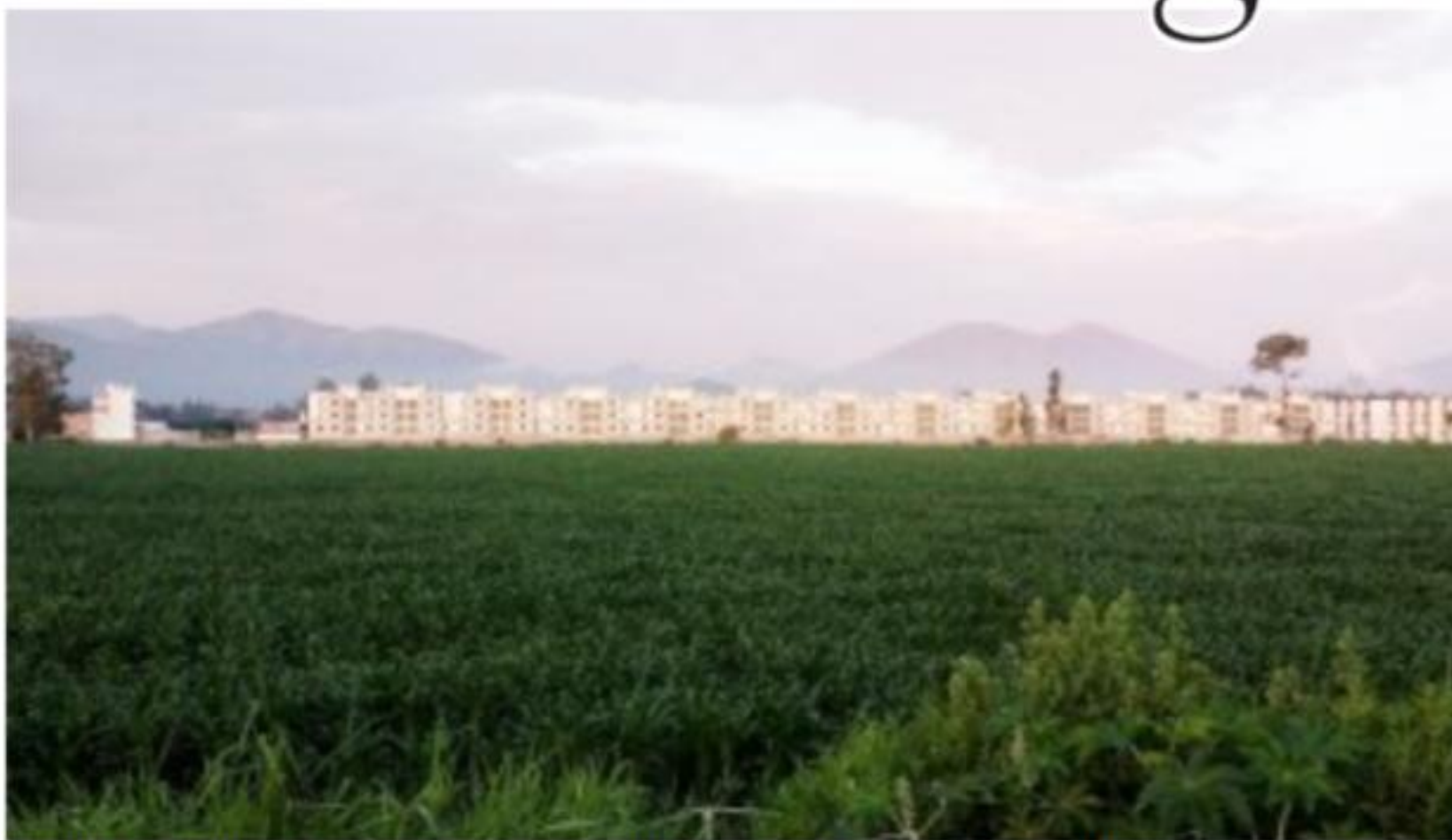
ZAMORA, MICH. - Grandes beneficios traería a productores del Valle de Zamora la aplicación de la nanotecnología.

Mucho por hacer en materia de equidad de género