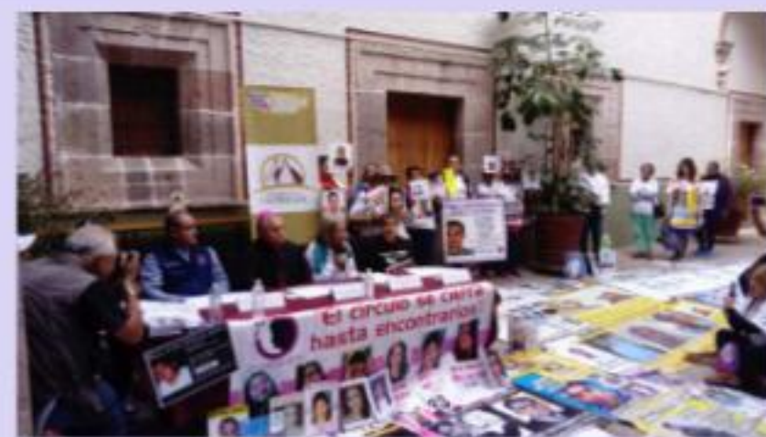
MORELIA, MICH.- Rueda de prensa de Caravana de Personas Desaparecidas.