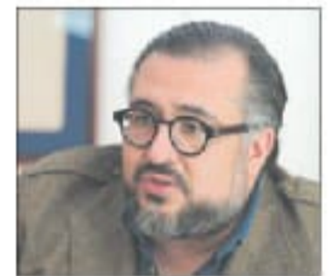
Arturo Peimbert, ombudsman de Oaxaca, durante la entrevista con La Jornada .