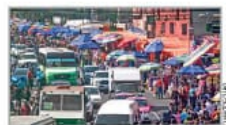
COMERCIO INFORMAL CRECE. Es una de las opciones que toman los desempleados.

El Centro de Estudios Económicos del Sector Privado advirtió sobre un "agotamiento" en la formalización de plazas, además de que consideró insuficientes los planes gubernamentales para crear puestos de trabajo; urgió a promover la confianza de inversionistas NEGOCIOS P. 15