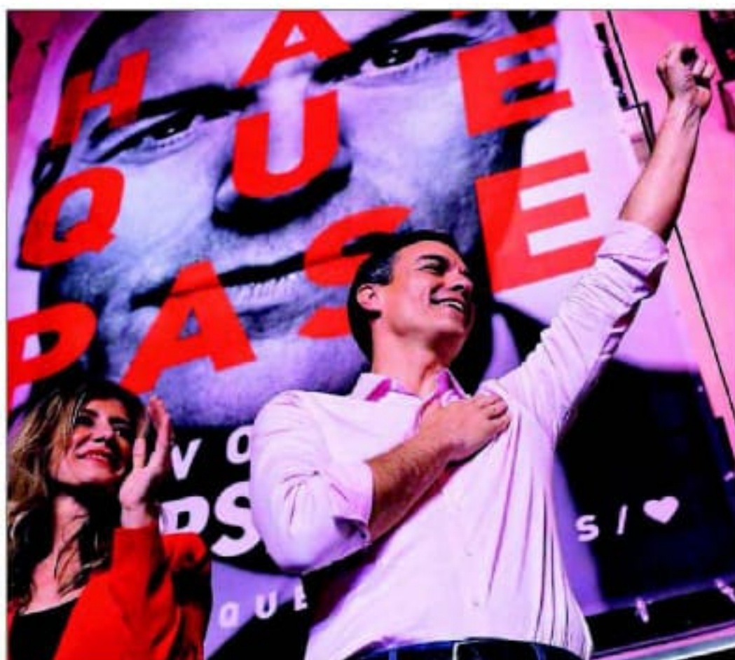
Pedro Sánchez, junto a su mujer, Begoña Gómez, saluda a los seguidores del PSOE. FERNÁN GONZÁLEZ (29)

El PSOE lograría la mayoría absoluta con Ciudadanos, y se quedaría al borde de conseguirla si pactase con Unidas Podemos y las fuerzas autonómicas no independentistas. Al celebrar su victoria, Sánchez proclamó: "Hemos mandado un mensaje al mundo de cómo derrotar a la involución y a la derecha". PÁGINAS 12 A 29