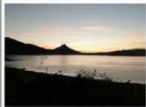
La belleza de La Presa del Bosque