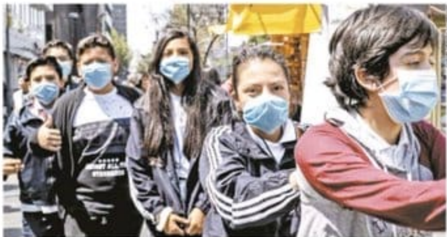
Distanciamiento en la capital del país mientras continúan con los niveles de prevención, tras el anuncio de la llegada del coronavirus a México.