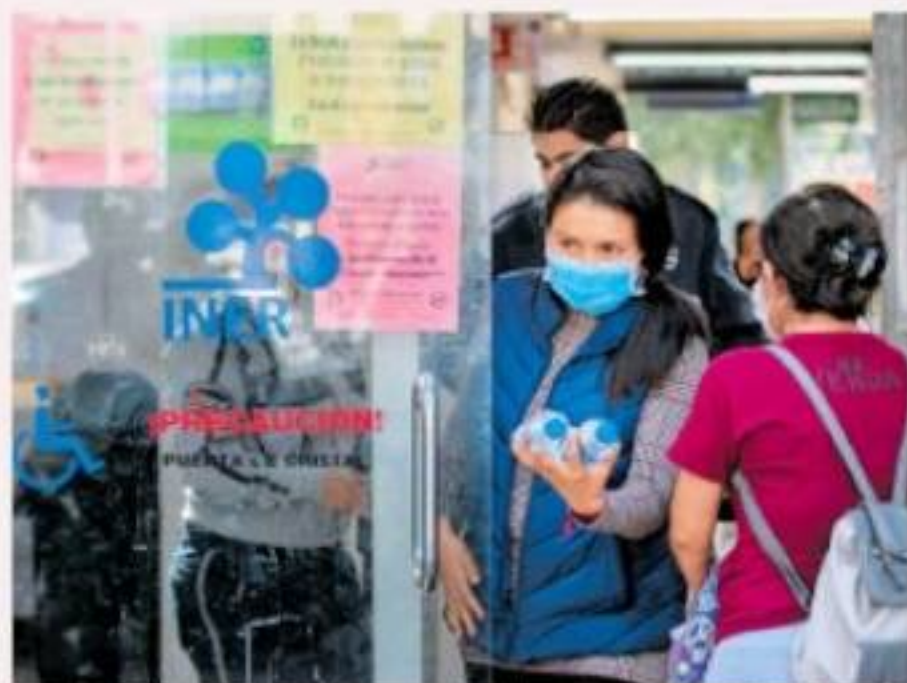
Desde muy temprano, la gente comenzó a utilizar cubrebocas en el Instituto Nacional de Enfermedades respiratorias

capitalinos se volcaron a las farmacias y agotaron en pocas horas el gel antibacterial y los cubrebocas. "No hay emergencia", dijo el subsecretario de Salud, Hugo López-Gatell, en su reporte nocturno. Y dejó claro que el cubrebocas "no sirve" para protegerse del contagio del coronavirus porque la enfermedad se puede contagiar hasta por los ojos. Pág. 4