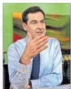
JUAN M. MORENO Presidente de Andalucía

Preparados para la pandemia Laura Spinsky PÁG. 118