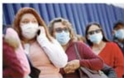
Miles de capitalinos empezaron a usar cubrebocas, pero autoridades sanitarias advierten que esta medida no protege contra el virus.

SABADO 29 DE FEBRERO DE 2020 • AÑO CII TOMO I, NO. 37432 • CIUDAD DE MÉXICO 72 PÁGINAS $16.96