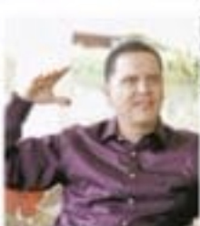
El ingeniero está vinculado con los cárteles de droga mexicanos.