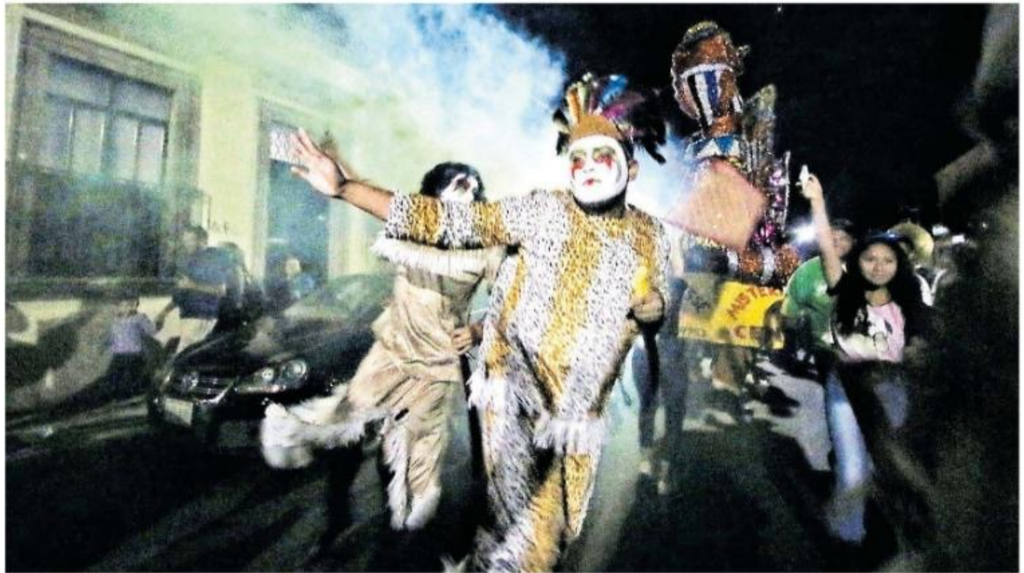
Los apaches, las maringuías, el caporal y el caballito se toman foto tras foto. Los vecinos se acercan y les piden la instantánea

DESDE 1870 El MET: siglo y medio de esplendor Este 2020 se cumplen 150 años de la creación del Museo Metropolitano de Arte de Nueva York. Todo comenzó como una iniciativa de amantes del arte que deseaban compartir su pasión con cualquier interesado. Págs. 16 y 17