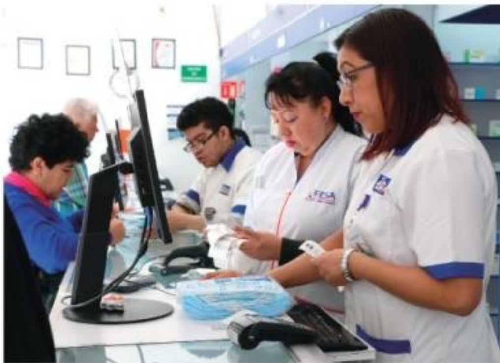
COMPRAS de cubrebocas, ayer en una sucursal de Tlalpan.

OMS sube amenaza a "muy alta", luego de que el virus ingresara a Nigeria; hasta el cierre suman más de 85 mil enfermos en 59 países.