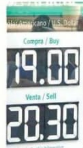
Los casos confirmados de coronavirus en el País dispararon ayer la cotización del peso frente al dólar.

Es por ello que el militar fue procesado por la falsificación de documento agravado, en su hipótesis de asentar hechos falsos como ciertos en documentos públicos, para hacerlos constar como prueba.