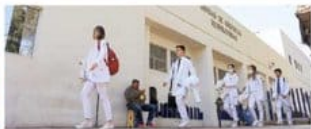
Ante el arbo de la epidemia, el gobierno actuó bajo un esquema de mitigación, no de contención, como sería restringir el libre tránsito. Agresió por ubicar casos, aislarlos y dar seguimiento a sus contactos.