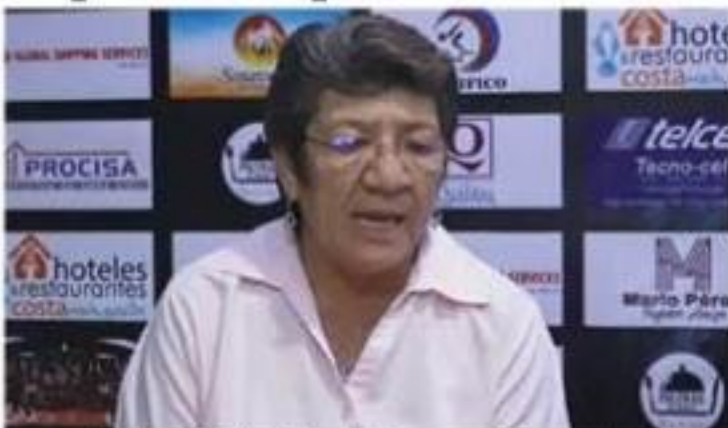
La coordinadora de los diputados de Morena en el Congreso local, durante su participación anoche en el Noticiero de este diario.