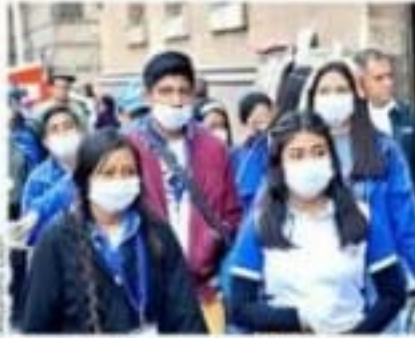
Pese a no ser necesario, según Salud, ayer hubo compras de pánico y uso de tapabocas.

Dos casos de coronavirus están en la CDMX. Uno, es un hombre de 35 años internado en el Instituto Nacional de Enfermedades Respiratorias (INER) quien incluso podría ser dado de alta el domingo, pero continuaría aislado en su domicilio hasta cumplir 14 días de protección. El segundo caso en la ci-