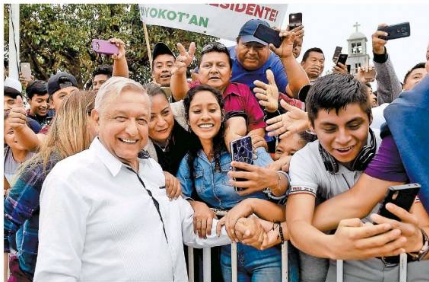
AMLO encabezó el acto en el que la Ssa recomendó evitar besos y saludos de mano, y por la tarde se fue de gira por Tabasco.