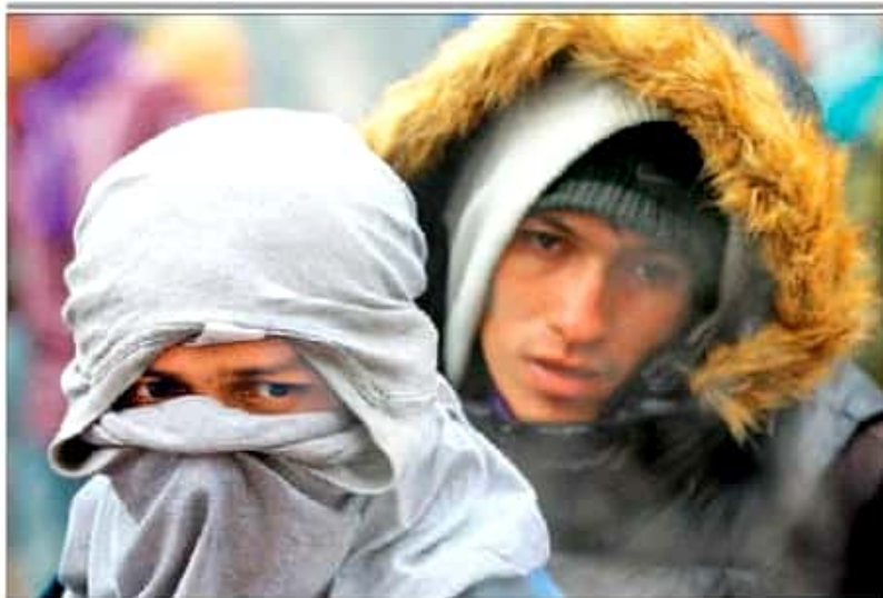
Integrantes de la segunda caravana de migrantes decidieron permanecer en la Magdalena Mixhuca mientras pasa la onda gélida que afecta al país.

La SCJN la anula: confundía seguridad pública con seguridad nacional; llama al Congreso a presentar una legislación que dé certeza jurídica