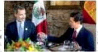
EL MANDATARIO, ayer con el rey de España, en Guatemala.

En Cumbre Iberoamericana, el Presidente resalta participación de la IP en el desarrollo del país, contempla que después de la Presidencia puede iniciar la vida pág. 14