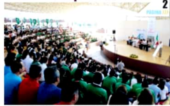
CD. LÁZARO CÁRDENAS, MICH.- Autoridades educativas y municipales, presentes en la celebración del 38 aniversario de Conalep Lázaro Cárdenas.