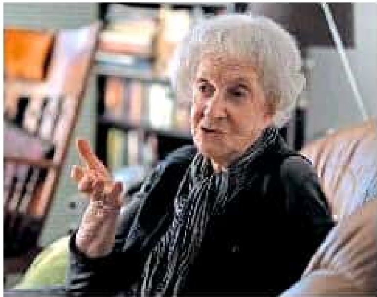
En México, celebrada en su honor el día de la madre, la abuela de Ida Vitale, autora del premio Cervantes.

El primer grupo de inmigrantes centroamericanos ha llegado a la frontera con Estados Unidos. Los inmigrantes están siendo recibidos en el sur del país estadounidense y se les está brindando asistencia humanitaria.