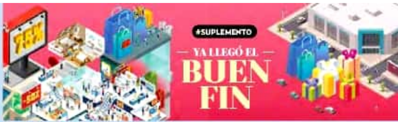
ILUSTRACIÓN ALLAN CRÁVINEZ