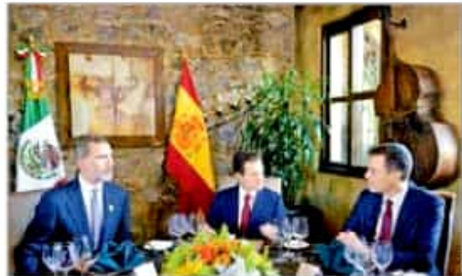
Hay vida después de la Presidencia: EPN MÉXICO P. 3

El banco central incrementó su carga impositiva de referencia en 25 puntos base, la más alta en casi 10 años. La Junta de Gobierno teme por riesgos macroeconómicos, derivados de las decisiones que tome el Presidente electo, Andrés Manuel López Obrador NEGOCIOS P. 24