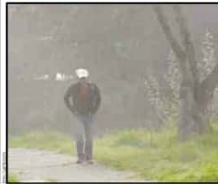
La onda gélida llevó el termómetro a cero grados en las zonas altas de la CDMX y el Valle de México.