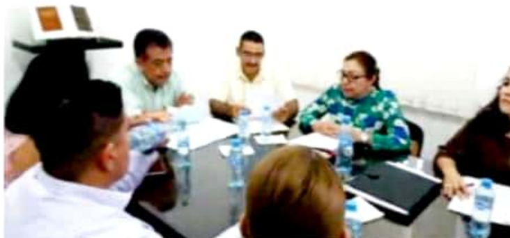
APATZINGÁN, MICH.- En sesión de Cabildo, fue aprobado el cobro anticipado del servicio de agua potable del próximo año, pero con tarifa del 2018.