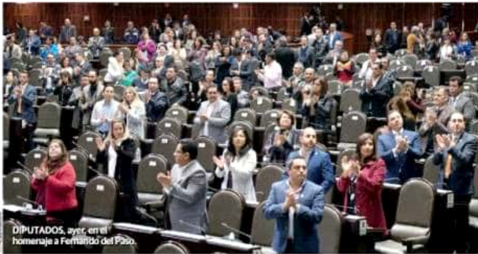
DIPUTADOS, ayer, en el homenaje a Fernando del Paso.

En una sesión de la Cámara Baja con numerosas ausencias, Sergio Mayer pidió un minuto de aplausos para el escritor fallecido, pero erró: dijo que el homenaje de hoy sería en Palacio Nacional y no en Bellas Artes. pág. 28