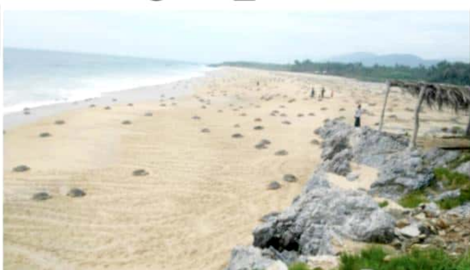
AQUILA, MICH.- La producción y trabajo de 4 arribazones masivas de tortugas marinas estimada en más de 20 millones de huevos, de la especie goffina, se echaron perder en días pasados en la comunidad de Mexiquillo, a causa del mal tiempo.

Cumple orgullosamente Conalep LC 38 años de formación profesional 2 PÁGINA 001