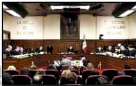
Sesión de la Suprema Corte de Justicia de la Nación.