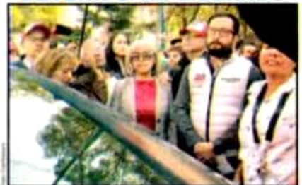
El alcalde de Miguel Hidalgo, Víctor Hugo Ponce, fue detenido brevemente por una presunta invasión en el Parque Reforma Social.