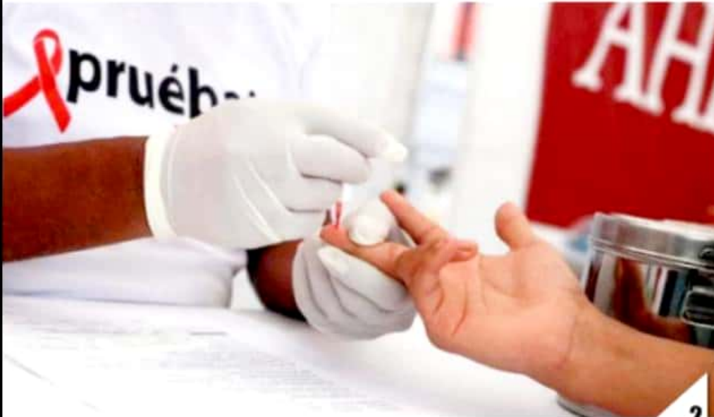
URUAPAN, MICH.- La Secretaría de Salud de Michoacán lleva a cabo una campaña para bajar a cero los casos de niños y niñas afectados por el Virus de Inmunodeficiencia Adquirida (VIH).