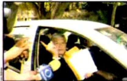
Andrés Manuel López Obrador: Proyectos limpios.