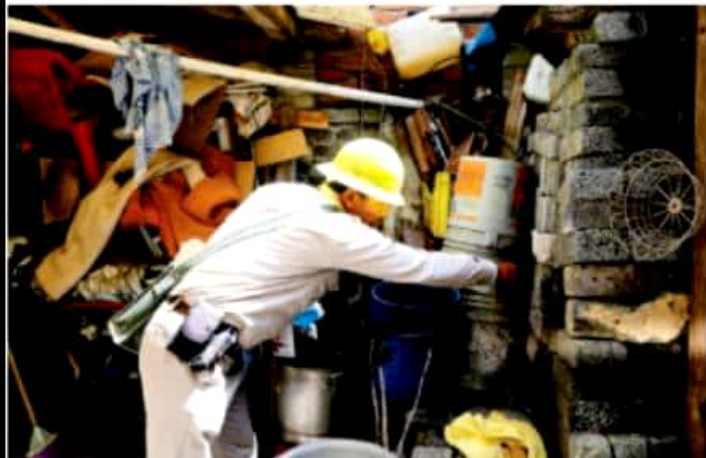
MORELIA, MICH.- La Secretaría de Salud de Michoacán (SSM), mantiene en activo las acciones preventivas para el combate del mosquito Aedes aegypti, transmisor de dengue, zika y chikungunya.