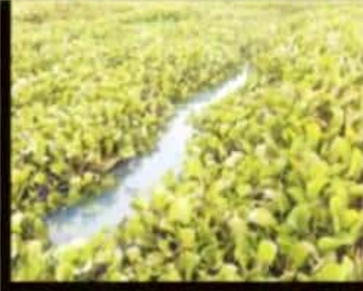
LOS ALTOS INDICES DE CONTAMINACIÓN Y LA PLAGA DE LIBRO "AHOGAN" A LA PRESA DE COINTZIO