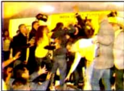
Las discrepancias sobre el método para cambiar los estatutos derivaron en un enfrentamiento.