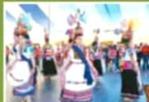
Danzas regionales engalanaron el ritmo de apertura de los santuarios.

¡ Ocampo, Mich. - Con una gran fiesta a las puertas de la reserva natural El Rosario fueron oficialmente abiertos al público los santuarios de la biosfera de la mariposa monarca, a los cuales se podrá acceder desde hoy y hasta el último día de marzo. (PAG. 3G)