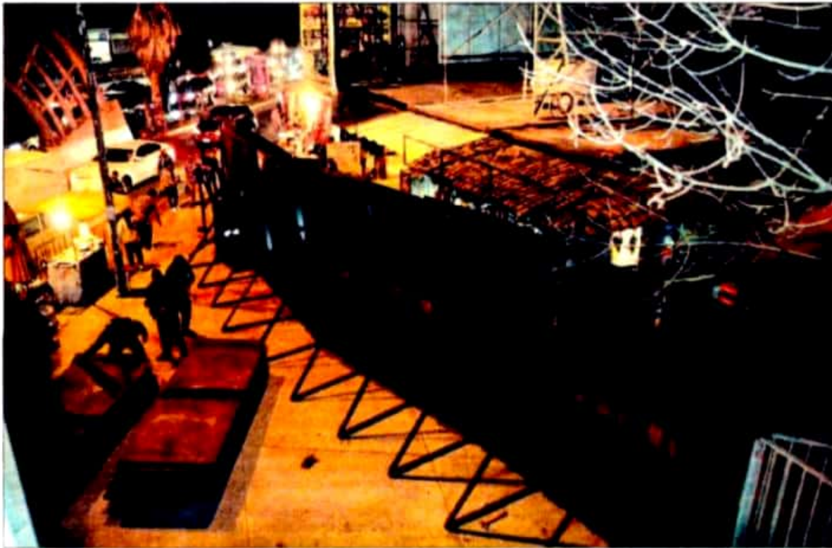
▲ La Policía Federal hizo este sábado en la noche un muro con vallas metálicas en el lado izquierdo de la garita de San Ysidro, California. La acción causó sorpresa entre los habitantes de Tijuana, debido a que es la primera vez que se realiza una acción de ese tipo. Mientras, en