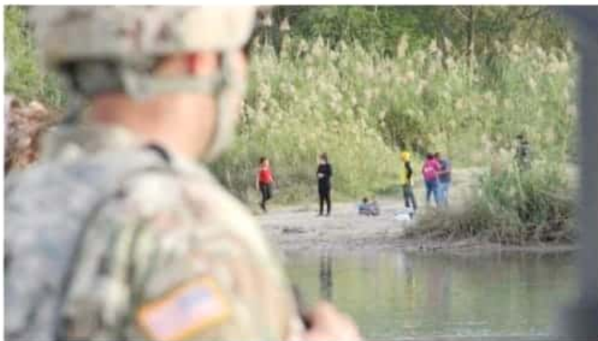
De izquierda a derecha: un grupo de personas que están del lado mexicano, en una zona en donde el río Grande divide ambos países.

Los albergues en la Sierra de Chihuahua se convirtieron en la única y mejor opción para los niños que provienen de familias con escasos recursos y lugares sin oportunidades de estudio. Sin albergar, deberían caminar hasta ocho horas a la escuela. Desde esos espacios los impulsan a continuar su preparación. Recien fue inaugurado el de la Secundaria Técnica 85 en Noregachi, comunitaria en el municipio de Guachochi. ESTADOS A23