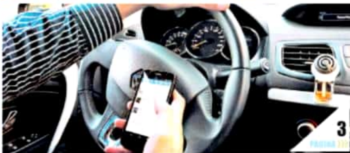
URUAPAN, MICH.- A pesar de los riesgos que implica, aún muchos conductores de automóviles siguen utilizando sus teléfonos celulares, por lo que las autoridades de tránsito y vialidad, hacen un exhorto para evitarlo.