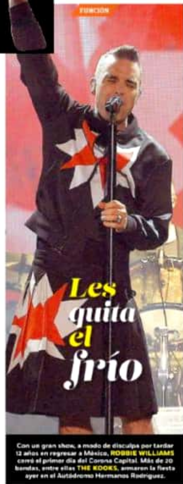
Con un gran show, a modo de disculpa por tardar 12 años en regresar a México, ROBBIE WILLIAMS cerró el primer día del Corona Capital. Más de 20 bandas, entre ellas THE ROOTS , amasaron la fiesta ayer en el Auditorio Hermanos Rodríguez.