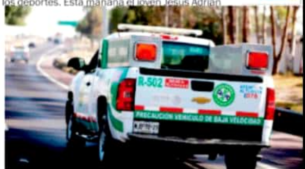
CD. LÁZARO CÁRDENAS, MICH.- Unidades de "Los Ángeles Verdes" están prontas para auxiliar a los turistas, en caso de que presenten fallas sus vehículos.