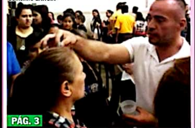
URUAPAN, MICH.- La grey católica acudió puntual, como cada año, a recibir la ceniza en el inicio de la temporada de Cuaresma, periodo en el que el clero ha convocado a vernos nuevamente con respeto y hermandad.