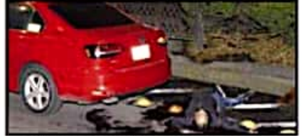
Dos hombres murieron al ser baleados en Paso de la Reforma. Los atacantes huyeron, pese al CS.