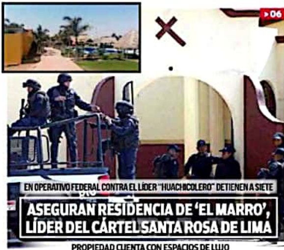
> 06 EN OPERATIVO FEDERAL CONTRA EL LÍDER "HUACHICOLERO" DETIENEN A SIETE

ARQUIDIOCESIS ABRE CANAL DE DENUNCIA CONTRA SACERDOTES ACUSADOS DE ABUSO