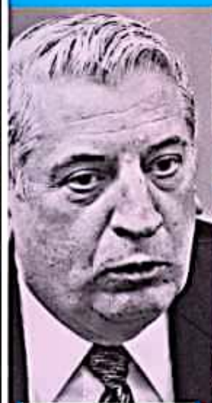
ARTURO NÚÑEZ EXGOBERNADOR DE TABASCO

FUNCIONARIO CAPITALINO COMPRA AUTO DE 1.2 MDP CDMX 10-11