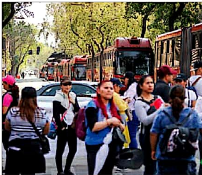
El tráfico vial en el cruce de avenida Insurgentes y Paseo de la Reforma, y sus alrededores, fue seriamente afectado la tarde ayer debido a las protestas y bloqueos que realizaron 300 empleados de la Universidad de Chapingo en demanda de un aumento salarial de 20 por ciento. Decenas de unidades de Metrobús dejaron de dar servicio. (Rodrigo Juárez).

Caos en el corazón capitalino por protestas de empleados de Chapingo