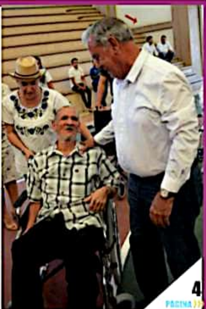
ARTEAGA, MICH.- El DIF municipal de Arteaga y de los municipios que conforman la "Sierra Costa" en coordinación con el DIF estatal, hicieron entrega de aparatos a personas con discapacidad.

Entrega DIF estatal aparatos funcionales, optométricos, auditivos y equipamiento diverso, en Arteaga