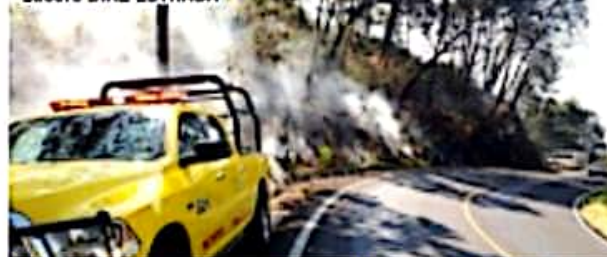
URUAPAN, MICH.- Supervisados por la Conafor, se realizan trabajos de quema controlada para abrir "líneas negras" que funcionarán como brechas cortafuego.

Del 19 al 24 de marzo desarrollará Capasu la Cuarta Semana del Agua