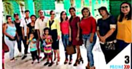
CD. LÁZARO CÁRDENAS, MICH.- Por motivo del Día Internacional de la Mujer, la administración municipal, a través del Instituto de la Mujer, llevarán a cabo un evento cultural y artístico el próximo domingo.

Definen actividades por el Día Internacional de la Mujer