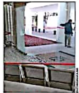
...Y EN REYNOSA. La violencia, hasta en hospitales del IMSS.