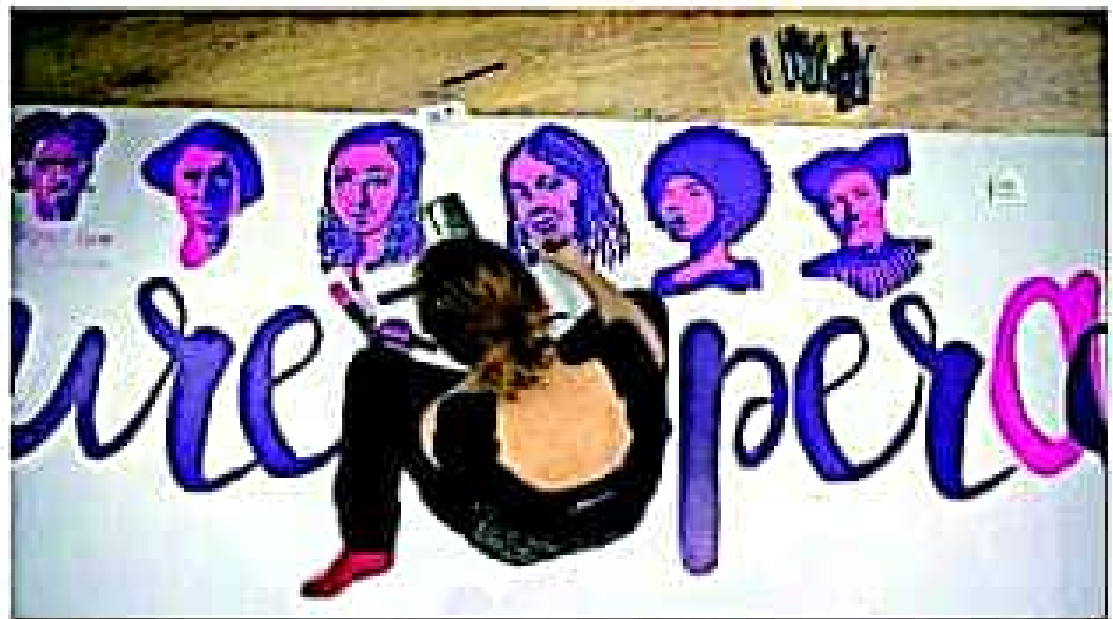
LA CUENTA ATRAS DEL BIM (Los presentadores de las modificaciones de Cien años de Soledad en un momento de la presentación del gran proyecto de reforma hace un año. En la imagen, una mujer mira una obra pictórica en el espacio Ca la Dona de Barcelona.) EL PAÍS

siguiente trimestre. En enero, los inmigrantes que cruzaron la frontera se elevó en febrero lo mejor como en 12 años. 15.000 inmigrantes para el primer trimestre de 2018 para reducir el déficit comercial y frenar la entrada de inmigrantes. EL PAÍS