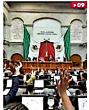
> 09 HASTA AYER SUMABA AVAL EN 18 ESTADOS