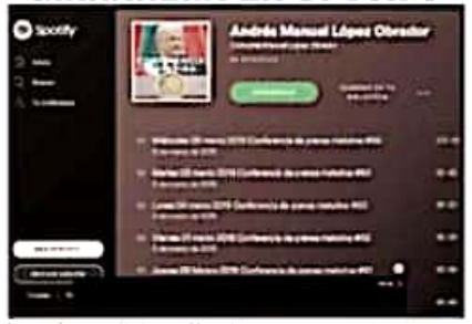
Las conferencias de Andrés Manuel López Obrador a cualquier hora.