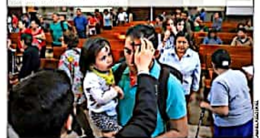
RELIGIÓN. Con el ritual de la ceniza inician los 40 días de Cuaresma en los que los fieles se preparan para la Pascua.