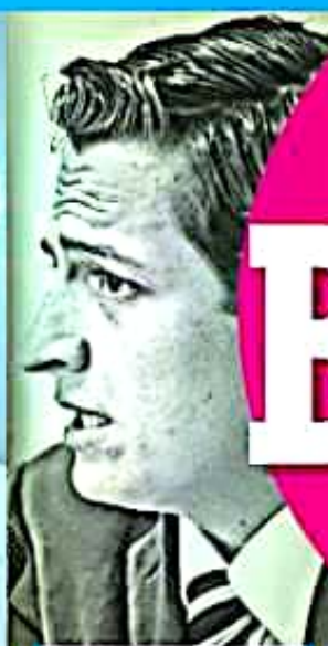
NÉSTOR NÚÑEZ ALCALDE EN CUAUHTÉMOC