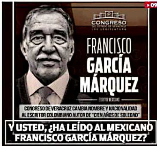
> 09 CONGRESO DE VERACRUZ CAMBIA NOMBRE Y NACIONALIDAD AL ESCRITOR COLOMBIANO AUTOR DE "CIEN AÑOS DE SOLEDAD"

Y USTED, ¿HA LEÍDO AL MEXICANO FRANCISCO GARCÍA MÁRQUEZ?