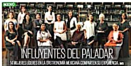
INFLUYENTES DEL PALADAR 14 MUJERES LÍDERES EN LA GASTRONOMÍA MEXICANA COMPARTEN SU EXPERIENCIA. A3

● En el Estado de México entregan más de 800 mil salarios mínimos. A19