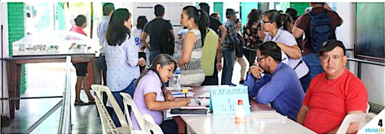
CD. LÁZARO CÁRDENAS, MICH.- En la segunda edición del programa "Día por el Empleo" se ofertaron 550 vacantes de las que 350 fueron proporcionadas por la Policía Michoacán.

En la segunda edición del programa Día por el Empleo , se ofertaron un total de 550 vacantes