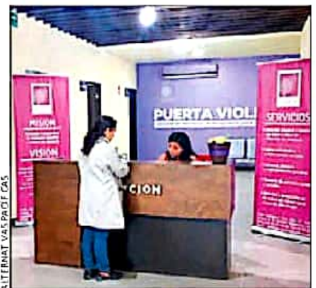
Instalación del refugio Puerta Violeta, en Escobedo, Nuevo León, modelo a seguir para atender a mujeres víctimas de violencia.