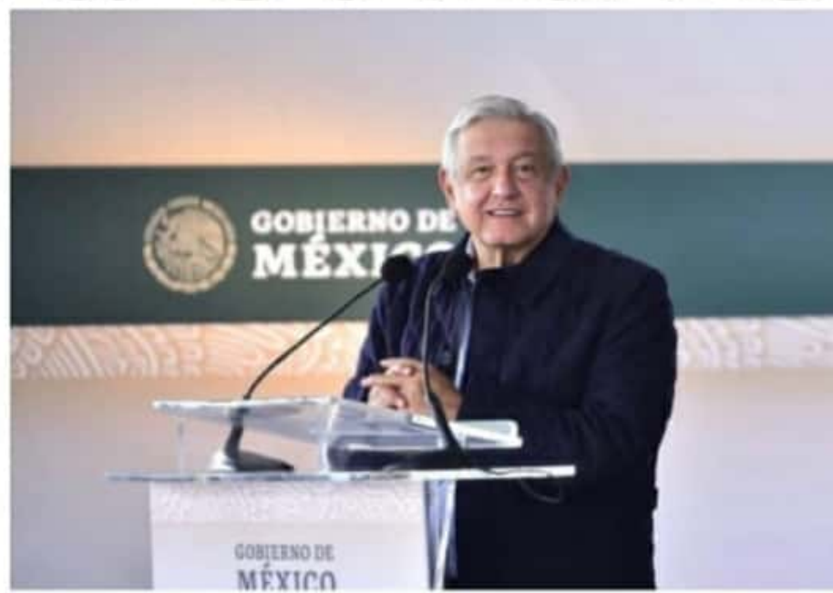
CDMX.- El presidente, Andrés Manuel López Obrador, informó la tarde de ayer, a través de Twitter, que tiene síntomas leves de Covid-19 y ya está en tratamiento médico. Además, precisó que la secretaria de Gobernación Olga Sánchez Cordero, lo representará en las conferencias matutinas.

Concluye instalación de las ocho bombas en Capalac PAG. 3