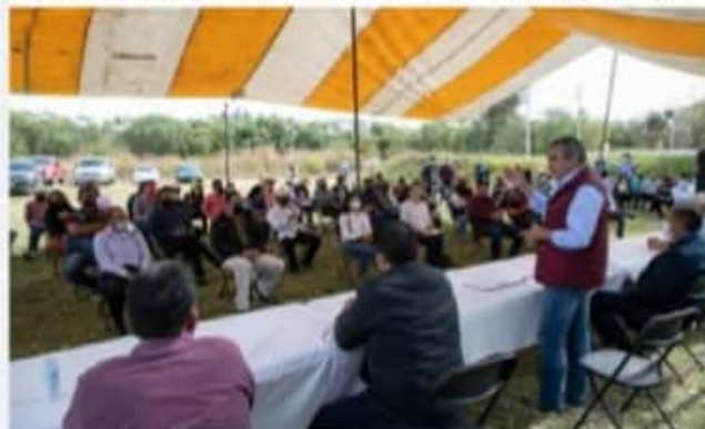
MARAVATÍO, MICH.- Raúl Morón, se reunió con liderazgos de las mencionadas regiones, a quienes les recaló la importancia de trabajar para alcanzar el máximo objetivo.

Indicó, que las elecciones de este año son un impulso fundamental para la Cuarta Transformación, por lo cual el trabajo a realizar a nivel territorial debe ser intenso, para reenfrentar ante la población los ideales y valores que la rigen y que con su aplicación en Michoacán, se dará una solución a sus causas, además del combate a la corrupción y la impunidad. En consenso, los liderazgos expresaron su confianza en que Raúl Morón es el perfil adecuado para gobernar la entidad y generar el desarrollo que demandan los michoacanos y afirmaron su redoble de esfuerzos para que esta estrategia sea conocida y compartida por toda la sociedad.