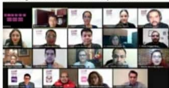
Consejeros del IEM durante la sesión virtual en que aprobaron candidaturas independientes a alcaldes y diputados locales.

aspirantes a Candidatas y Candidatos Independientes a Diputaciones y Ayuntamientos, donde de las 30 solicitudes presentadas, 23 pasaron a la etapa de Respaldo Ciudadano al contar con todos los requisitos corres- >>> 5