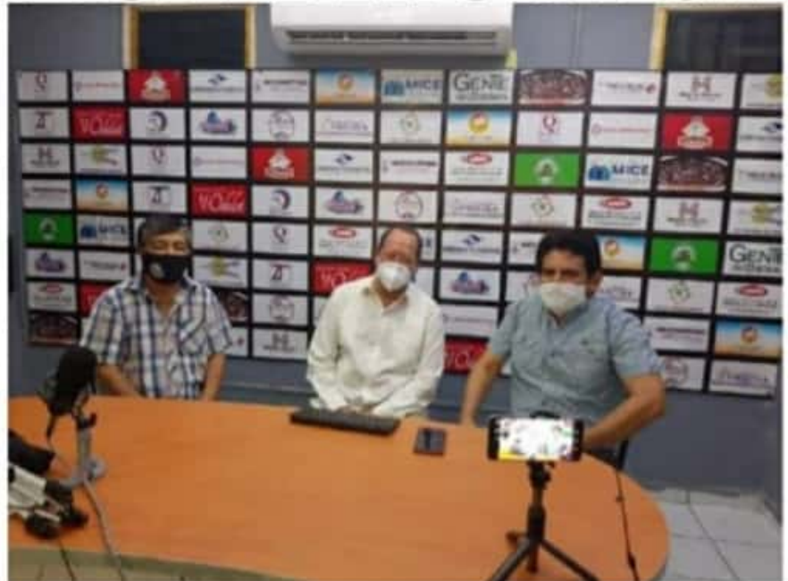
El ex gobernador de Michoacán y actual aspirante a la candidatura de Morena por el distrito electoral federal 01 con cabecera en este puerto, Leonel Godoy Rangel, durante la entrevista exclusiva que concedió al Noticiero de este diario el pasado fin de semana.