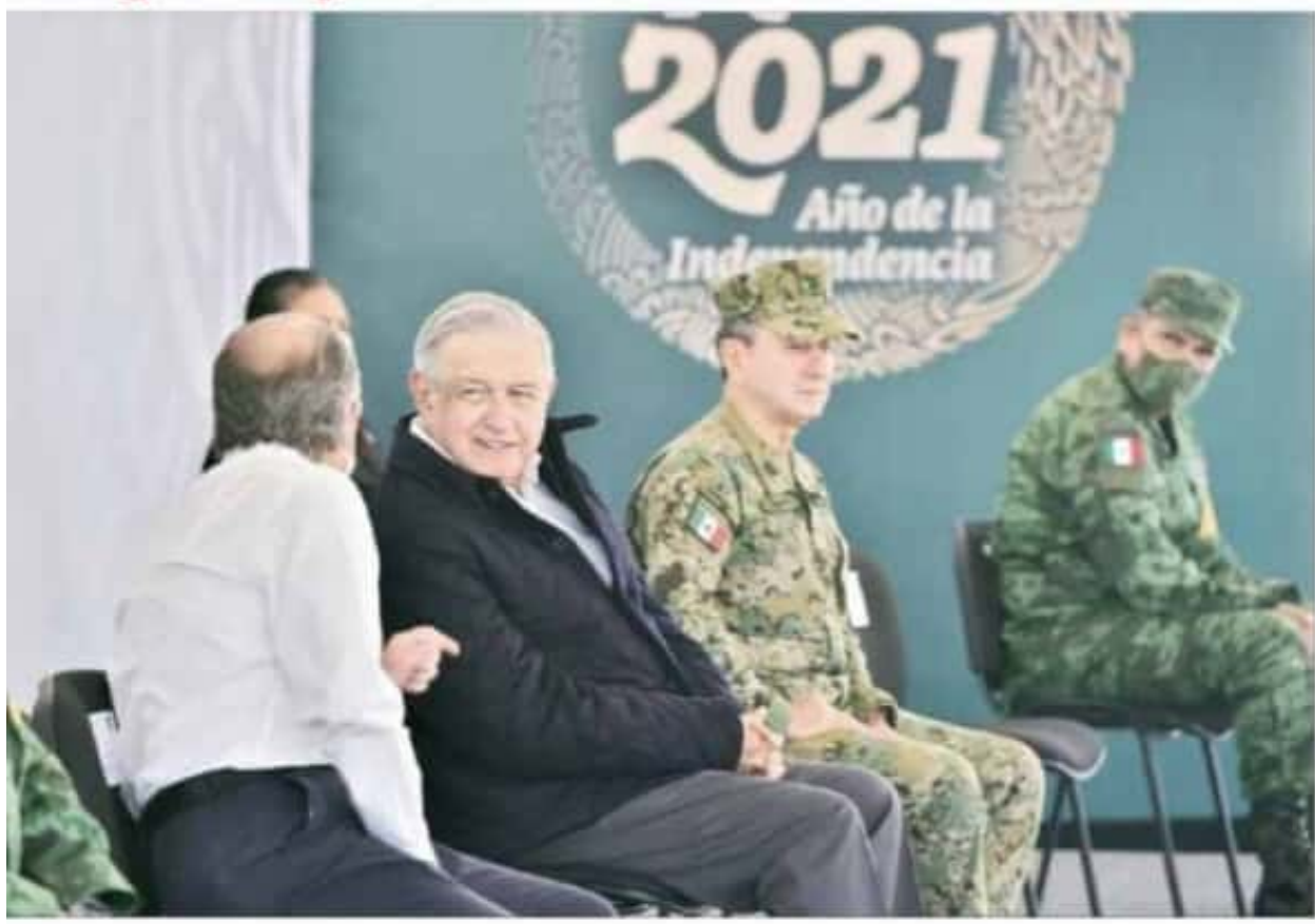
El presidente Andrés Manuel López Obrador dialoga con el gobernador José Manuel Carreras, durante el acto en el poblado de Soledad de Graciano Sánchez. Hasta el momento se han construido