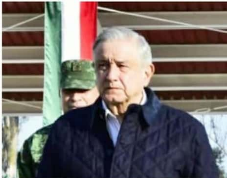
CIUDAD DE MÉXICO.- El presidente, Andrés Manuel López Obrador, informó la tarde de ayer, a través de su cuenta de Twitter, que dio positivo a Covid-19 y precisó que la secretaria de Gobernación, Olga Sánchez Cordero, lo representará en las conferencias matutinas.