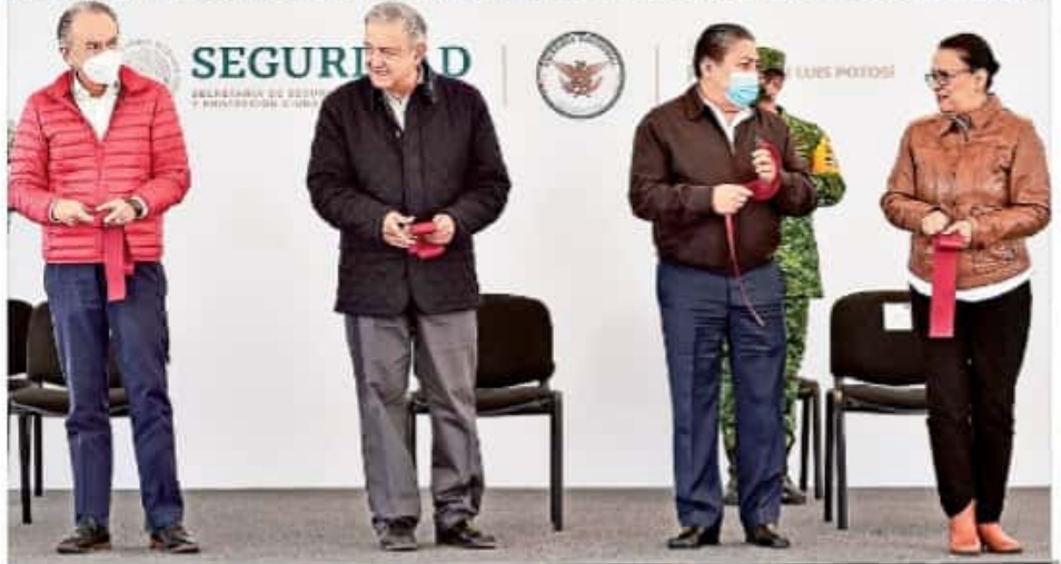
EL FIN DE SEMANA. López Obrador realizó una gira, donde convivió y compartió micrófonos con miembros de su gabinete y los gobernadores de Nuevo León y San Luis Potosí, Jaime Rodríguez y Juan Manuel Carreras. MÉXICO P.4