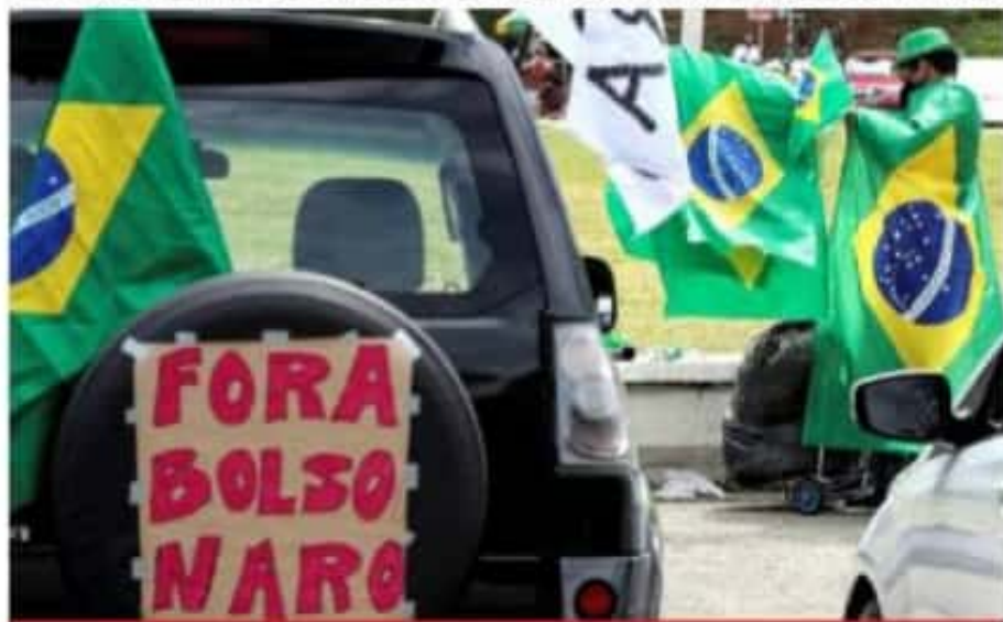
Integrantes del Movimiento Brasil Libre participaron en una caravana en São Paulo para exigir un juicio político al presidente de Brasil, Jair Bolsonaro, por su cuestionada gestión frente a la pandemia del coronavirus.