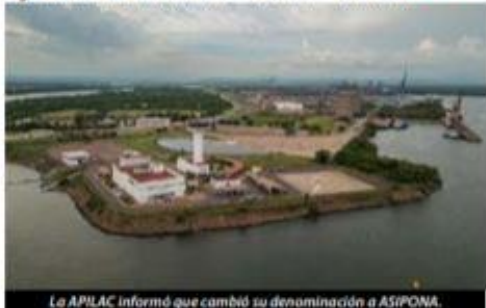
La APILAC informó que cambió su denominación a ASIPONA.

Mediante un comunicado del conocimiento público que, de prensa, la APILAC señala lo siguiente: Esta entidad hace en la Septuagésima Octava Asamblea >>> 6