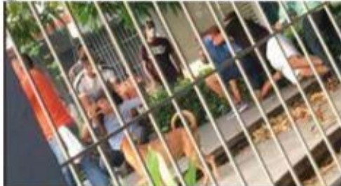
Maestros de la secundaria Ricardo Flores Magón de esta ciudad, escenificaron ayer un bochornoso espectáculo frente a padres de familia, alumnos y directivos, llegando a los golpes en el interior del plantel.

A través de un comunicado enviado a los medios de comunicación social via whatsapp por la Coordinación Regional de la Sección XVIII de la CNTE, se acusa a integrantes del grupo, tam- >>> 3