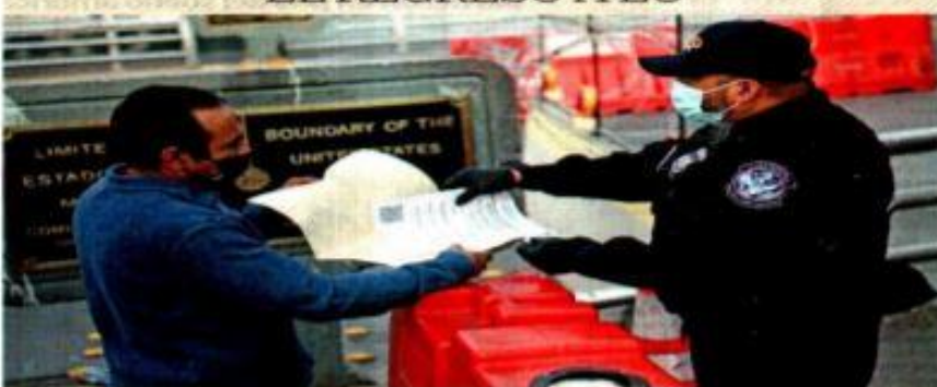
Ciudad Juárez. — En el primer día de la reapertura de la frontera de Estados Unidos reinó la alegría de las familias que se reencontraron, pero hubo desilusión de los comercios al no registrar las ventas esperadas. En las garitas se solicitó certificado de vacunación. | A34 |