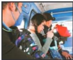
EL PASAJE EN COMBIS Y CAMIONES SE ELEVARÁ DESDE MAÑANA.

La Comisión Coordinadora del Transporte (Cocotra) finalmente habría autorizado un incremento de un 11% al pasaje, luego de 3 años sin ajustes en las tarifas. Se espera que en las próximas horas la Cocotra oficialice la decisión que impactará a los usuarios.