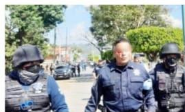
URUAPAN, MICH.- Seis policías lesionados fue el saldo reportado tras los enfrentamientos que docentes de Poder de Base sostuvieron con elementos de la Policía Michoacán y la Guardia Nacional, que resguardaron las vías del tren en Caltzontzín, para evitar que los del magisterio volvieran a bloquear el paso del ferrocarril.