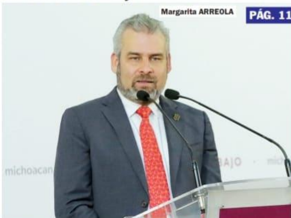
MORELIA, MICH.- El gobernador, Alfredo Ramírez Bedolla, expresó su respaldo a las actuaciones que ha tenido el Ejército Mexicano en la tierra caliente michoacana.