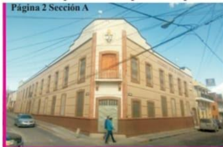
Página 2 Sección A