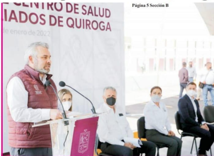
Página 5 Sección B