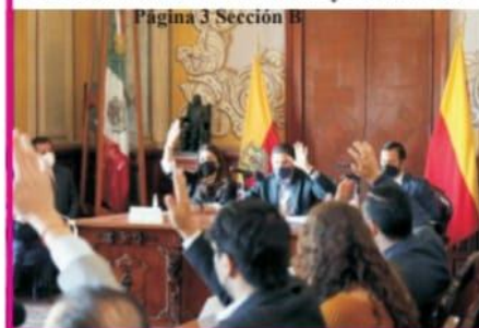
Página 3 Sección B