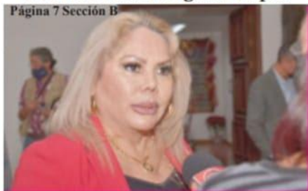
Página 7 Sección B