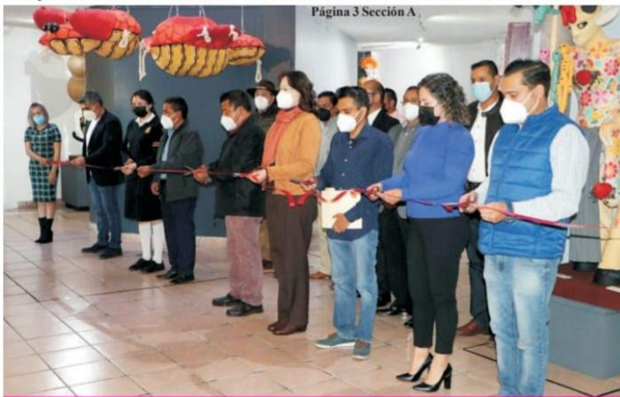
Página 3 Sección A