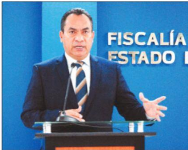
EL TITULAR DE LA FISCALÍA GENERAL DEL ESTADO, ADRIÁN LÓPEZ SOLÍS, INFORMÓ SOBRE LOS AVANCES EN LAS INVESTIGACIONES EN LOS HECHOS VIOLENTOS EN SAN JOSÉ DE GRACIA.

Diputados de distintos partidos y diversos sectores exigieron a las autoridades federales y locales que se use todo el peso de la ley para poner fin a la violencia que golpea a la entidad.