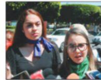
Representantes de colectivos feministas informaron sobre las acciones para el 8 de marzo.