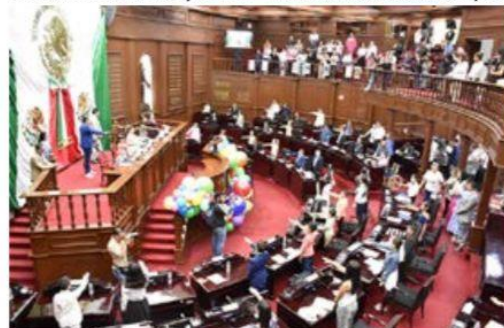
En la máxima tribuna del estado, parlamentarios expusieron sus inquietudes, propuestas e iniciativas.