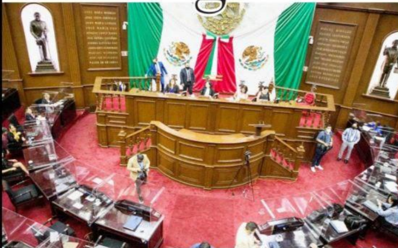
MORELIA, MICH.- En medio de la confrontación e inconformidad existente en la bancada de Morena, cuatro diputados del partido guinda y una del Verde Ecologista, notificaron a la Junta de Coordinación Política la salida de sus respectivas bancadas.