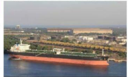
Trabajadores sindicalizados de la Terminal de Almacenamiento y Despacho (TAD) de Pemex de Lázaro Cárdenas, denunciaron nuevamente presuntos actos de corrupción y de abuso de poder de su líder sindical. (Foto ilustrativa de la planta).