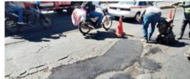
URUAPAN, MICH.- Este mes iniciarán trabajos de repavimentación en las calzadas B. Juárez y La Fuente, por lo que estas labores de bacheo, infructuosas pero necesarias, serán cosa del pasado.

Con una inversión de 47 mdp, se estiman unos cuatro meses de trabajo PÁG. 3