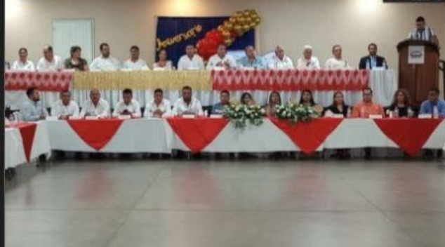
CD. LÁZARO CÁRDENAS, MICH.- El Sindicato de Estibadores CROM cumplió este miércoles 50 años de operación, destacando que en estas cinco décadas no han estallado ninguna huelga, gracias al entendimiento y buena comunicación con los empresarios.