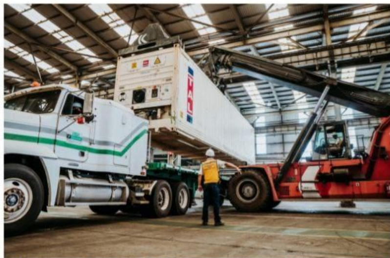
CD. LÁZARO CÁRDENAS, MICH.- El Estado de México se posiciona como el foco rojo para el transporte de carga michoacano, debido a la gran cantidad de robos registrados en el 2022.

Auditoría Superior llevará 6 casos por presunto abuso de confianza y peculado ante la FGI