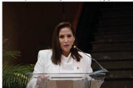
La presidenta de la mesa directiva del Congreso local, Ivonne Pantoja Abascal, asistió al Foro "Diálogos, Reforma al Poder Judicial".

Morelia, Michoacán, a 1 de septiembre de 2024.- La diputada Ivonne Pantoja Abascal convocó a priorizar el diálogo y la apertura al intercambio de ideas, a fin de fortalecer el sistema democrático de México, y ga- » 5