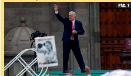
CIUDAD DE MÉXICO.- El presidente Andrés Manuel López Obrador presentó su sexto y último informe de gobierno desde el Zócalo de la Ciudad de México.