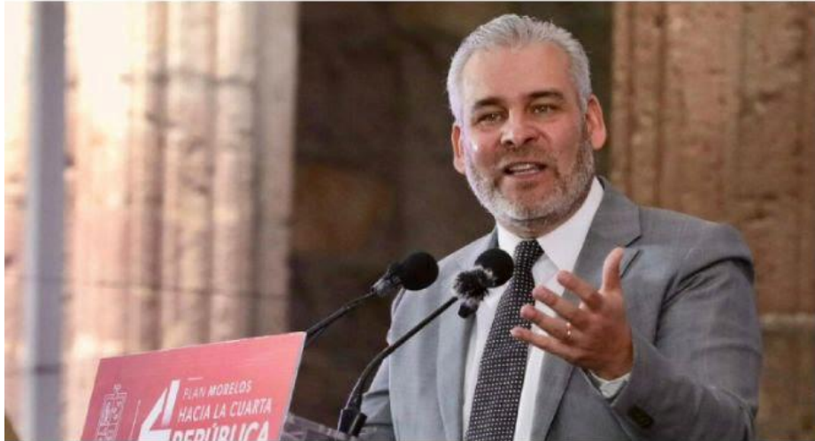
MORELIA, MICH.- El gobernador del estado, Alfredo Ramírez Bedolla, presentó el Plan Morelos, que contempla 9 reformas de ley, entre las que incluye el tema de Justicia.

El jefe del Ejecutivo estatal busca homologar el marco legal local, al federal PÁG. 3