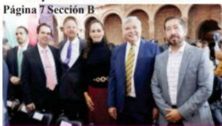
Página 7 Sección B

Diputados electos del Partido Verde respaldarán reformas de Bedolla