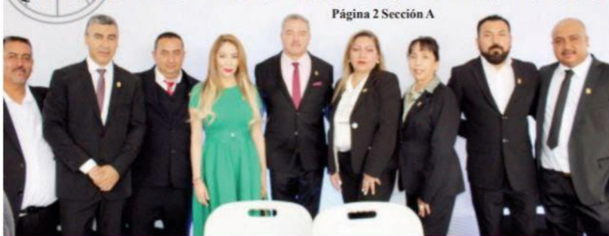
Página 2 Sección A