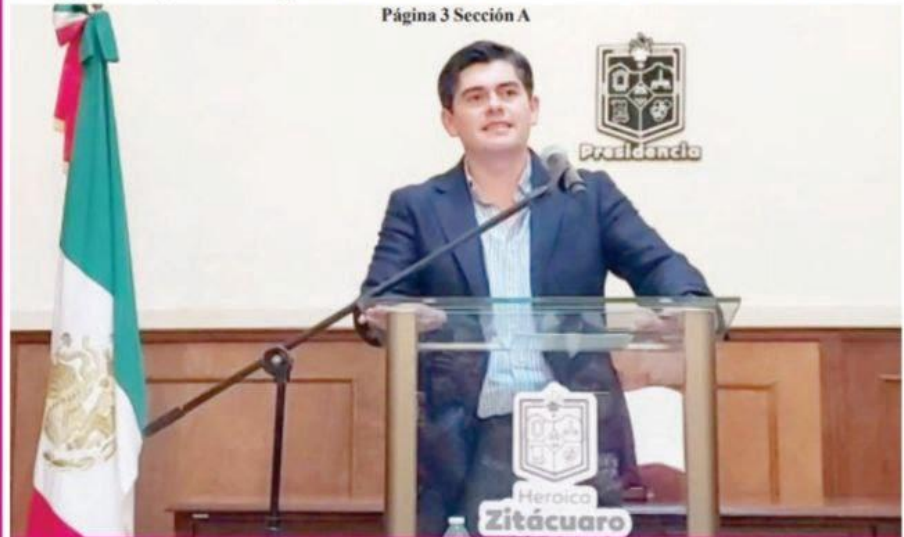
Página 3 Sección A