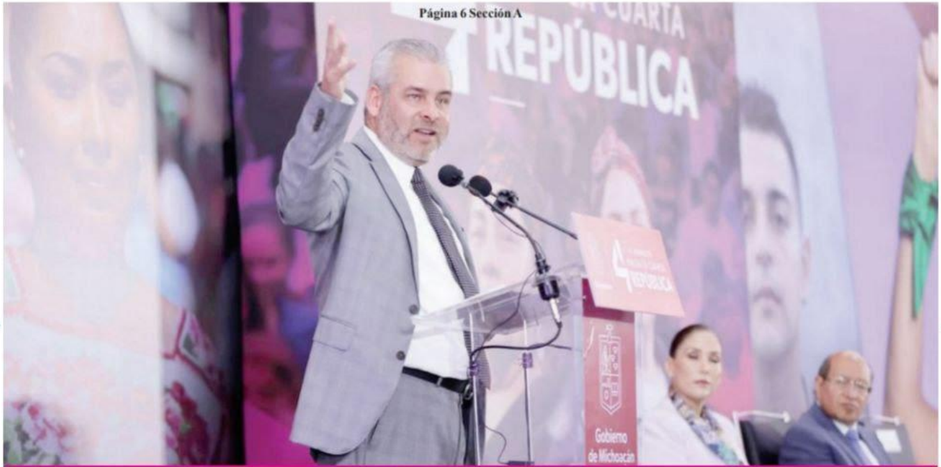
Página 6 Sección A