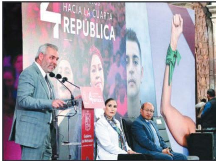
EL GOBERNADOR ALFREDO RAMÍREZ BEDOLLA ACOMPAÑADO POR MIEMBROS DE SU GABINETE Y AUTORIDADES DE LOS 3 PODERES DE GOBIERNO, RELANZÓ EL PLAN MORELOS, HACIA LA CUARTA REPÚBLICA.