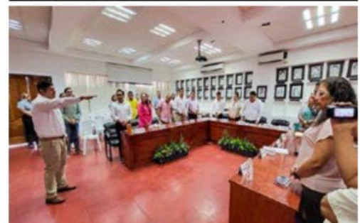
Durante el nombramiento del nuevo secretario del ayuntamiento local, afloraron las primeras diferencias entre los integrantes del Cabildo porteño.