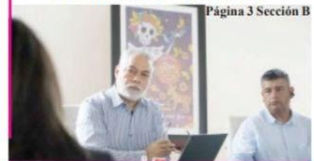
Página 3 Sección B