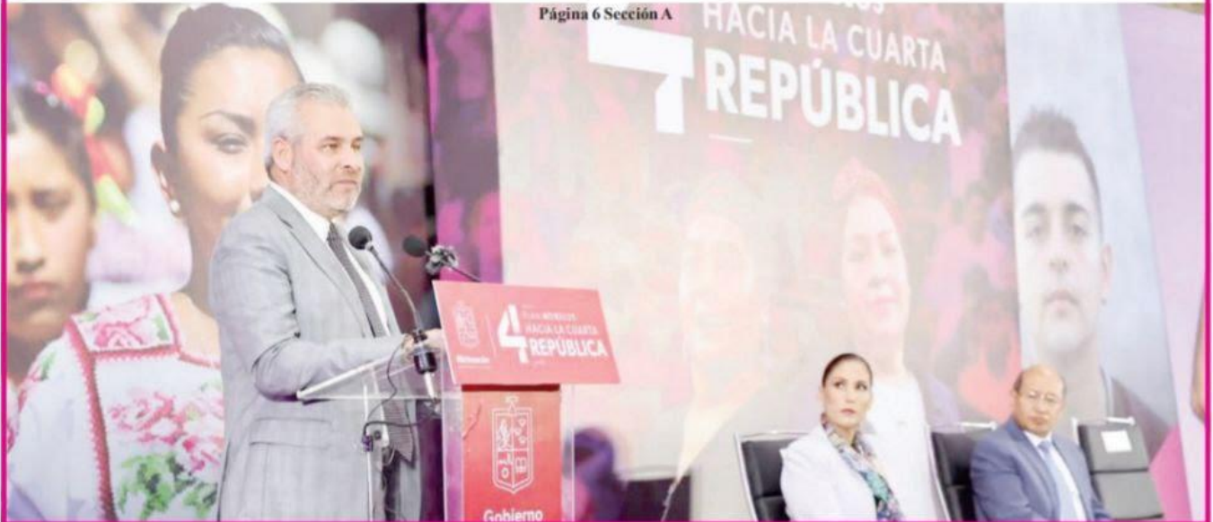
Página 6 Sección A

Plan Morelos, siguiente paso para la transformación en Michoacán: SEE