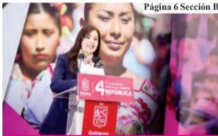
Página 6 Sección B

Diputados electos del Partido Verde respaldarán reformas de Bedolla