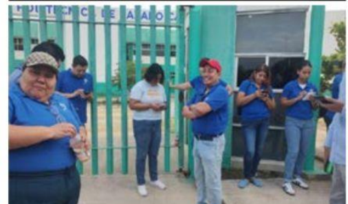
Integrantes del SUTUPLC, bloquearon la entrada a las instalaciones de la Universidad Politécnica de LC.