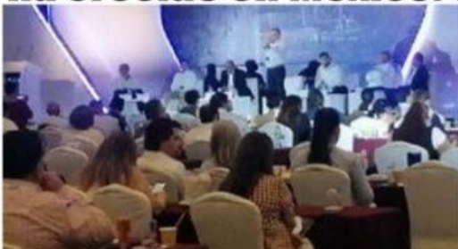
El Almirante Jorge Luis Cruz Ballado, director general de la ASIPONA LC, durante su participación en el Congreso de AMANAC celebrada el pasado viernes en Ixtapa.

Inversiones del orden de los mil 500 millones de pesos aplicará Puerto Lázaro Cárdenas en el proyecto de un muelle específico para cabotaje y transporte marítimo de corta distancia... 2