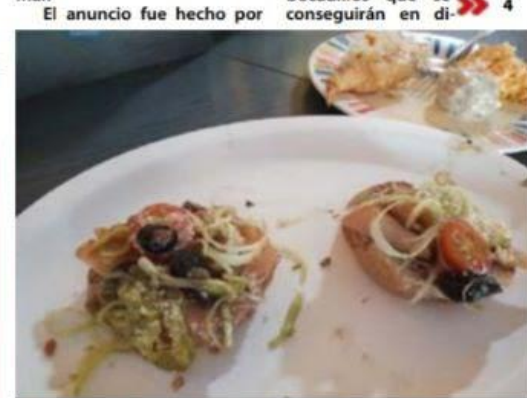
El próximo 17 de diciembre se llevará a cabo en el estacionamiento del Centro Cultural antes cinemas Flemings de LC, una muestra gastronómica "del mar a tu paladar".

restaurantes nativos de la ciudad, quienes realizaron una "pequeña calentona", como denominaron a una degustación de algunos de los platillos y bocadillos que se conseguirán en di... 4