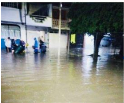
URUAPAN, MICH.- La fuerte lluvia que azotó a esta ciudad la noche del sábado, dejó algunas inundaciones pero no daños mayores ni personas lesionadas, fallecidas o desaparecidas.