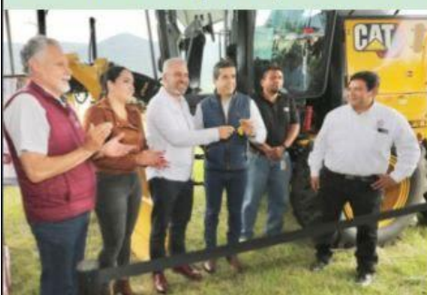
MORELIA, MICH.- El apoyo del gobierno estatal a los municipios es evidente con la reciente entrega de 78 maquinarias a igual número de ayuntamientos michoacanos,