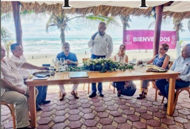
CD. LÁZARO CÁRDENAS, MICH.- El gobernador Alfredo Ramírez Bedolla propuso que el aeropuerto local "Gral. Lázaro Cárdenas del Río", sea administrado por la Asipona.