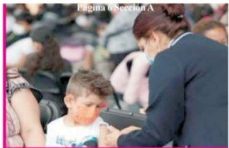
Página 6 Sección A

Aplicadas, en 5 meses, más de medio millón de dosis anti COVID-19 a menores de 5 a 11 años