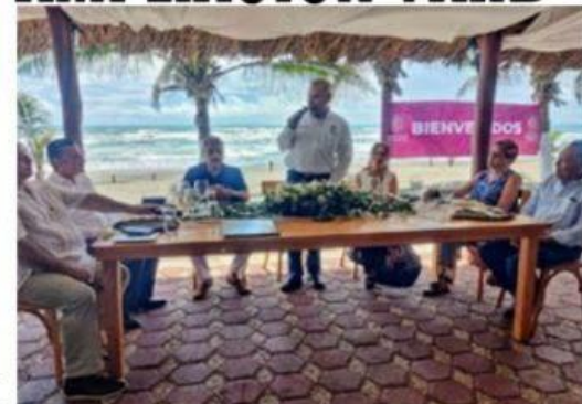
El gobernador Alfredo Ramírez Bedolla, señaló en breve entrevista con este diario, al terminó de un convivio con empresarios navieros de todo el país, que se está trabajando para lograr la ampliación de la Siglo 21.