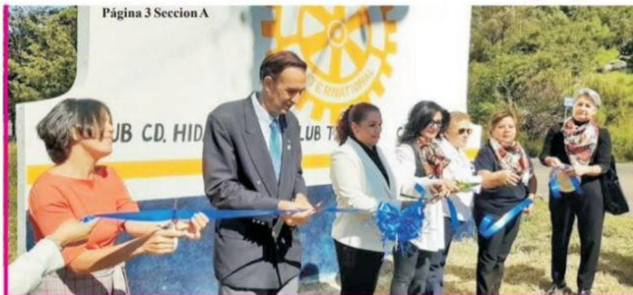
Página 3 Sección A

Aplicadas, en 5 meses, más de medio millón de dosis anti COVID-19 a menores de 5 a 11 años