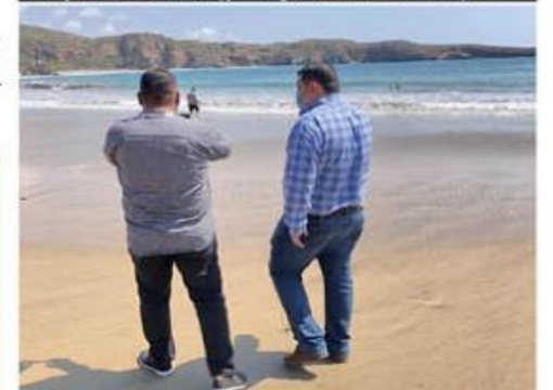
Tras mortandad de peces en la zona de playa de Caleta de Campos, autoridades sanitarias determinaron, luego del análisis de las aguas, que no había toxinas ni productos nocivos en esas aguas.