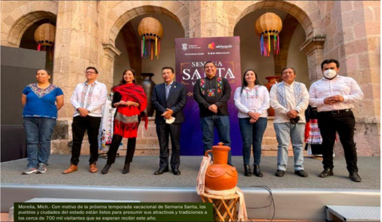
Morelia, Mich.- Con motivo de la próxima temporada vacacional de Semana Santa, los pueblos y ciudades del estado están listos para presumir sus atractivos y tradiciones a los cerca de 700 mil visitantes que se esperan recibir este año.