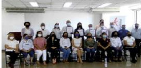
Mujeres de Acero y el ayuntamiento de Arteaga, suscribieron un convenio de colaboración, para trabajar por una cultura de paz.