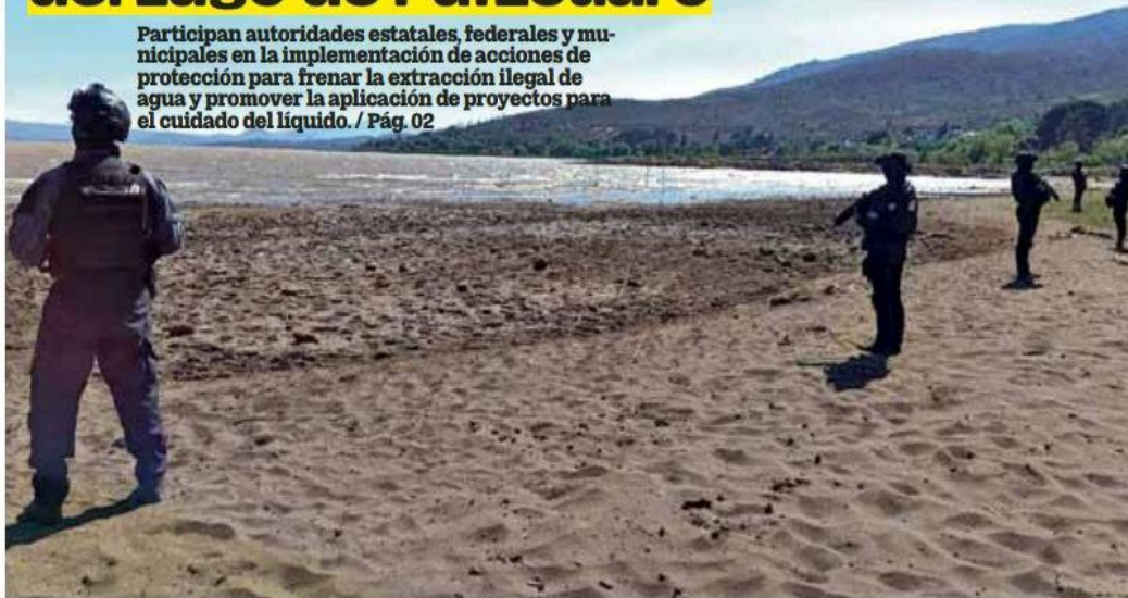
Michoacán. El comité está integrado por la Conagua, la SSP, la CEAC, la Secma, la Compesca, los ayuntamientos de Pátzcuaro, Quiroga, Tzintzuntzan, Erongaricuaru y autoridades comunales.

Participan autoridades estatales, federales y municipales en la implementación de acciones de protección para frenar la extracción ilegal de agua y promover la aplicación de proyectos para el cuidado del líquido. / Pág. 02