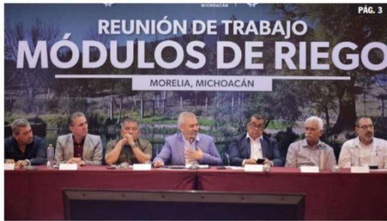
MORELIA, MICH.- El gobernador Alfredo Ramírez Bedolla acordó trabajar en conjunto con los 45 módulos del agua del estado para cuidar y mejorar el uso de este recurso.

Entre el gobierno estatal y los 45 módulos del vital líquido