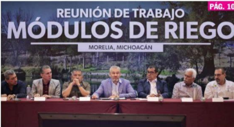
MORELIA, MICH.- Alfredo Ramírez Bedolla y representantes de los 45 módulos del agua del estado acordaron trabajar en conjunto para cuidar y mejorar el uso de este recurso.

► Se reunió el gobernador, Ramírez Bedolla con representantes de los 45 módulos