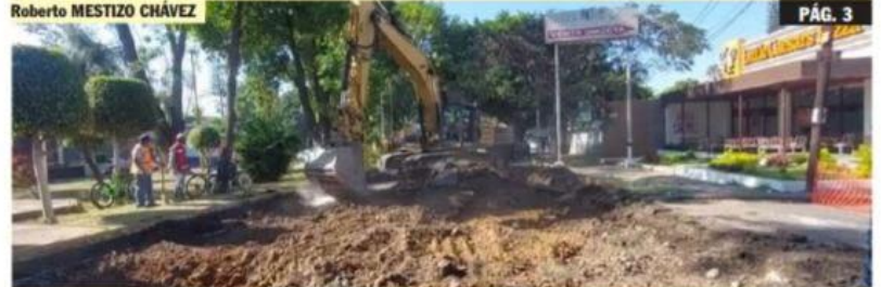
URUAPAN, MICH.- Dieron inicio los trabajos para pavimentar con concreto hidráulico un primer tramo de la avenida Paseo de la Revolución, desde la Escuela de Guardas Forestales, hasta la calzada Lázaro Cárdenas, en ambos sentidos de circulación.