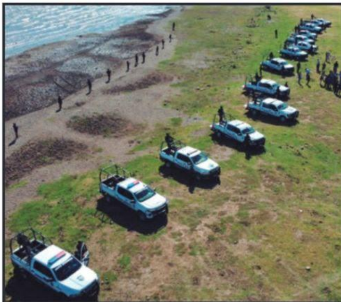
ELEMENTOS DE LA GUARDIA CIVIL YA ESTÁN DESPLIEGADOS CUIDANDO LA RIBERA DEL LAGO DE PÁTZCUARO.